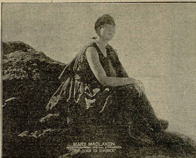
«La senda del divorcio»

Simultáneamente al regreso del caballero Arturo de la guerra donde ha pa-