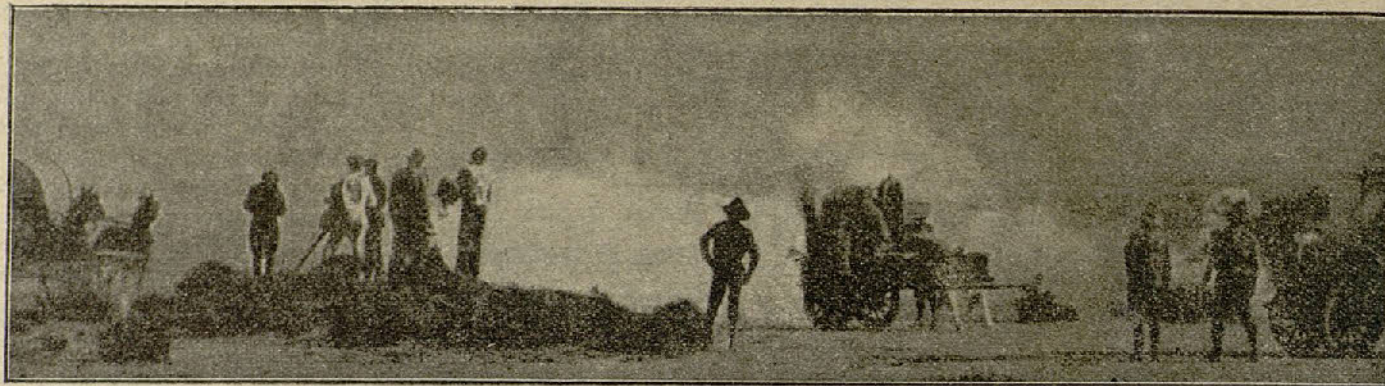
Un huracán artificial en la Ciudad Universal