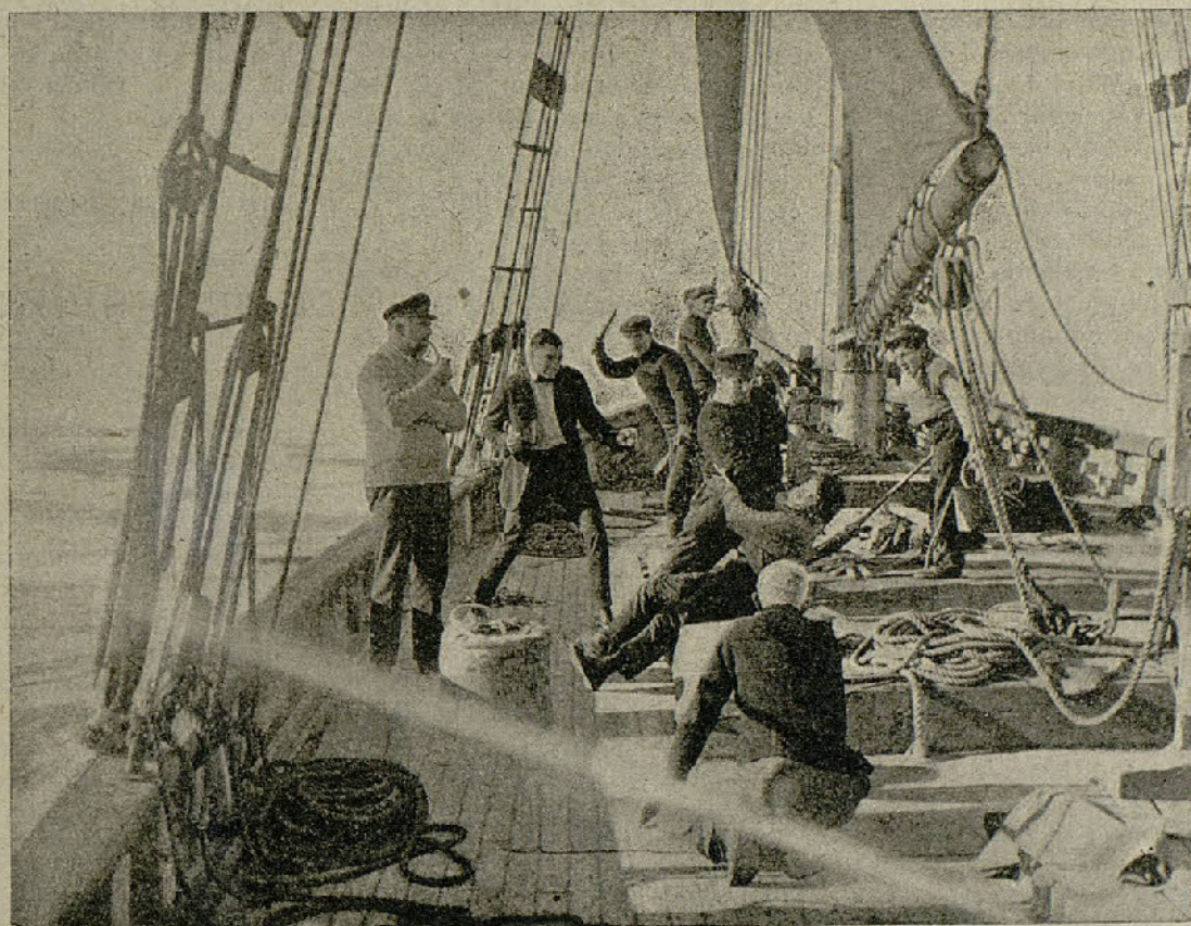
«Vivo o muerto»

do a mi hija al cuidado de mi fiel Kabyr, que actualmente me sirve. El brahmán Maharah nos recibió hostilmente, maldiciéndonos por la audacia de mancillar con nuestras plantas la morada de la deidad; pero la belleza de Georgina le impresionó hondamente... Días después, su vendedor llegaba a nuestra casa a ofrecer su mercancía y miraba a nuestra hijita, que dormía en su cuna, concentrando en ella todo el odio ancestral de su raza a la raza europea. Este mercader, llamado Bankor, y su hija Nirvana, sacerdotisa de Siva, eran protegidos de Maharah. Nirvana había recibido ultrajes de un europeo, vicioso y pendenciero, Cirilo Max, que frecuentaba en Benarés un lugar de libertinaje. Hasta el brahmán