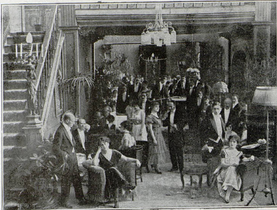
Una escena de la película «Tuya para siempre»

Una de las noches que Lidia velaba a la cabecera de su hermana, cuando en el castillo todo era silencio y quietud, ve con terror desde la ventana un hombre que avanza por el parque. Aquel hombre se introduce sigilosamente en el castillo, recorriendo habitaciones, con la seguridad de un conocedor de la casa. Lidia lo sigue por los largos pasillos, y lo ve dirigirse resueltamente a una caja que se halla en la habitación, abrirla y extraer de ella unos papeles. Entonces Lidia se oculta tras las cortinas de la habitación. Y cuando el desconocido va a salir, huyendo después de cometer su reprochable acción, ella, decidida, valiente, le corta el paso, resuelta a conocer el secreto que guardan aquellas visitas misteriosas. Al