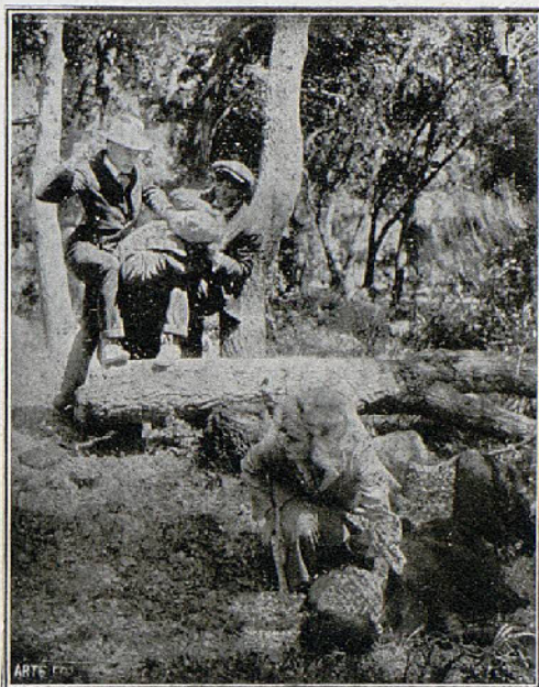
Una escena de la película «El secreto del submarino»

La única persona de la casa que parecía gozar con la desarmonía que reinaba entre los dos esposos, era Simona, la prima de Andrés. Esta mujer, ya en el ocaso de su vida, amaba a Andrés con una pasión sin esperanza, viendo desvanecerse poco a poco el sueño que había alimentado toda su vida, de que su primo correspondiese a su amor. Y con una paciencia