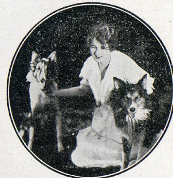
Una escena de la película «Voluntad».

Además debe percibir los derechos de autor y un tanto por ciento que le concede la casa en las ganancias.