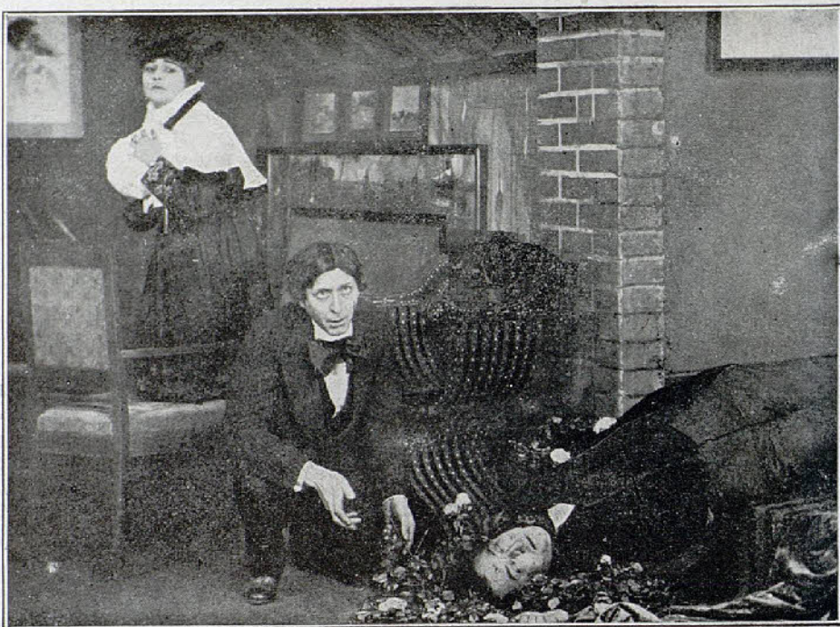
Una escena de la película «La flota de los emigrantes»

Entretanto la hija de Arrigo y de la infortunada Giorgina, se ha convertido gracias a su belleza y a su excelente voz, en una de las mejores tiples de la época y alcanza todas las noches extraordinarios éxitos en el teatro que se ve lleno a rebosar de sus admiradores incansables. Entre éstos un pretendiente que la asedia constantemente, buscando la ocasión