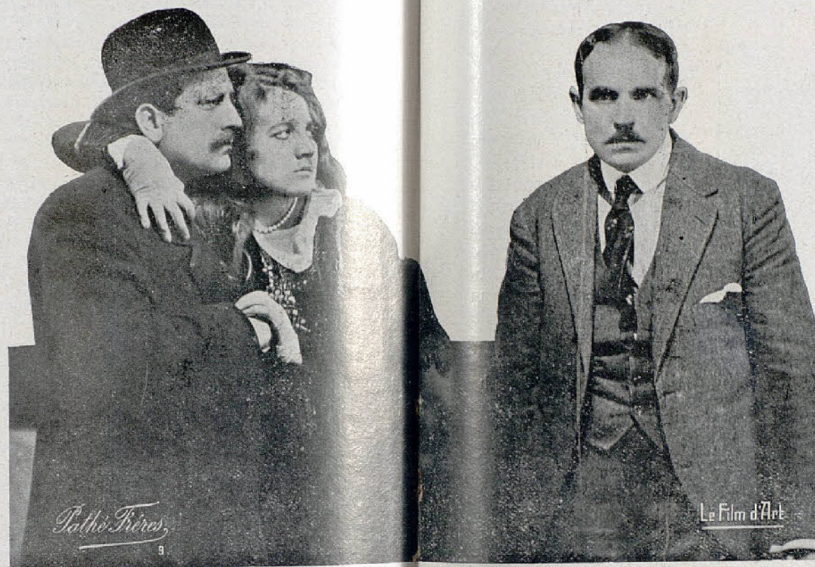
Una interesante escena de la película «Voluntad».

Para atender al restablecimiento de su salud, se ha retirado de la sociedad que for-