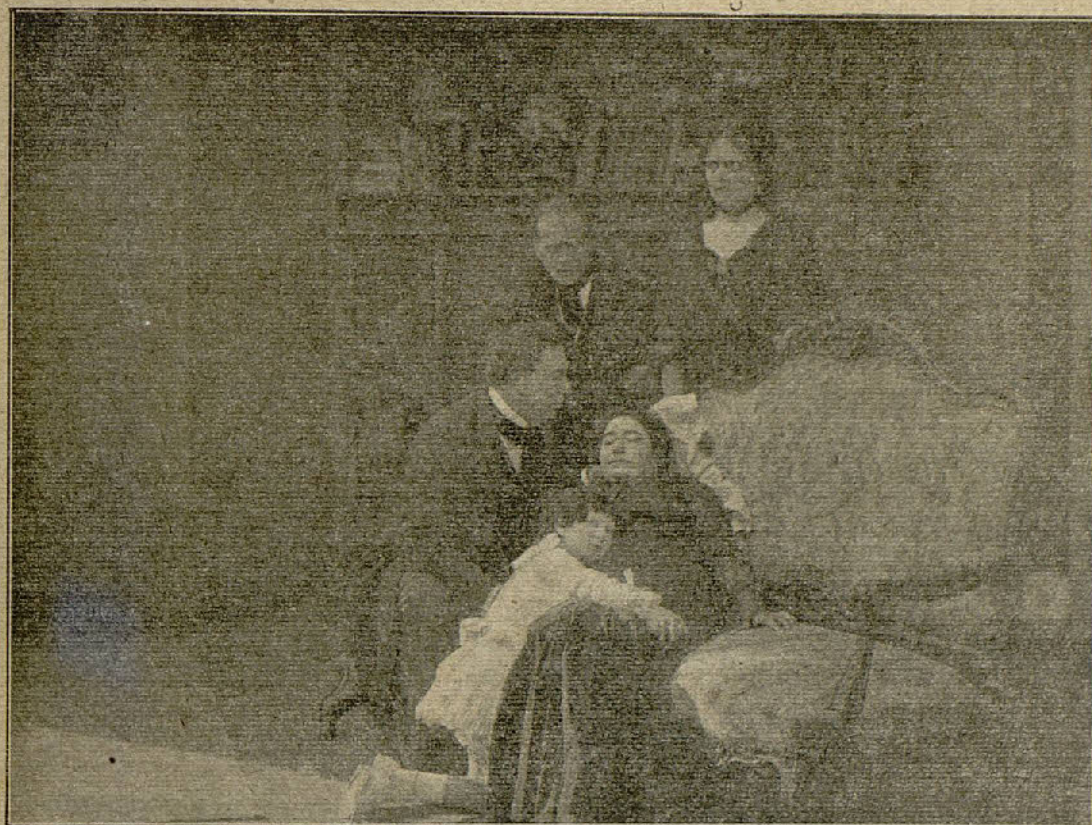
Una escena de la película «La ciega de Sorrento»

le espía, y cuando el general y su secretario penetran en su despacho, ya en él les esperaba la Lady dispuesta a apoderarse de la codiciada fórmula. Lo desgracia la persecución. Cuando con sus manos iba ya a robar los documentos fué descubierta su presencia en aquel lugar y gracias a sus excelentes piernas logró escapar.