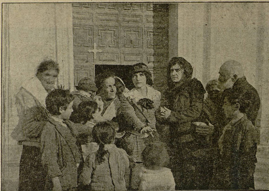
Una escena de la película «La ciega de Sorrento»

Algunos días más tarde la artista llega a la pequeña estación, donde Claudio Derqui ha ido a esperarla y la señorita Borjas se extraña al ver que el molinero es hombre joven de mundo, de buenas maneras y de una figura muy interesante y se promete pasar bien sus vacaciones.