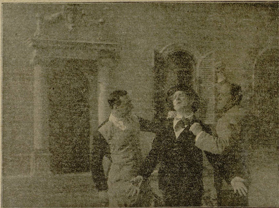
Una escena de la película «La ciega de Sorrento»