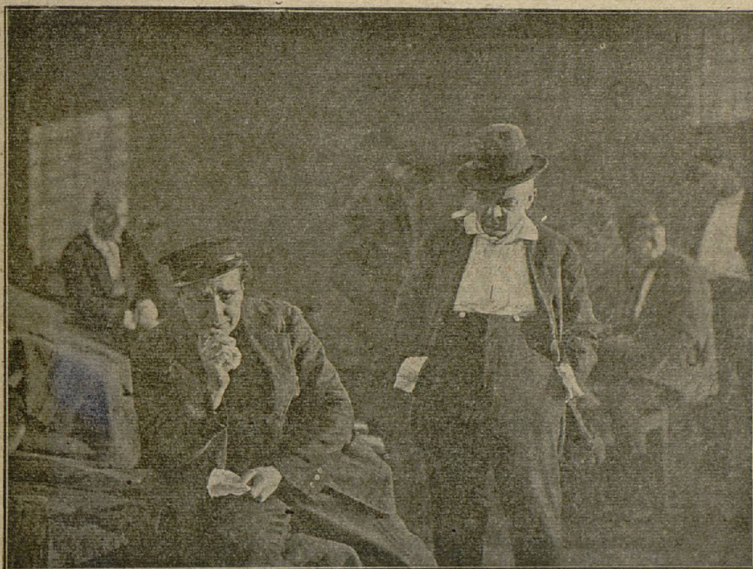
Una escena de la película «La ciega de Sorrento»

está ciega. Perouna tía de la enferma, cómplice del homicidio de Baldieri y Basileo, que había asesinado precisamente a la madre de la ciega, trabaja en la sombra, de acuerdo con Basileo, para impedir la curación de la joven, a fin de arrebatárle la herencia. Gianni el piloto, llega