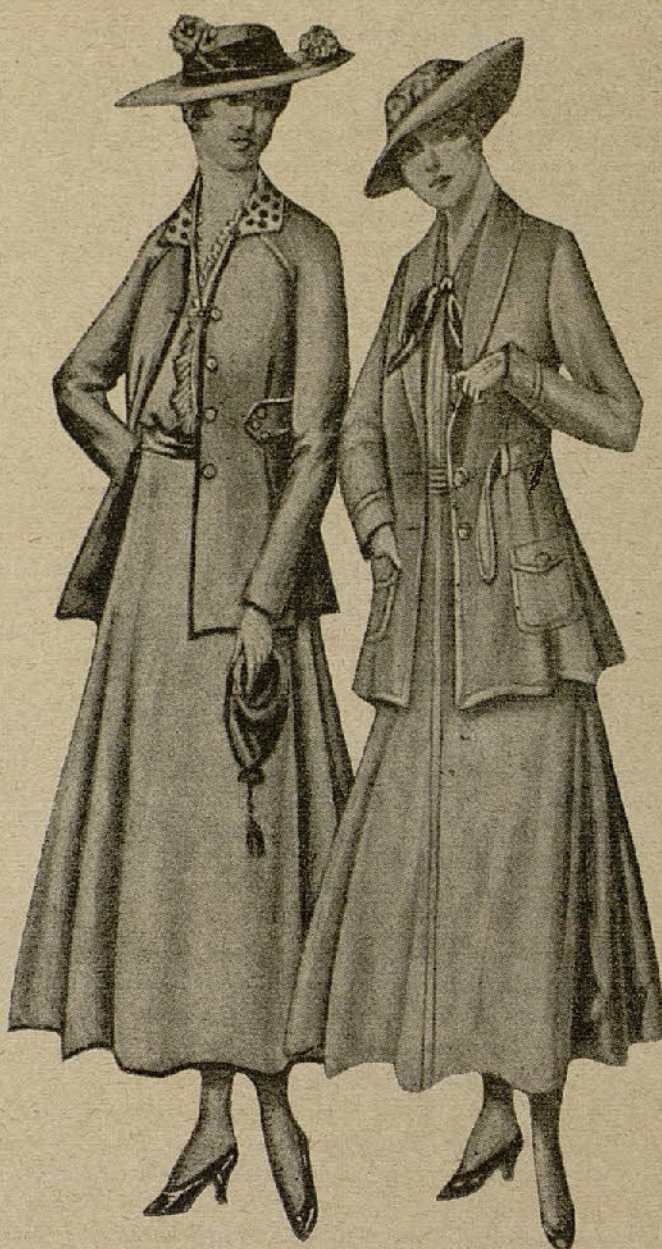
Tallfleurs para jovencitas.—1. De color gamuza; falda de capa, chaqueta con manga japonesa, cuello de lunares y ribetes de galón.—2. Color de oliva, con los únicos adornos de pespuntos en pestañas.

Teatro San Martín. —Sigue siendo muy concurrido este teatro, donde actúa la compañía Isaura-Arcos.