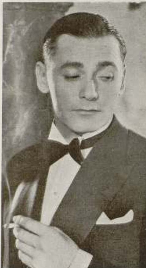
Para Herbert Marshall el prototipo del héroe es Lindberg.

como la actriz más extravagante. Ello será, sin duda, porque hace poco hizo que su mueblista le construyera una camita del mismo estilo que la suya para que en ella durmiera su bull-dog y, por si eso fuera poco, han visto que las uñas de los pies de la famosa e intriga actriz, llevan los colores de la bandera de Méjico.