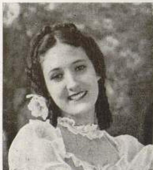
Anita Campillo, es la más joven de las estrellas hispanas.

La famosa estrella Dolores Del Río, es considerada por los artistas de Hollywood