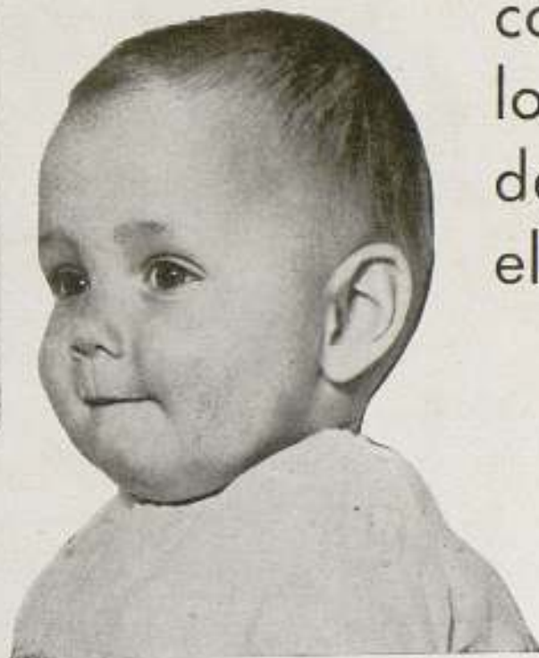
Este gordito es el famoso Baby Le Roy

bre por tal trabajo su milloncito de pesetas.