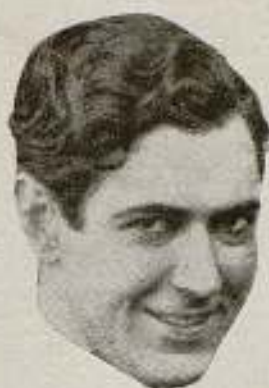
Johnny Mc. Brown

El primero... "fuera"... Stan Laurel y Oliver Hardy. Pensaban más en divertir al público que en cortejarlo. Supe lo que es ser besada por la misma boca que acaba de pronunciar un chiste de más o menos gusto.