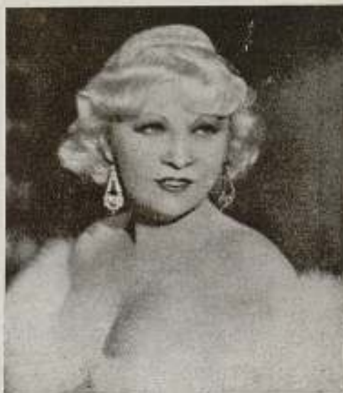
Mae West nunca toma baños de ducha.