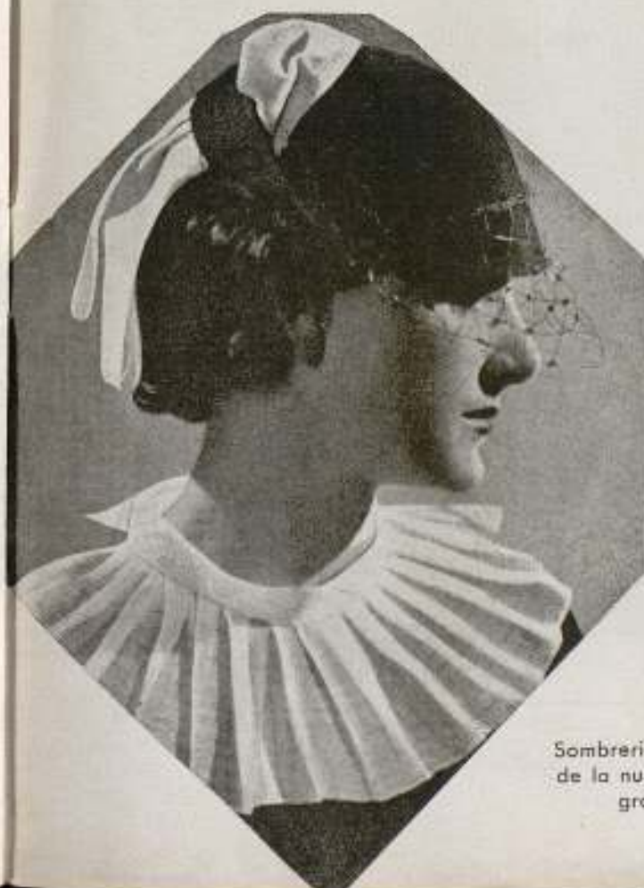
Sombrerito "Duchesse", último grito de la nueva temporada. Feltro negro y terciopelo blanco.

Ke ... .. 2 gramos Sulfato de cinc ... .. 1 gramo Acetato de aluminio ... .. 1 gramo Acido benzoico ... .. 25 gramos