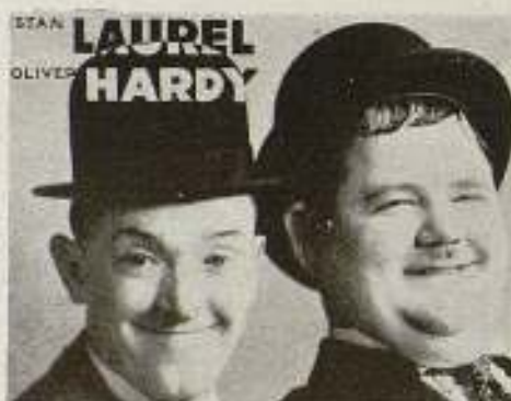
El primer amor de Jean en la pantalla "fueron" Stan Laurel y Oliver Hardy.

Jean Harlow, la platinada rubia de M. G. M., es la artista que más se destacó en el elenco cinematográfico, por la majestad de su figura y por el color de su pelo. Luego, pero sólo en segundo lugar, empezó a adquirir personalidad artística. Sus sucesivas bodas contribuyeron mucho a su publicidad. El primer matrimonio pasó desapercibido por no pertenecer ella aún al elenco cinematográfico. El segundo esposo de Jean fué el famoso productor Paul Bern, que de manera tan aparatosa la dejó viuda, suicidándose sin que se pudiera aclarar los