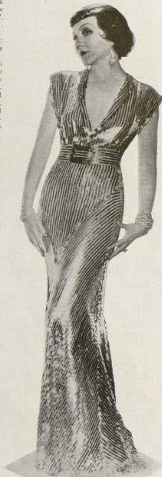
Claudette Colbert considera a Madame Curie la mujer más interesante de los tiempos modernos.

Las acusaciones que se hacen contra estos y otros artistas que durante varios días causaron algún revuelo, parece que carece de fundamento. Se cree que si hay algo de cierto en lo que se dice sobre la posibilidad de que hayan facilitado dinero "para la causa", no pasa de ser una de tantas excentricidades de artistas que, con dinero en abundancia, dan algo a casi todo el que "llama a su puerta".