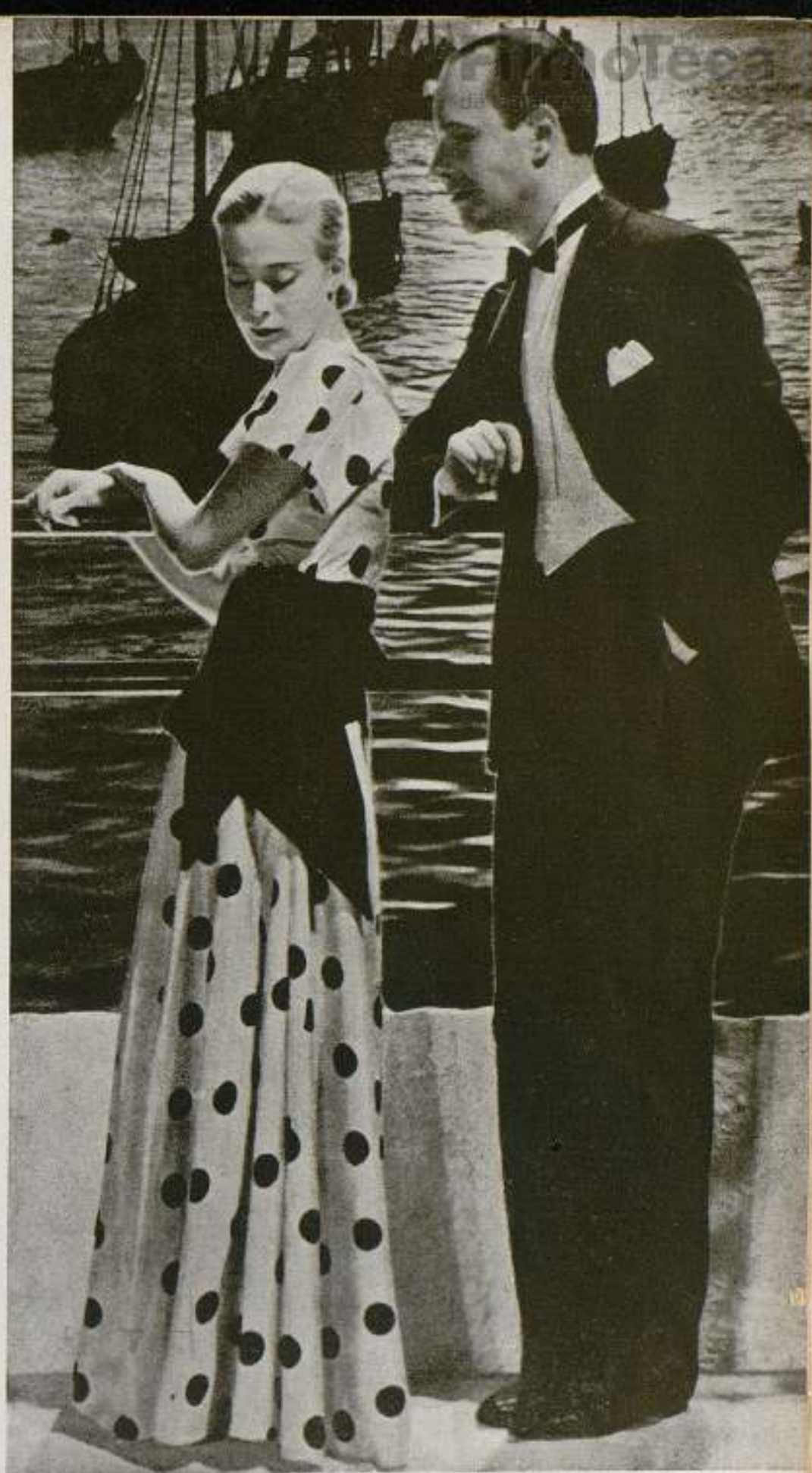
Elegante vestido de "taffetas" rosa adornado con pastillas negras y cinturón de terciopelo negro.