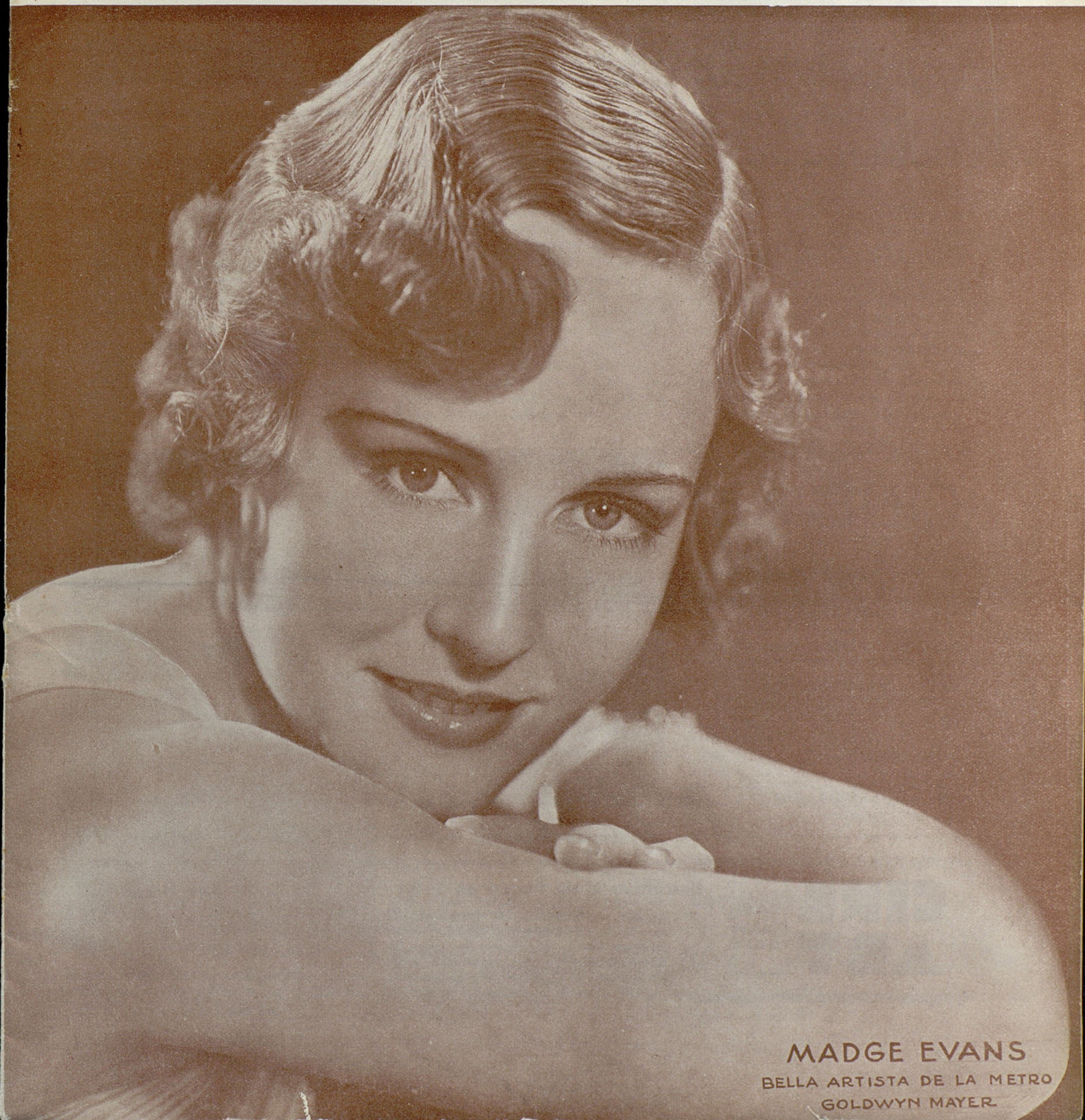
MADGE EVANS BELLA ARTISTA DE LA METRO GOLDWYN MAYER