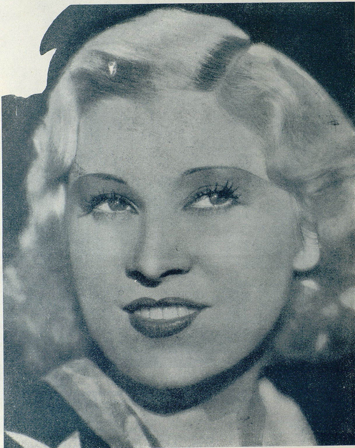
Mae West, la actriz de Paramount que exhibe y blasona orgullosa la invasión de sus carnes y de sus curvas de matrona.

Los magazines nos hablan con frecuencia de que mantienen el peso ingravido por medio de continuo deporte y del ejercicio físico. Indudablemente las estrellas tienen sus deportes predilectos como cualquier muchacha al día, pero ese deporte favorito no tienen gran ocasión de poder explicarlo porque bastante deporte es para ellas el rudo trabajo cotidiano, en el cual ocupan la mayor parte de su tiempo. Gracias a este esfuerzo, unido a la dieta reglamentada, no pierden este encanto que les envidian las mujeres de todo el mundo.