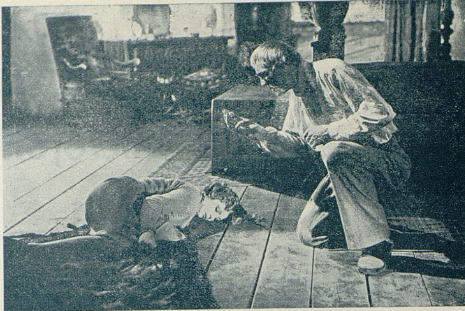
Boria Karloff, el excelente actor inglés, en una escena de la película «El resucitado»

Desde entonces continuamente han ido desfilando por la pantalla, miles de rostros perfectos, bellezas de tipos representativos de todo género humano, desde la exótica Josefina Baker a la encantadora y deliciosa Janet Gaynor, desde la