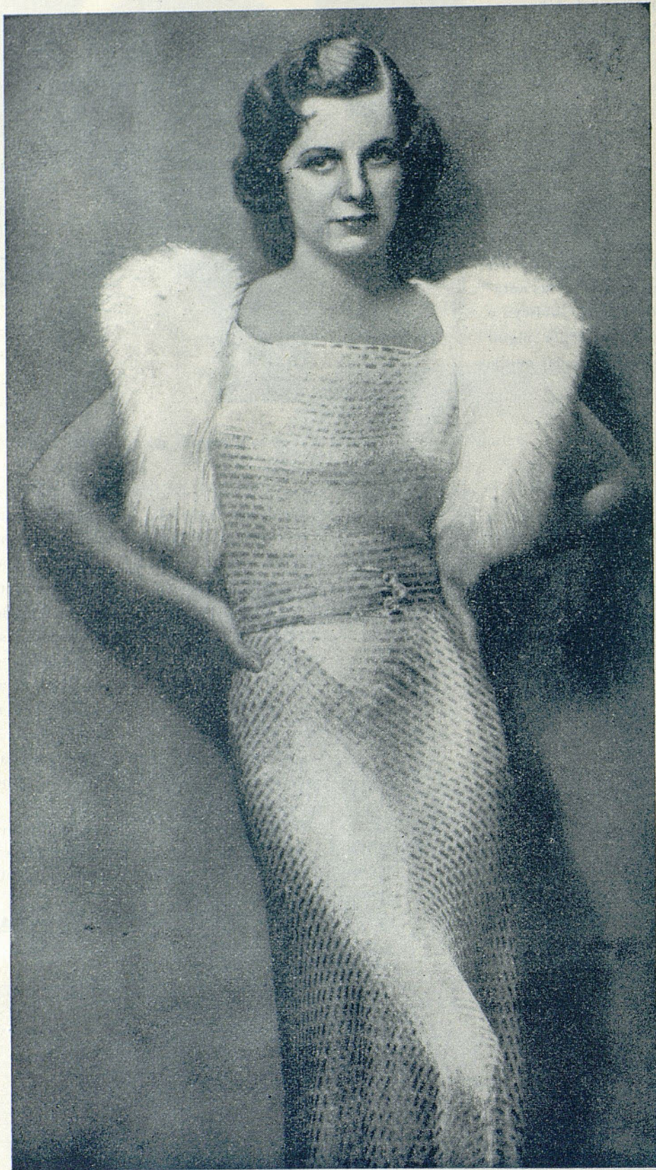
Maureen O'Sullivan, de Universal luciendo un modelo muy adecuado para traje de concierto