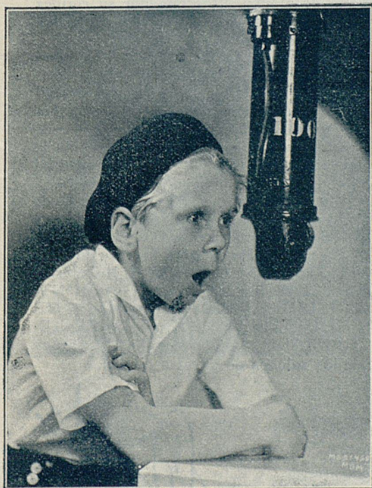
Jackie Cooper, el gracioso actor infantil, cantando a voz en grito sin temor ante «Miguelito»