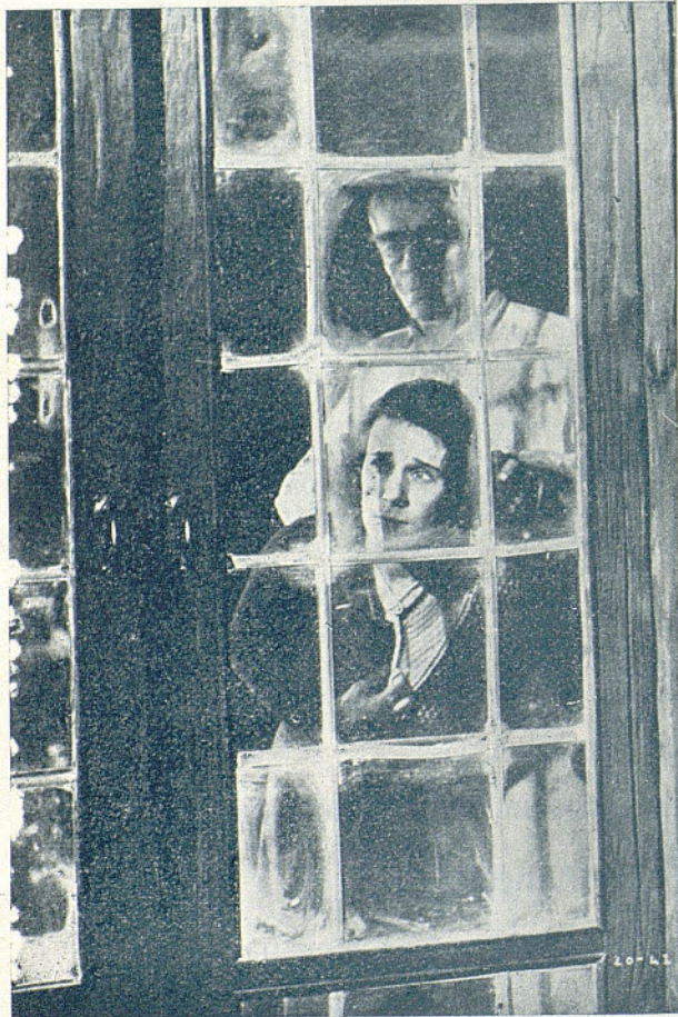
Una escena del film «El resucitado» por Boris Karloff

Es uno de los actores favorecidos con doble contrato en América e Inglaterra. Para la productora inglesa GAUMONT-BRITISH ha filmado últimamente «THE GHOUL» que bajo el título de «EL RESUCITADO» vimos pocos días ha en uno de los salones de nuestra ciudad.