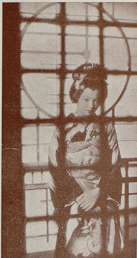
Silvia Sydney, de la Paramount en su role amarillo de «Madame Butterfly»