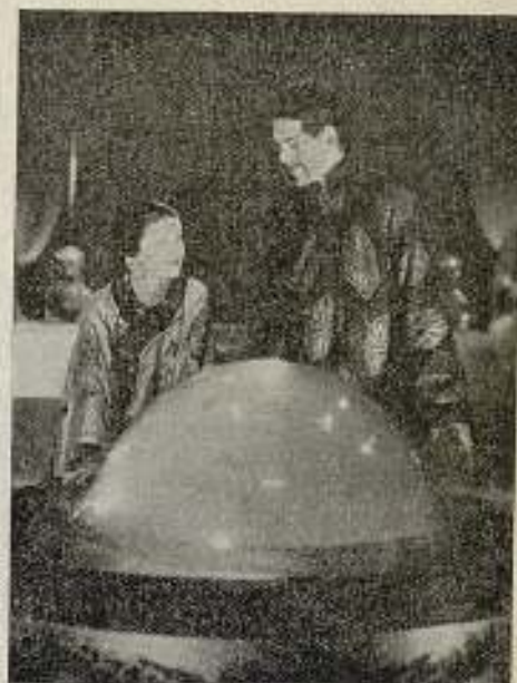
Myrna Loy y Boris Karloff en «La Máscara de Fu Manchú» de M. G. M., que en breve se estrenará