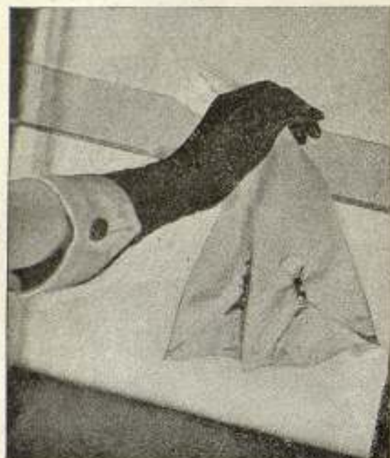
Dos encantadores modelos de última creación: Suecia con puño de raso y Glacé blanco con broches de plata