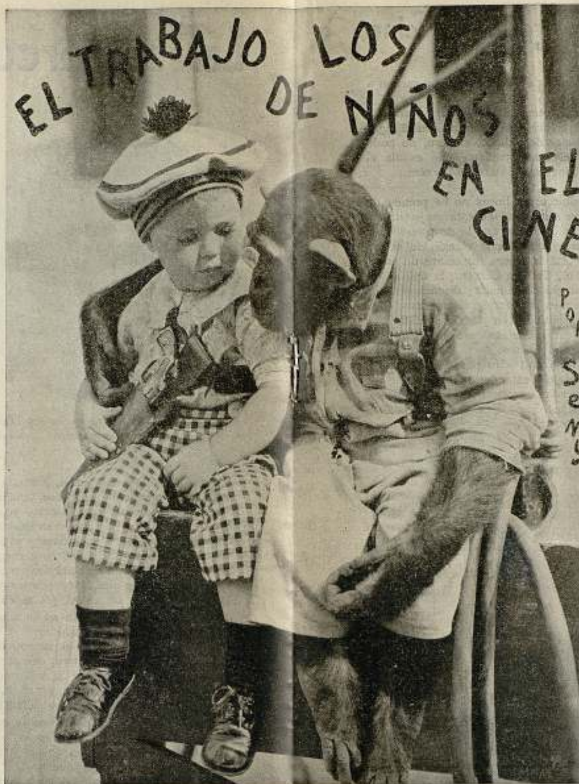
Aquí tenemos el célebre Spanky con el chimpancé llamado Sigs. Spanky además de feliz actor ha entrado en la orden de los publicistas internacionales y honra con su infantil pluma las páginas de nuestra revista. Lea V. su reportaje titulado: «Yo, Max y Bimbo Carnera» que se inserta en este número.

Hace años—comenta—algunos directores empleaban muñecos en sustitución de niños, siguiendo la antigua costumbre del teatro. Recuérdese si no las escenas de la persecución del drama «La cabaña del Tío Tom», en las cuales Elisa, la protagonista, apretaba contra su pecho un bebé de trapo. El público, absorto, acaso, en la carrera de los sabuesos, no se apercebía o daba cuenta del engaño. En la pantalla esto sería imposible.