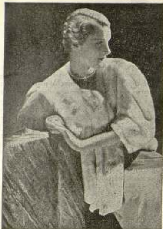
Elegante y práctico «mantelet» de armiño