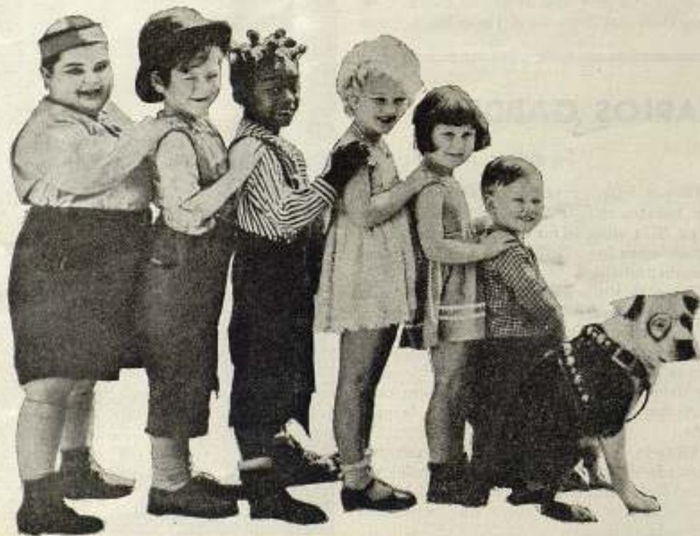
He aquí la célebre «Pandilla» de la M. G. M. Mas de cien mil niños desfilaron por los estudios de Hal Roach, solicitando un puesto en la misma. Pocos fueron los seleccionados, pero suficientes para divertir enormemente al público en cuantas películas nos han presentado.