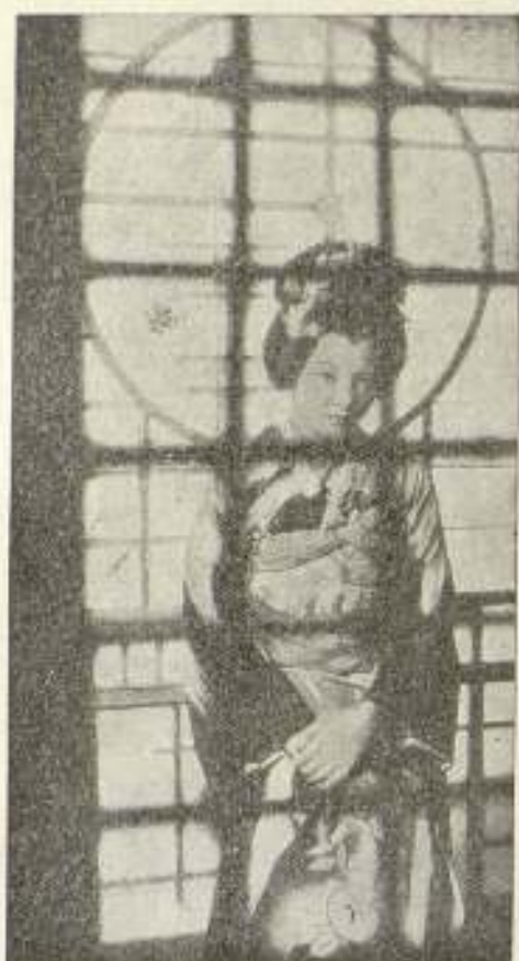
Silvia Sydney en «Madame Butterfly» de la Paramount