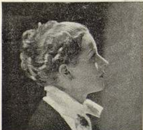
El nuevo peinado, último grito de elegancia femenina

Desde que los cuellos se usan altos los peinados han tenido que seguir el ejemplo porque de lo contrario ya no podrían lucirse los bucles. Por eso la mayoría de los peinados son altos y en forma de cresta. Los sombreros también adoptan esa forma y terminados con plumillas negras de manchas amarillas son preciosos y muy juveniles.