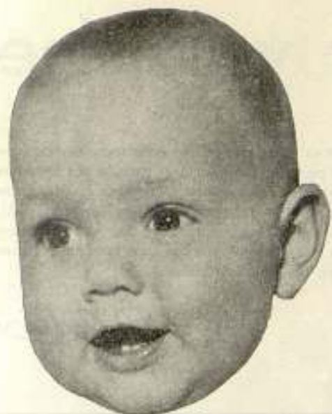
Baby Leroy, el más diminuto de los astros infantiles, que ya desde tan temprano tiene la suerte de poder lucir su nombre y soportar sobre sus espaldas infantiles el importante contrato por siete años que le reporta la interesante suma de cincuenta mil dólares.

Forman legión los niños que sueñan con ser actores de cine. En Hollywood son muchas las familias que viven con lo que les reporta el trabajo de sus hijos en las películas. Todos los días, de todas las partes del globo, llegan caras nuevas a la Meca del celuloide, con la pretensión de verse reflejados en la pantalla.