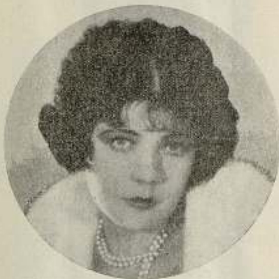
René Adorée, [una de] las víctimas del cine. Muñó llena de ilusiones y esperanzas... que fallaron

Tres palabras que contienen, juntas y separadas, un mundo de ensueños juveniles. Tres palabras que parecen buscarse y completarse. Tres ideas que encierran ilusiones, dichas y desgracias. Románticas y crueles a un tiempo, o dan felicidad o la rasgan. ¿Quién en su juventud no soñó con un Chopin, si mujer, o con una Margarita Gautier, si varón? ¿Quién no amó? ¿A quién no entusiasmó el cine? ¿A quién no encantó la inspiración artística del músico inmortal que condensa en sus obras todo el romanticismo febril, amoroso, de un enfermo, que por ser tuberculoso lleva su arte a la sublimidad, como él sólo puede hacerlo, y arrastra tras sí la avasalladora pasión de la no menos avasalladora George Sand? ¿Quién no se habrá sentido atraído en su mocedad hacia la famosa Dama de las Camelias que inmortalizó Alejandro Dumas hijo, que no fué una amante vulgar sino que amó mejor y más intensamente por el solo hecho de ser tuberculosa?