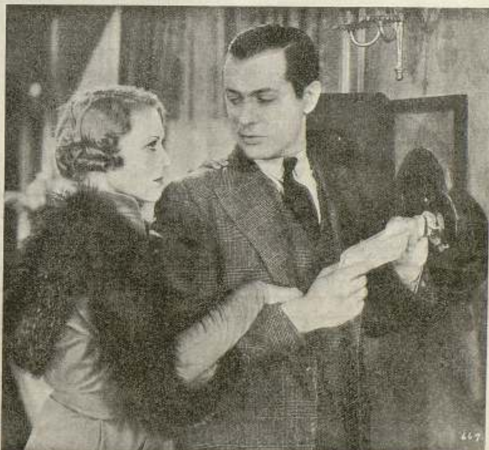
Interesante escena de «La mujer que he creado» de M. G. M., cuyo argumento publicamos en la página cinco de este número

«Me alegra el saber por su cable que ahora por fin comprende el asunto; mas yo hubiera deseado que hubiese expresado antes las mismas ideas, puesto que así me hubiera ahorrado muchos sinsabores, y no hubiera dado lugar a la idea de que yo apoyaba mis declaraciones con rumores falsos».