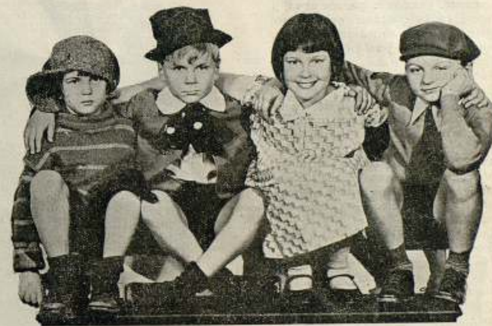
De izquierda a derecha: Robert Coogan, Jackie Cooper, Mitzi Green y Jackie Searl. Todos ellos contribuyen a solazar nuestros ánimos en las diferentes producciones que protagonizan. Han demostrado suficientemente ser conocedores del complicado sistema del cine: toma de vistas, de sonidos, etc., obedeciendo ciegamente a sus directores.