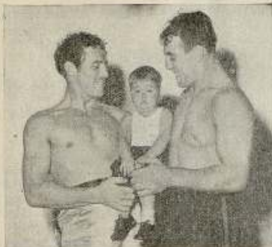
Spanky en los brazos de Max Baer y Carnera

—Pues, he encontrado al hombre más grande del mundo!