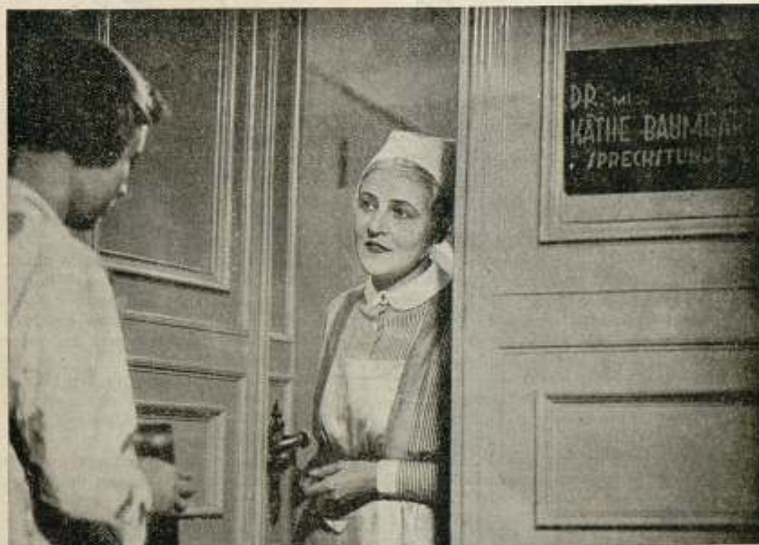
Llena de dolor ante el problema pavoroso que con su nuevo embarazo se le presenta busca una solución que la ciencia mercantilizada no le soluciona