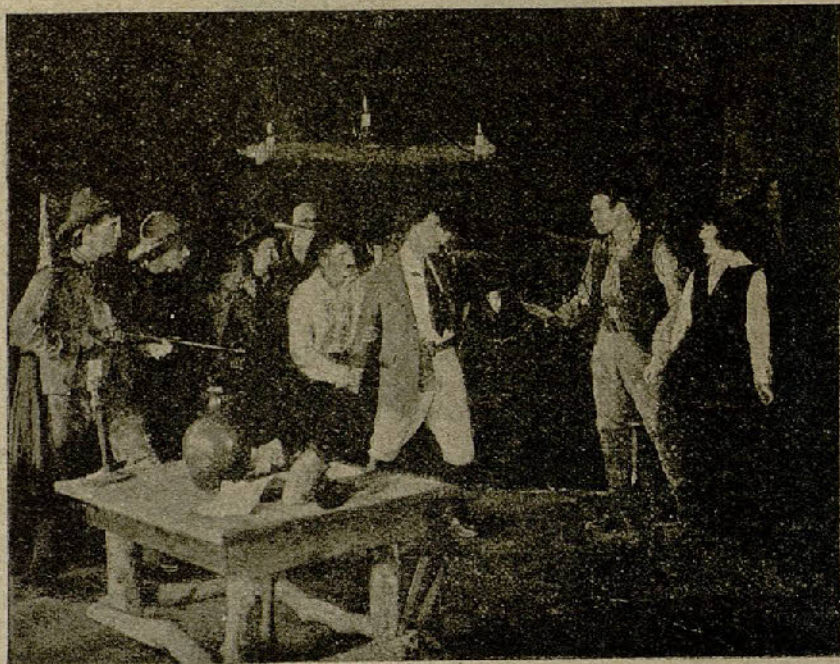
«El rey de la audacia»