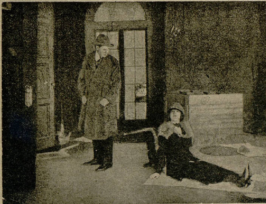
«El rey de la audacia»

Aquella misma noche Canfield fué a la casa de Sutton, resuelto a secuestrar a Violeta, casarse con ella y eliminar definitivamente de su vida a los miembros de la Banda Negra, a fin de gozar por sí solo de la fortuna íntegra de la joven. Pero no sabía que Sutton y su protegida se habían ido a vivir ya al domicilio que había sido de Nerva, y que solamente Ned había permanecido en la antigua residencia.