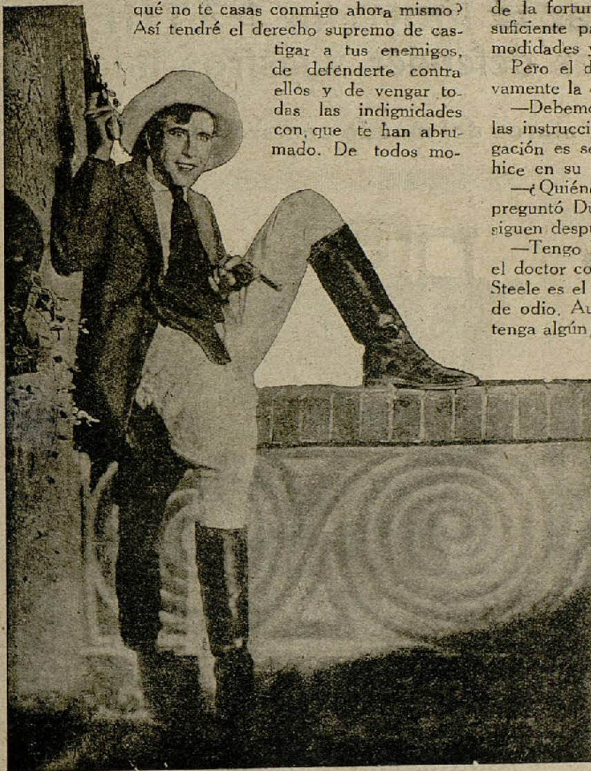
«El rey de la audacia»

de defenderte contra ellos y de vengar to- das las indignidades con que te han abru- mado. De todos mo-