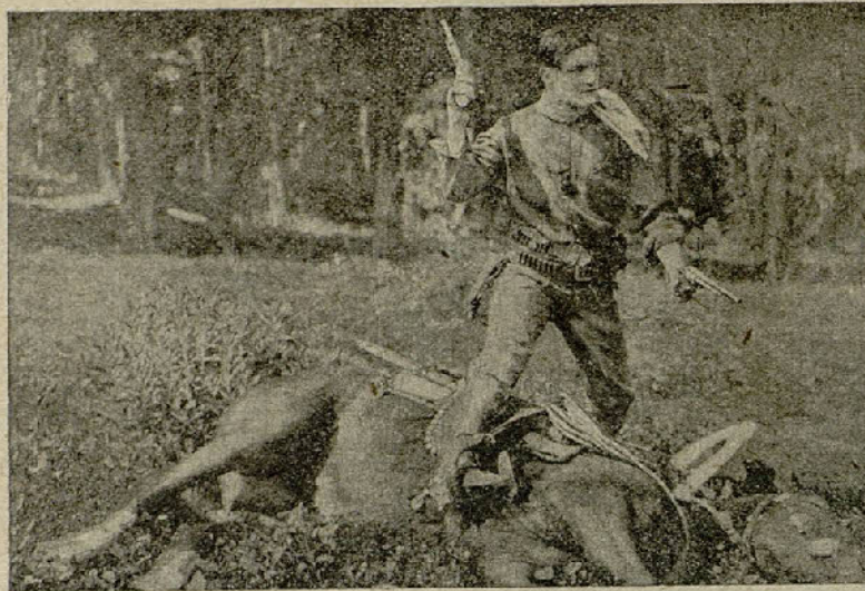
El célebre artista Tom Mix

—Nuestro padre ha sido acusado de haber asesinado a un hombre a la puerta de nuestra casa. El cadáver llevaba clavado en el pecho un puñal que en el nácar del puño tenía grabado el nombre de «Nin»; alguien ha debido robarlo durante la noche, para que la sangre del asesinado caiga sobre nuestro