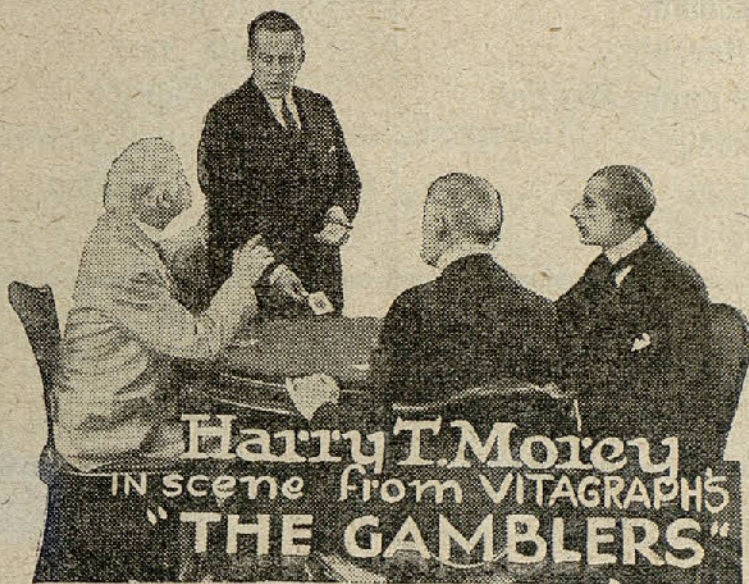
Una escena de la película «Por una jugada»

arrastrar por los dictados de su corazón generoso, dispónese a acudir de nuevo en auxilio de la joven.