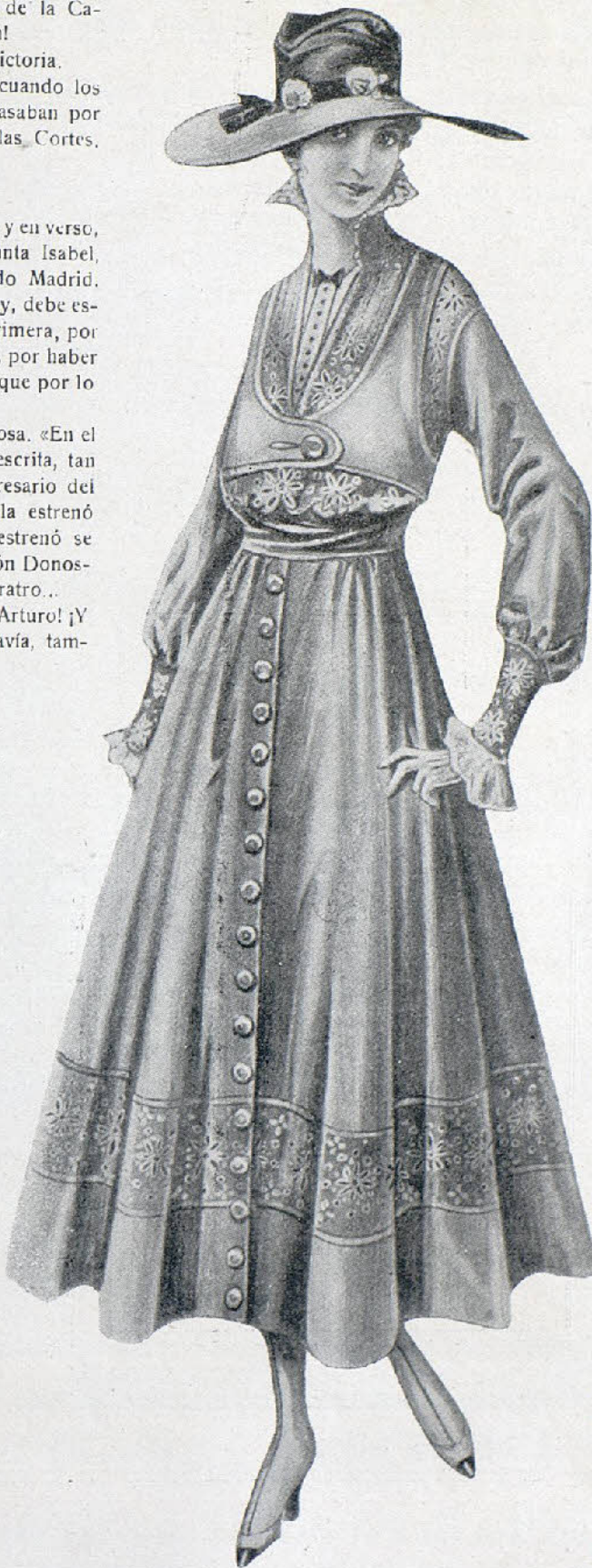
Linda toilette de seda cruda. Falda acampanada, con banda de encaje; corpiño de encaje también y encima, tirantes de seda.

Lee uno el cartel y se encuentra: A las diez, «Modas»; a las once y media, «Retazo». Y por si esto fuera poco, está en ensayo «La modelo». ¡Claro! Y no estrena «Sastre del Campillo», porque el amigo Viérgol está en el otro mundo; en América, queremos decir, ¿eh?