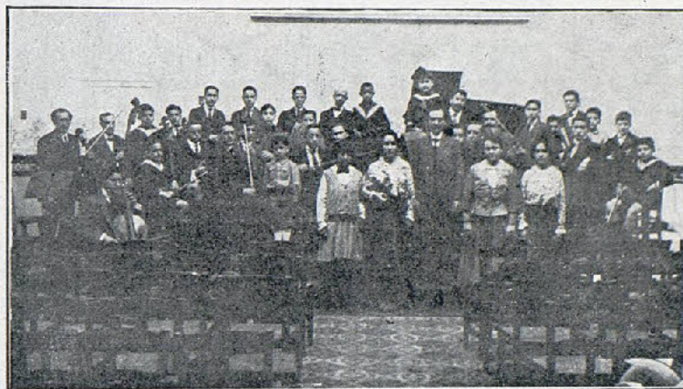
Grupo de alumnos de la Academia Joire, que tomaron parte en el concierto del domingo del Fomento Nacional

Es gentil y digno el gesto de los apuestos segundones; con ellos va el entusiasmo de