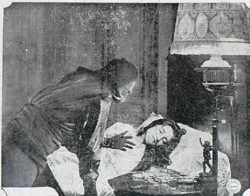
Los Vampiros (1.ª serie)