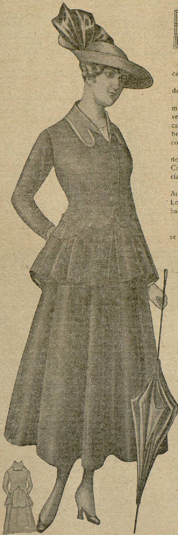
Lindo traje violeta — La falda es de capa y fruncida en la cintura. Chaqueta cerrada, con el bajo a ondas. El faldón tiene forma de volante.

La obra es utilísima, original y barata, pues el precio de venta, en Madrid, es el de cincuenta céntimos.