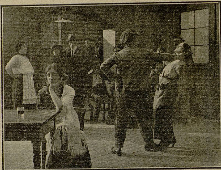
«Diamantes y lágrimas»

Sin embargo, Lydia no ama a Raimundo; y si ha prometido ser un día su esposa, sólo