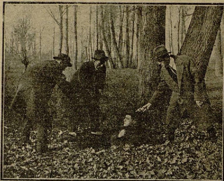
«Diamantes y Lágrimas»

Apenas recibida la orden de marcha, activaba Guerande los preparativos para el viaje. Se despidió de su anciana madre que tiembla siempre que ve a su hijo emprender tales expediciones y antes de separarse le da ella la