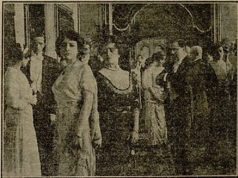
Una escena de la película «Diamantes y lágrimas»

Aquí viene el encuentro de la hermana con el prometido. Pero ahora es Enriqueta la que quiere hablar y confiesa toda la verdad a Ricardo, quien perdona a Ana. Restablecida poco después, ha encontrado también su felicidad. En cuanto al caballero de Lovan, éste encontró el justo castigo que merecía.