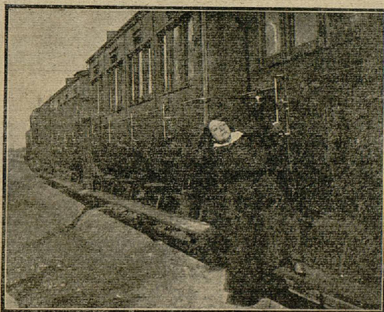
«Diamantes y lágrimas»

El público, abandonó la sala, precipitándose en los corredores y Felipe, al correr a informarse de lo sucedido, tropezó en su camino con el conde de Noirmontier, en quien reconoció al jefe de los Vampiros. Decidido a no dejar escapar aquella vez, hizo que su automóvil persiguiera al falso conde, pero otros Vampiros velan sobre su jefe. Subidos a la traseña del coche de Guerande continuaron allí hasta que el auto hallóse en desierto lugar, donde paró