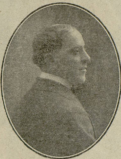
JUAN ARGELAGUES notable primer actor de la Hispano Film

Collo el actor fino y elegante no desmerece de la labor de la célebre actriz.