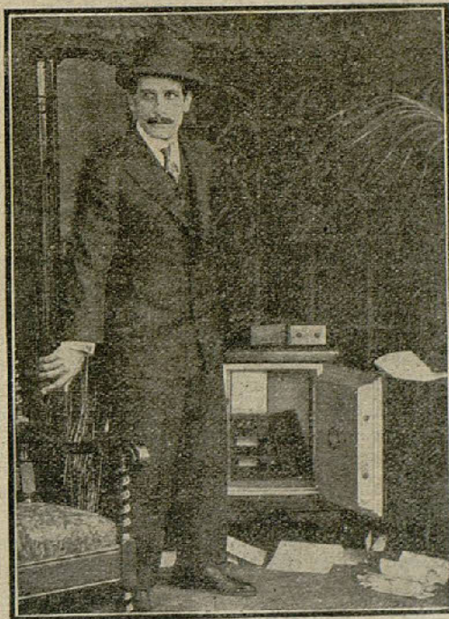
Una escena de la película «¿Quién es el culpable?» (S. Bolibar)

También el señor Arenzan recibe la advertencia y se apresura a avisar a su mujer, en