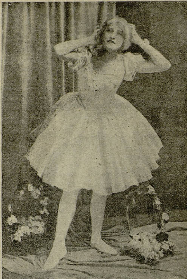
Para el Concurso de EL CINE. — Miss. Ivy Close Protagonista de la grandiosa película «Perdida en Londres»

PRECIO DE LA CAJA: 2 REALES Pídase en todas las farmacias y droguerías