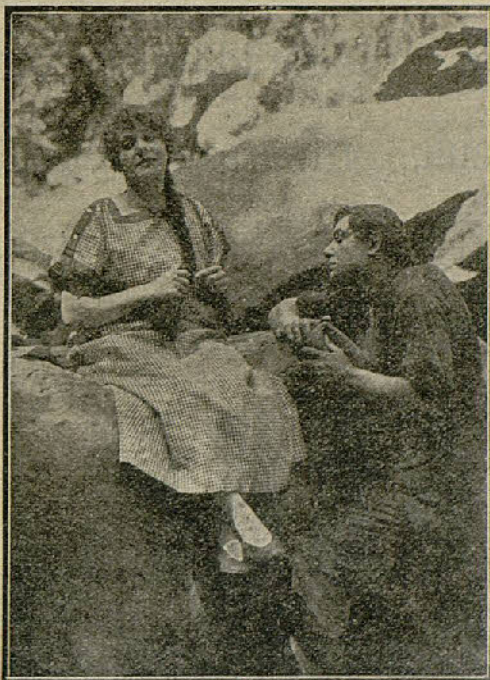
Una escena de la película «¿Quién es el culpable?» S. Bolibar

Entretanto, Florinda sufría las crueldades de sus carceleros, y en medio de tan atroces,