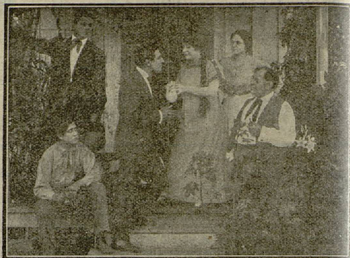
Dos escenas de la película «¿Quién es el culpable?»