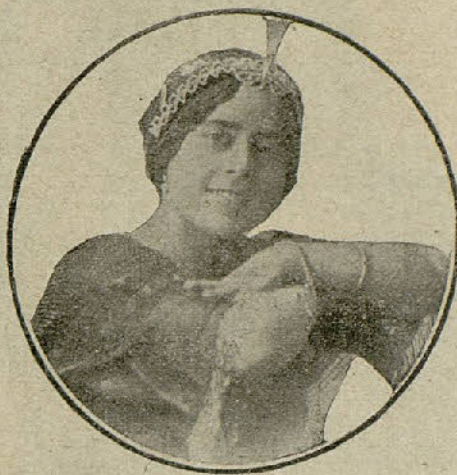
Colombina, bella y gentil artista española que está triunfando actualmente en América.

A las representaciones de «Luisa» siguió el debut del famoso barítono Titta Ruffo, que produjo cierto desencanto en el público, ese público que vuelve la espalda al arte puro, elevado, excelso, y llena el teatro cuando se le ofrece un «divo».