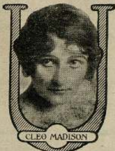
Para el Concurso de EL CINE

Una noche, aprovechando el descanso de la tribu, Azucena roba las joyas de más valor, y César, en la misma tienda del tío Curro, fuerza el cofre que guarda los ahorros de la tribu. El Zancudo, sabedor del plan, intenta desbaratarlo, sosteniendo una lucha cuerpo a cuerpo con el presidiario; pero la cruel Azucena interviene, hiriendo a su compañero de tribu; después de la lucha, César y Azucena incendian la tienda, propagándose el incendio rápidamente por el misero campamento. Los gitanos, sobrecogidos, son presa de indecible pánico; pero repuestos, consiguen llevarse el