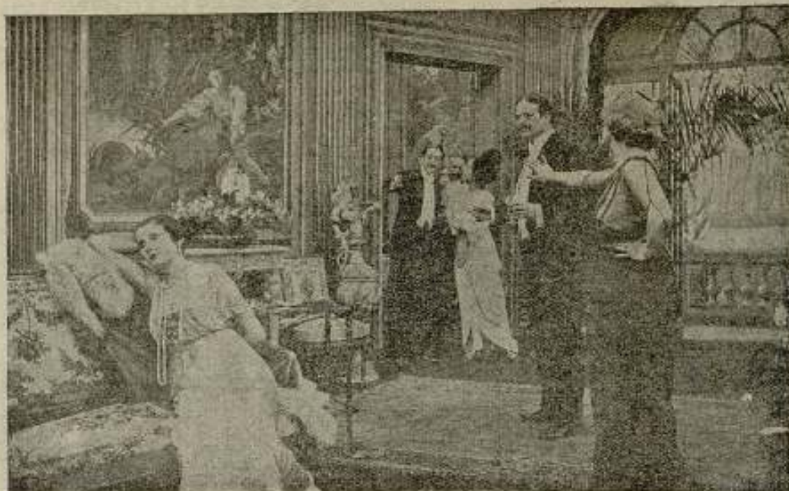
Una escena de la película «Monmartre».