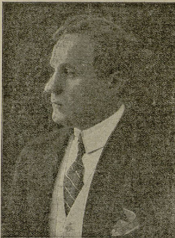
Para el Concurso de EL CINE.—El célebre W. Pellander

Es esperada con gran interés por el elemento cinematográfico, la película de la casa