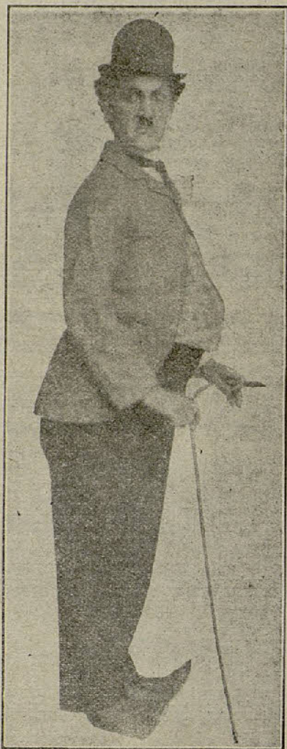
Para el Concurso de EL CINE.—El jocoso Billie Ritchie

Con decir que en el reparto figuraban nada menos que la Pareto, la Lucci, Battistini y Nicoletti-Kórmann, artistas excelentes entre los excelentísimos, está dicho todo.