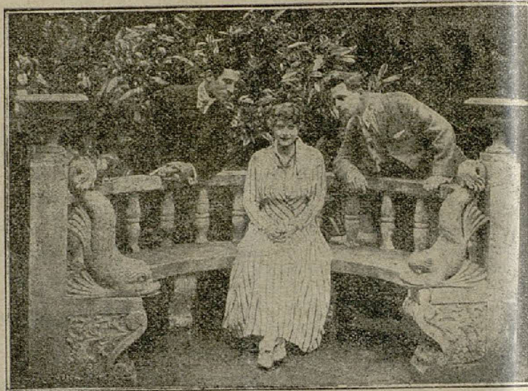
Dos interesantes escenas de la película «El desenlace»