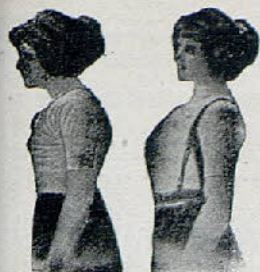
Sin Benefactor Con Benefactor