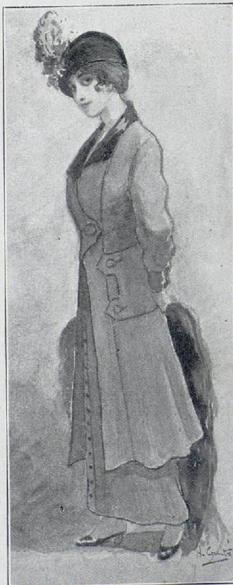
Traje sastre color topo, cuello y bocamanga de terciopelo del mismo tono

La prisionera le dirigió una profunda mirada de desprecio, y murmuró secamente antes de salir:—Gracias.