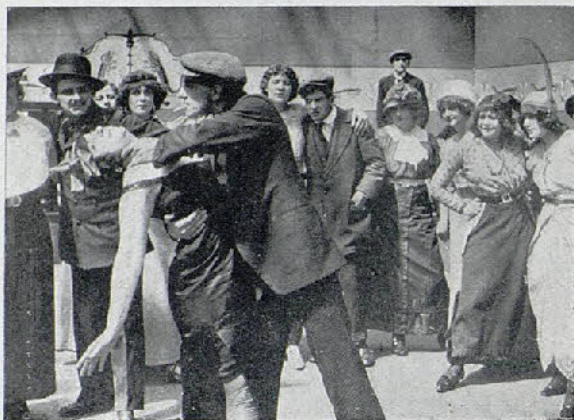
Una escena de la película Los cuervos

Entretanto, la madre enterada de la desaparición de su hijo, se abandona a la más acer-