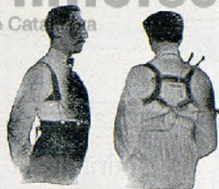
Con Benefactor El Benefactor de espalda