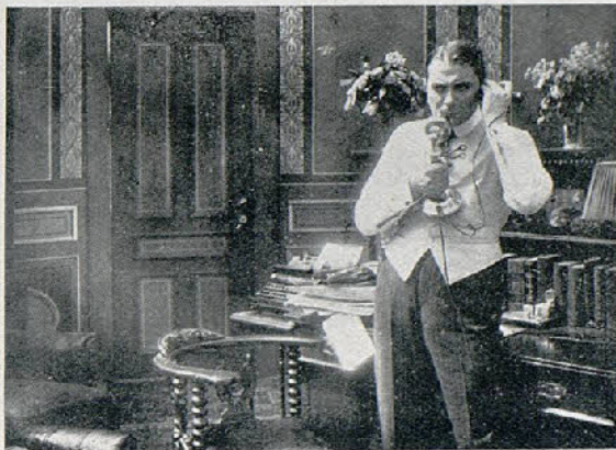
Una escena de la película Los cuervos

El tributo, «Vitagraph» (dramática) 562 metros.