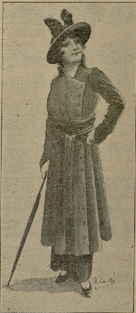
Traje sastre, color gris oscuro, falda, cuello y faja de terciopelo negro

Por fin el gran momento llegó. Era la hora de la comida.