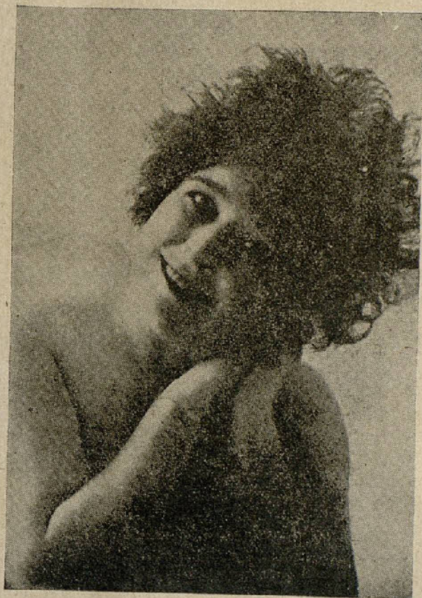
La notable cancionista NINÓN

Nosotros creemos que de los diferentes matices que cultiva sobrepasa en veracidad el de la chulilla madrileña—porque madrileña es—que canta sus dolores y sus alegrías. Sus dolores un poco bravíos y sus alegrías ingenuas sin bastardeos ni chavacanerías de baja estofa, que algunas otras artistas hacen que se hermane tipo tan simpático como son estas