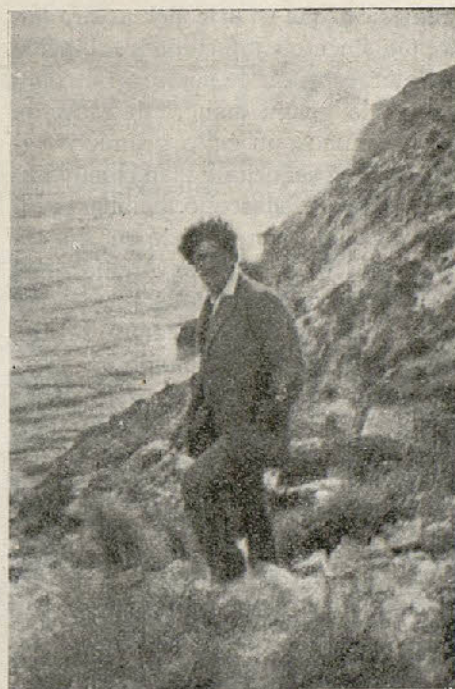
Sydney descendiendo por las rocas de la Costa de Garraf

te, no da idea de insignificancia, sino de poder, de dominio de la inteligencia. Claro es que no hay afirmación que no deje alerto el portillo a la duda, como lo indican estas cruces negras, que abren sus brazos maldiciendo al paso de la «Mala dona». Argilés, siempre al volante, nos las hace observar con un solo gesto y nosotros le contestamos con una son-