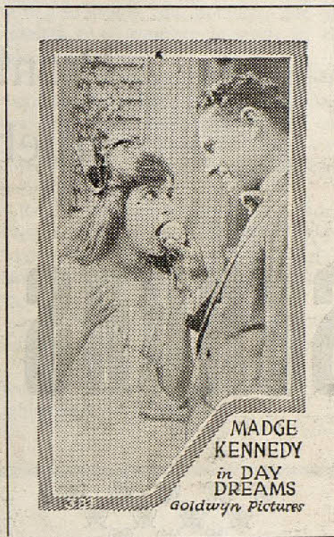
MADGE KENNEDY in DAY DREAMS Goldwyn Pictures

gresará a su patria en compañía de Perla, y hará desaparecer, con su presencia, el intempestivo apodo que pesaba sobre La casa del odio , conocida en lo sucesivo por La mansión de la dicha .