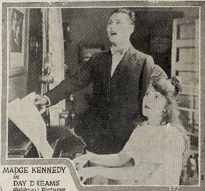
MADGE KENNEDY in DAY DREAMS Goldwyn Pictures

Según noticias de la prensa americana, Max Linder ha llegado a Los Angeles,