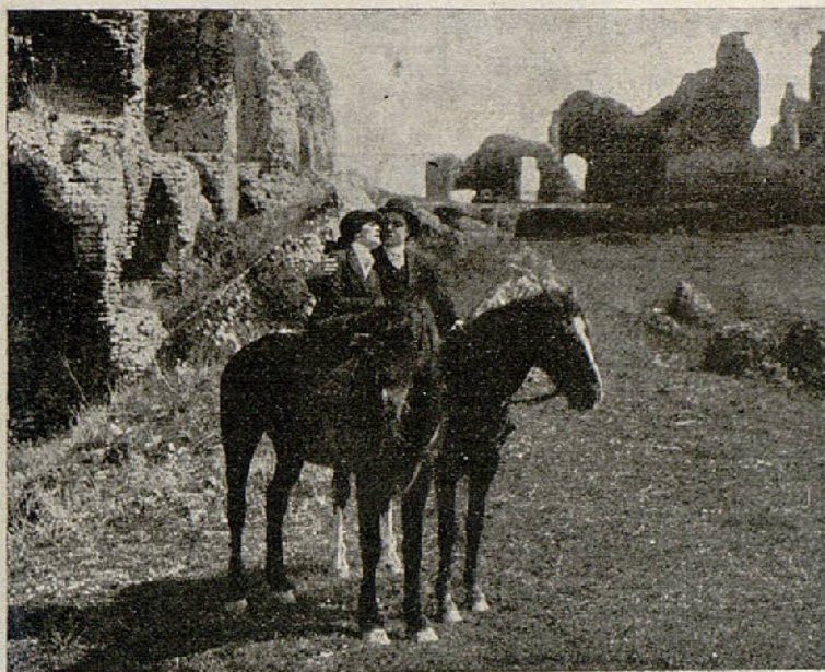
Una escena de la interesante película «El estigma rojo»

Perla ha resultado, sin embargo, sana y salva; pero Gresham está gravísimo.