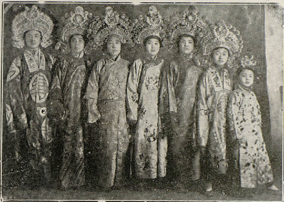
Troupe SEE-HEE que ha debutado en el teatro Circo Barcelonés