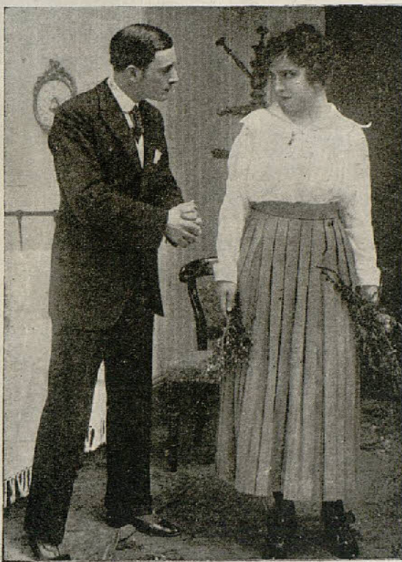
Una escena de la interesante película Adios juventud

El doctor Canfield, acompañado de Rosalinda y de Bates, guía el automóvil a toda velocidad por lo más quebrado del camino. Al dar la vuelta a una curva muy pronunciada, los tres pasajeros contemplan horrorizados como las llamas destruyen el puente. Jugando el todo por el todo, el doctor Canfield arroja el automóvil sobre las medio carbonizadas tablas del puente, logrando saltar a la orilla opuesta. Gracias a esta temeridad, el testigo entra en la sala del tribunal a la hora fijada. (Continuará)