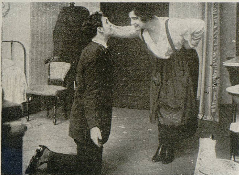
Una escena de la interesante película Adios juventud

Gilberto recibe una misteriosa comunicación de uno de sus secuaces en la que éste le informa que la fortuna de Homero Joy está escondida en una maleta cuyo paradero sólo Rosalinda sabe. Esta noticia parece infiltrar