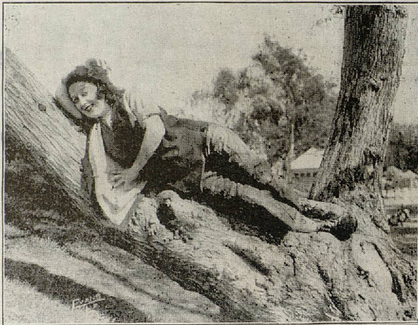
Una escena de la interesante película Mickey

Nuestra enhorabuena a los distinguidos intérpretes de «Mátame!» y a la manufactura Studio, al acometer una empresa digna de todo elogio.