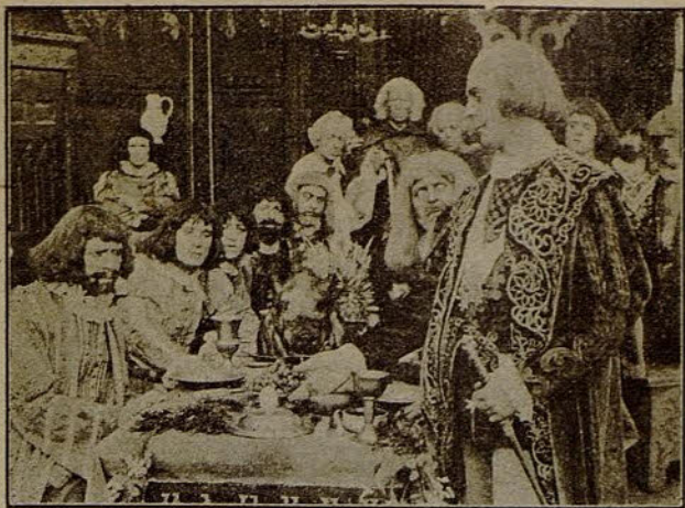
Dos escenas de la famosa película CRISTÓBAL COLÓN