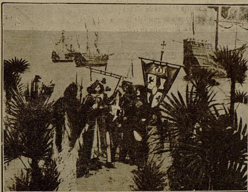
Una escena de la grandiosa película «Cristóbal Colón»

El aturdimiento y distracción de Pacomio parecían divertir prodigiosamente a su perseguida, que tenía que hacer esfuerzos para no soltar la risa. Así que terminó de hacer sus compras, obligando en ese intervalo a su perseguidor a hacer lo propio, tomó un automóvil a la carrera y desapareció de los ojos de aquél, que quedó como se dice con un palmo de narices.