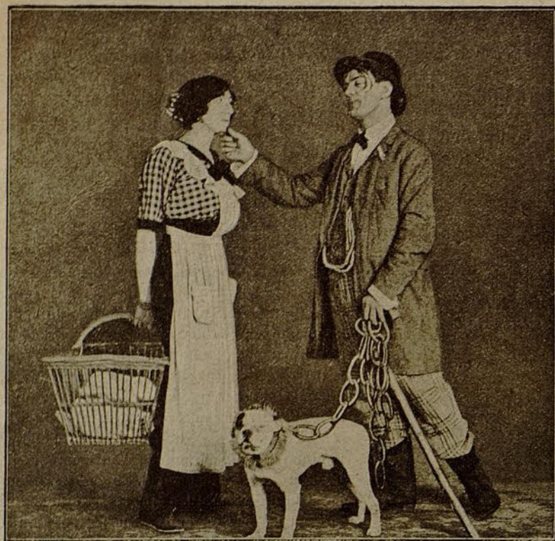
Una escena de la película «Zigoto»

Luego, ofreciendo la mano galantemente á