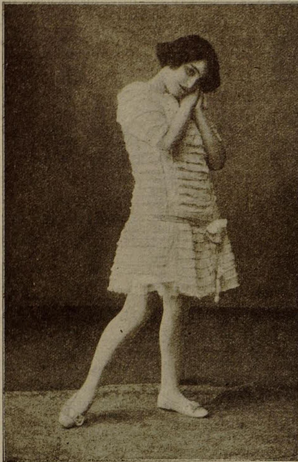
• MONNA •

Hermosa excéntrica que ha actuado en los principales Music-halls de Barcelona y es hoy día aplaudidísima en el teatro del Bosque.