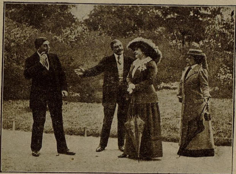
Escena de la película «El tren expreso».

Gastón contaba con el azar, que rige nuestros destinos, y que suprime ó alarga las horas, que se complace en regir á su guisa las pasiones, los sentimientos y las costumbres de la humanidad.