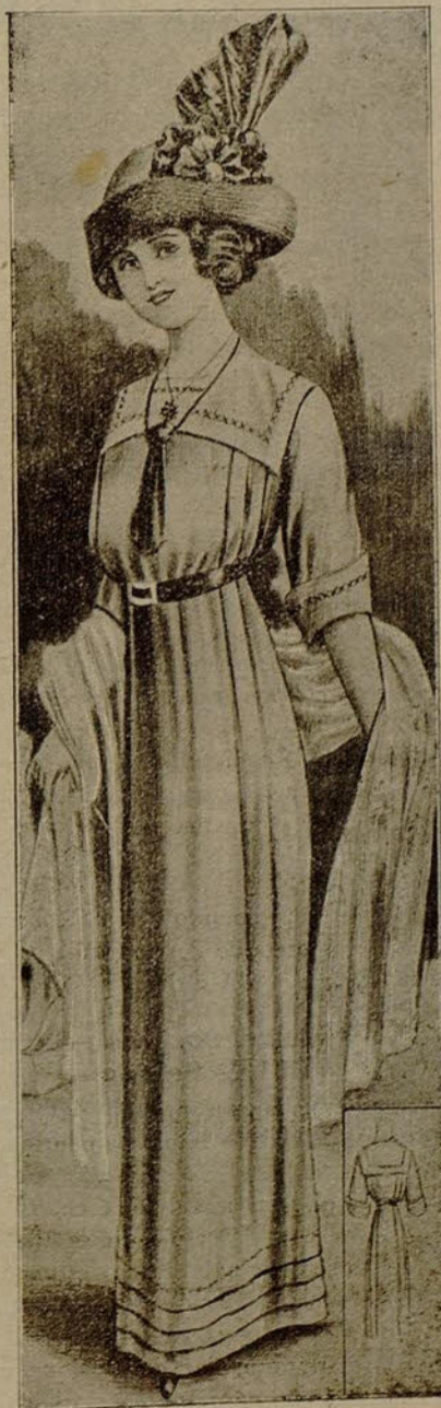
Toilete de campo ó playa

Blusa marinera con cuello cuadrado y corbata de seda. Falda con tablero y cuatro jaretas en el bajo.