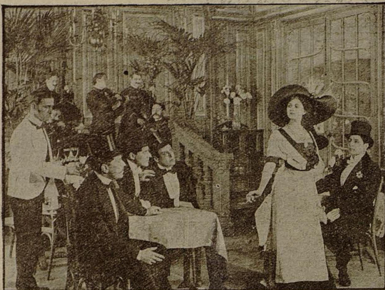
Pedro, á impulsos de una agitación inmensa, medio levantóse de su asiento (De la película «La otra»).

Esta revelación acabó de completar la transformación que lentamente se operaba desde hacía algún tiempo en su alma. Y como sintiera que aquella había de hacerse extensiva también al traje, se vistió y