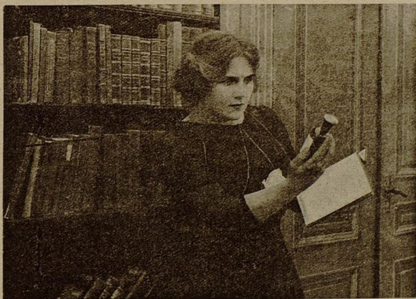
Una escena de «El torbellino de la vida»

Aterrado Robert, deja caer la botella, que se