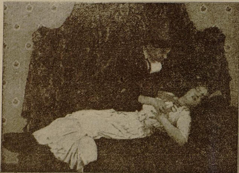
Una escena de «El fantasma del pasado»

con tal de llegar al fin; se trate de amigos ó enemigos, no le importa. Así es que, habiéndose ausentado por un momento el Profesor, aprovecha la ocasión para apoderarse de la invención de su amigo, colocando en su lugar otra botella parecida, á la que pega una falsa etiqueta. El Profesor no se apercibe del robo, tiene entera confianza en Robert y hasta le invita á comer.