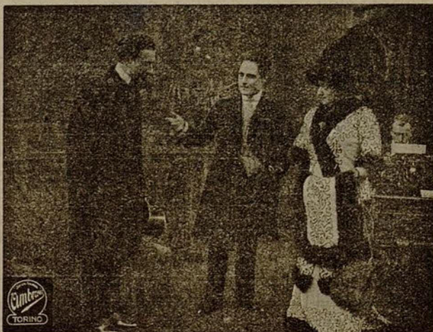
Una escena de la película «La rampa»

Poco á poco, el arte vá envolviendo el alma