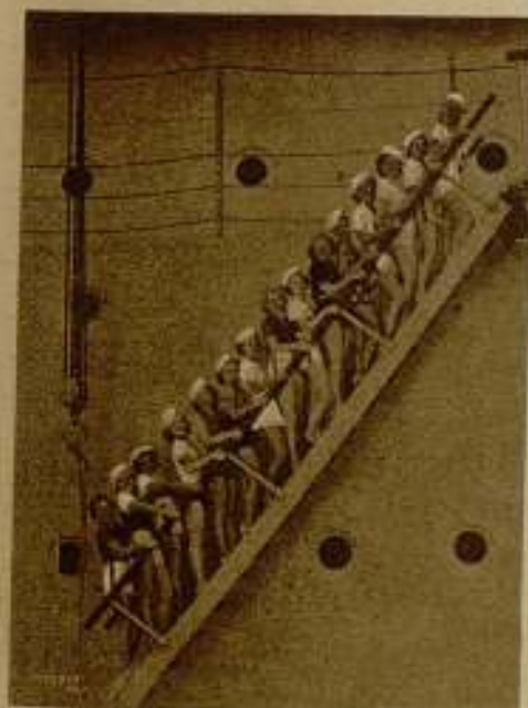
«Cargamento salvaje»

Una casa la ha contratado para una reaparición con todos los honores.