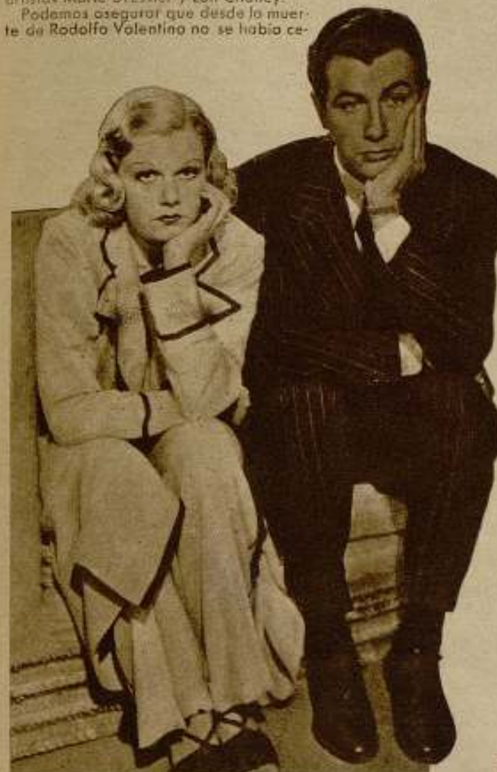
Las tres últimas películas de Jean Harlow

Podamos asegurar que desde la muerte de Rodolfo Valentino no se había ce-