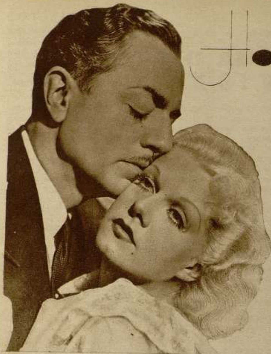
Beso emocionalmente éste, que William Powell da a Jean Harlow, en el que se plasman, mezclados, la ternura y el dolor, beso simbólico, exento de sensualidad, como un adiós póstumo en el rostro de la amada, cuya belleza ni la agonía osó destruir.

T RANSCRIBIMOS algunos detalles de la muerte y sepelio de la grande y malograda artista Jean Harlow, en la seguridad de que han de interesar al público español que tanto la ha admirado.