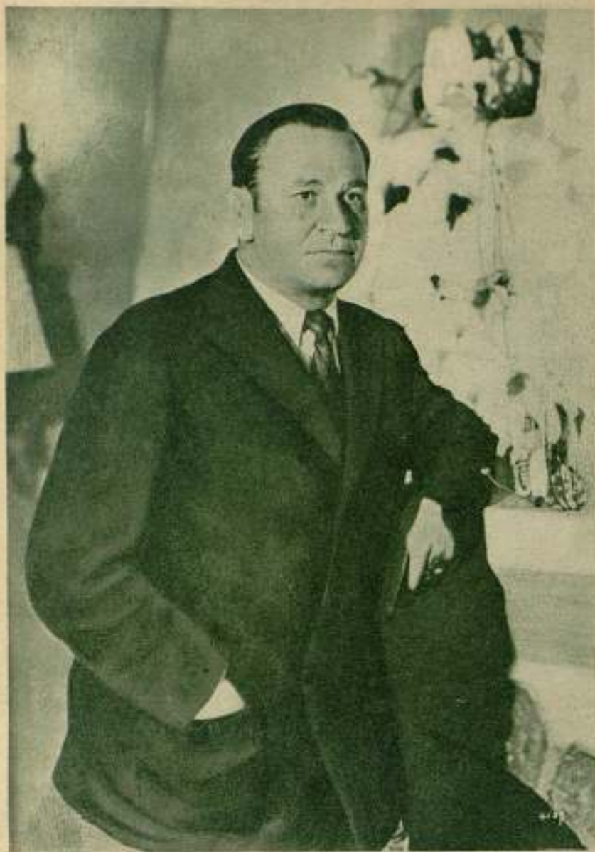
Wallace Beery.