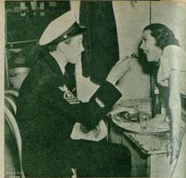
James Stewart estaba castigado a comer solo. Pero para calma de males, Eleanor Powell estaba castigada a no comer. «¿Me quiere dejar probar el bistec?», ha dicho Eleanor. «Con mucho gusto», responde Stewart con una cara de veinte mil diablos. «El gusto es mío», contesta la picaresca Eleanor.