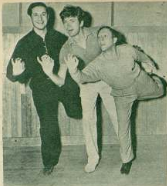
A Dave Gould, director de bailes de la Metro, le han dado dos patos por desbravar: Buddy Ebsen y Sid Silvers.