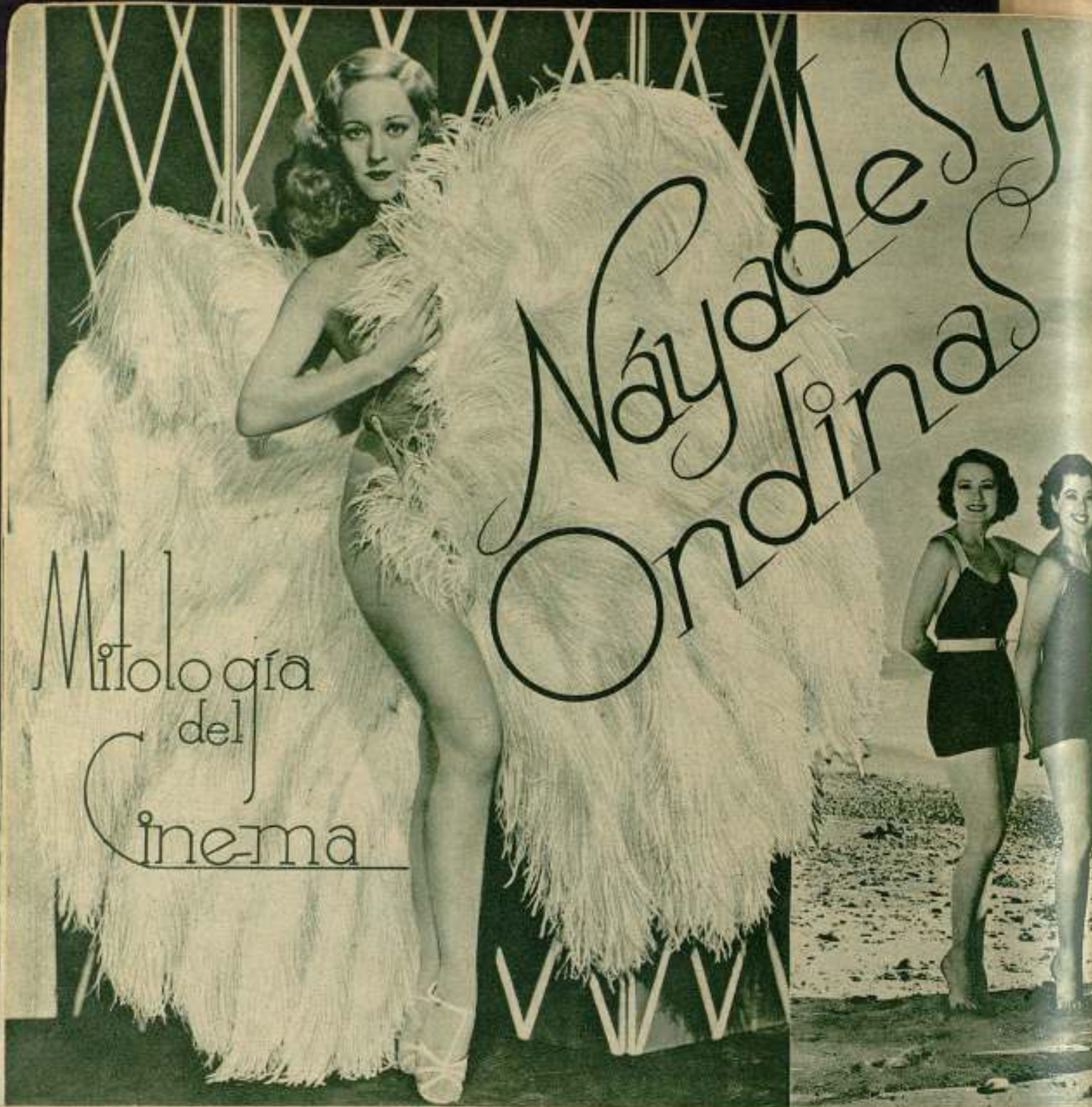
Sally Rand.

T AMBIÉN el cine cuenta con sus muchachas de conjunto; no se llaman así, claro está. Si el cinema no contase con un léxico propio, perdería un cincuenta por ciento de su fuerza mágica. Se llaman «girls» o parecidamente. Pero, en el cinema, estas muchachas tienen una importancia decisiva. Fueron, antes, las bañistas de Mack Sennet: llevaban un rayado maillot que les daba un aire de ligeras cobras del mar. Era el primer paso hacia la mitología — todo el cine es un mito infinitamente