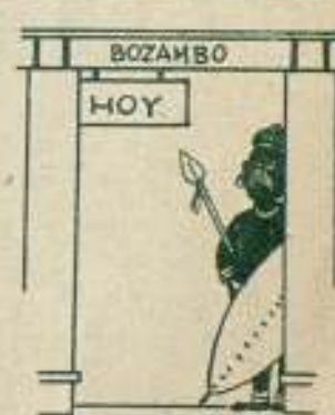
Y después de todo, ¿por qué no?