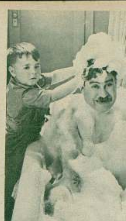
«Spankys», el chaval de la Pomilla, donde jaban a Billy Gilvert. Es lo que dijo el clásico: «Con jaban nada hoy que falle.»

Lo dramático del caso es que en el cine en cuestión ha caído una verdadera plaga de novios y el director no se atreve a prohibir sus expansiones... por si las moscas.