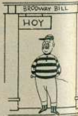
...la nueva empresa...