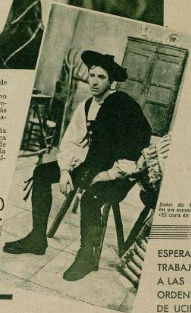
Juan de Orduña en un momento de «El cura de aldeas».