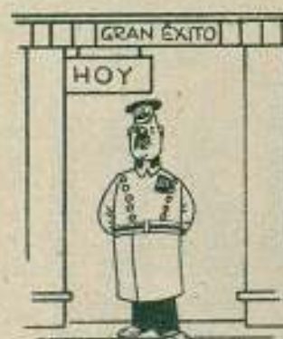
Antes lucía ya un magnífico uniforme de portero...