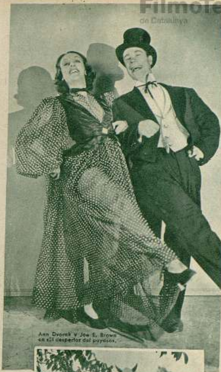
Ann Dvorak y Joe E. Brown en El despertar del payaso .