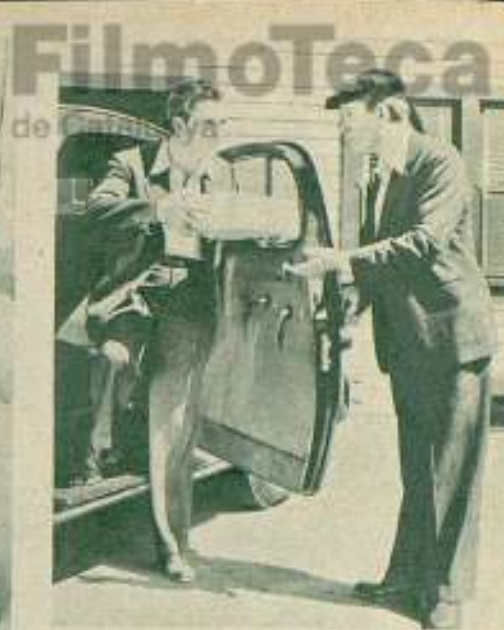
Stuart Erwin se queda perplejo al observar que el mismo se abre la portezuela del auto, al propio tiempo que Stuart Erwin se queda mirando al que baja y exclamar: «Caray, ¿hey yo, a soy el otro?»