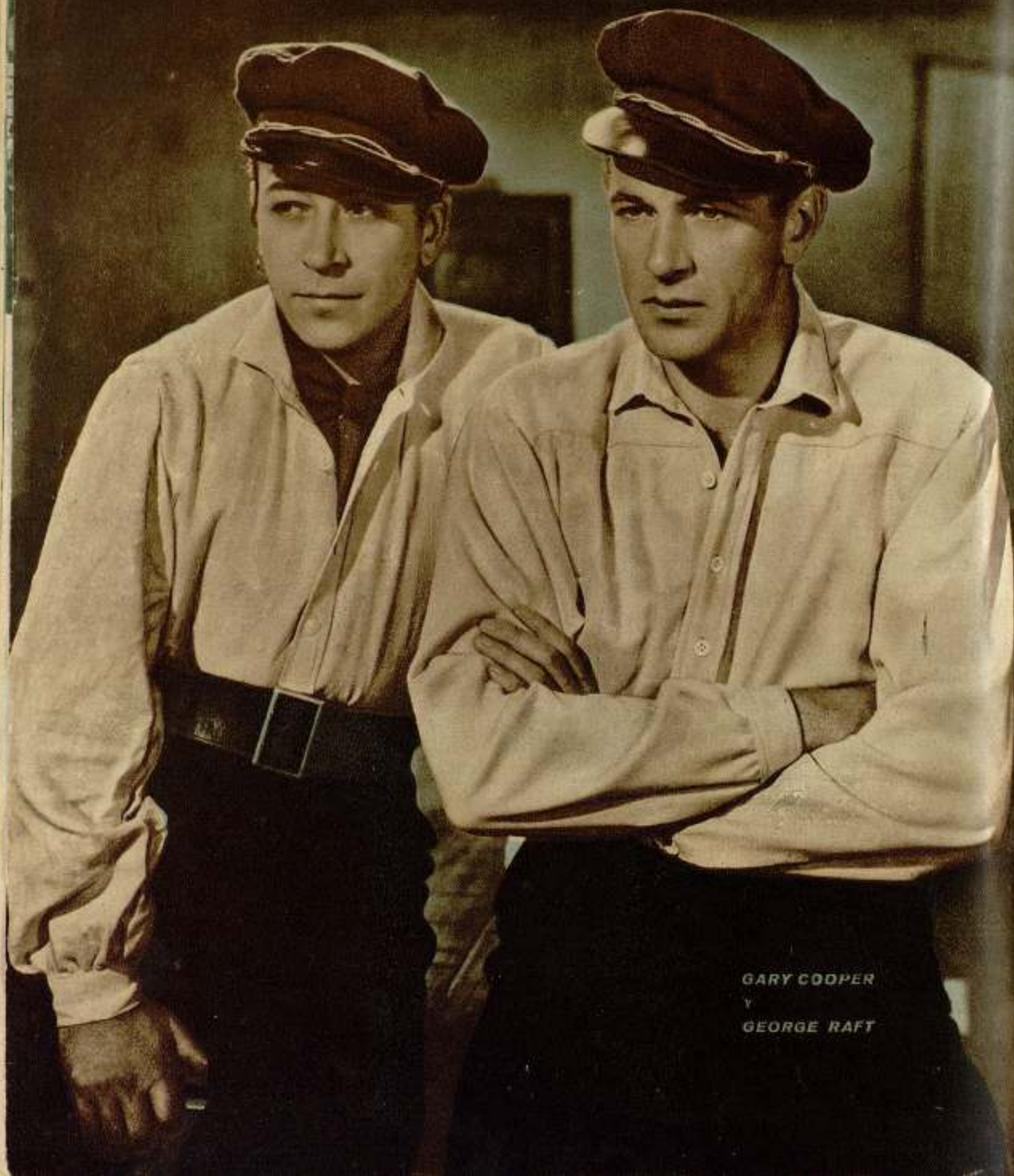
GARY COOPER Y GEORGE RAFT