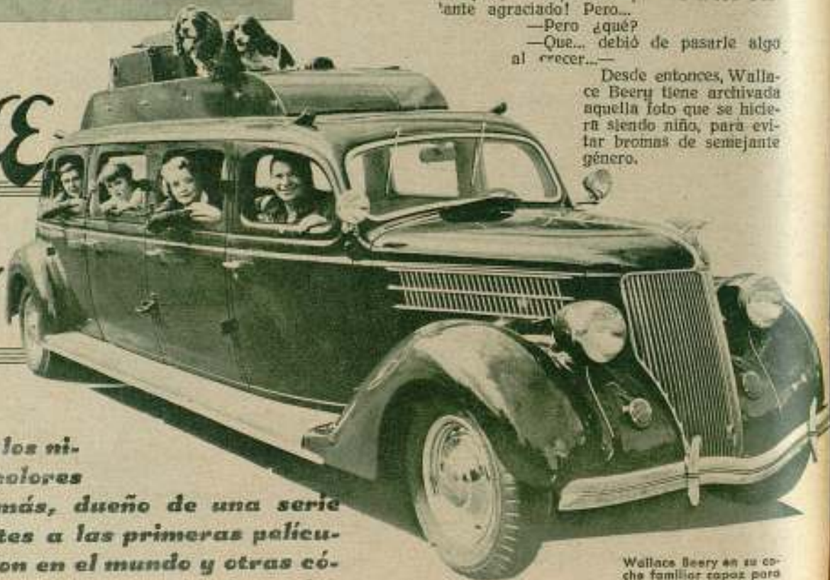
Wallace Beery en su coche familiar capaz para once pasajeros, en el que viaja con sus hijos.

Desde entonces, Wallace Beery tiene archivada aquella foto que se hizo siendo niño, para evitar bromas de semejante género.