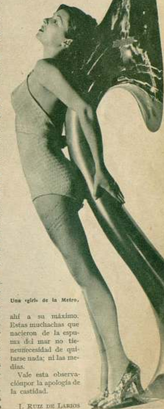
Una «girl» de la Metro.

ahí a su máximo. Estas muchachas que nacieron de la espuma del mar no tienen necesidad de quitarse nada; ni las medias.