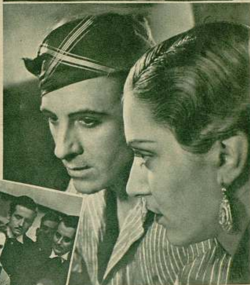
Un admirable primer plano de Juan de Orduña y Pilar Muñoz en «Nobleza baturra».