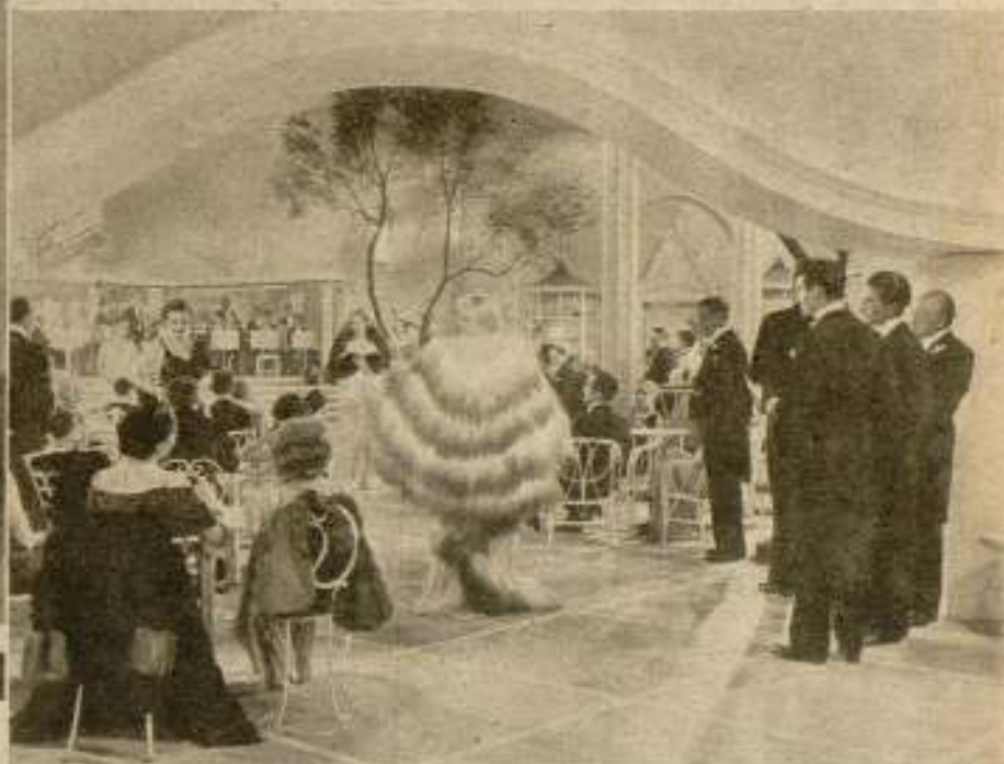
«Giras» que el cine americano ha internacionalizado.

Una escena hoy clásica en las películas de gran espectáculo. Exhibición de modelos dentro de un marco fantástico y deslumbrante.