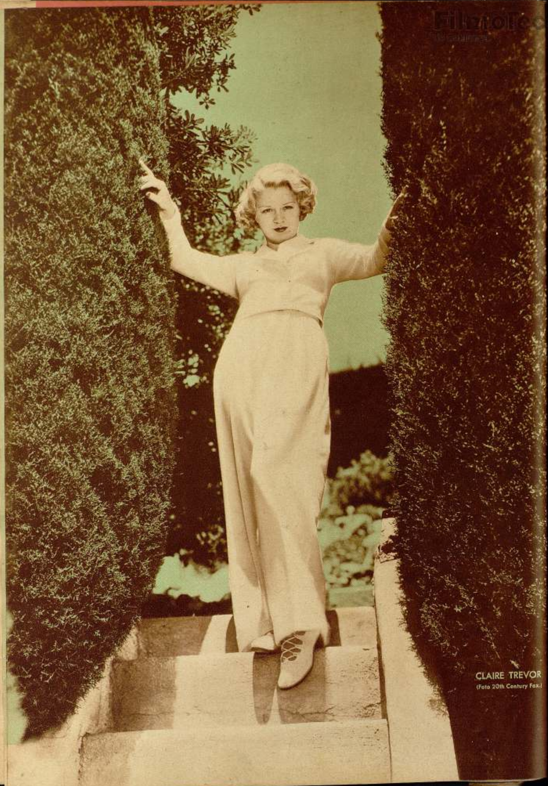
CLAIRE TREVOR