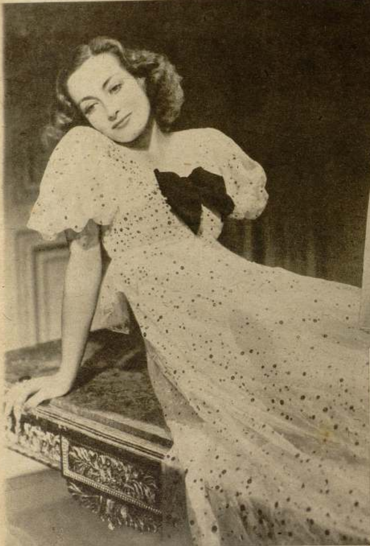
Por su magnífica figura, ha sido popularizada Joan Crawford como la «Venus moderna». Su baño diario en la playa dió a su cutis un tono bronceado que había de hacer furor por todas las playas del mundo.

En manos de sus directores, grandes artistas, hombres de vasta cultura y refinamiento, el cine norteamericano ha encontrado un tesoro de elementos de gracia, de elegancia, en las maneras y en el vestir exclusivamente norteamericanos. Estos grandes artistas han sabido destacar en las almas, en los cuerpos, en los gestos, en las costumbres, una serie de esencias que no pertenecen a otros pueblos, que son exclusivamente norteamericanos. Han sabido encontrar un estilo propio. Y el estilo repre-