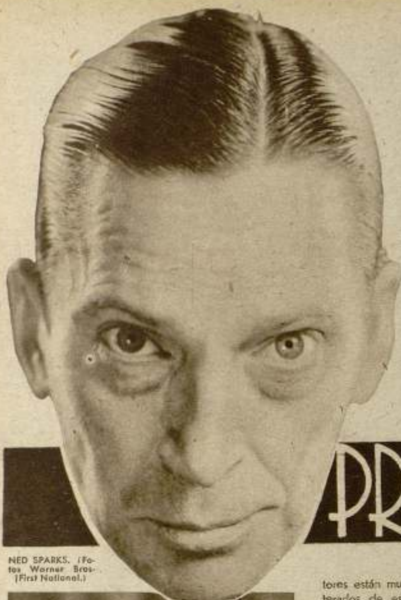
NED SPARKS.