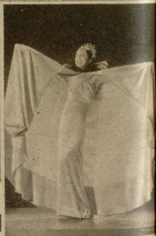
Irene Dunne, evocadora de exquisita sensibilidad... de elegancia inabarcable... de raras musas que decían nuestros días con su voz de plata.