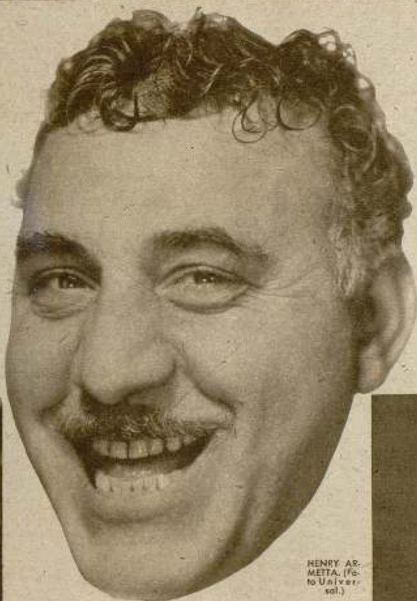
HENRY ARMETTA.

Como ya hemos dicho, su casa es la mejor amueblada de toda la región. Edward Everett Horton es muy sociable y gusta del trato de la gente. Asiste a fiestas y las da, aunque se muestra algo exigente con respecto a sus amigos. Entre éstos figuran, en primera línea, Ruth Chatterton y Genoveva Tobin. Es soltero. Este año tiene el propósito de ir a Nueva York para representar una comedia. Pero el