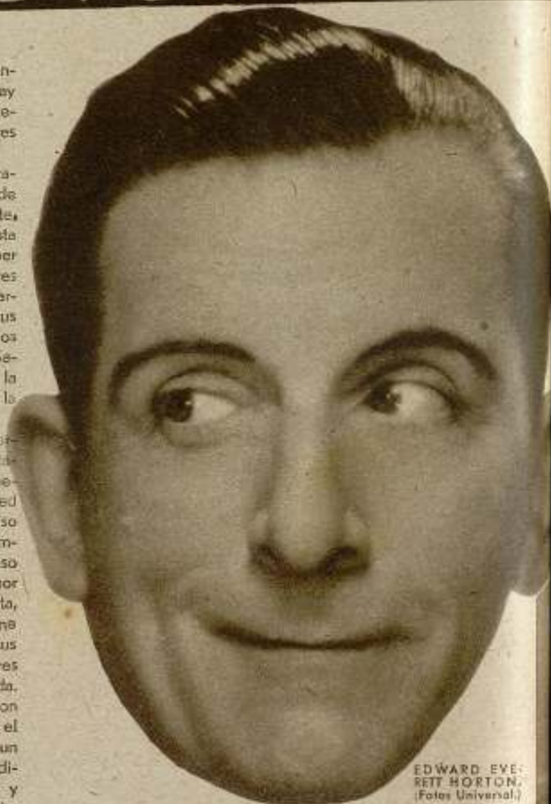
EDWARD EVERETT HORTON.