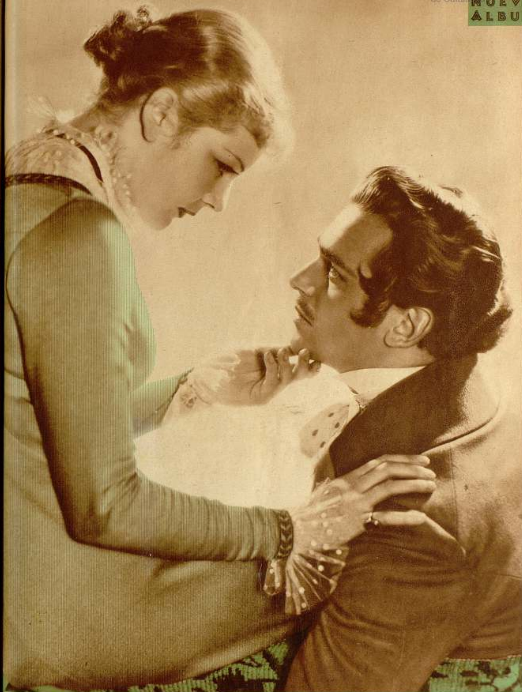
Elissa Landi y Douglas Fairbanks Jr. en «Caballero Improvisado»