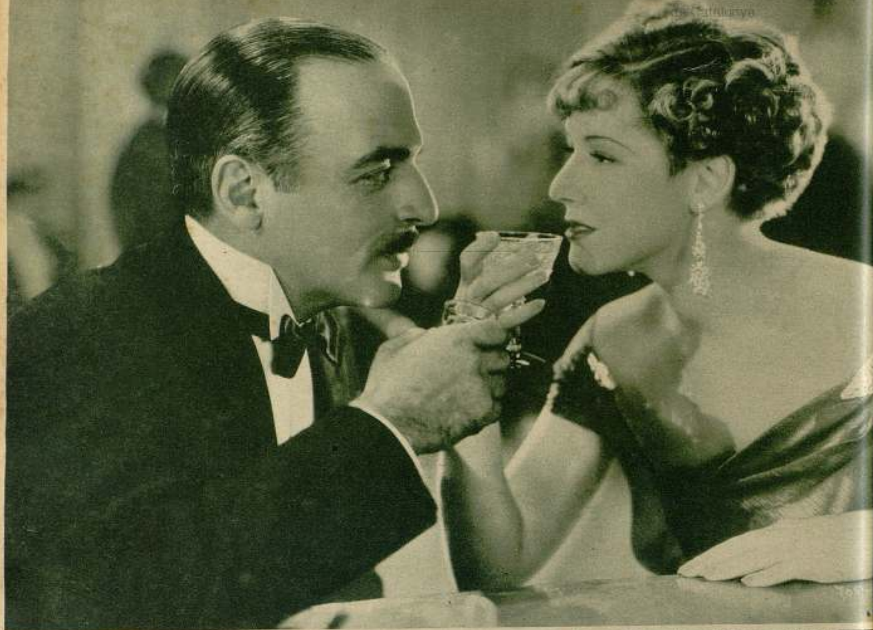
C. Henry Gordon y Mae Clarke, en una escena de «Asesinato en la terraza».