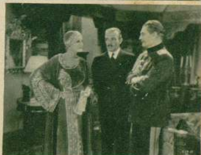
C. Henry Gordon con Greta Garbo y John Barrymore en «Mata-Hari».