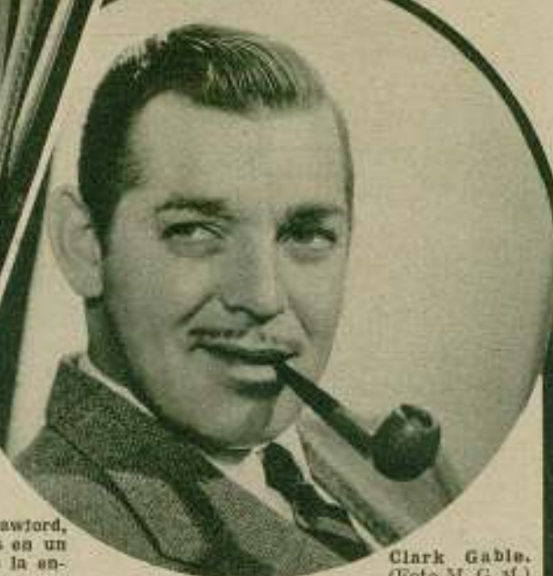
Clark Gable.