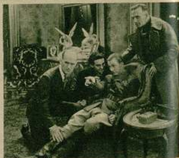
C. Henry Gordon en un momento del film «De última hora».

C. Henry Gordon en una escena de «Tempestad de amores».