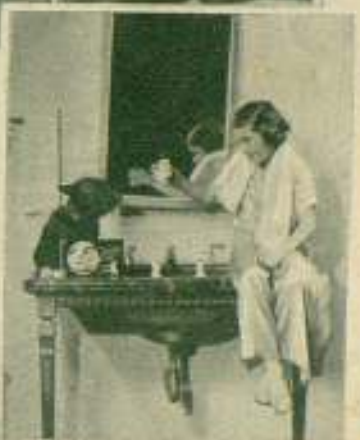
Edith Fellows, estrella de «Pagó y mamá se casó», con Mary Astor y Melvyn Douglas, de la Columbia.