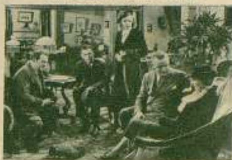
Gertrude Green y Richard Dix en una escena de «El escuadrón del Diablo» de la Columbia.

Edward Arnold, Russell Hardie, Joan Perry, Frank Conroy.