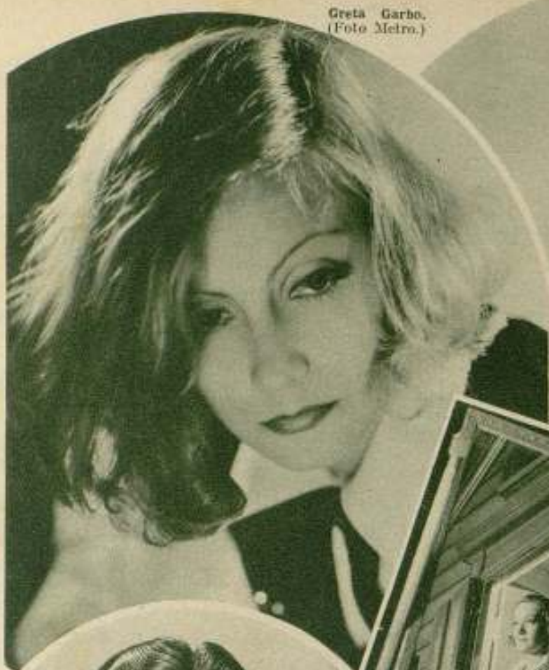
Greta Garbo.