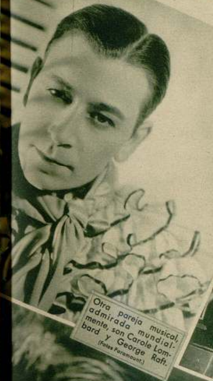
Otra pareja musical, admirada mundialmente, son Carole Lombard y George Raft.