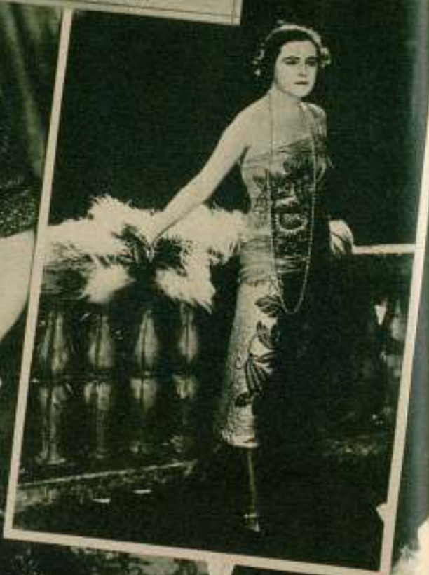
Francesca Bertini, que con Gustavo Serena formó una de las primeras parejas de la pantalla.