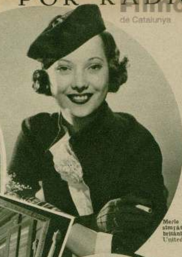
Merle Oberon, la atractiva estrella británica.