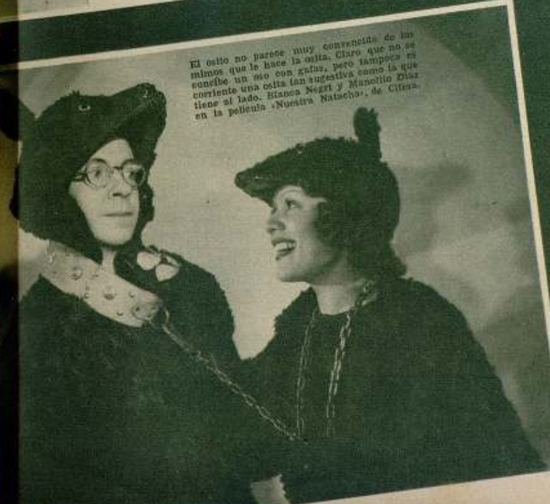
El oso no parece muy convencido de los mimos que le hace la niña. Claro que no es como un oso con gatas, pero tampoco es como un oso tan sugestivo como la que corrientemente se ve en las películas de Cifesa.