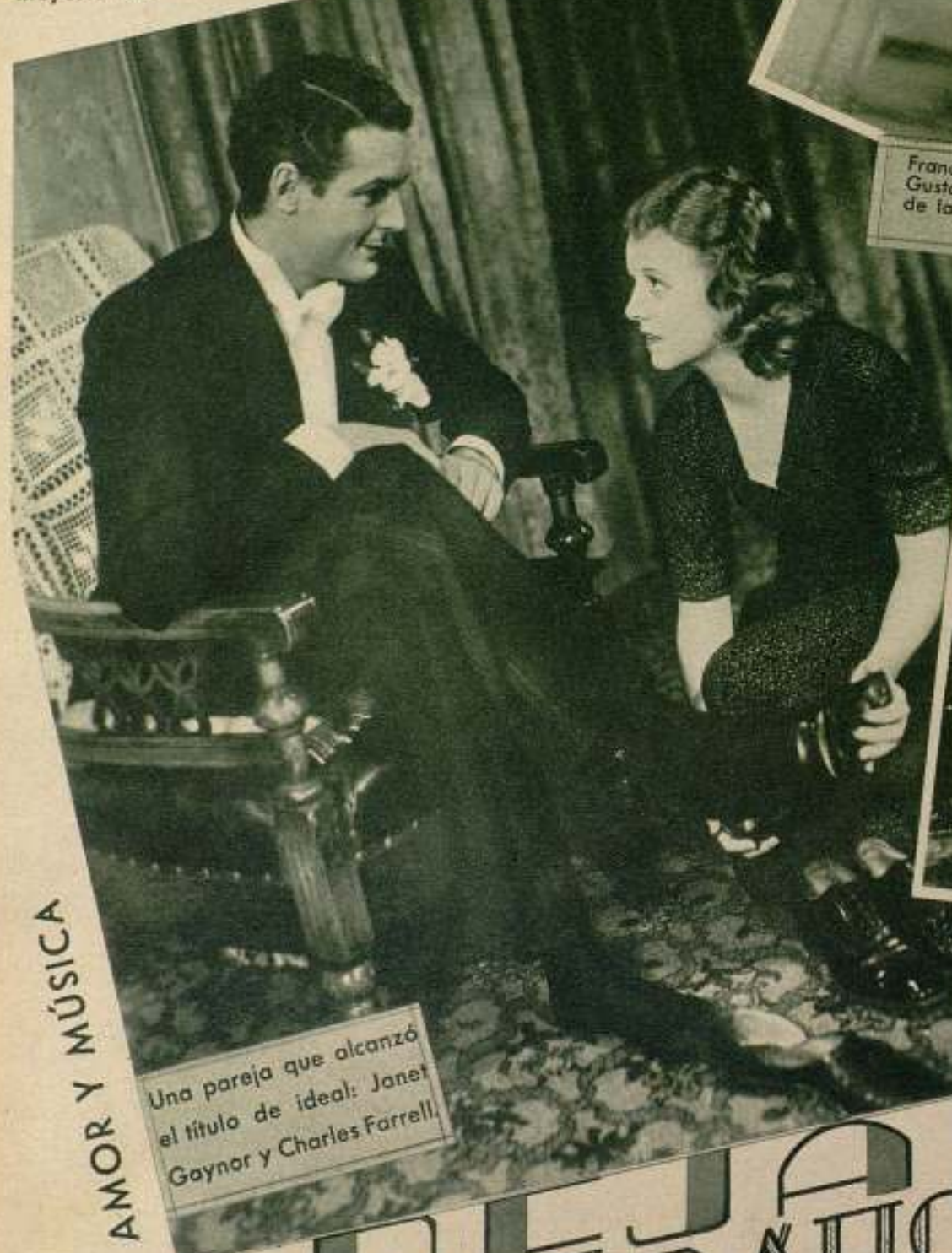
Una pareja que alcanzó el título de ideal: Janet Gaynor y Charles Farrell.

Janet y Charles popularizaron el tipo perfecto de pareja eternamente joven y soñadora, dulce y sencilla, pero eterna y floreciente siempre una nueva pasión. Sin exageraciones filmicas ni languideces bertinescas, y sin ribetes de tragedias patéticas y paroxismos dolorosos, que en la mayoría de