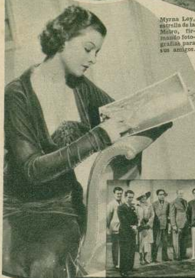
Myrna Loy, estrella de la Metro, fir- mando foto- grafías para sus amigos.