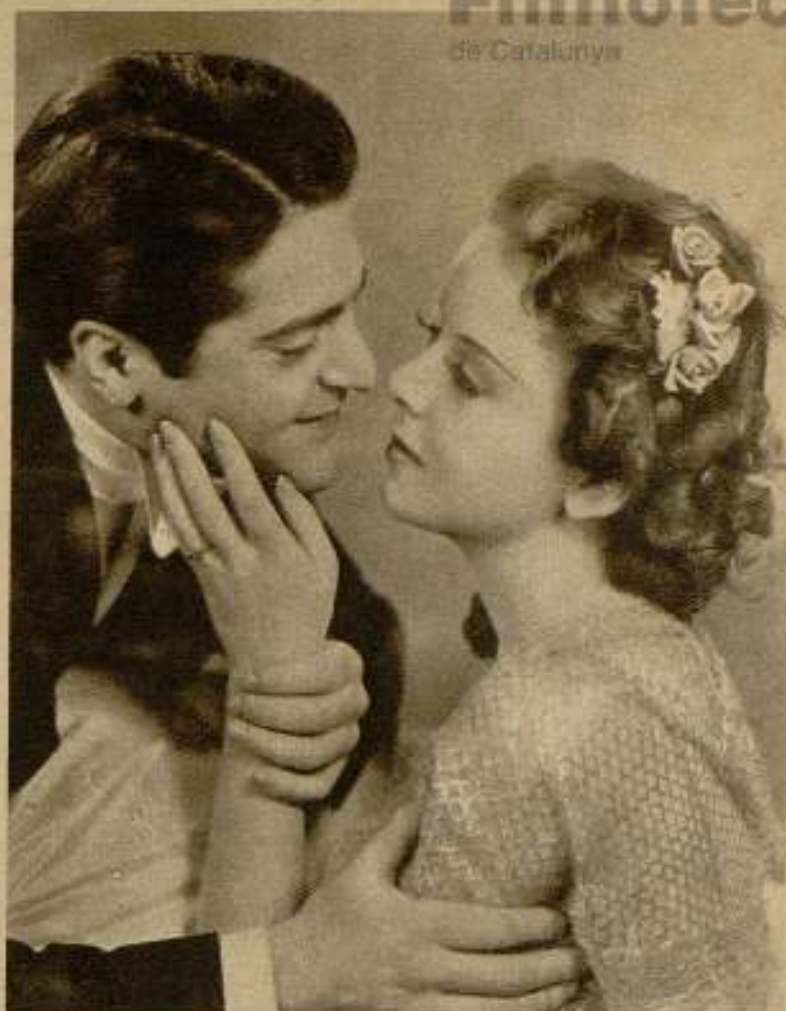
Francis Lederer e Ida Lupino en una escena de la producción Pickford-Lasky, «Ocurrió una tarde».