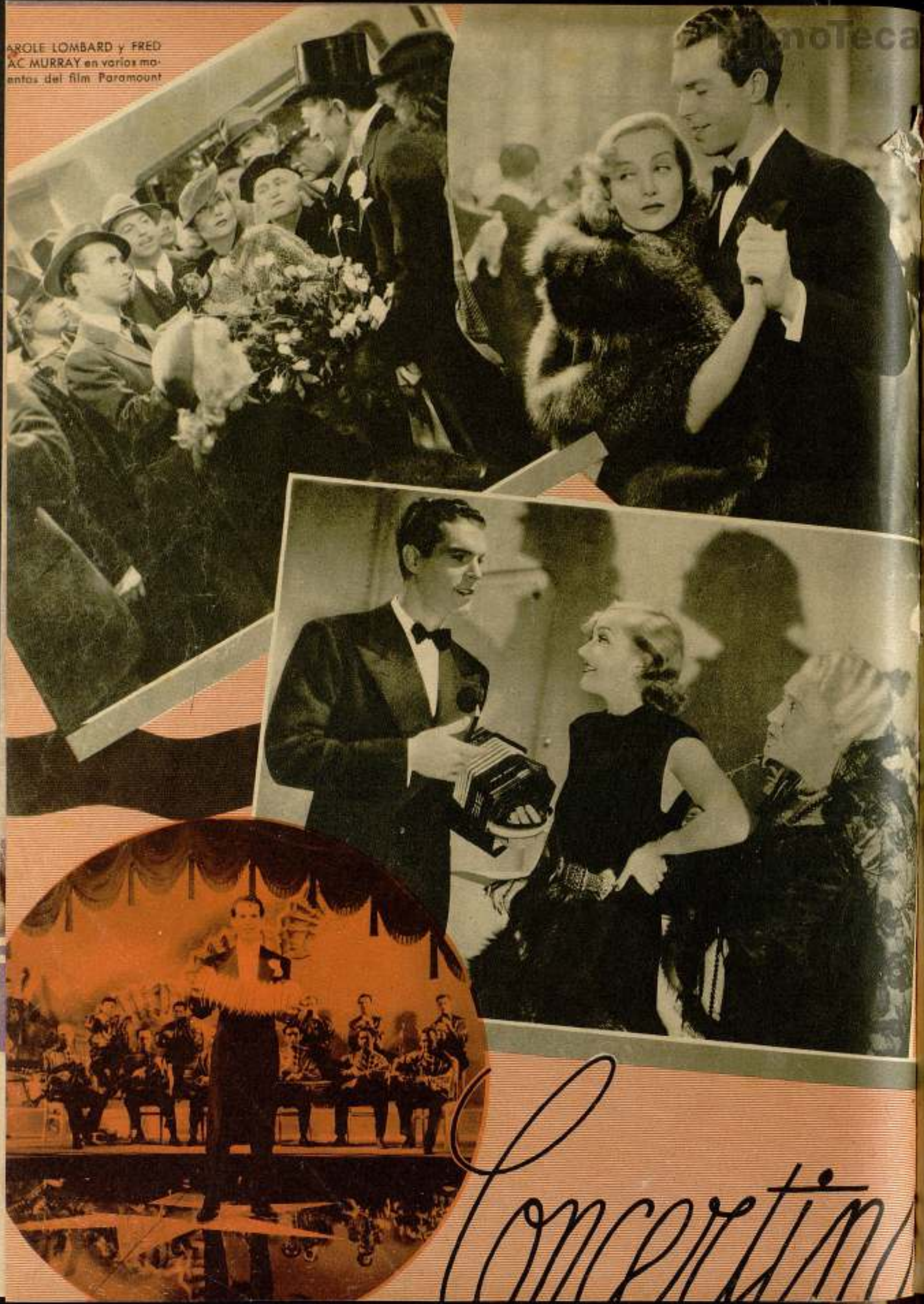
AROLE LOMBARD y FRED AC MURRAY en varios mo- mentos del film Paramount