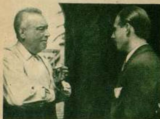
«Civilització...» de J. Arrufat y F. Viader, de la «Associació de Cinema Amateur».

«La vida és un joc de mans» («La vida es un juego de manos»), de Eusebio Ferré, de la «Associació de Cinema Amateur», del F. A. D. Una historia sencilla de la vida de una muchacha desde su llegada al mundo hasta el nacimiento de su primer hijo, explicada siempre y solamente con primeros planos de las manos de sus intérpretes. El autor, cineasta cien por cien,