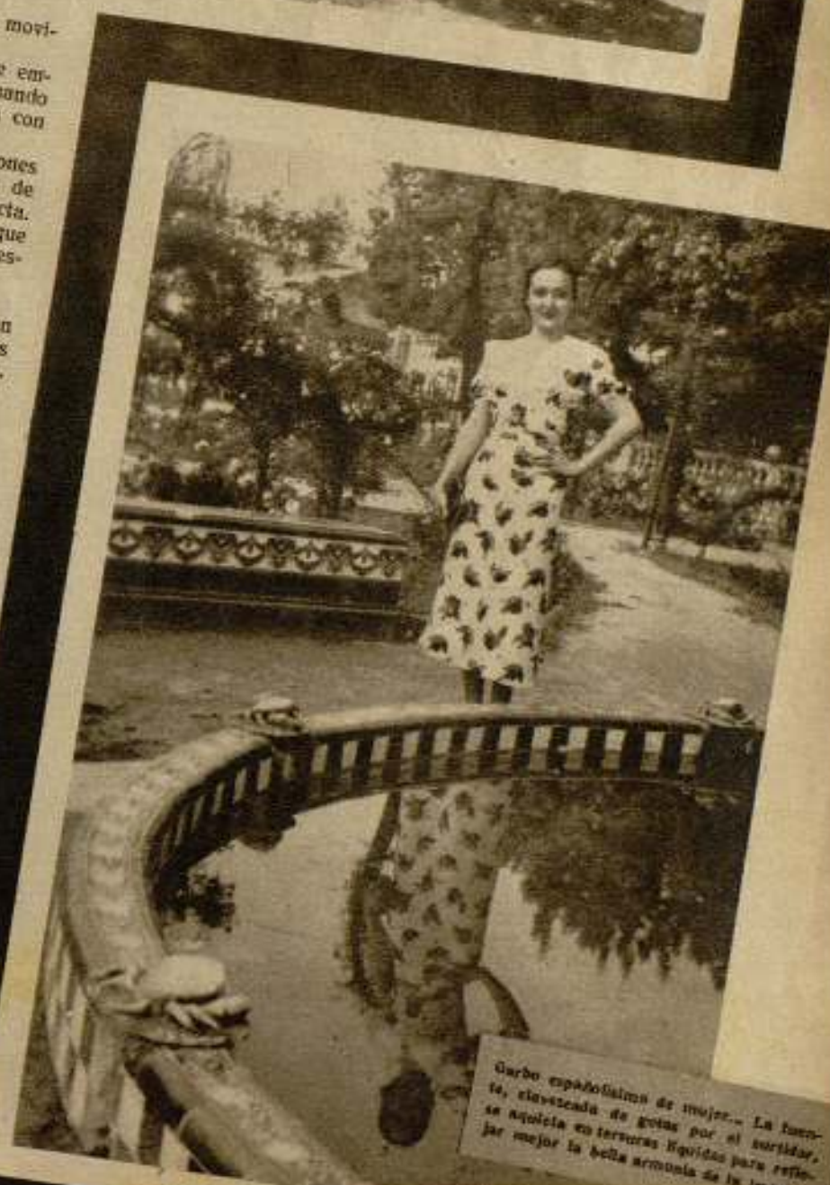
Curdo españolismo de mujer... La fuente, elevándose de gotas por el surtidor, se agita en terribles líquidos para reflejar mejor la bella armonía de la imagen.