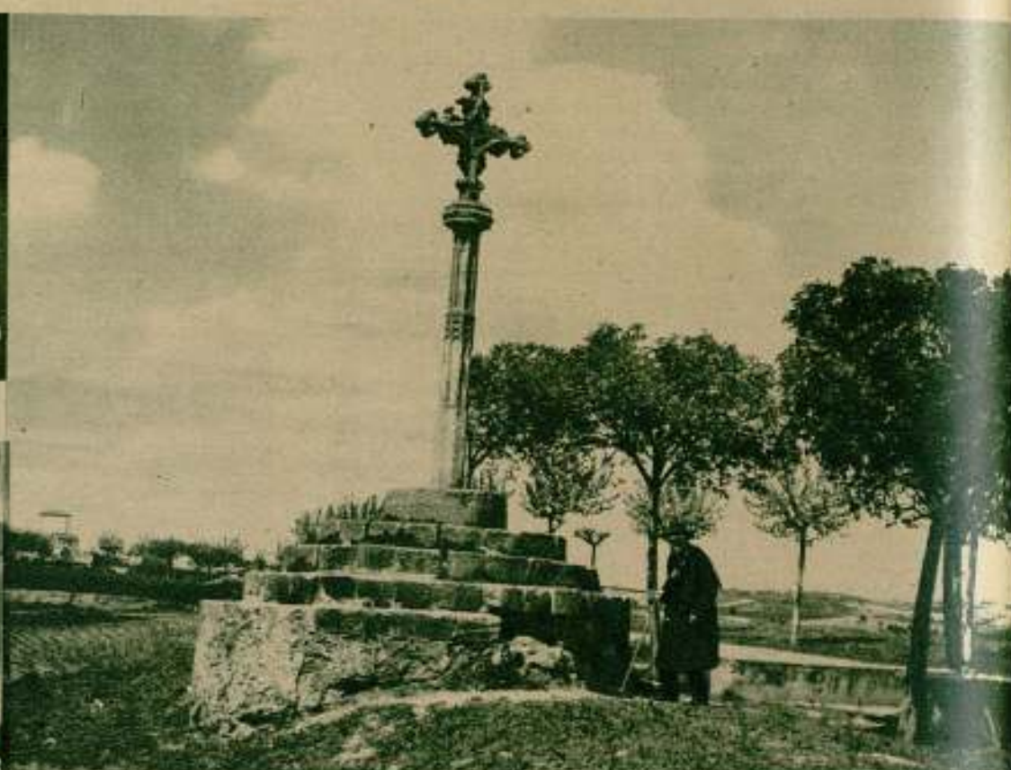
«Última jornada», de Jacinto Arnau, de la «Associació de Cinema Amateur».

Antes de proseguir hasta el examen de lo que fué la sesión queremos subrayar el éxito de este concurso, del que puede enorgullecerse muy justamente la Federación. El número de entidades participantes ha sido de once. De cinco participantes en el Primer Concurso celebrado la temporada pasada, se ha llegado a la cifra de once; esto nos dice más claramente que todas las explicaciones que puedan darnos, la pujanza que está despertando nuestro cinema amateur. Este número de entidades participantes o sea entidades que producen cine es el mayor éxito de la Federación.