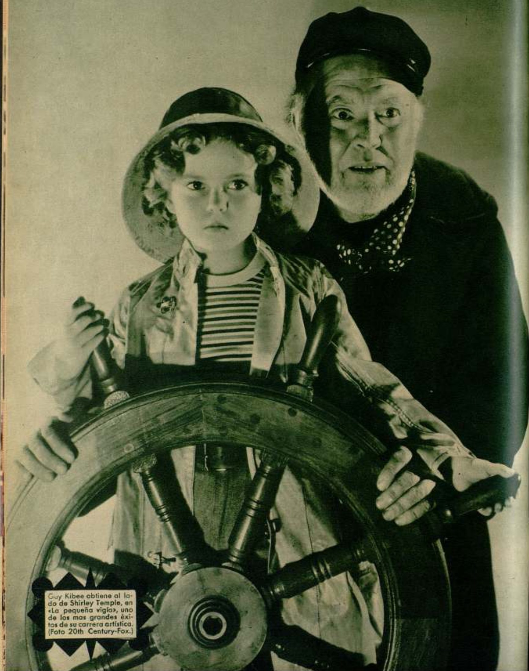
Guy Kibee obtiene al lado de Shirley Temple, en «La pequeña vigla», uno de los más grandes éxitos de su carrera artística.