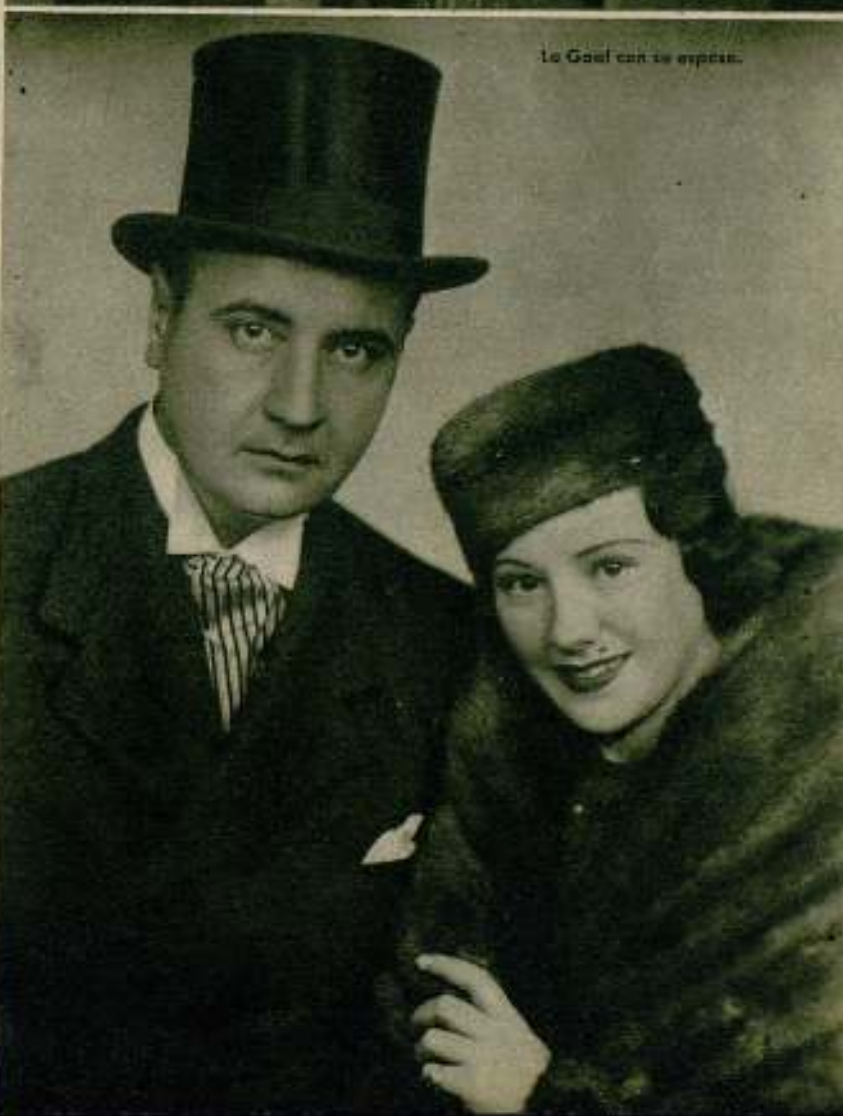
La Gaal con su esposo.