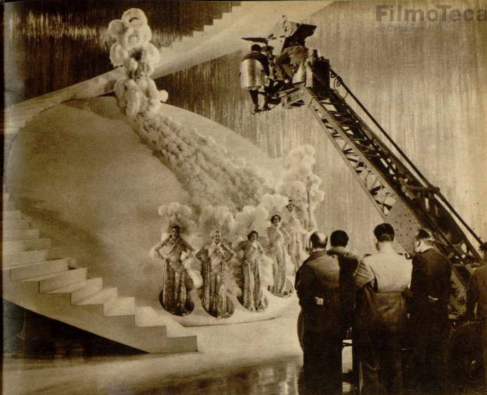
El traje más suntuoso creado hasta ahora para una película. Está elaborado con quinientas plumas blancas de avestruz, y siete lindas muchachas forman la cola. Virginia Bruce luce el primoroso traje en una nueva película de la Metro-Goldwyn-Mayer.

por la que en el en por retario elistas, fotos. con- el, la os fin- que r, do pro- ral de studios forma