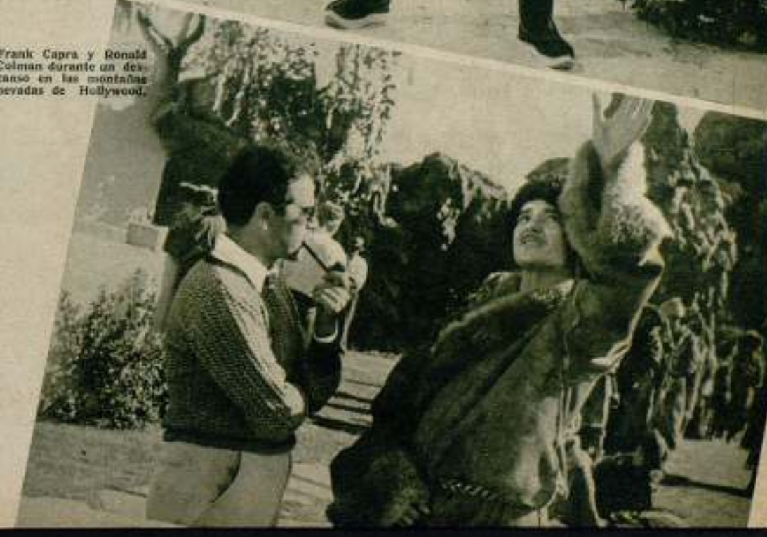
Frank Capra y Ronald Colman durante un descanso en las montañas nevadas de Hollywood.