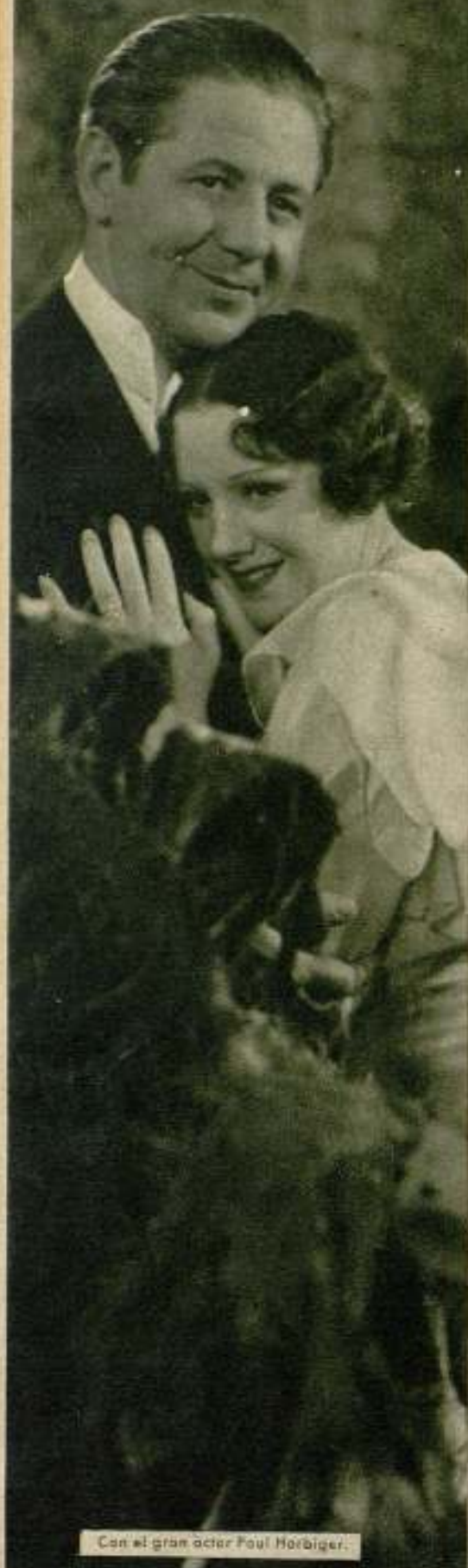
Con el gran actor Paul Hörbiger.