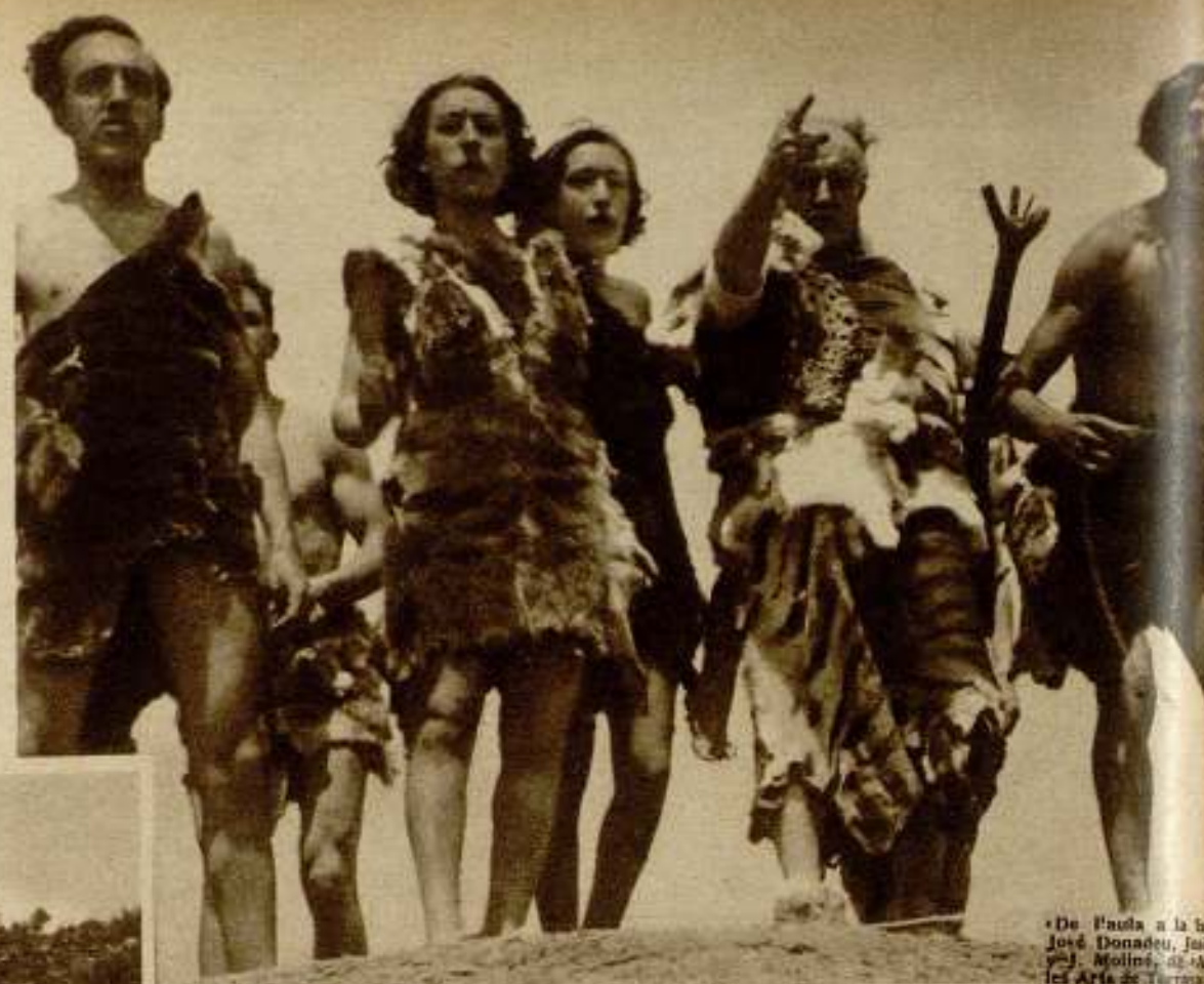
«De Paula a la faula», de José Donadeu, Girona y J. Moliné, de las Artes de Tarrasa, ganador del premio de interpretación.