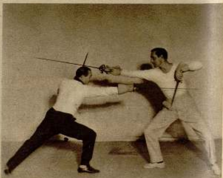
Ejercina con espada y daga. Basil Rathbone practicando con el maestro de esgrima Fred Cavers para las escenas del duelo de una próxima producción de la MetroGoldwyn-Mayer.