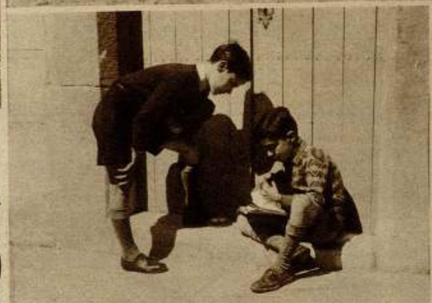
«Última jornada», film de Jacinto Aman, de A. C. A.