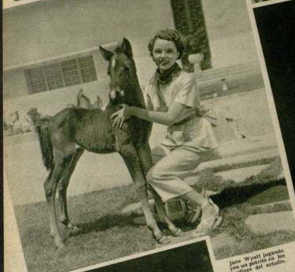
Jane Wyatt jugando con un potro en los jardines del estudio.