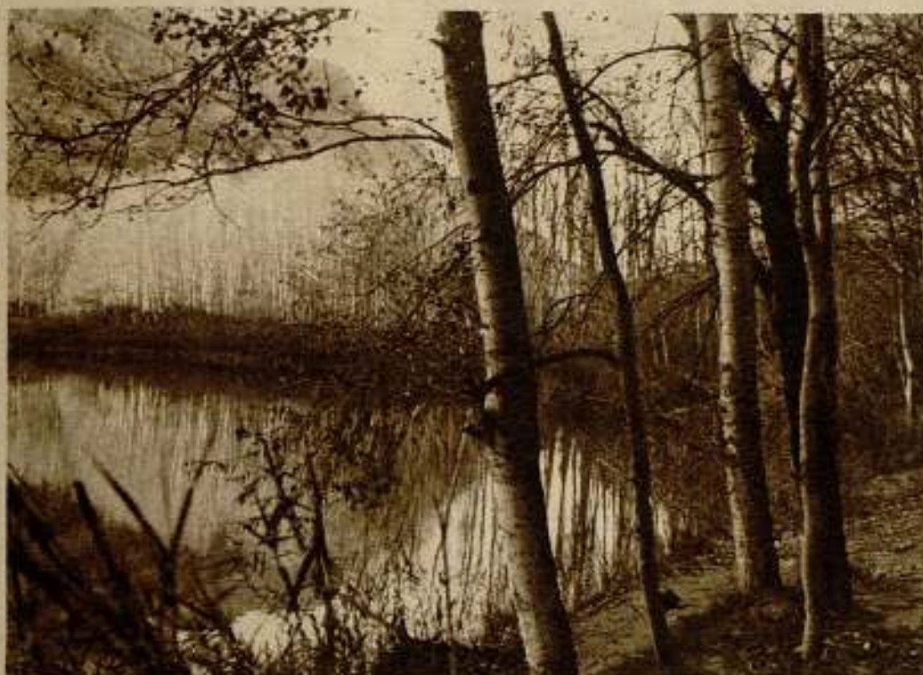
Del film «Baix Llobregat», de Amadeo Real.

cho» que la mayoría del público pueda encontrar, creemos que los concursos en competencia y con una organización perfecta estimulan y son convenientes al «amateur». El film «amateur», de concepto y de filmación, debe enfrentarse con el público, con su «público». Siempre la obra de arte debe