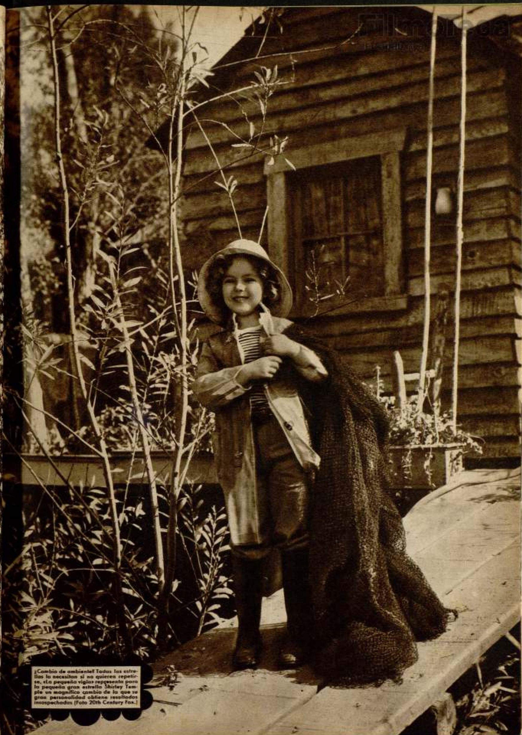
¡Cambio de ambiente! Todas las estrellas lo necesitan si no quieren repetirse, esta pequeña vigia representa para la pequeña gran estrella Shirley Temple un magnífico cambio de la que su gran personalidad obtiene resultados insospechados