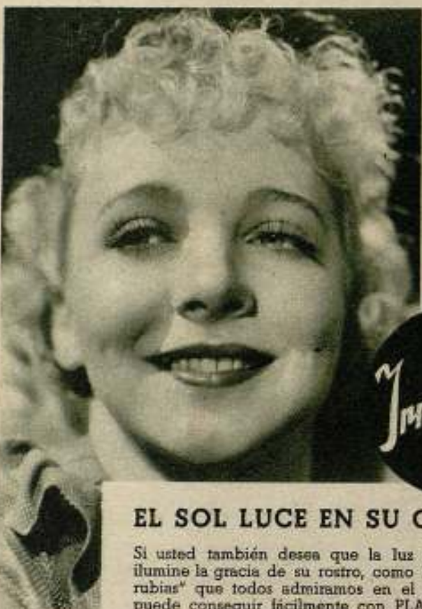
VIRGINIA BRUCE Presentadora de la gran producción Metro Goldwyn Mayer EL GRAN ZIRÓFELD