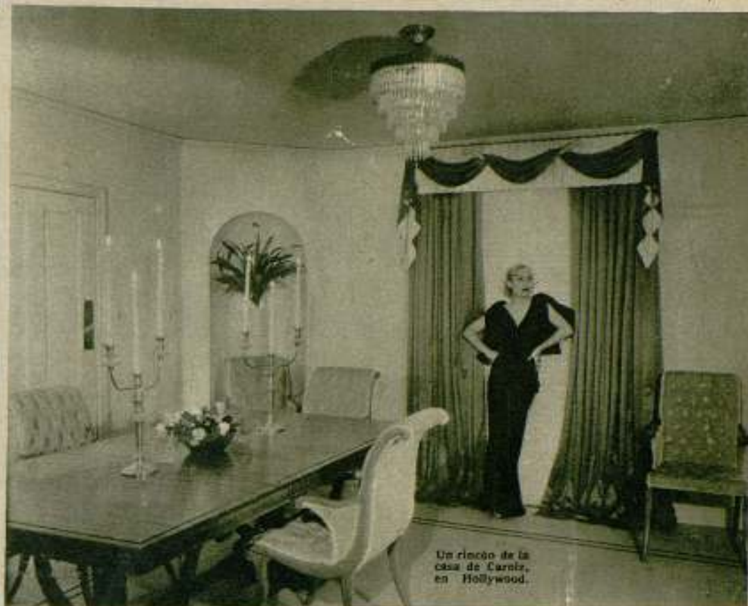
Un rincón de la casa de Carole, en Hollywood.

¿Recuerdan ustedes aquella película «Casada por amor?...» El primer actor era Clark Gable... He aquí una muestra de las apasionadas escenas de que estaba cuajada aquella producción.