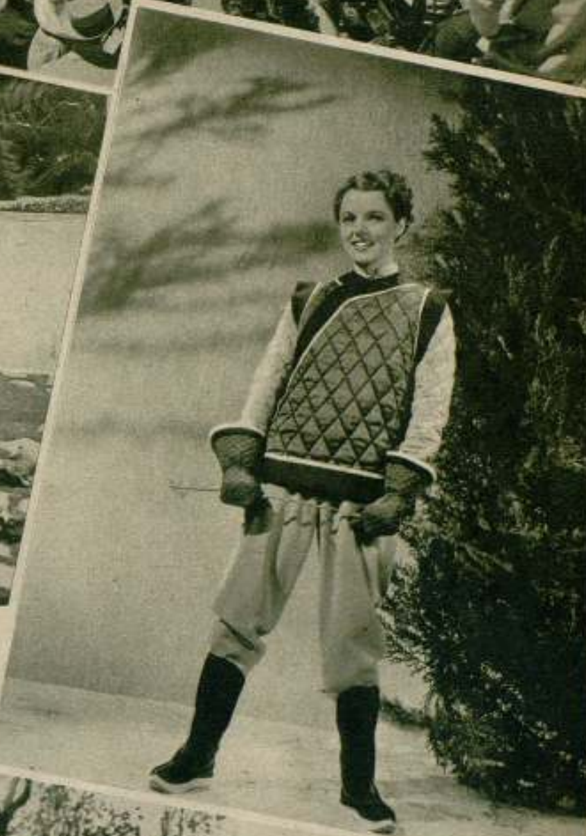
Jane Wyatt acolchada para defenderse del frío.