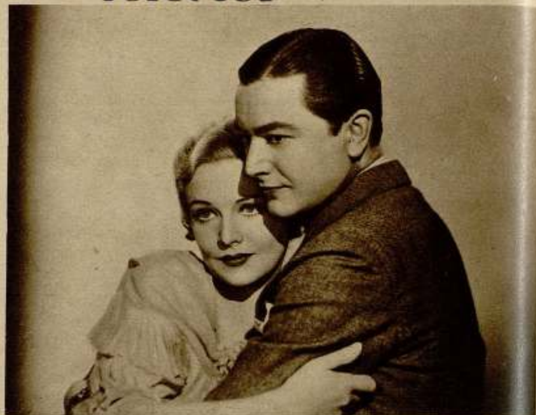
Madeleine Carroll y Robert Young en un momento de la película «El agente secreto», que se ha rodado en los estudios de la Gaumont-British, Londres.