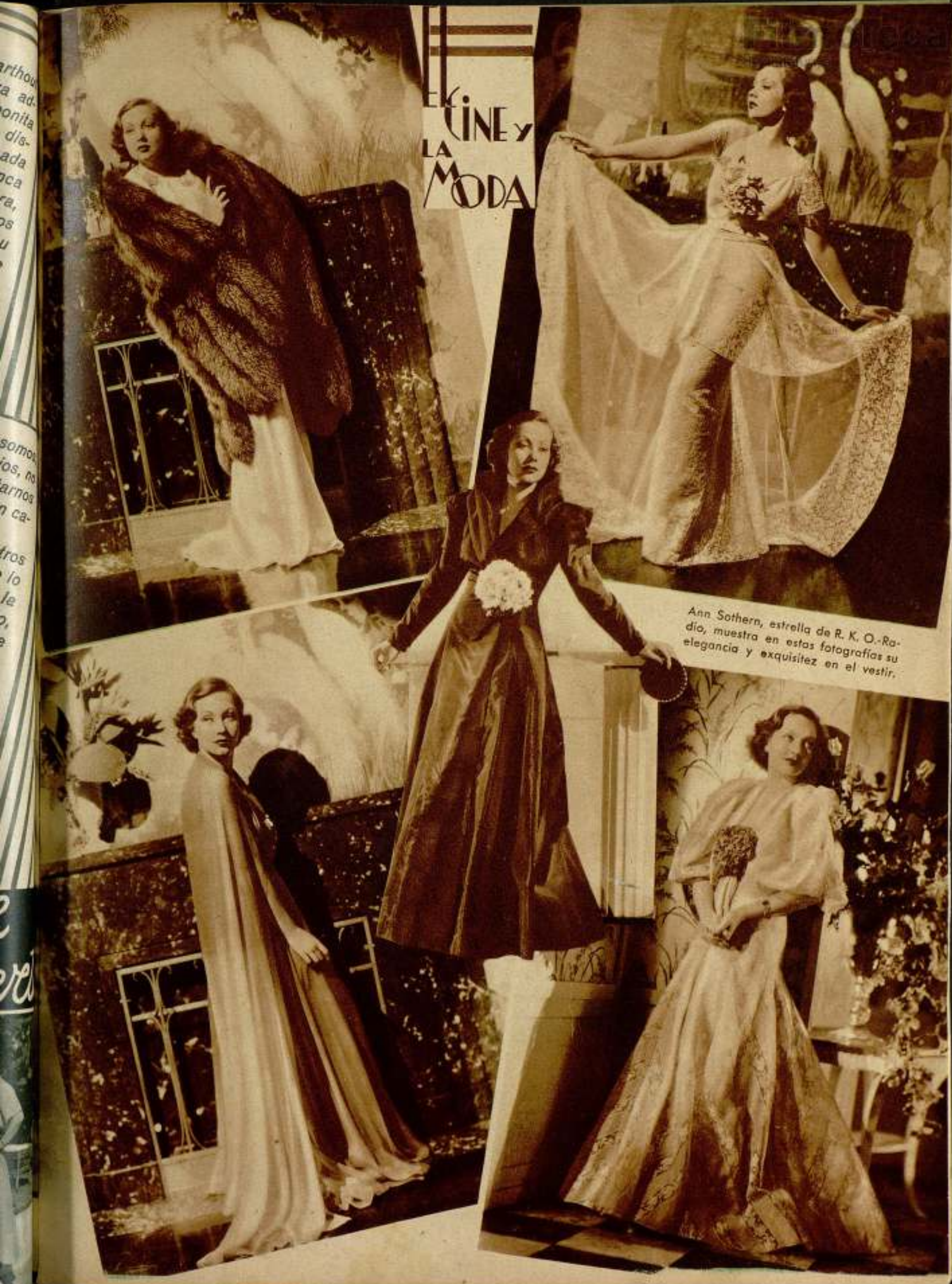
Ann Sothorn, estrella de R. K. O.-Radio, muestra en estas fotografías su elegancia y exquisitez en el vestir.