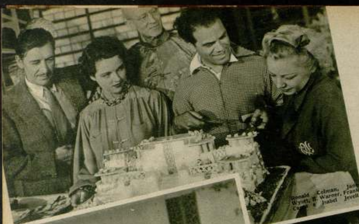
Ronald Colman, Jane Wyatt, H. Warner, Isabel Jewell