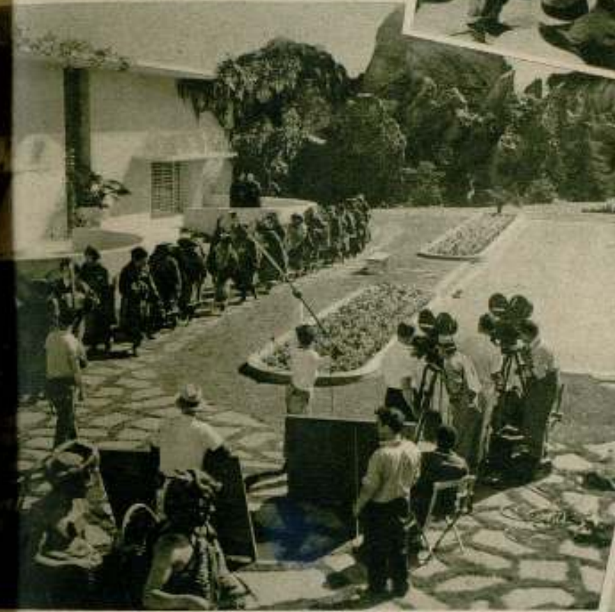
Rodando escenas de «Horizontes perdidos».

Charles Boyer nos contó que en la primera semana de filmación de «El jardín de Alá» se capturaron, vivas, más de sesenta serpientes venenosas y más de doscientos escorpiones, también vivos y cogiendo. ¡Pueden imaginarse los sustos y las bromas! Todo ello con una temperatura interna y teniendo que vivir durante varias semanas en pleno desierto. Dos