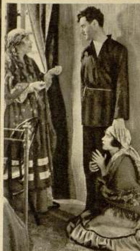
John Gilbert y Renée Adorée en «Redención».