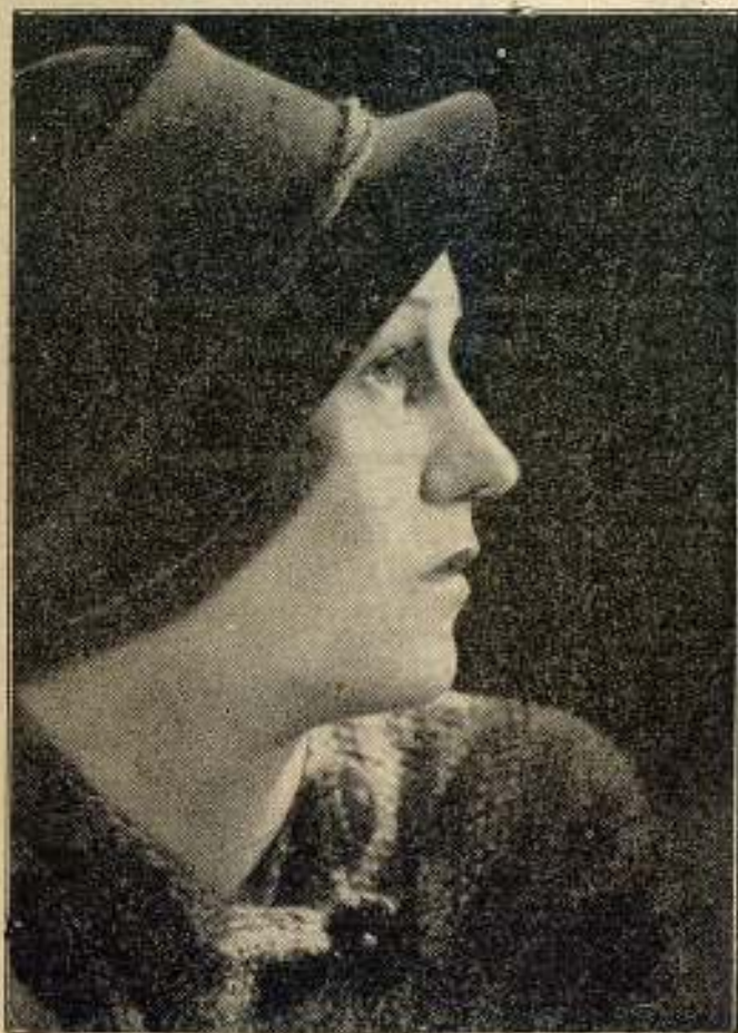
Käthe Gold, artista de la Ufa.

Recortes de periódicos europeos traen la nueva que en un puente recientemente acabado de construir en Rotterdam (Holanda) una estatua de grandes dimensiones de Charlie Chaplin adorna el parapeto. El comediante ha sido el genio inspirador de innumerables series de caricaturas publicadas en periódicos.