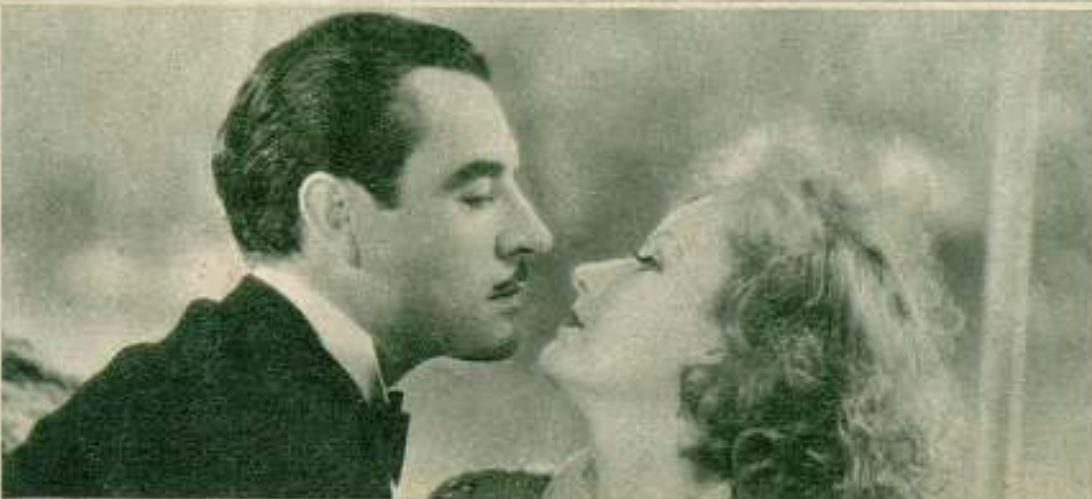
John Gilbert y Greta Garbo en «La mujer ligera».

Fracasado en sus tentativas como direc- tor, reapareció en la pantalla con «El con- de de Montecristo». Su labor en este film atrajo la atención de Irving Thalberg y fué contratado por la Metro-Goldwyn-Mayer, bajo cuyo distintivo consiguió los ma- yores éxitos de su carrera artística. Con el advenimiento del cine sonoro su fama se oscureció hasta el extremo de que la citada empresa le propuso rescindir su