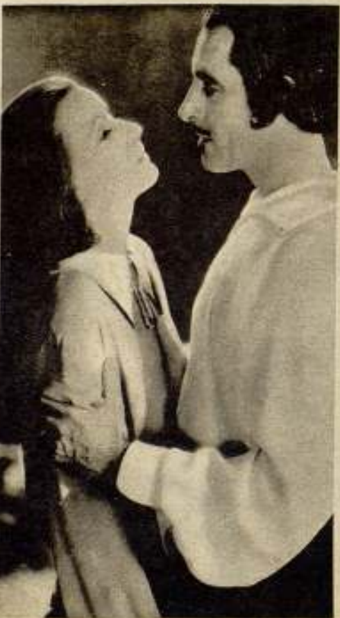
Con Greta Garbo en «La reina Cristina de Suecia».