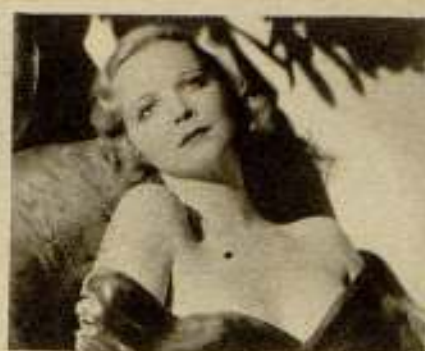
Virginia Bruce, que compartió últimamente el tálamo nupcial con John Gilbert.