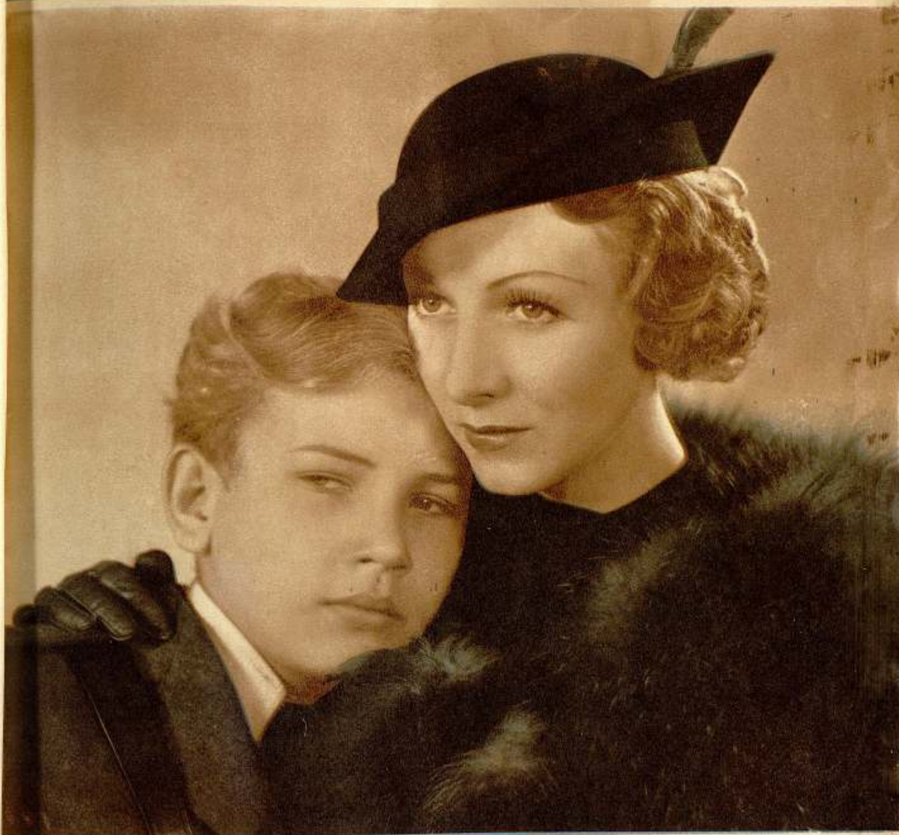
Karen Morley y Frankie Thomas, principales intérpretes de la emotiva película Radio «LOS HIJOS DEL DIVORCIO» o «El nido deshecho».