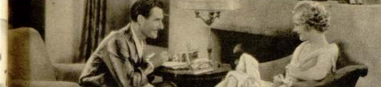
John Gilbert y Lois Moran en «Lejos de Broadway».

sados. Lo que supuso era que habrían tenido algún disgusto. Greta y John, como en efecto así sucedió, porque se susurraba que Greta andaba estrechamente ligada a otro artista y John no veía con buenos ojos tal intimidad. El caso fue que, sin nadie esperarlo y casi de repente, John Gilbert e Ina Claire, acompañados por varios amigos, se fueron a Las Vegas (Nevada), donde el día 9 de mayo de 1929 contrajeron matrimonio en medio de la mayor sencillez.