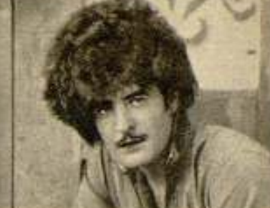
John Gilbert en «Los cosacos».

¿Quería realmente John a su tercera mujer? ¿Se había unido con ella en matrimonio por despecho a Greta?