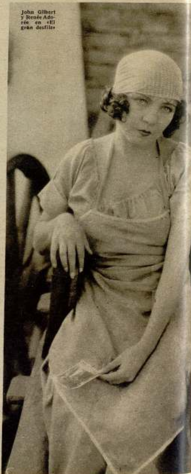
John Gilbert y Renée Adorée en «El gran desfile».