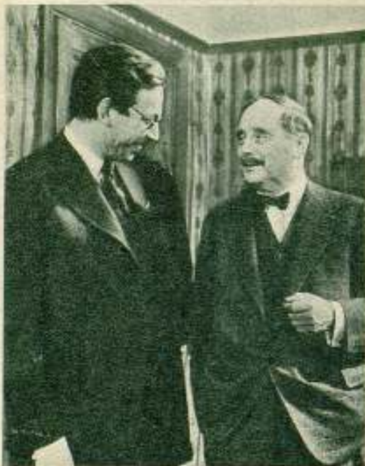
Alexander Korda, jefe de producción de London Films, y H. G. Wells, el célebre novelista, haciendo sobre la producción "100 years to come" (Dentro de cien años), obra original de Wells, que distribuirá United Artists.