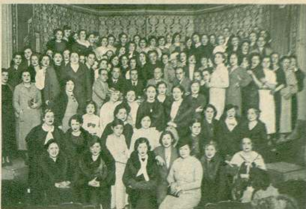
Un grupo de concursantes femeninas del certamen organizado por Artífices con la colaboración de Radio Barcelona rodeando al jurado seleccionador compuesto de prestigiosas críticas barcelonesas.

Robison estaba contratado por la U. F. A. desde hace muchos años. Su último trabajo, terminado unos días atrás, es la versión hablada de "El estudiante de Praga".