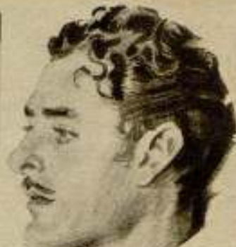
John Gilbert visto por James Montgomery Flagg, eminente ilustrador norteamericano.