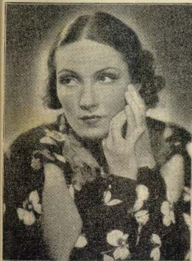
Brigitte Horney, artista de la Ufa.

Pocas semanas después el destino quiso que Gloria Stuart recibiera otro contrato, y Olivia de Havilland desempeñó el papel de Hermia en la obra teatral. Más tarde repitió su éxito en el cinema.