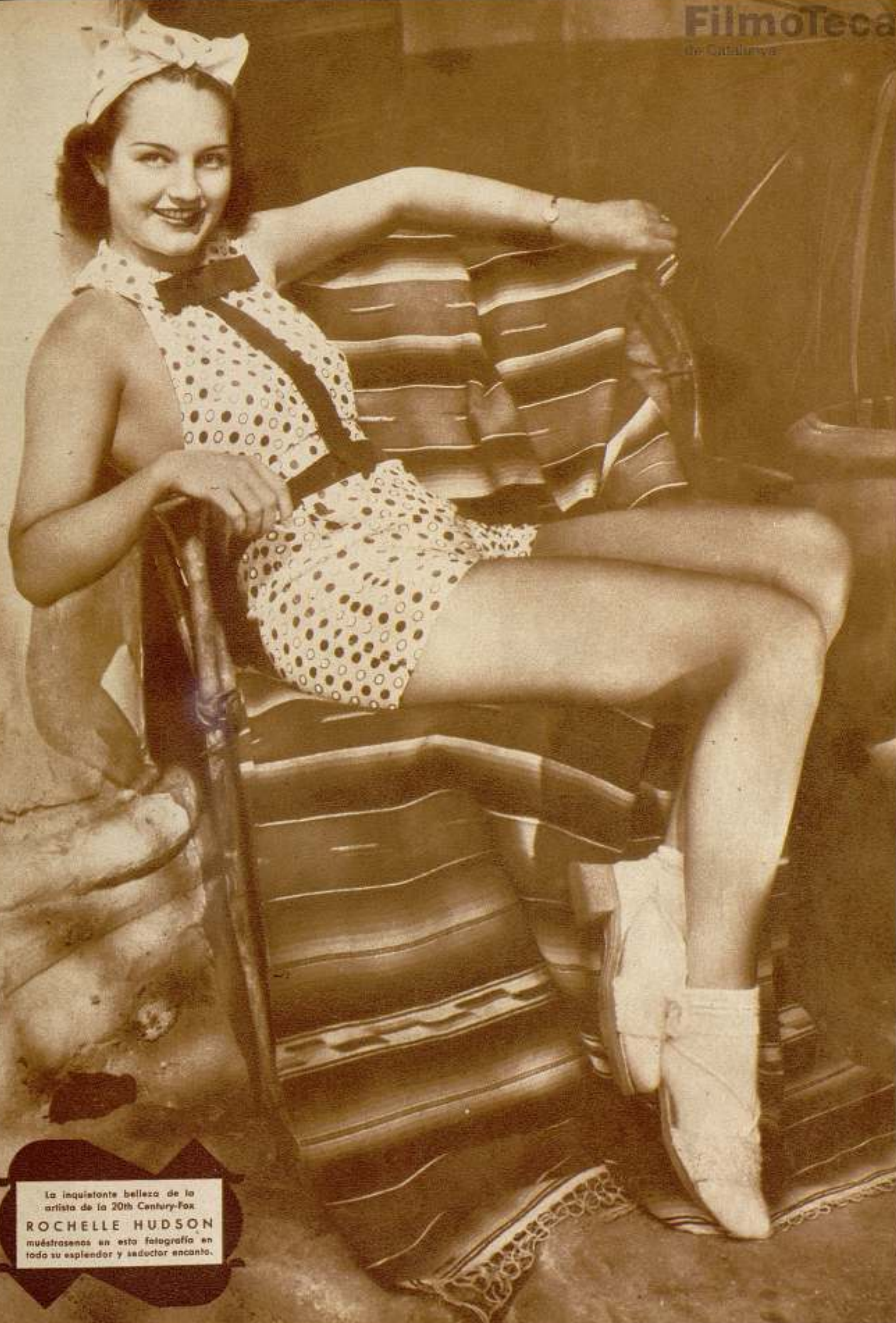
La inquietante belleza de la artista de la 20th Century-Fox ROCHELLE HUDSON muéstranos en esta fotografía en todo su esplendor y seductor encanto.