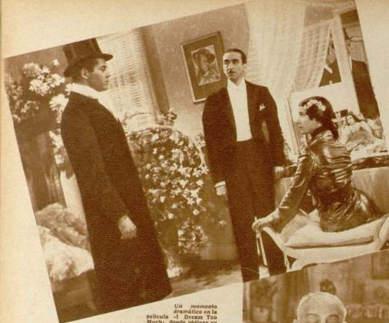
Un momento dramático en la película «I Dream Too Much», donde obtiene su primer éxito filmico la célebre cantante de ópera Lily Pons, acompañada por Henry Fonda, Osgood Perkins y otros artistas de verdadero mérito

Lástima grande que Caruso hubiese desaparecido antes de que el cine plasmara la exquisitez de su arte. Todo lo que tenemos de su grandiosa voz es el recuerdo y los discos fonográficos. La expresión dramática de su rostro, la maravilla de sus interpretaciones han desaparecido con él.