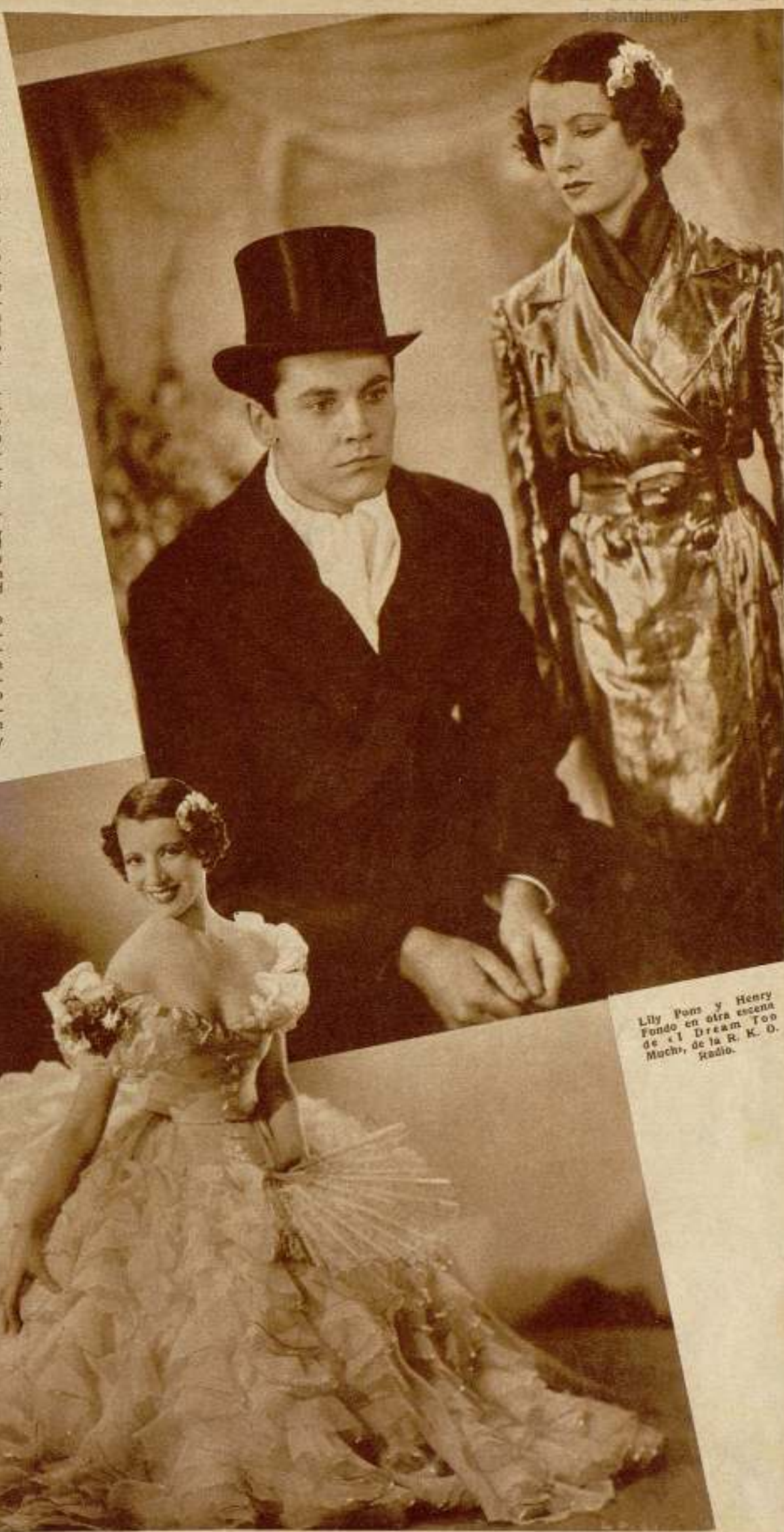
Lily Pons y Henry Fonda en otra escena de «I Dream Too Much», de la R. K. O. Radio.

Y ahora el más humilde cinema de pueblo puede ofrecer a sus espectadores las figuras gloriosas del Metropolitan u otros teatros importantes de las capitales. Gracias al cinematógrafo, el individuo cuyos medios no le permiten trasladarse a esos lugares puede escuchar a un Lawrence Tibbett, Martinelli, Jan Kiepura y Lily Pons.