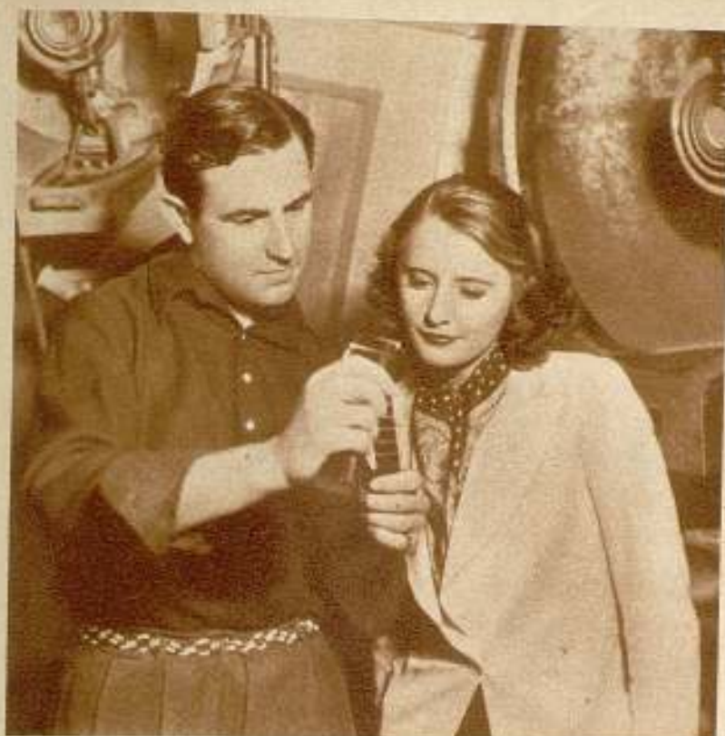
Sidney Lanfield y Bárbara Stanwyck, el director y la estrella de «Red Salute», examinan varios fotogramas de esta cinta Reliance.