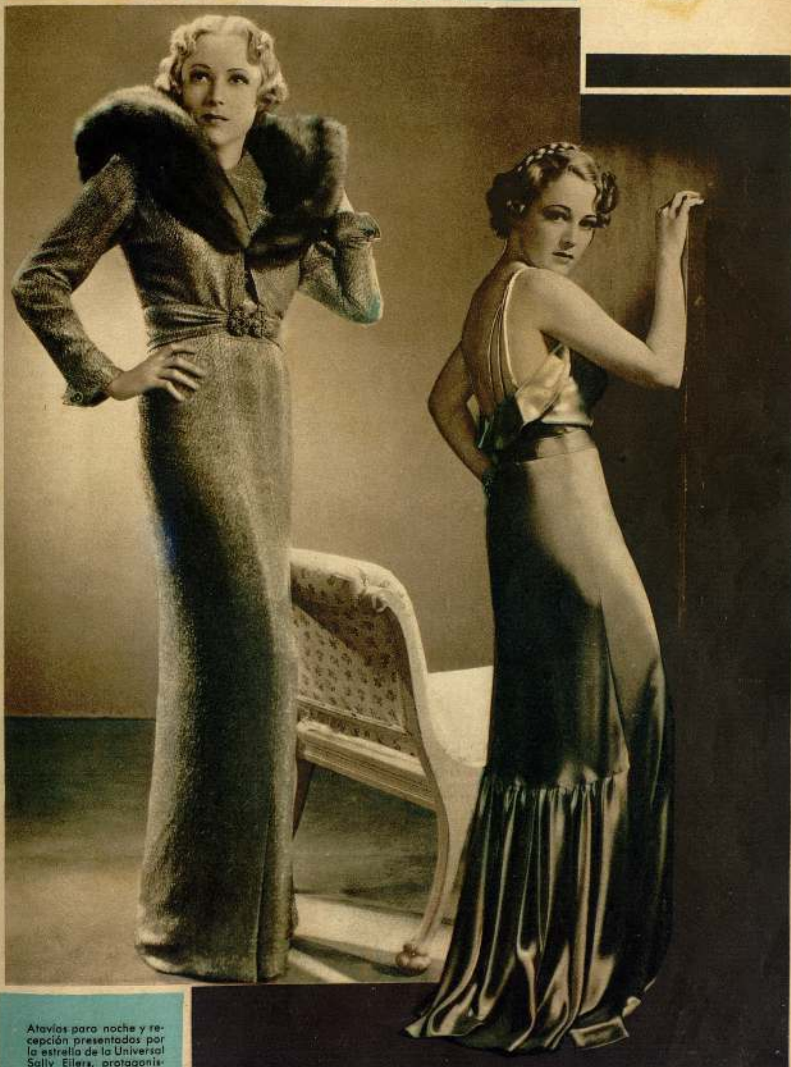
Atavíos para noche y recepción presentados por la estrella de la Universal Sally Eilers, protagonista de «Alias» Mary Dow.