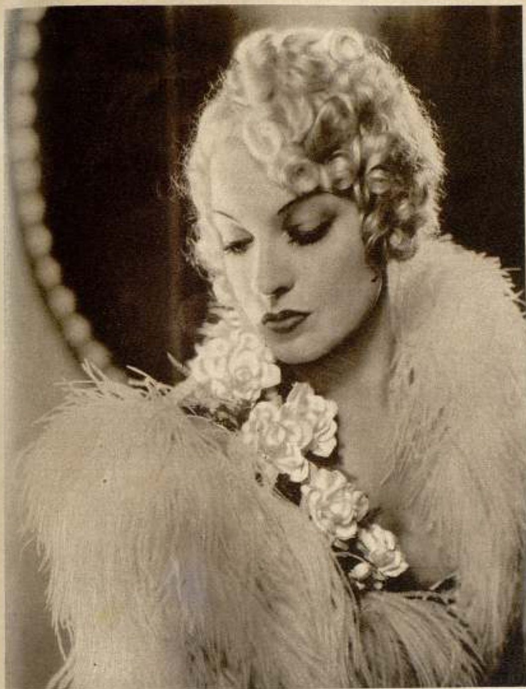
Lili Damita en «Los millones de Brewster».

⊙ Durante su reciente visita a Hollywood, el notable explorador Peter Freuchen se hospedó en casa de Carl Brisson. Freuchen llamó la atención con su imponente barba negra.