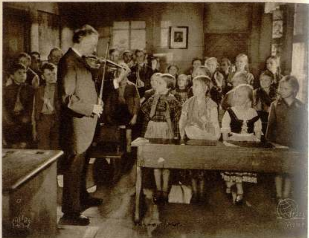
Escena del film Terra, dirigido por Frank Wysbar. «Führmann Maria».

Dentro del grupo de producción Bruno Duday se comenzará en breve el rodaje del nuevo film de la Ufa «La cautiva del Emperador», bajo la dirección de Detlef Sierck. Los autores del manuscrito son Barbara Roesch y W. Brandes.