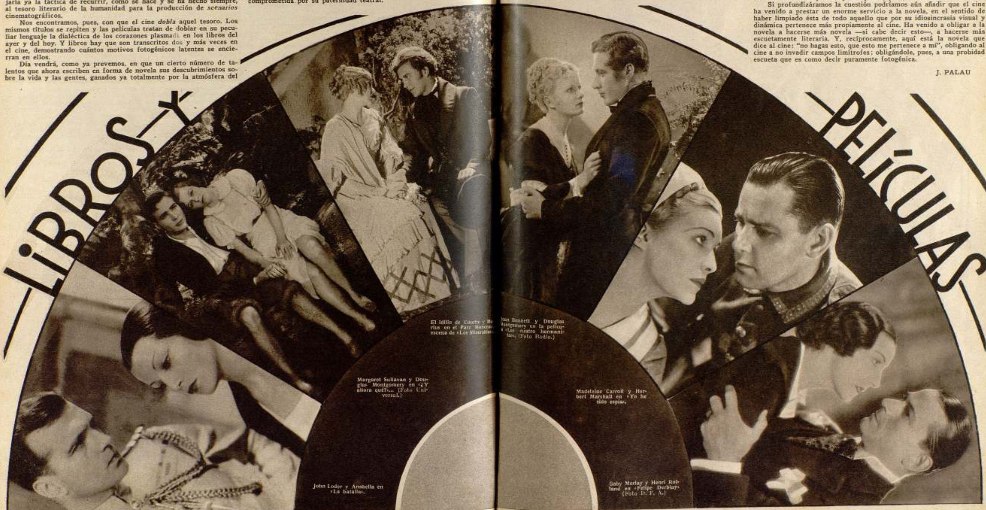
El idilio de Cosette y Marius en el Parc Montsouris, escena de «Los Miserables».