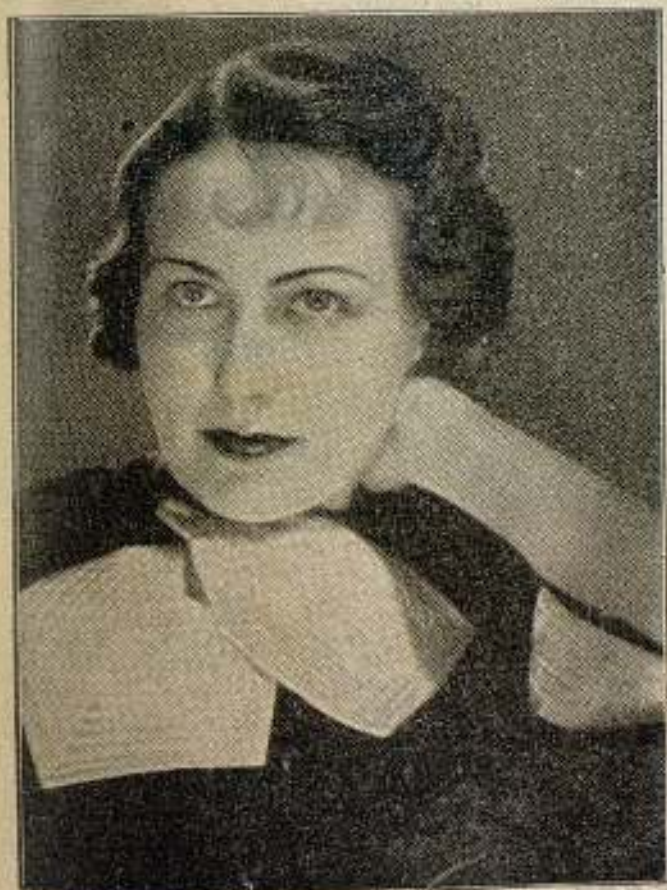
Carola Höhn, artista de la Ufa.

Expresándolo en una forma concreta. —con-