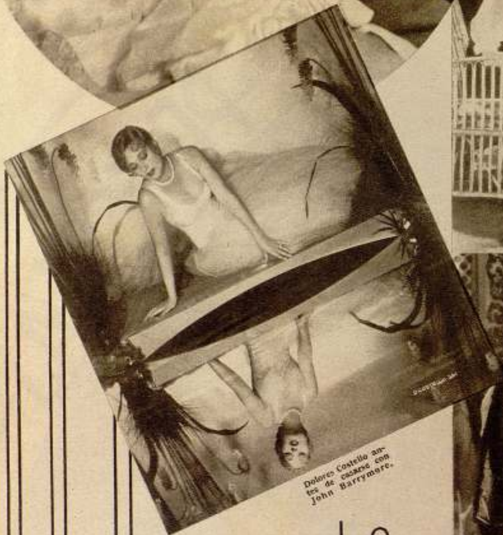
Dolores Costello antes de casarse con John Barrymore.