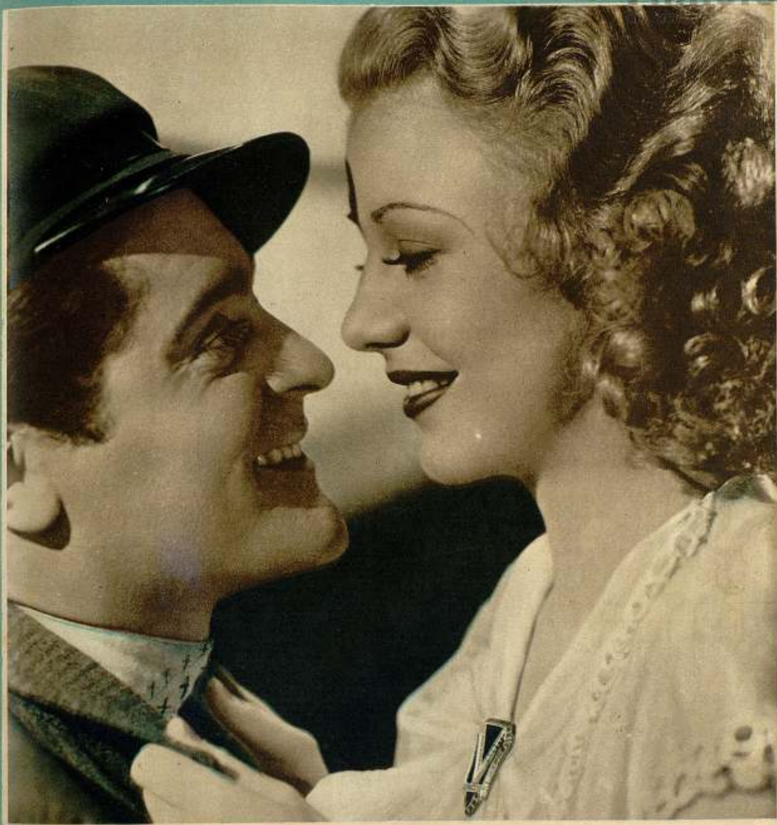
Ginger Rogers y Francis Lederer en el film RADIO «El embrujo del Manhattan».