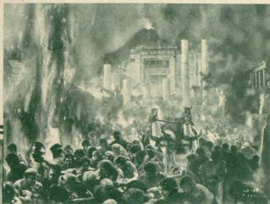
Una escena de gran valor espectacular en el film de la R. K. O. «Radio-Pumpkin»