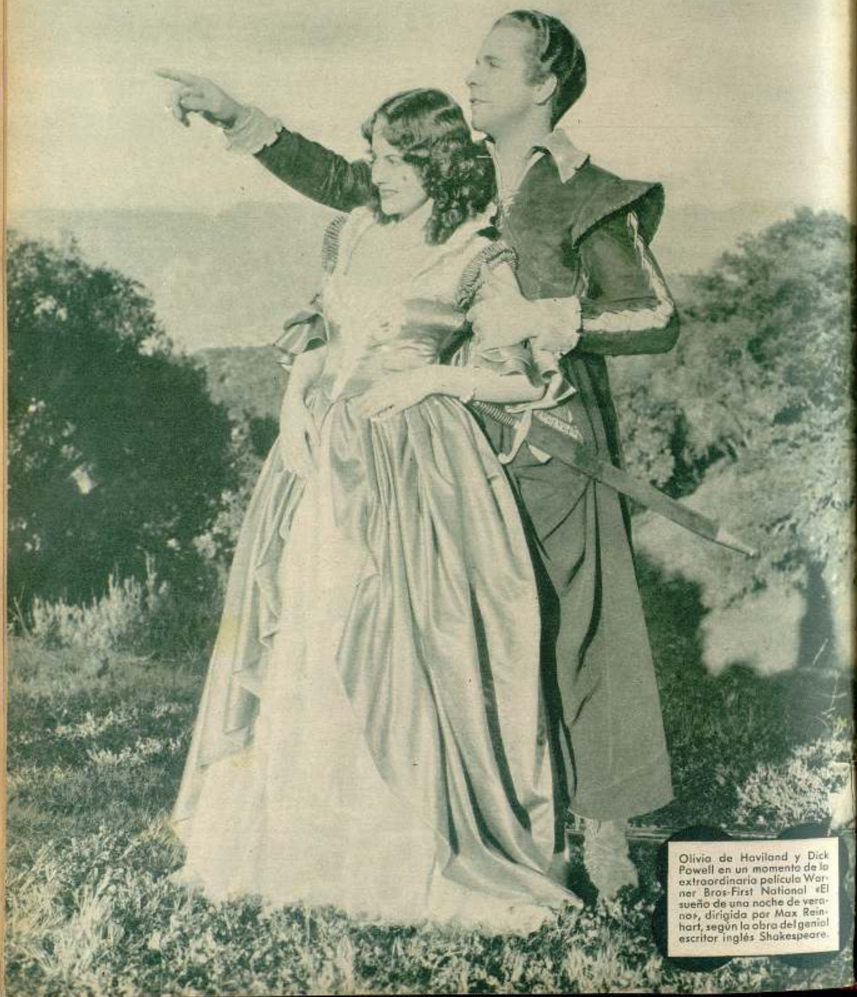
Olivia de Havilland y Dick Powell en un momento de la extraordinaria película Warner Bros-First National «El sueño de una noche de verano», dirigida por Max Reinhardt, según la obra del genial escritor inglés Shakespeare.