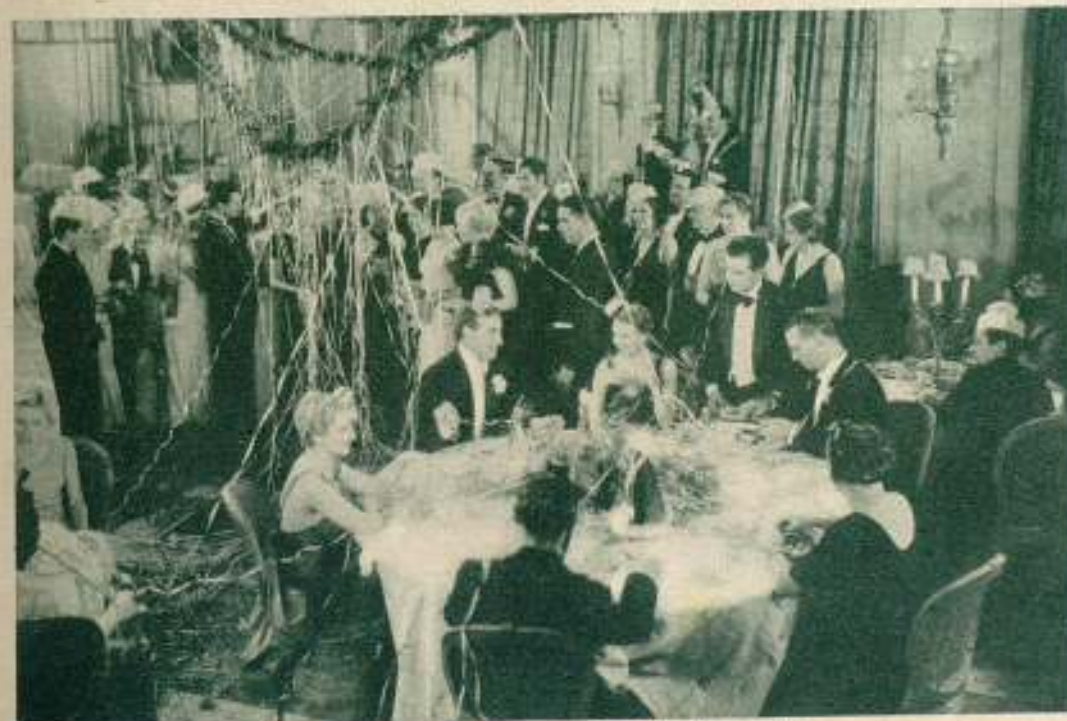
Visión de la película nacional "La bien pagada".