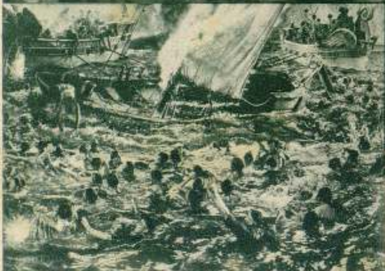
Espectacular y dramática, la sombría huida de «Pompeya», bajo el azote de la destrucción, deja en suspenso al espectador...

Schoedsack, el director de la misma, merece nuestra especial mención. Ernest Schoedsack tiene toda la experiencia y prestancia de un actor consumado, capaz de apreciar la emoción que debe impartirse a una escena para hacerla realista y hermosamente artística. Hombre culto y estudiante empedernido de temas históricos, no es de extrañar que estudiara con profundo interés los detalles históricos de la época que ha llevado a la pantalla, para hacernos sentir, en un par de horas, el milagro de haber vivido en los frívolos días a que se remonta el argumento de la historia.