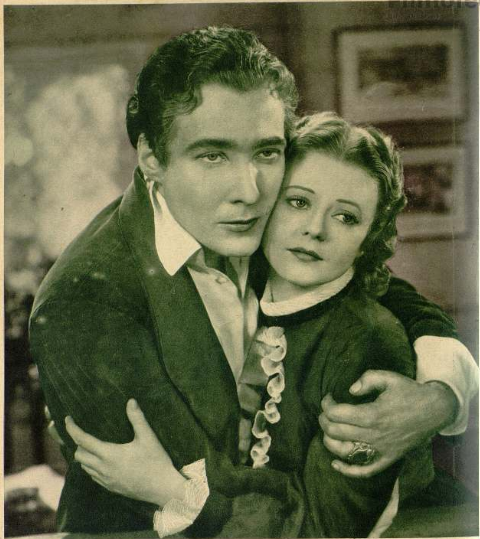
HEATHER ANGEL y DOUGLAS MONTGOMERY en «El misterio de Edwin Drood», film de la Universal.