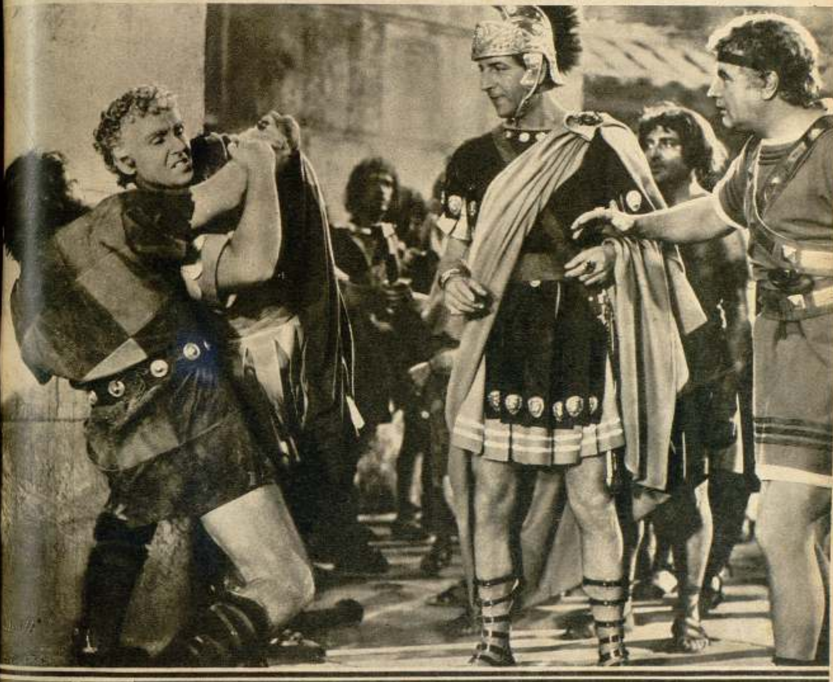
Preston Foster, como gladiador romano, es el tipo romántico que despierta la curiosidad femenina en «Pompeya» y que logra romper la monotonía de una carrera artística casi oscura y anódina.

Es cierto que en «Pompeya» la pluma del adaptador ha tomado