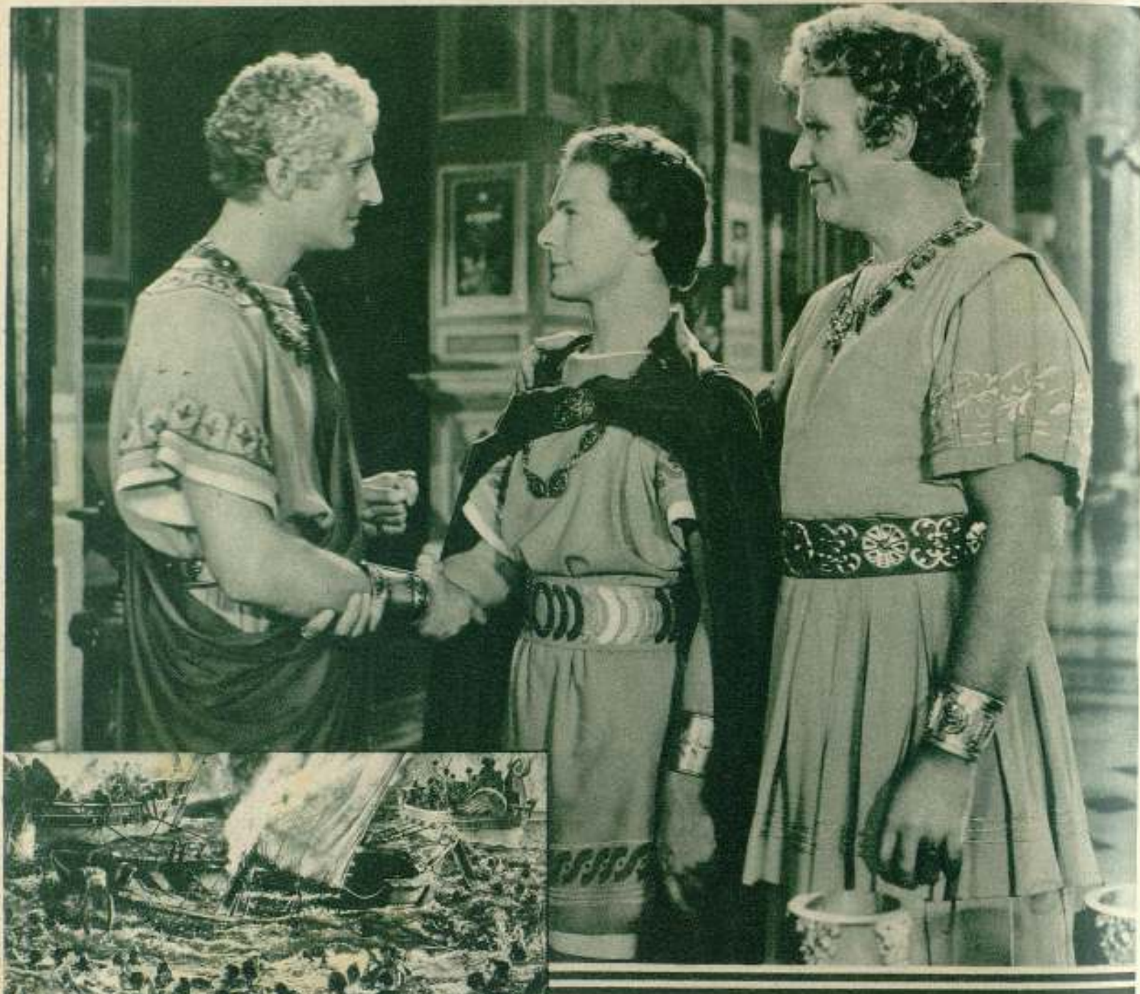
Preston Foster (Marcus), John Wood (Flavius) y Basil Rathbone (Pontius Pilatus), en una escena del bello film «Pompeya» llevado a la pantalla por R. K. O. Radio.

¿Qué papel puede engendrar Victor Mac Lagien que supere a su «delator»? ¿Ha vuelto, acaso, Richard Dix a tener la oportunidad que tuvo cuando interpretó «Cimarrón»? ¿Qué otro papel prestará a Paul Muni las ventajas dramáticas de «Yo soy un fugitivo»? ¿Cuándo volveremos a ver a Elisabeth Bergner en algo tan magnífico y de acuerdo con su talento histriónico que en «Catalina de Rusia»? Y