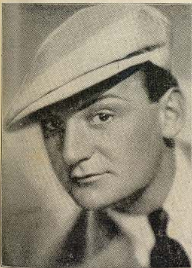
Willi Forst, artista de la Ufa.

Jenny Jugo es Eliza, la florista, llamada a ocupar un rango social e intelectual superior, y Gustavo Gründgens, el etimologista que muestra sus grandes y brillantes aptitudes.