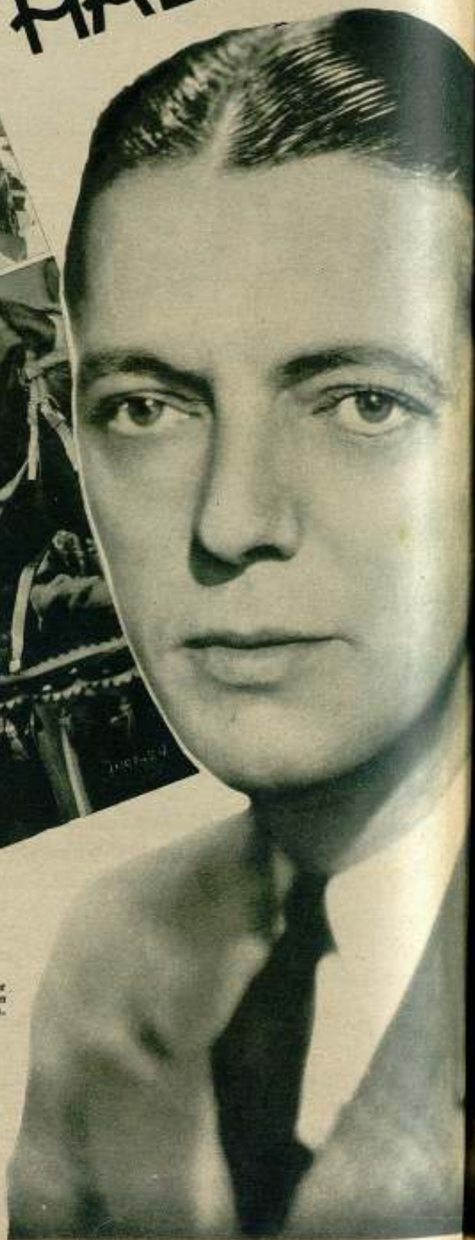
«Pecadores sin careta.»