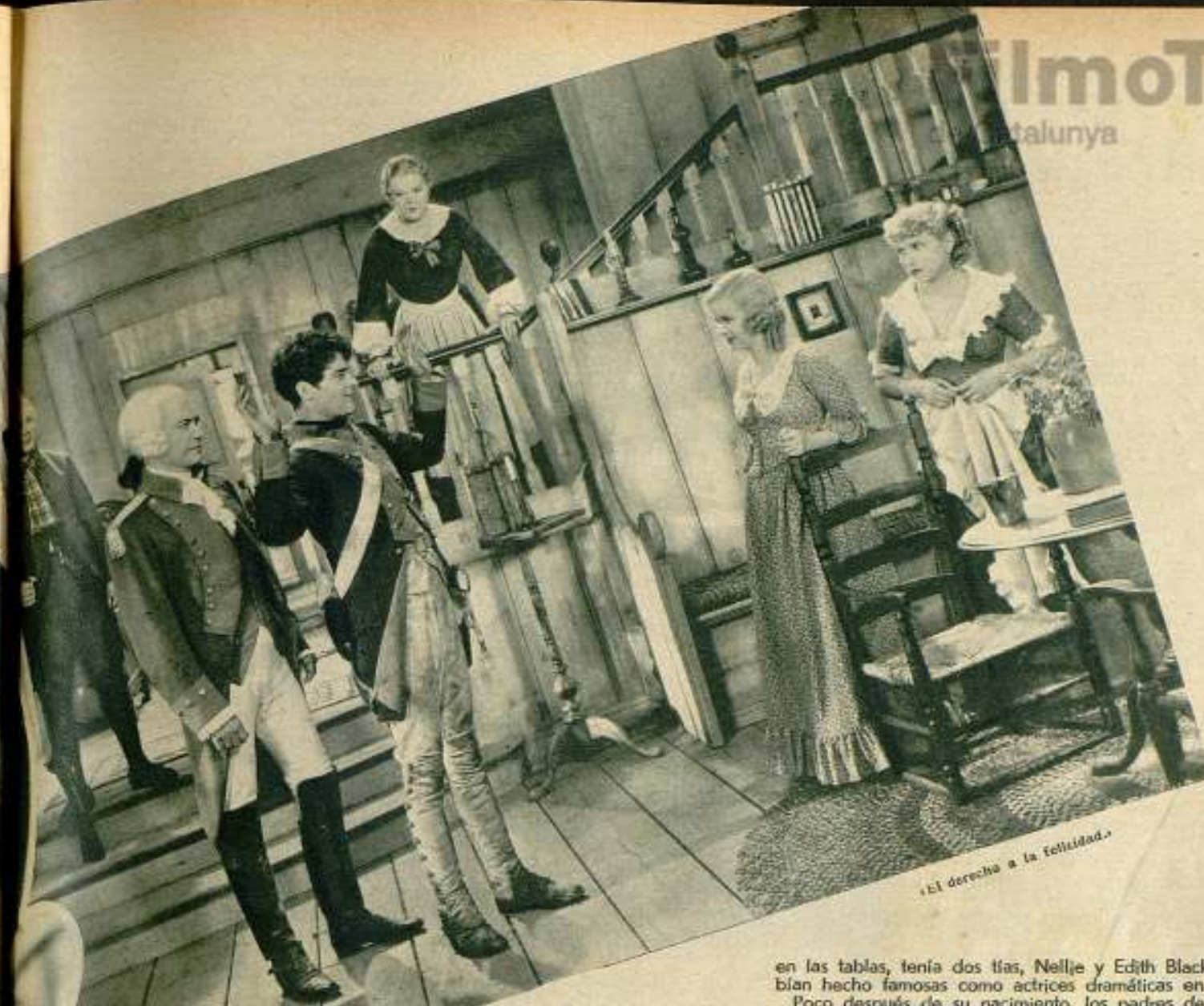
«El derecho a la felicidad.»