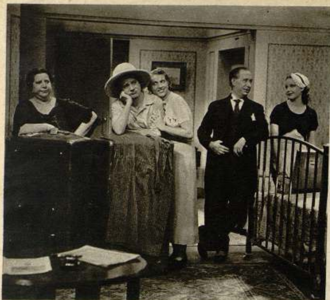
Una escena de la divertida película de Ibérica Films «Aventura oriental».

al igual que sus admirables novelas, han merecido y merecen el honor de recorrer diversos países del mundo. No obstante, usted, en un momento de ofuscación disculpable, ha negado todo. Y esto es injusto, tan injusto como si sus libros fueran juzgados a través de la impresión recibida por la lectura de un libelo cualquiera.