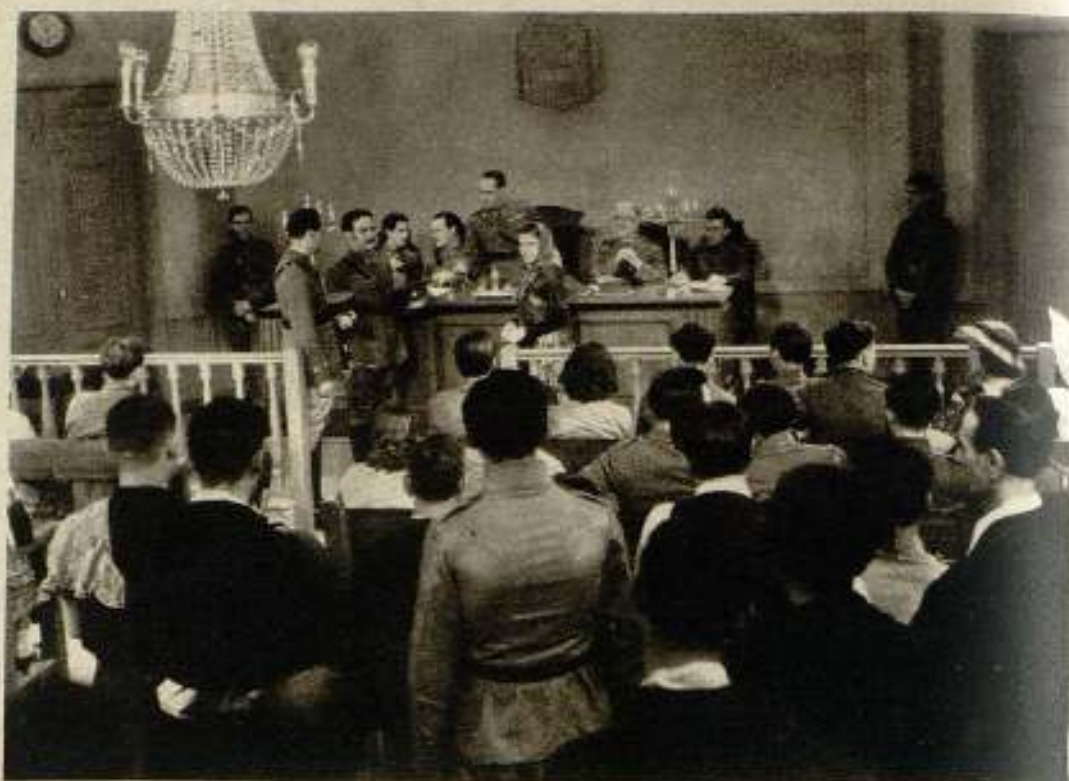
Entretenida escena de la película de Lapeyre Films "Amor en maniobras" distribuida, menos en la región norte, por Atlantic Films.