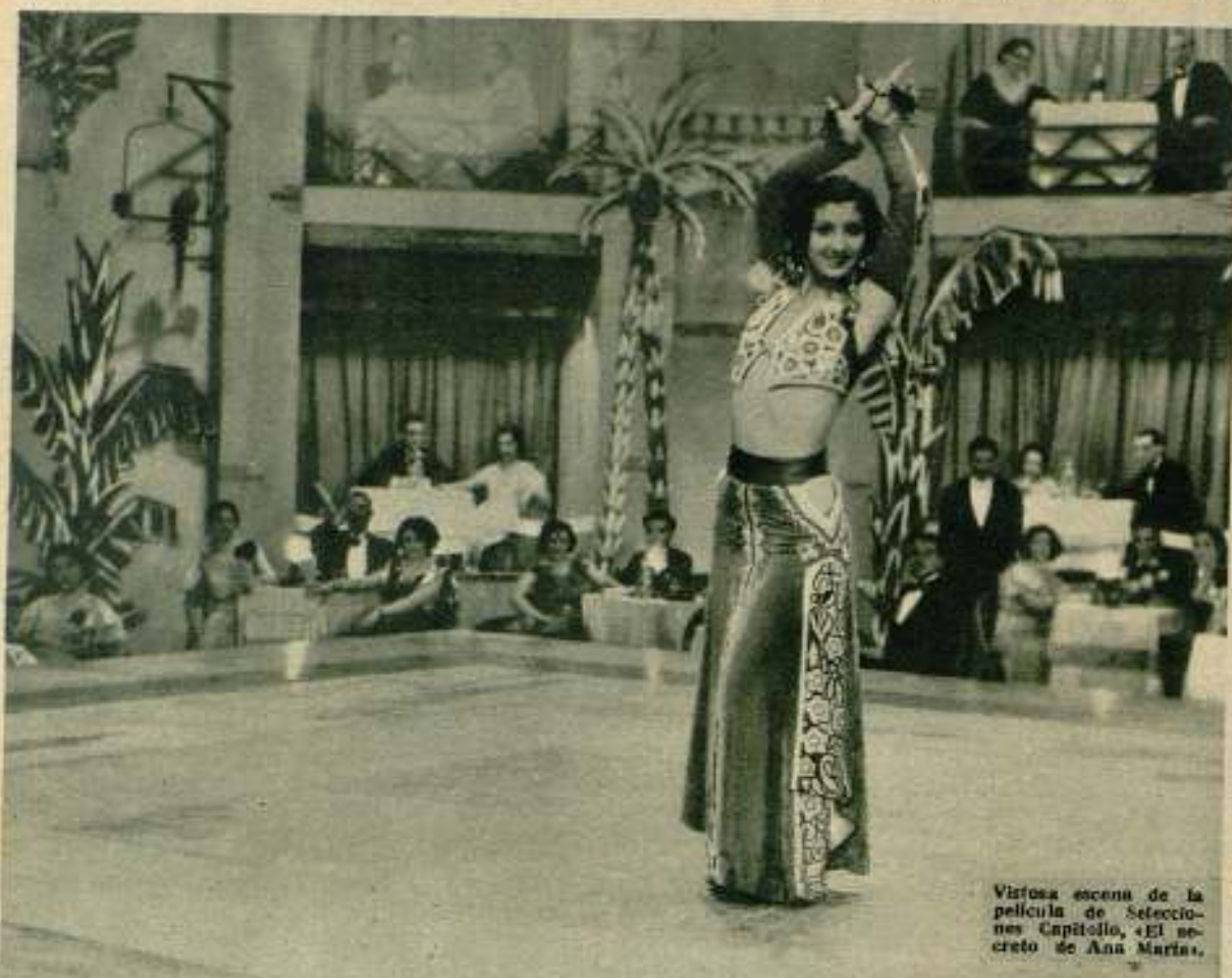
Vistosa escena de la película de Selecciones Capitolio, «El secreto de Ana María».

co. Y era entonces cuando usted debió exteriorizar su disgusto, negándose incluso a que la película fuera exhibida con su nombre.