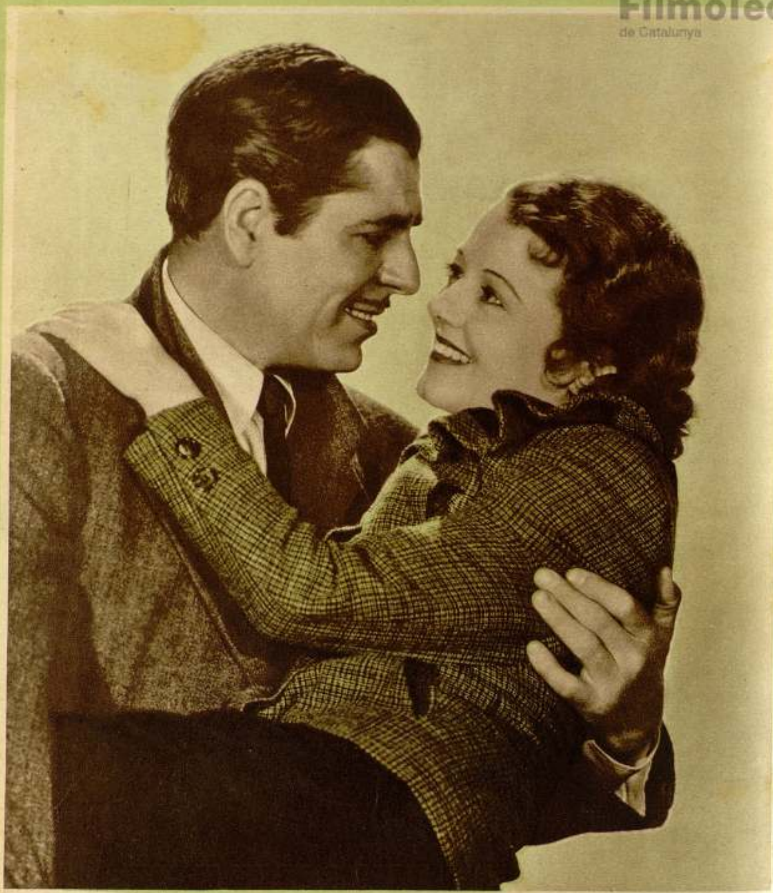
JANET GAYNOR y WARNER BAXTER en «Otra primavera», película Fox.