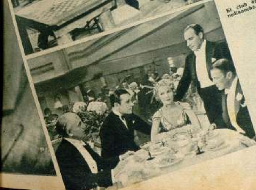
«El club de medianoche.»