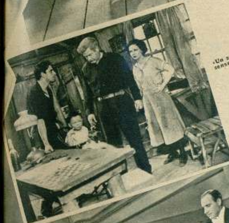
«Un secuestro sensacional.»