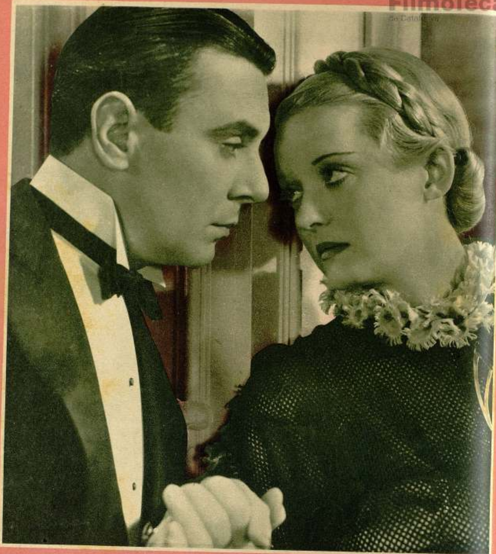
George Brent y Bette Davis en «Una mujer de su casa», pelícu- la Warner Bros-First National.