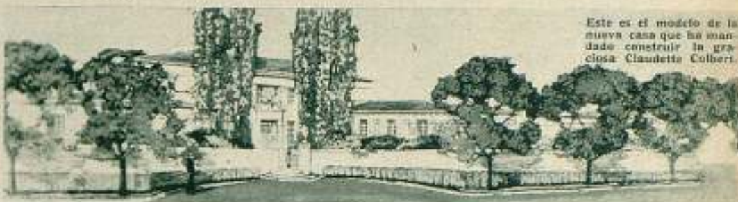
Este es el modelo de la nueva casa que ha mandado construir la graciosa Claudette Colbert.