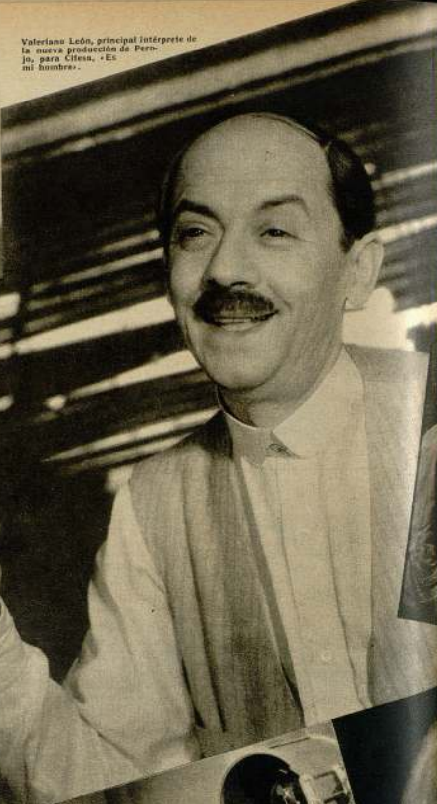
El genial artista de «Es mi hombre» se retrata para sus admiradoras de allende las fronteras. Ha elegido esta indumentaria para que se vea que en España también hay artistas de abrigo.