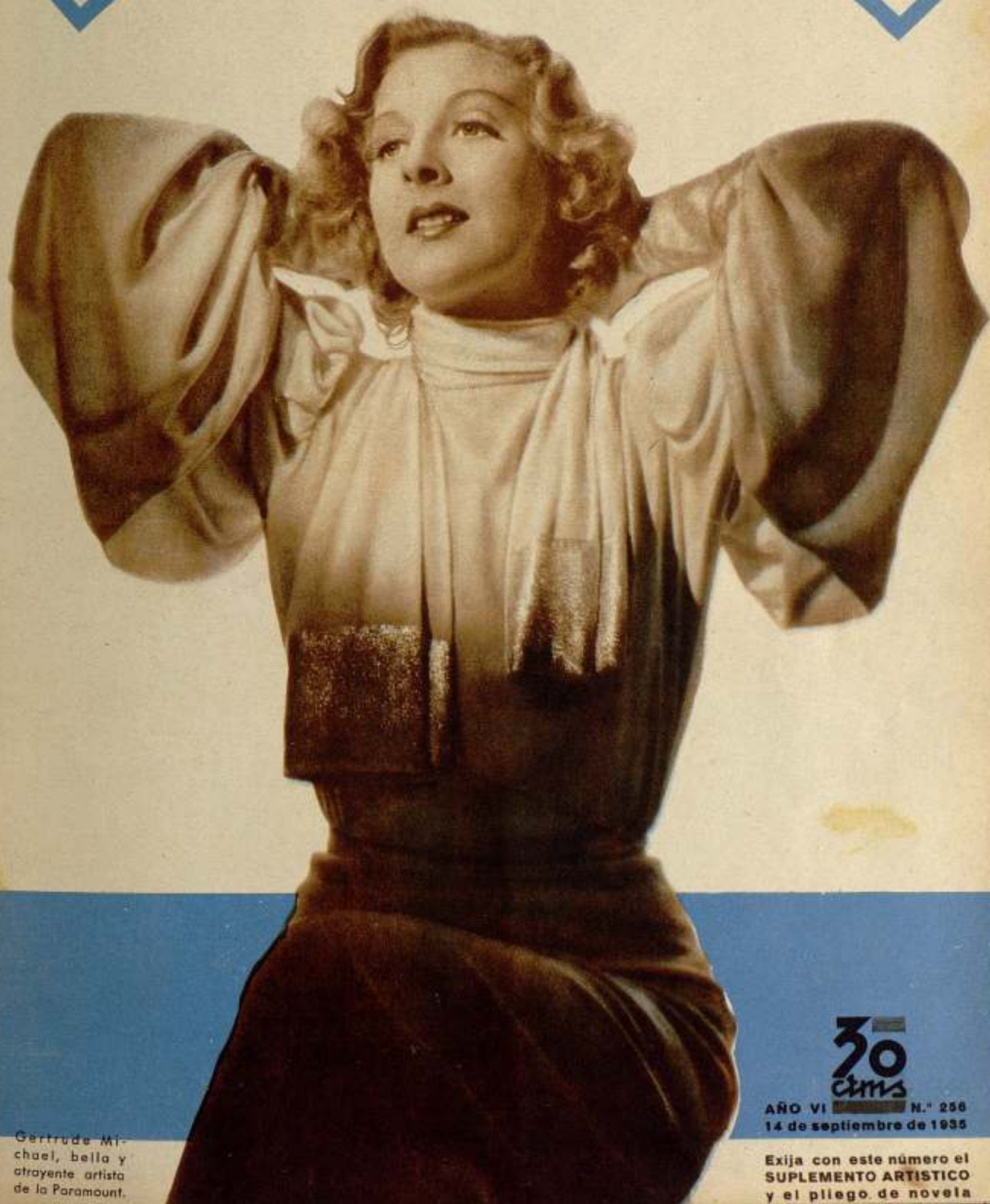
Gertrude Michael, bella y atrayente artista de la Paramount.