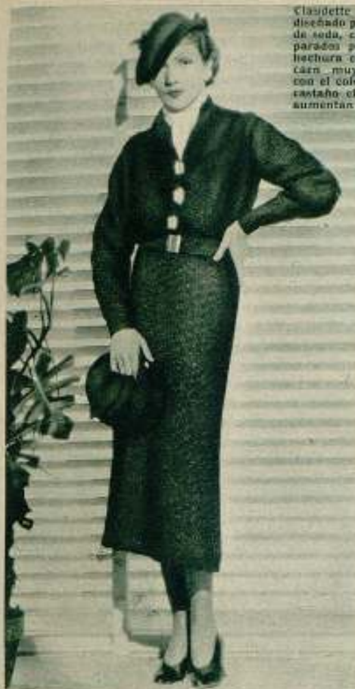
Claudette Colbert luciendo un traje diseñado por ella misma. La tela es de seda, color gordo, con vivos separados por hilos de oro. Tanto la hechura como el color del traje le caen muy bien, pues armonizan con el color de sus ojos y de su pelo castaño claro. Las barritas doradas aumentan la belleza del vestido.