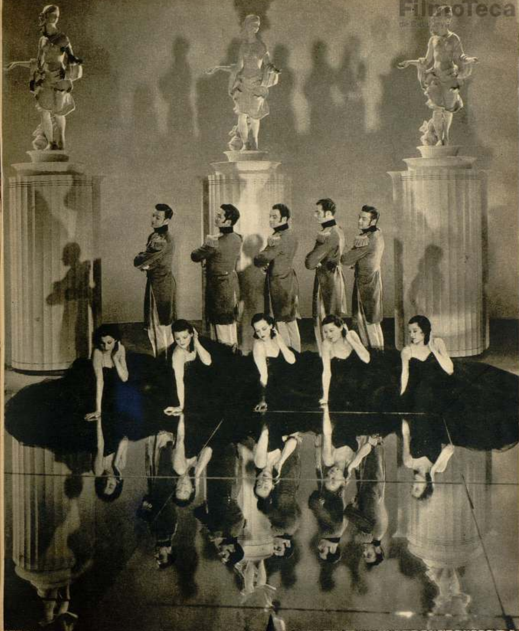
Espectacular escena del film Paramount «Recordemos aquellas horas».