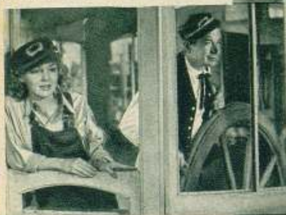
Will Rogers y Ann Shirley en el film de la Fox «Steamboat Round the Bend», que no ha sido aún presentada al público.