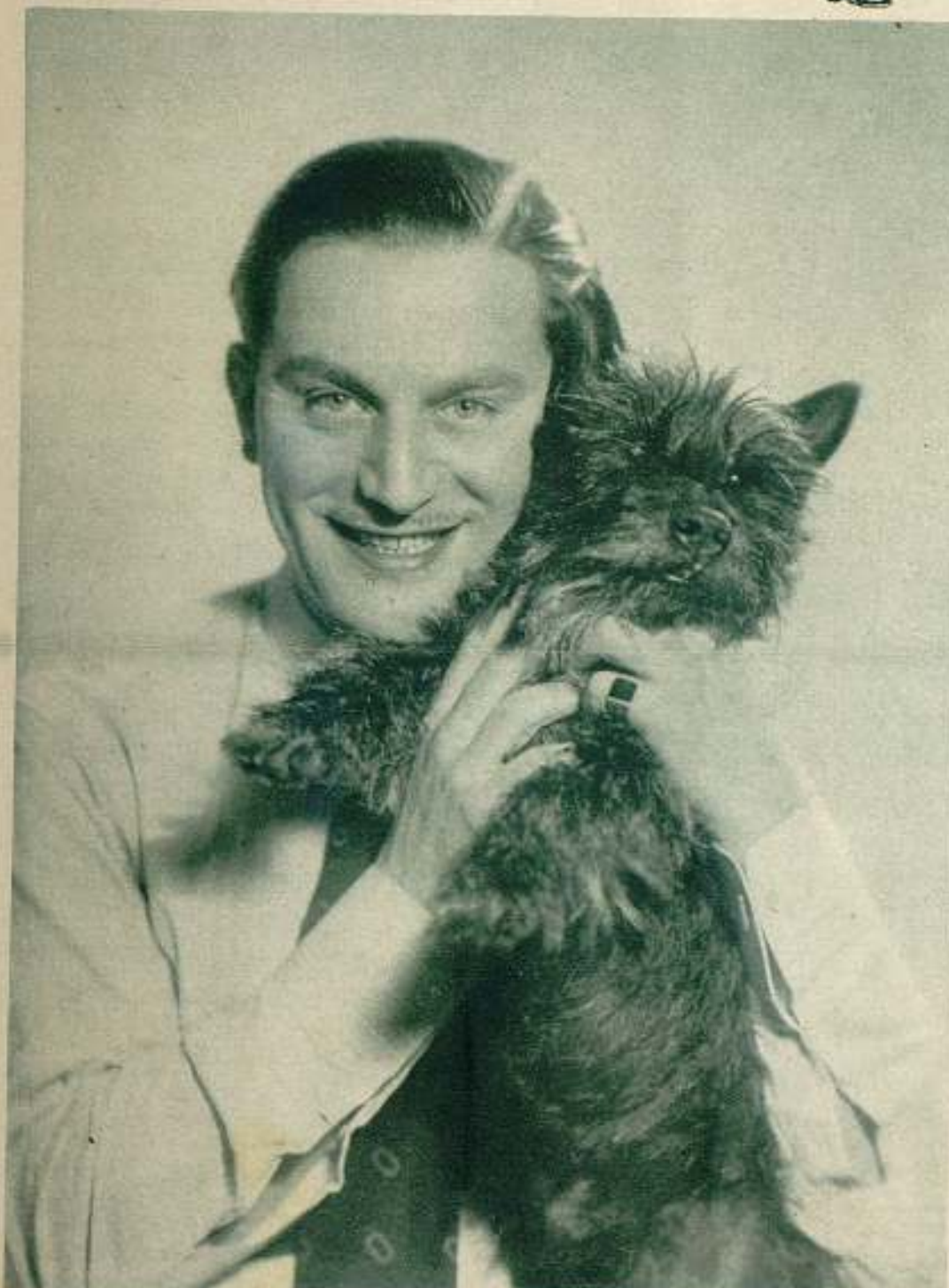
Adolf Wohlbrück es el protagonista de tres nuevas producciones de Tobis-Cinéma: «Yo era Jack Mortimer», «El estudiante de Praga» y «El correo del Zar».