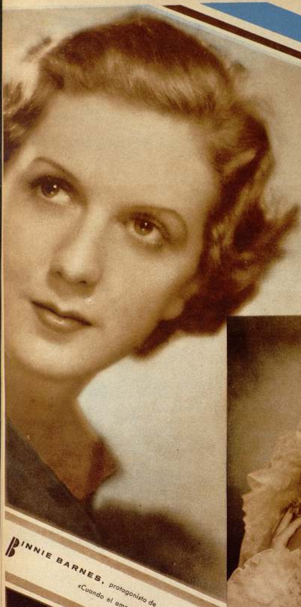
PINNIE BARNES , protagonista de «Cuando el amor muere», film de la Universal