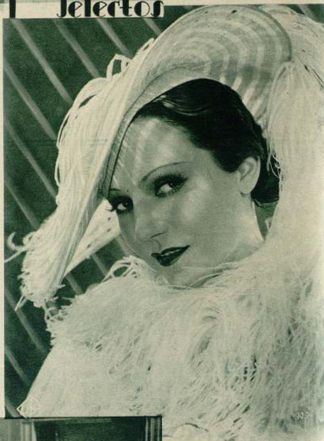
Ultimo retrato de la estrella de la Ufa Kala de Nagy