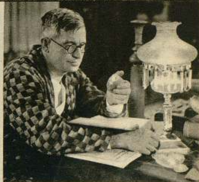
Will Rogers en su espléndida caracterización de «Dr. Bull» otro éxito de taquilla en Norteamérica.

hasta el año 1929 en que hizo su debut en los films parlantes, con la película «They had to see Paris», para la casa Fox. Sus triunfos se sucedieron en rápida sucesión. «So this is London», «Lightnin'», «A Connecticut yankee», «Young as you feel», «Business and pleasure», «Ambassador Bill», «Down to earth», «To hussy to work», «State fair» (premiada por la Academia), «Dr. Bull», «Mr. Skitch», «David Harum» (en la cual Will Rogers interpretó de manera magistral a un tipo famoso de la historia norteamericana), «Merry Andrew», «Judge priest», «The country chairman», «Life begins at 40», fueron todas una serie interminable de éxitos artísticos y de taquilla.