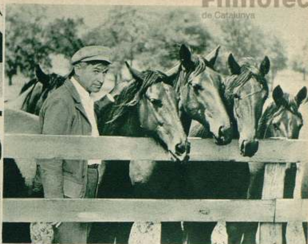
«In Old Kentucky», otra de las películas del gran actor desaparecido que aún no han llegado a la pantalla y que marcan el final de su carrera.