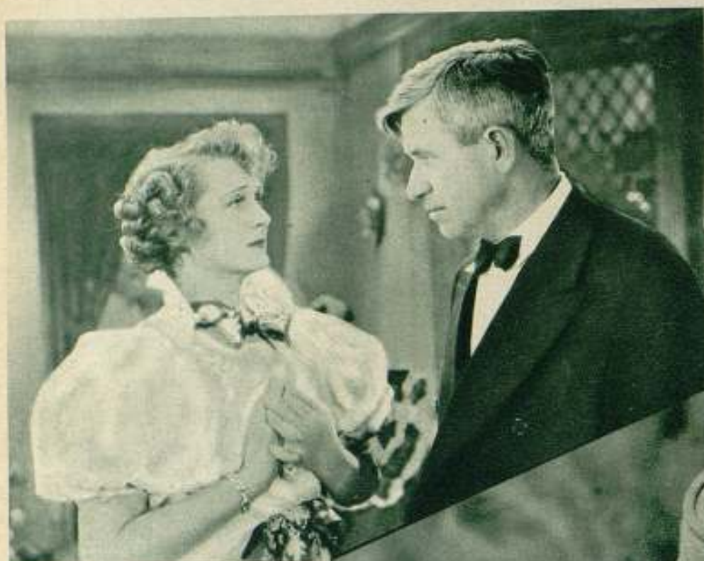
Will Rogers y Billie Burke en una escena de la espléndida película «Dontling Thomas», penúltima aparición del actor en la pantalla.

ofreció sus servicios en diversas funciones de caridad, a fin de que el dinero colectado fuera a aliviar la indigencia.