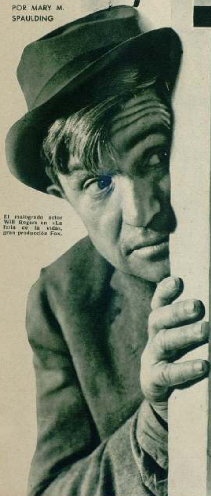
El malogrado actor Will Rogers en «La terza de la vida», gran producción Fox.

IMPLACABLE, la mano sarmentosa de la muerte tiende de nuevo su guadaña para segar otra vida famosa en los prósperos jardines de Cinelandia, enlutando el corazón de Norteamérica y los demás pueblos de la tierra. De nuevo la tragedia, sombría, fática, misteriosa, asoma su rostro pálido y enjuto, desbaratando trágicamente otro hogar.