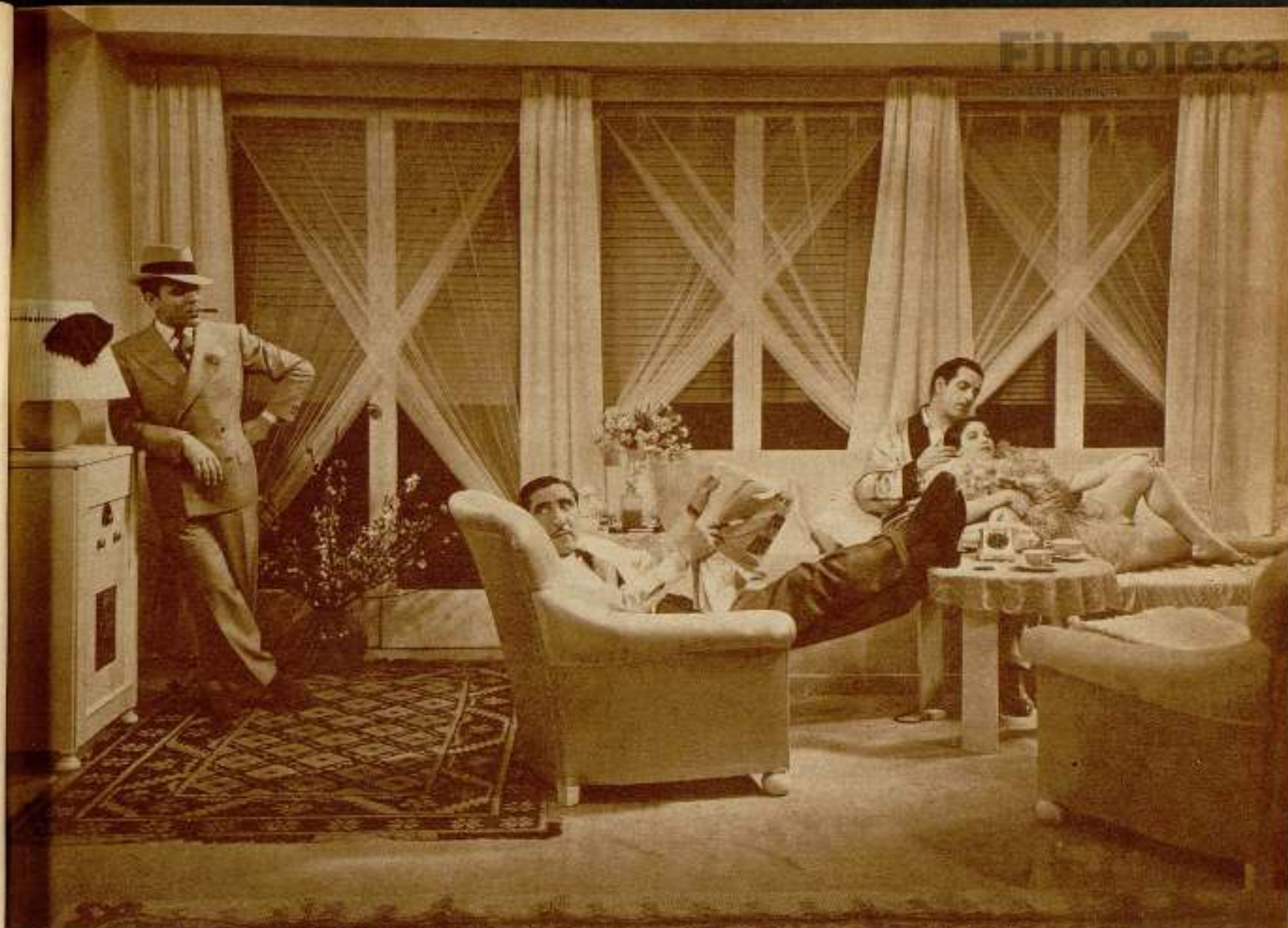
Dos escenas de la divertida película española, producción Ibérica Films, «Poderoso caballero».