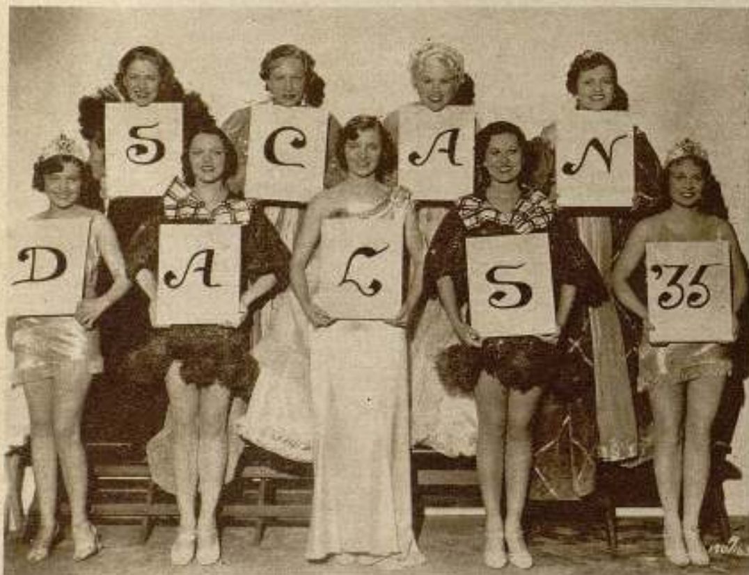
Lindas actrices que toman parte en «Scandala 1935» forman el título de este entretenido film Fox.

No sería difícil, por consiguiente, un exodo de los estudios de Hollywood.