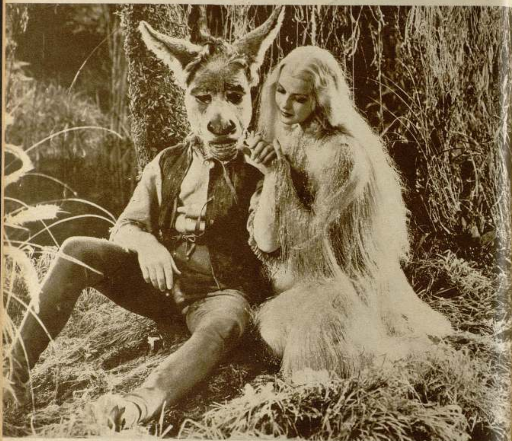
Una escena de «Una noche de verano», película en que hace su debut como director cinematográfico el reputado Max Reinhardt.

N UNCA se produjo en Hollywood una película que haya necesitado de tan elaboradísima preparación como «El sueño de una noche de verano», el primero de los ensayos técnicocinematográficos del gran director Max Reinhardt, en los estudios de la Warner Bros-First National.