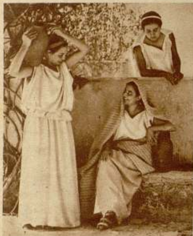
Del film «Arquimedes», de Luis Masriera, el cual ha presentado recientemente en la Sala Busquets una colección de fotografías de esta película.

El primer concurso organizado por la Federación Catalana de Cinema Amateur ha sido, sin duda, el más importante de cuantos se han celebrado en esta temporada tan pródiga en concursos. Como ya hemos explicado alguna otra vez, la Federación está integrada por los grupos más importantes de cineastas de Cataluña. Es preciso hacer, no obstante, una observación: la única entidad de