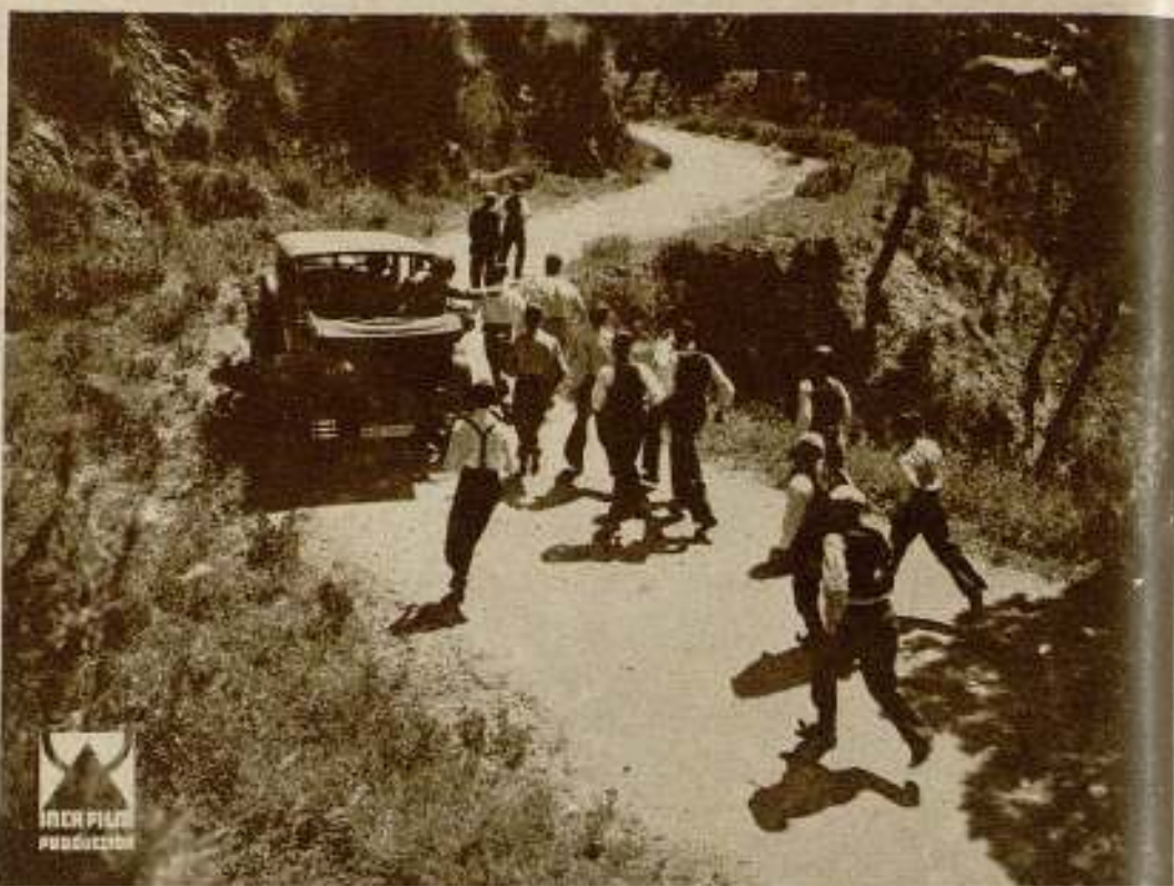
Una escena, muy divertida por cierto, de la película Inca Films, que actualmente se está rodando en los estudios Grifera de Montjuich, titulada «El malvado Corabel», realización cinematográfica de la novela del mismo título del insigne escritor Wenceslao Fernández-Flores.

Al lado de todos ellos, veremos, por prime-