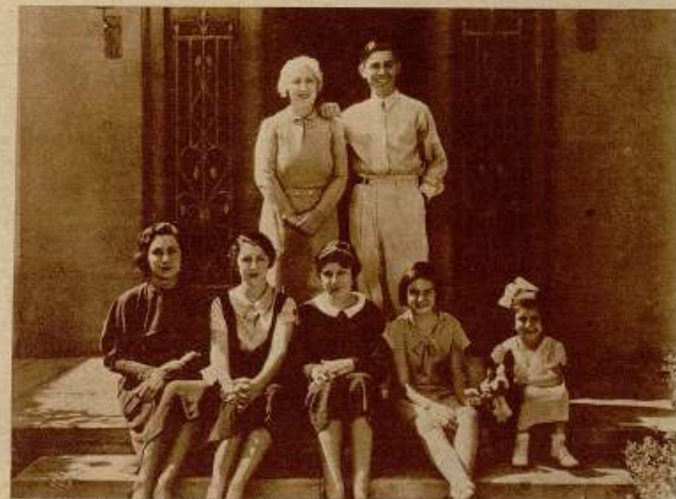
Para familia la de Eddie Cantor. Cinco manebas que vuelven loco al comediante de los ojos saltados, quien dice: «Hasta el presente ninguna ha traído al nacer un pan debajo del brazo... ¡Hay que trabajar mucho para mantener a tanta mujer!»