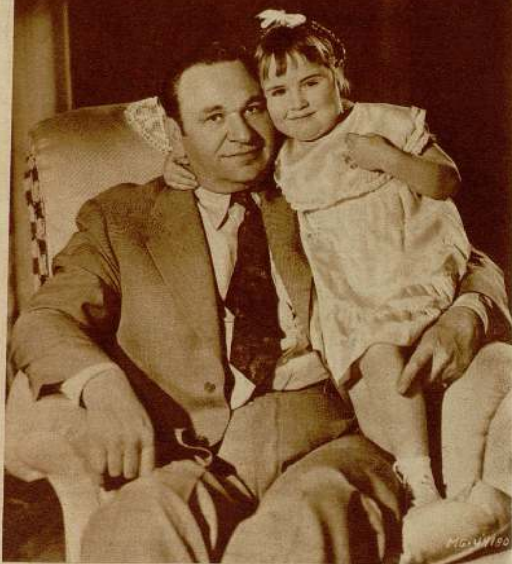
Y si no tenerlos propios Wallace Beery adoptó a la pequeña Carol Ann, que será un día artista de cine como su famoso padre adoptivo.

El chico enlazó con sus brazos regordetes el etéreo cuello de aquella mujer que había sido tantas veces estrechado por brazos vigorosos de