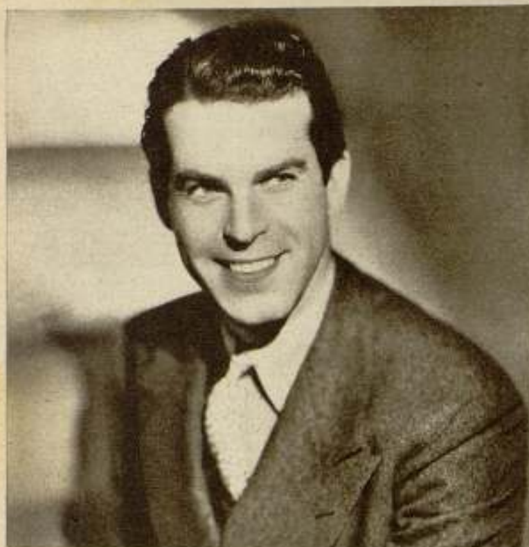
De las modestas oficinas de Oscar Serlin surgió, para regalo espiritual de las bellas muchachitas románticas, Fred Mac Murray, uno de los galanes jóvenes que más se destacan actualmente en la pantalla.

de la visita. Primero gana la confianza del entrevistado y poco a poco comienza a surgir, involuntariamente, la personalidad del individuo.