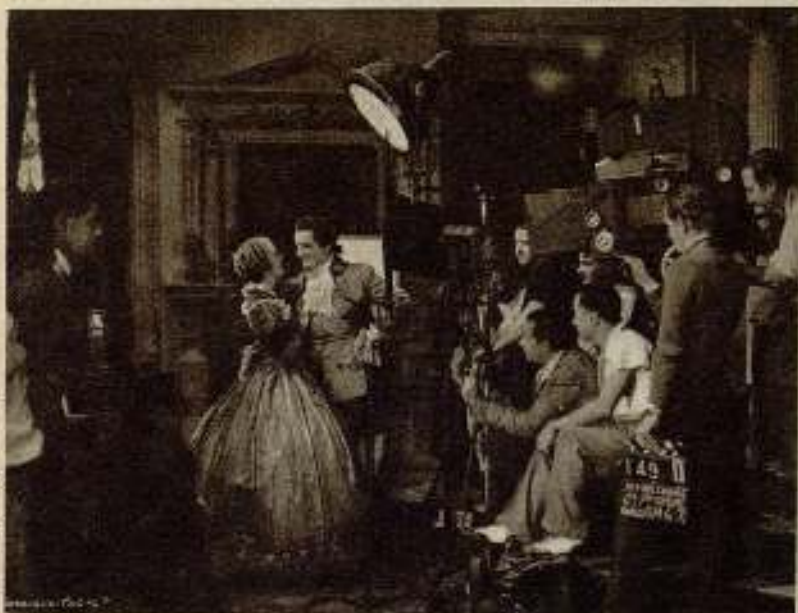
Ronald Colman y Loretta Young interpretan una escena de amor en «Clive of India», ante numerosos testigos.

"Top Hat" es el nuevo film musical que ha empezado a rodarse en los Estudios Radio Films, de Hollywood. Protagonizado por Ginger Rogers y Fred Astaire, "Top Hat", sin título en español todavía, es una versión musical del "sketch" escrito por Mark Sandrick, actores y músico, respectivamente que colaboraron en "La alegre di-