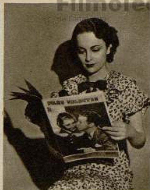
La cantante artista Olivia de Havilland lo lee en los momentos que le quedan libres durante el rodaje de la película «Alibi Ike», en la que actúa con Joe E. Brown.