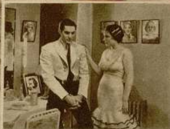
Cuatro escenas de la emocionante comedia dramática Universal «Fascinación» cuyos principales papeles corren a cargo de Constance Cummings, Paul Lukas y Phillips Red.