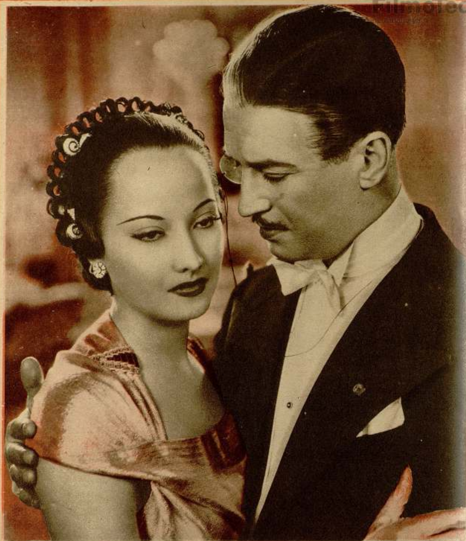
Merle Oberon y Maurice Chevalier en una escena de la cinta 20th Century «Folies Bergères»