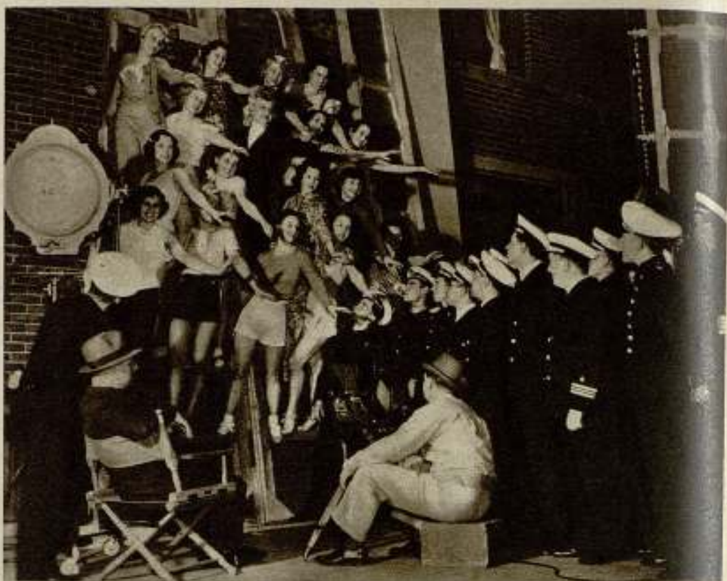
Los oficiales y guardias marinos del «Juan Sebastián Elcano» en su visita a los estudios Warner.

Esta nueva sociedad, dedicada exclusivamente a producir películas nacionales, se funda con un capital de 1.050.000 ptas., capital que será ampliado casi seguramente para evitar el prorrato de los títulos entre los suscriptores, en vista de las nuevas posibilidades de producción que se presentan a ECE a raíz de su vida social.