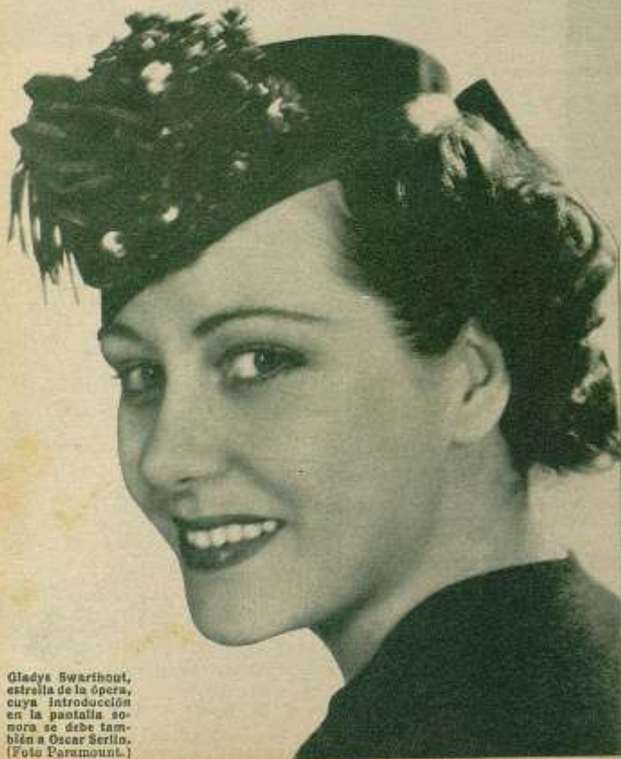
Gladys Swarthout, estrella de la ópera, cuya introducción en la pantalla sonora se debe también a Oscar Serlin.