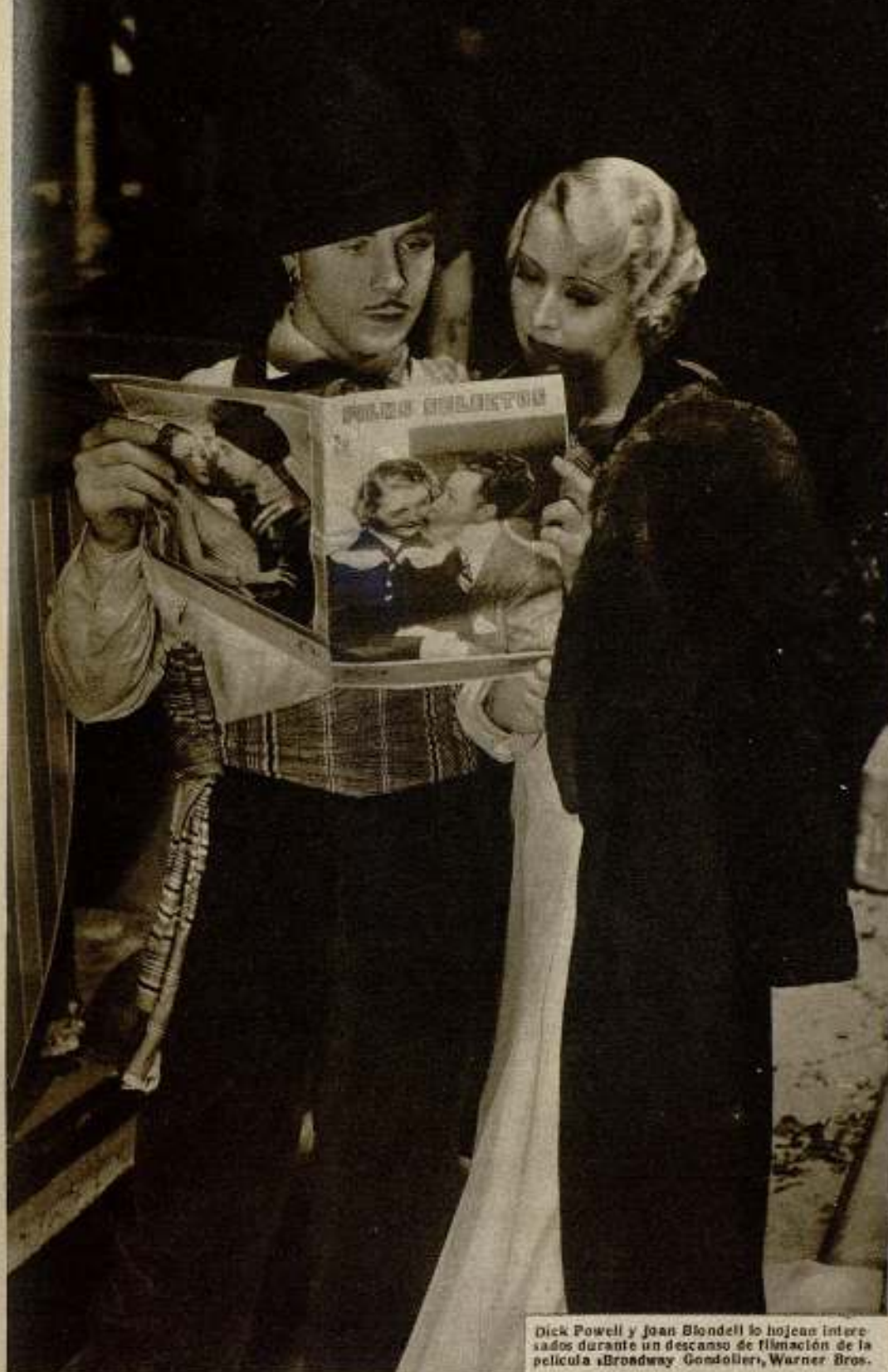
Dick Powell y Joan Blondell lo hojean interesados durante un descanso de filmación de la película «Broadway Gondoliers», Warner Bros.