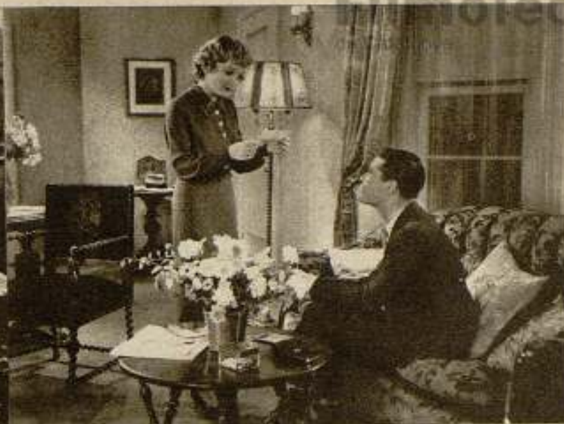
Tom Brown y Marion Nixon, en una escena de la cinta «Sweepstake Annie», de la Liberty Pictures.