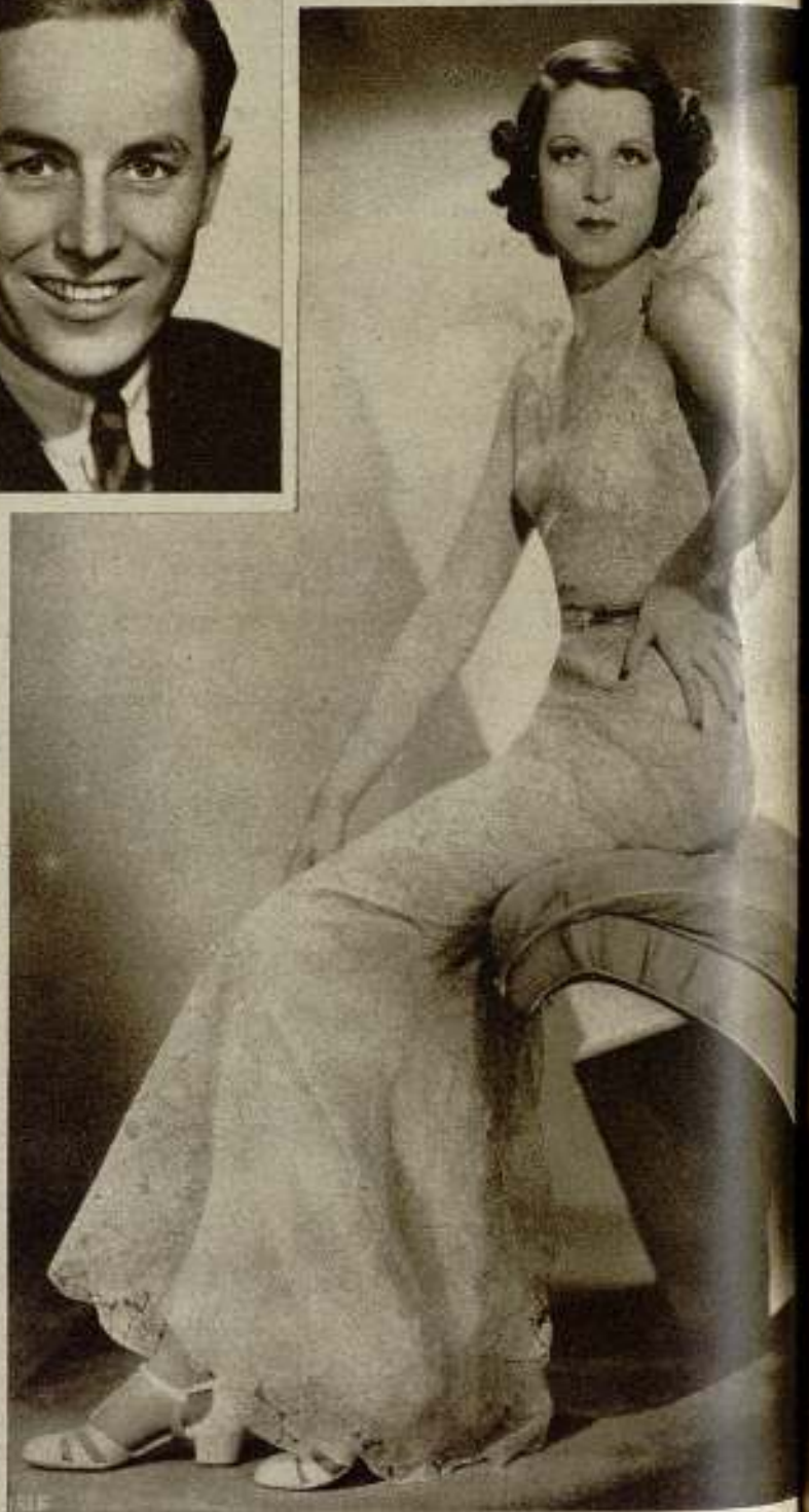
Kitty Carlisle, promesa filmita que ya comienzan a conocer nuestros públicos por su bello y positivo talento histrionico, descubierta también por Oscar Serlin.