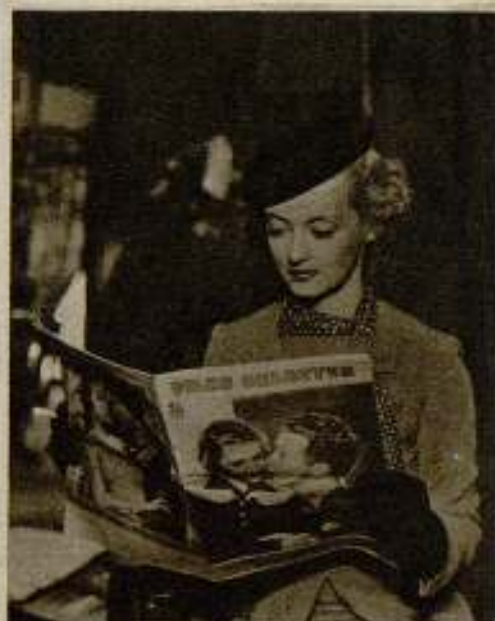
Bette Davis una de las grandes estrellas de estos estudios contempla interesada FILMS SELECTOS entre escenas de la película «Front Page Woman», en la que actúa de protagonista.