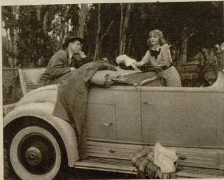
Grace Bradley y Bruce Cabot, en una escena de la interesante cinta «Redhead», producida por la casa Monogram Pictures.

Este cupón es válido hasta el día 22-6-1935, F.