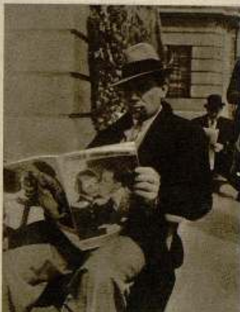
George Brent que actualmente actúa ante la cámara para la película «Front Page Woman», espera la hora de actuar viendo nuestra revista.