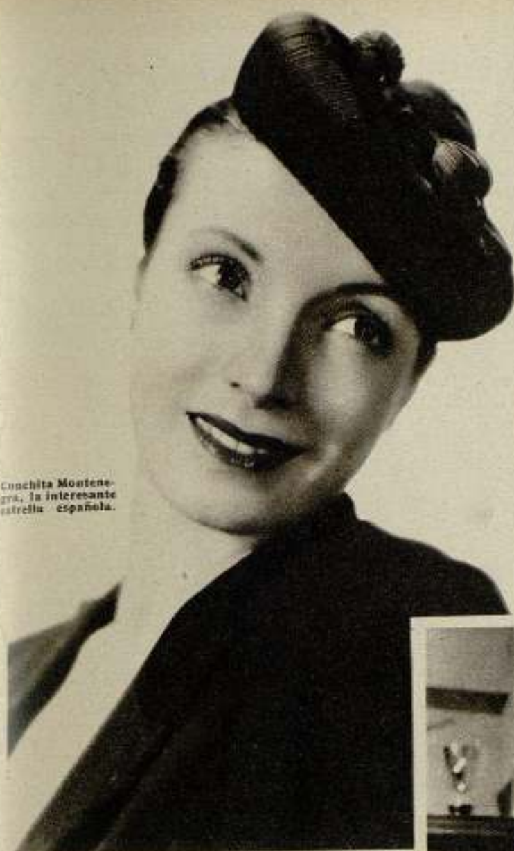
Conchita Montenegro, la interesante estrella española.