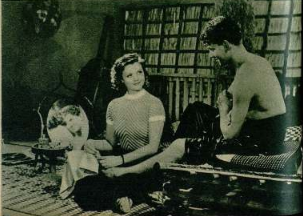
«El lago de las damas», de Marc Allégret, uno de los films franceses de mayor éxito popular.