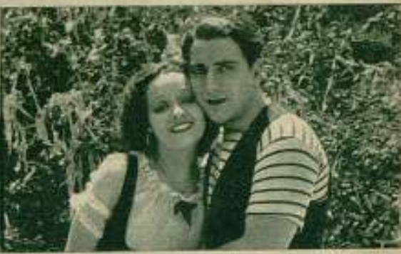
Enrico Caruso y Carmen Rúa en «El cantante de Nápoles».

lúrica como en «El diluvio», una formidable fantasía de toda la química moderna como en «El oro...». El cine padece hipertrofia del amor: de un amor falso, elemental y honesto; de un amor vulgar. Y está matando al cine con el tóxico con que el amor mismo se suicida en la vida real: con la monotonía.