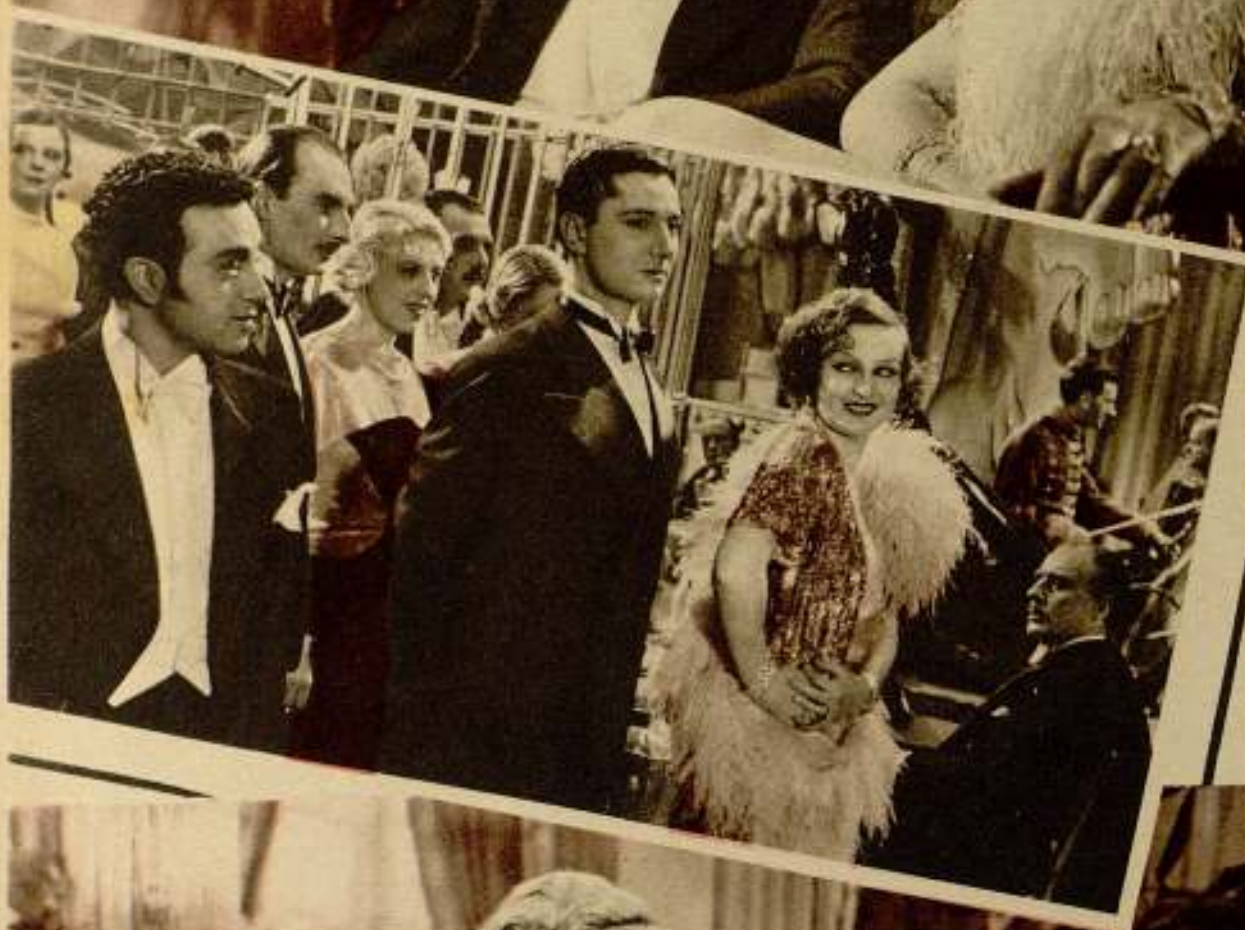
Pierre Athoua Pierre Brasseur y Colette Darfeuil