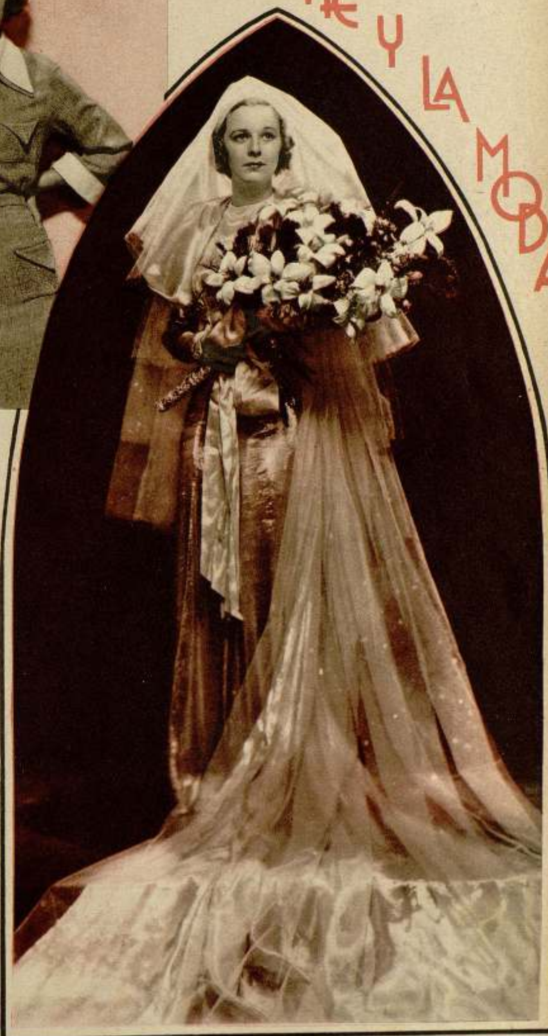
Trajes de a diario y de novia presentados por la gran estre- lla de la UNIVERSAL MARGARET SULLIVAN