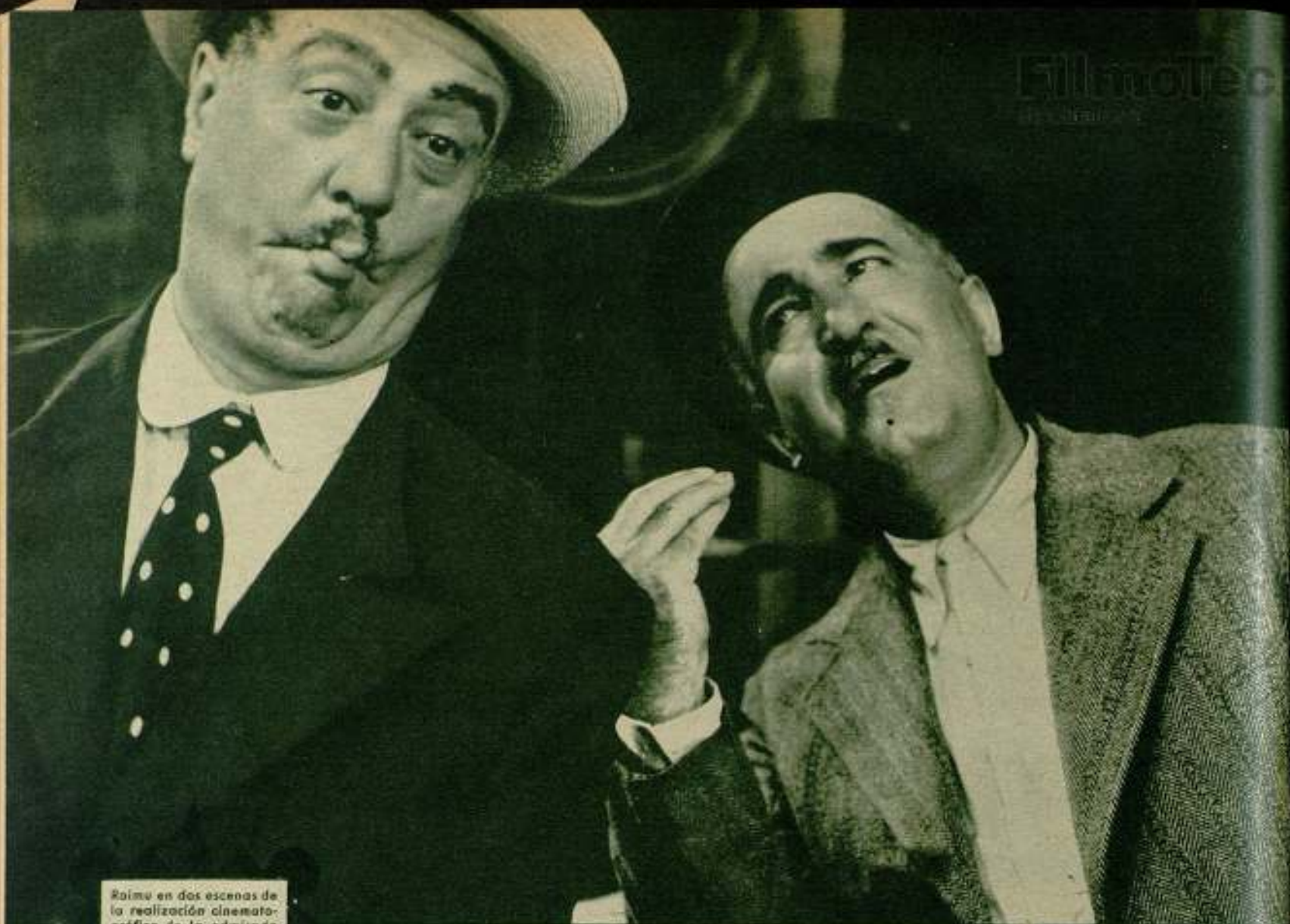
Raimu en dos escenas de la realización cinematográfica de la admirada obra de Pagnol «Fanny».