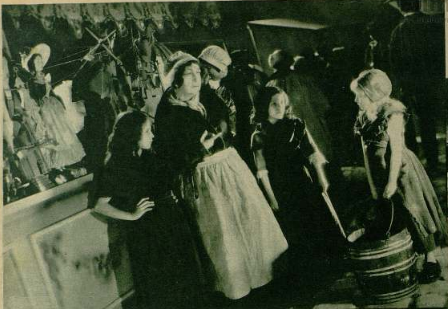
Dos escenas de la película «Los Miserables»