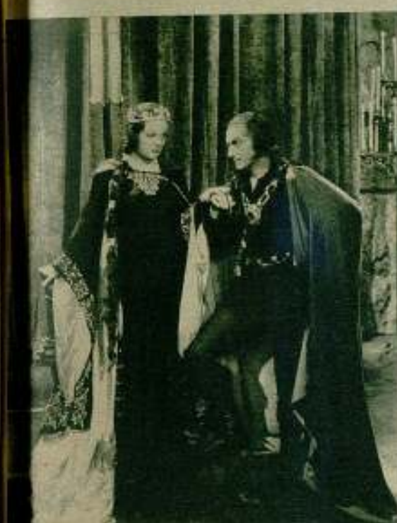
Una escena de amor en la nueva película Paramount, de Cecil B. de Mille «Las Cruzadas».