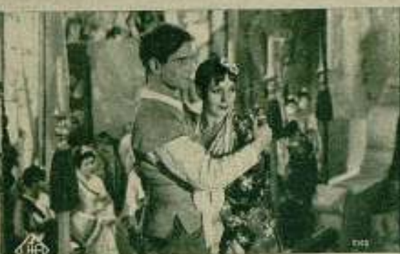
Kate de Nagy y Pierre Blanchar en «Turan».