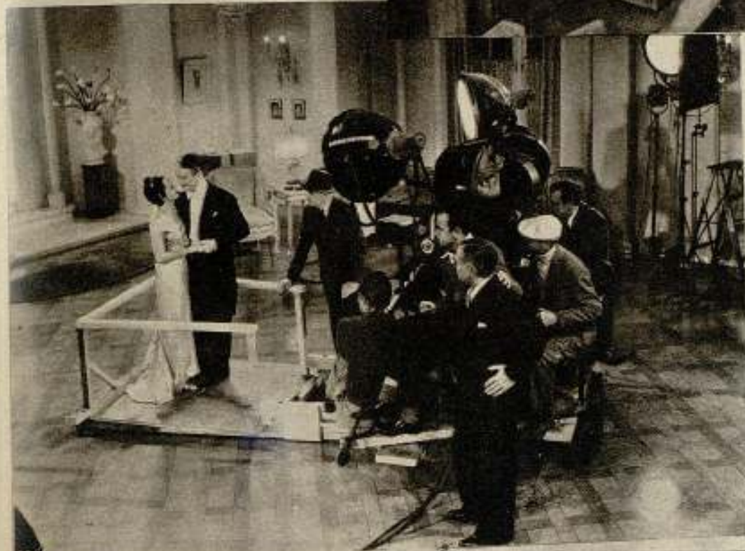
Maurice Chevalier y Merle Oberon durante el rodaje de una escena de «El caballero del Folies Bergère», versión inglesa, realizada por la 20th Century.