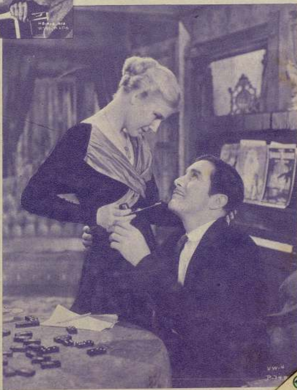
Ann Harding y John Boles en la película «The life of Vergie Winters» (La vida de Vergie Winters), producida por la R. K. O.-Radio durante el año 1934.

Miss Mitchell ha actuado en «La cita a ciegas», «Lo que los dioses destruyen», «El capitán odia el mar» y otras. Walburn formó parte del elenco de «Ángel del arroyo», «Estrictamente confidencial», «Una mujer fue la causa» y recientemente en «Mills of the gods», sin título aún en español.