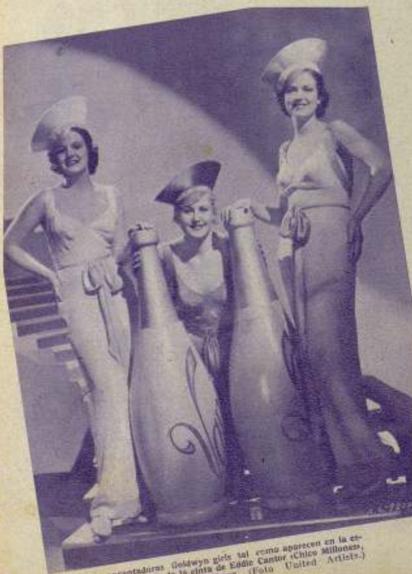
Tres encantadoras Goldwyn girls tal como aparecen en la escena a todo color de la cinta de Eddie Cantor «Chico Millones», dirigida por Samuel Goldwyn.