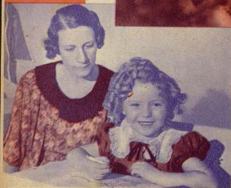
NUEVAS ESTRELLAS la gran revelación del año 1934 SHIRLEY TEMPLE