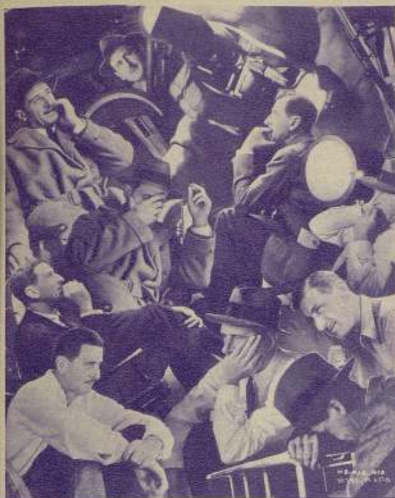
Interesante fotografía múltiple del director John Cromwell, a cuyo cargo estuvo la filmación de la película «Of Human Bondage».

mayoría de las estrellas con la cabeza de famosas estatuas, podrán observar que la cara de las estrellas es más pronunciada. Miren a Joan Blondell, a Barbara Stanwyck o a Bette Davis. Todas ellas son bellísimas y tienen la cabeza grande. La mujer que quiere ser algo en el cine tiene que tener grande la cabeza.