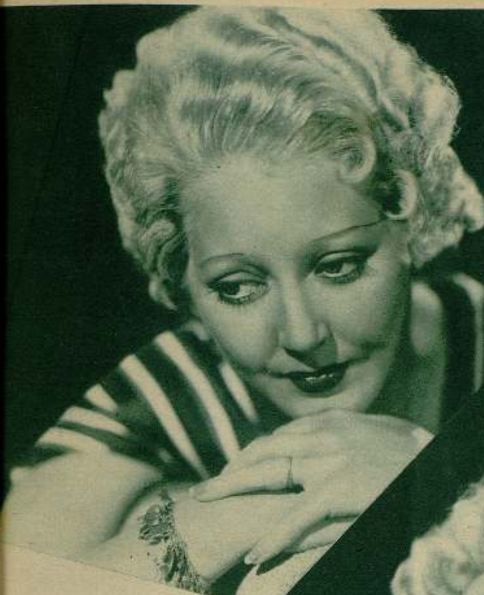
Bella y refinada como una dama del siglo XVII es la atrayente y simpática Thel- ma Todd.

Thelma venció en el concurso y fue proclamada miss Massa- chusetts y empezó la carrera cinematográfica que antes de ser miss Massachusetts ha- bía conquistado. La encanta- dora rubia ha tenido siem- pre empeño en hacer cons- tar que no fue el premio en el concurso de belle- za lo que le abrió las puertas de los estudios.