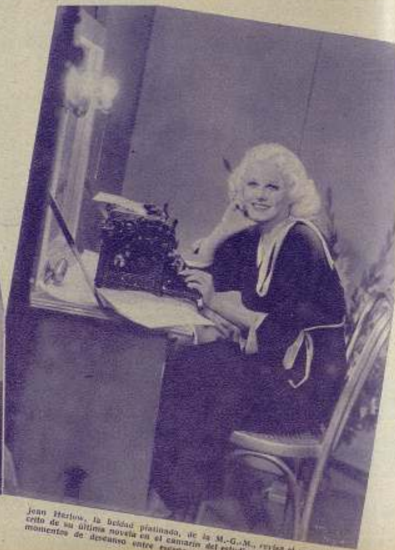
Joan Harlow, la belleza pinelada, de la M.-G.-M., revisa el manuscrito de su última novela en el camarín del estudio, aprovechando los momentos de descanso entre escena y escena de su nueva...