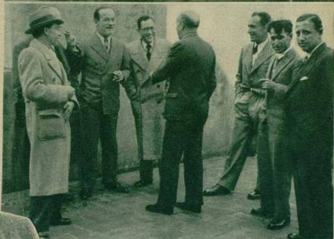
Luis Trenker en varios momentos de la entrevista que con él celebramos.