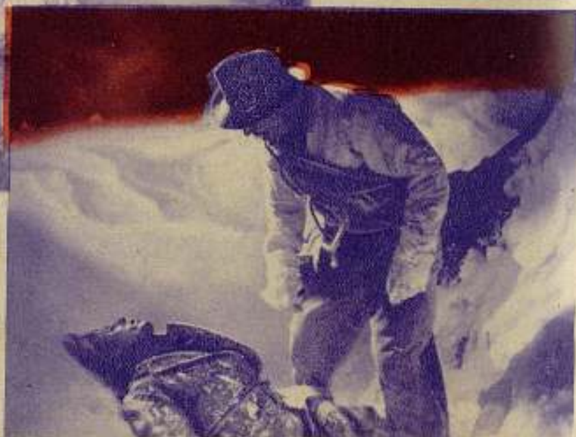
Tres momentos de la emocionante y bellísima película de la Universal, «El hijo perdido», cuyo autor, director y protagonista es Luis Trenker.