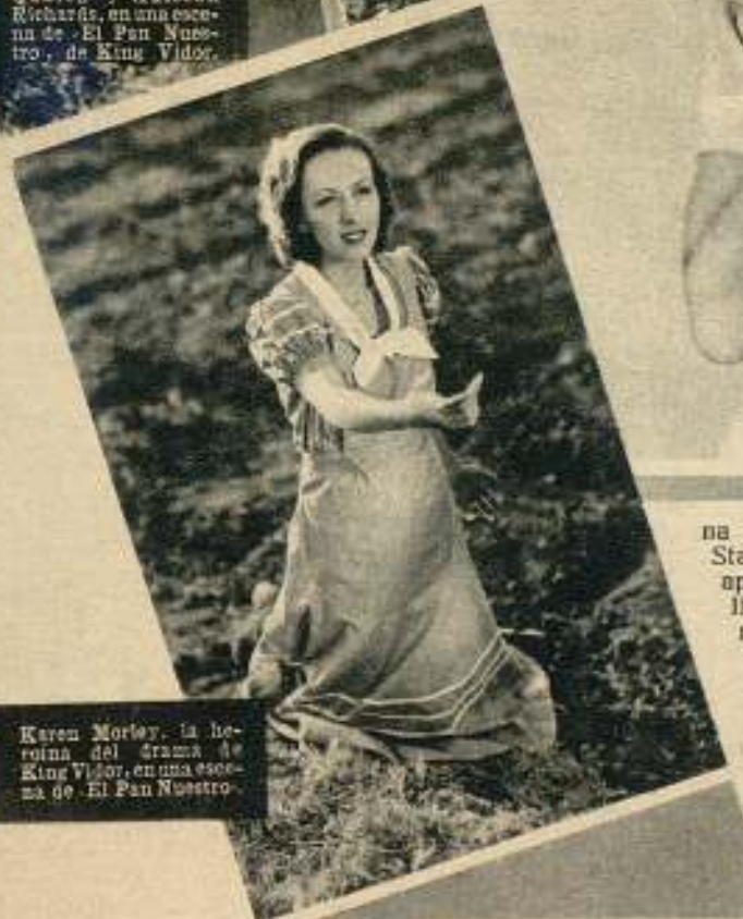
Karen Morley, la heroína del drama de King Vidor, en una escena de «El Pan Nuestro».