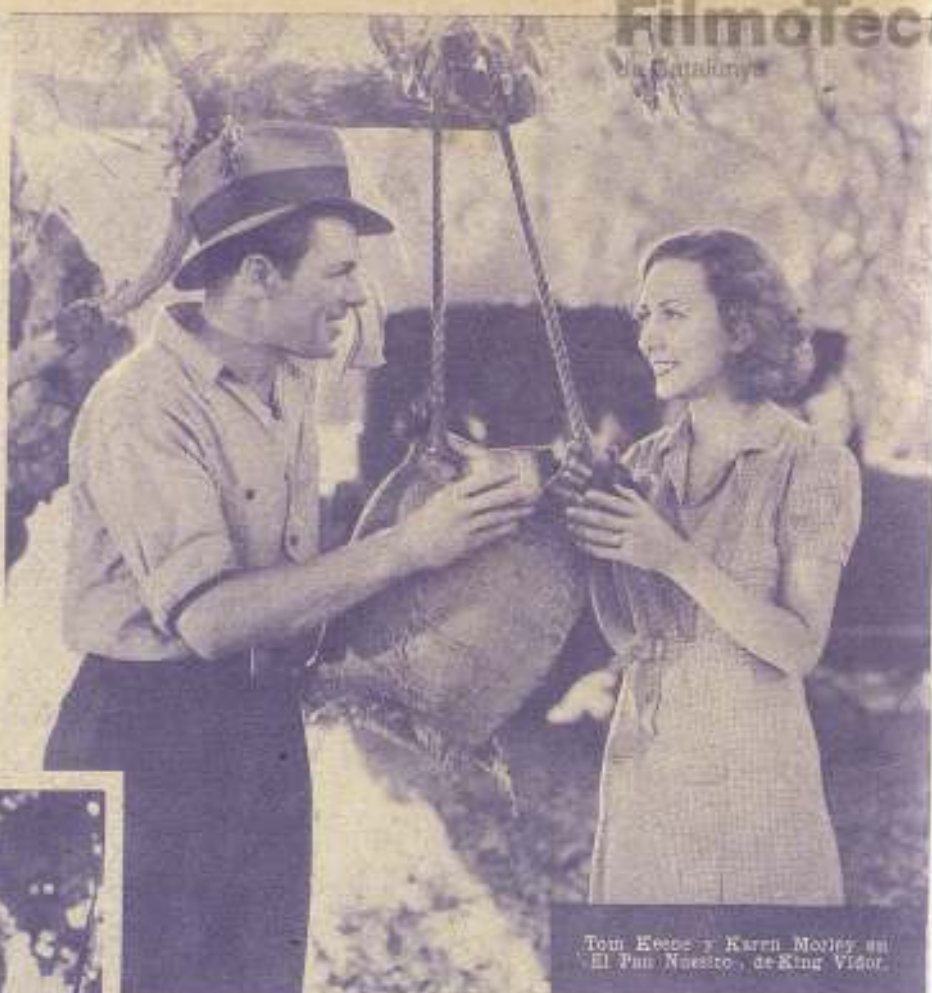
Tom Keene y Karen Morley en «El Pan Nuestro», de King Vidor.

Y he aquí una vez más demostrado que no es esa belleza «standard», tan popular en Hollywood, lo que determina el valor de una artista. Karen, tomando las viejas reglas que establecen la belleza femenina, no podría ser calificada de bella. Pero la muchacha se transforma, animada por la sagra-da llama del arte. Y sus pómulos salientes, que podían ser feos, se hacen interesantes; y su frente, demasiado ancha, se nimba con la luz del genio; y sus ojos, ligeramente orientales, conquistan el espíritu porque pueden ser tiernos y conmovedores y muy humanos. En cuanto a su boca, todos los críticos, y hasta los menos versados en reconocer la belleza clásicamente, convienen en que la boca de Karen Morley es de una