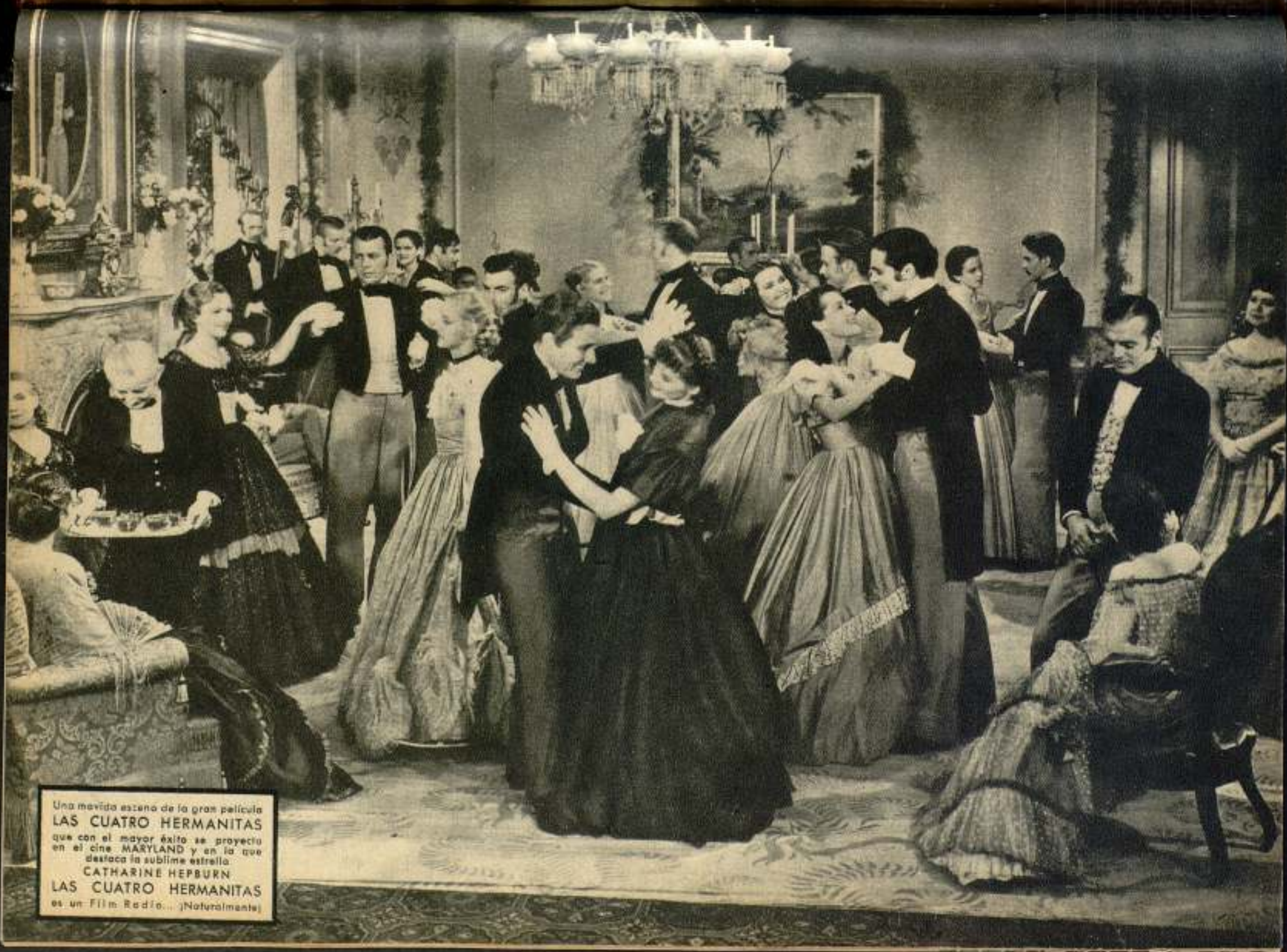
Una movida escena de la gran película LAS CUATRO HERMANITAS que con el mayor éxito se proyecta en el cine MARYLAND y en la que destaca la sublime estrella CATHARINE HEPBURN LAS CUATRO HERMANITAS es un Film Radio... ¡Naturalmente!