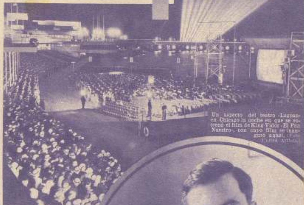
Un aspecto del teatro Lagoon en Chicago la noche en que se estrenó el film de King Vidor, "El Pan Nuestro", con cuyo film se inauguró aquel teatro.

Pero la opinión de los «mejor versados» (que eran en este caso los que tenían suficiente dinero para producir el film en cuestión) se oponía a la realización del ideal acariciado por el joven director. Tal vez tenían poner el dedo en la llaga y ser acusados de incitadores y revulsivos, descomos de añadir nuevos problemas y complicaciones a los muchos que pesaban sobre el país.