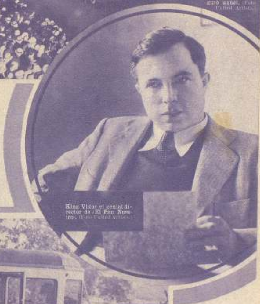
King Vidor, el genial director de "El Pan Nuestro".