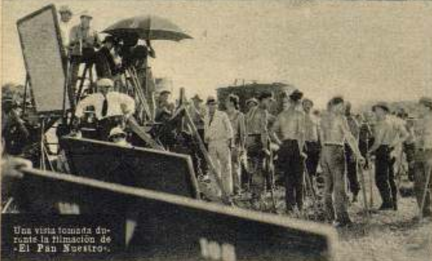
Una vista tomada durante la filmación de «El Pan Nuestro».

sombrio como la miseria que pinta; voluptuoso como la tierra que sirve de argumento. Drama hecho de lodo y polvo, desesperación y miseria, que establece una verdad incontrovertible: «Sólo el trabajo colectivo, el copioso sudor del hombre, cagando sobre las entrañas de la generosa madre tierra, puede engendrar al hijo inmortal que se llama regeneración social, aplastando al pavoroso monstruo de la depresión...»