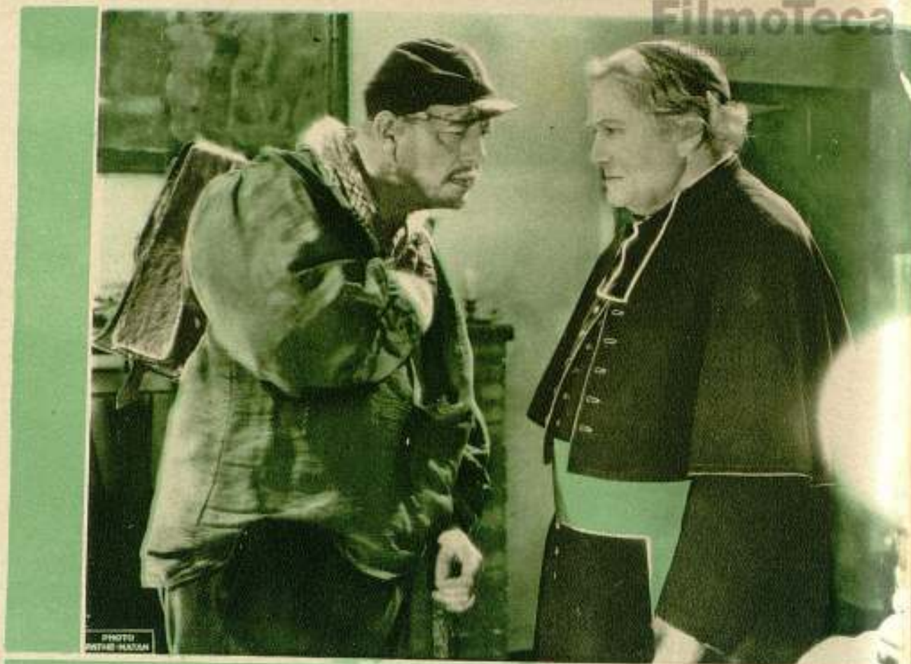
Das escenas de la muy emocionante película «Los misera- bles» que ha sido presentada por la casa Exclusivas Trian,