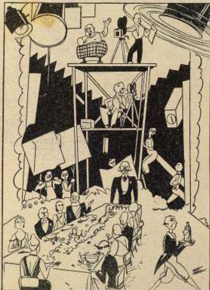
El director cinematográfico. — Basta por hoy, hijos; ya es hora de que nos vayamos a comer.