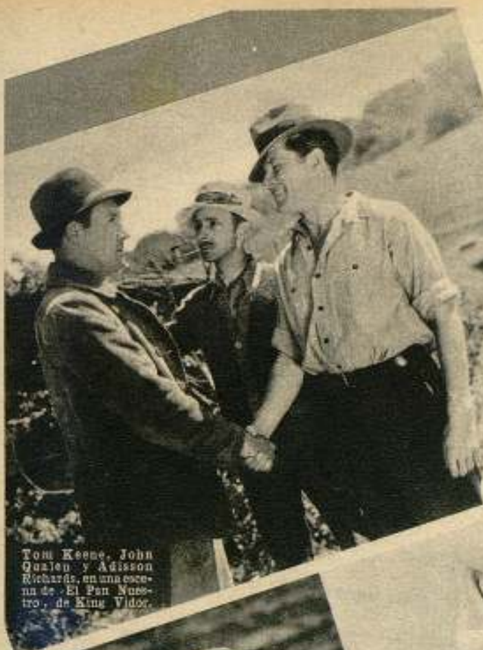
Tom Keene, John Qualen y Addison Richards, en una escena de «El Pan Nuestro», de King Vidor.

Y nos atrevemos a emitir la anterior opinión, porque recordamos aquella otra película en la cual la tierra jugaba importante papel, siendo heroi-