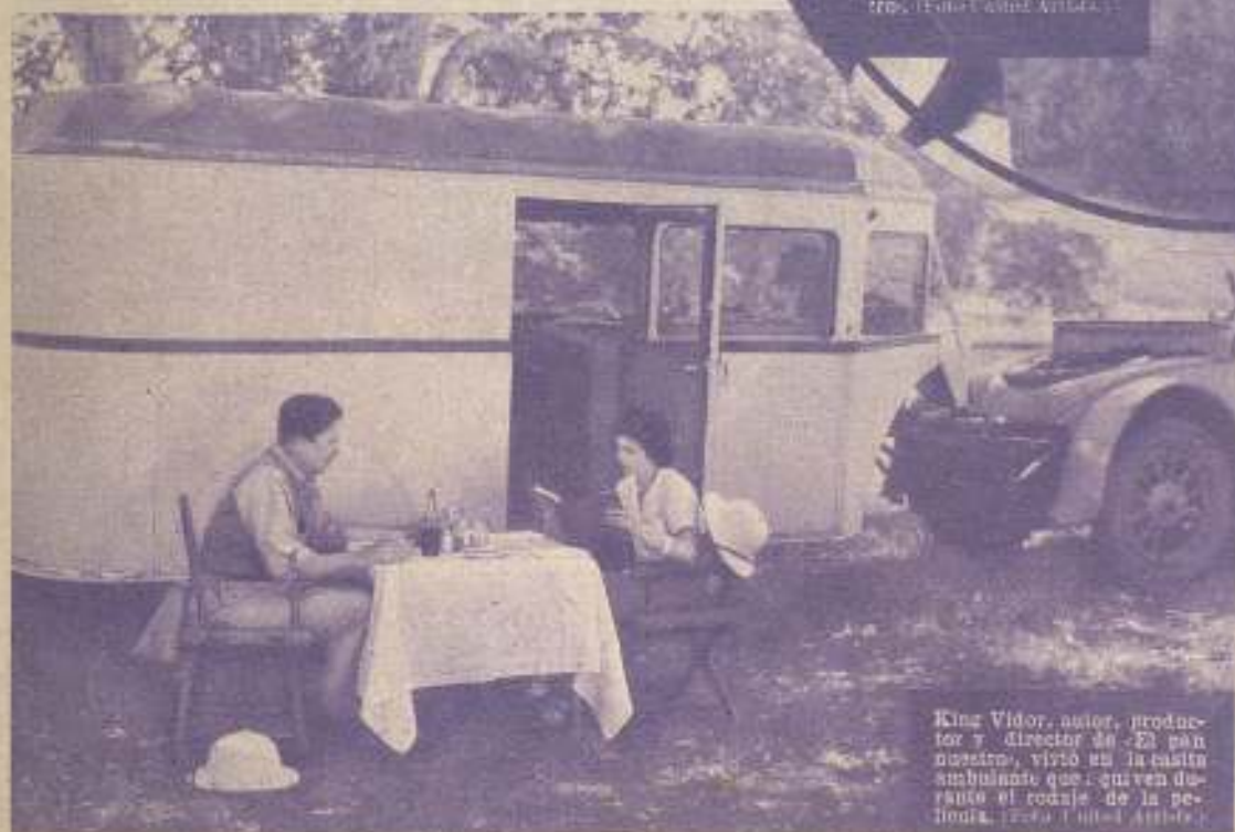
King Vidor, autor, productor y director de "El pan nuestro", vistió en la casita ambulante que usó durante el rodaje de la película.

A pesar de las repetidas protestas de King Vidor de que sus ideas no tenderían a fomentar el desconcierto, sino que más bien ofrecerían la única solución al problema de la inquietud reinante, no hubo compañía pelicular que se expusiera a ser responsable, llevando a la pantalla las altas ideas del genial director. Hasta que Vidor se cansó de esperar la