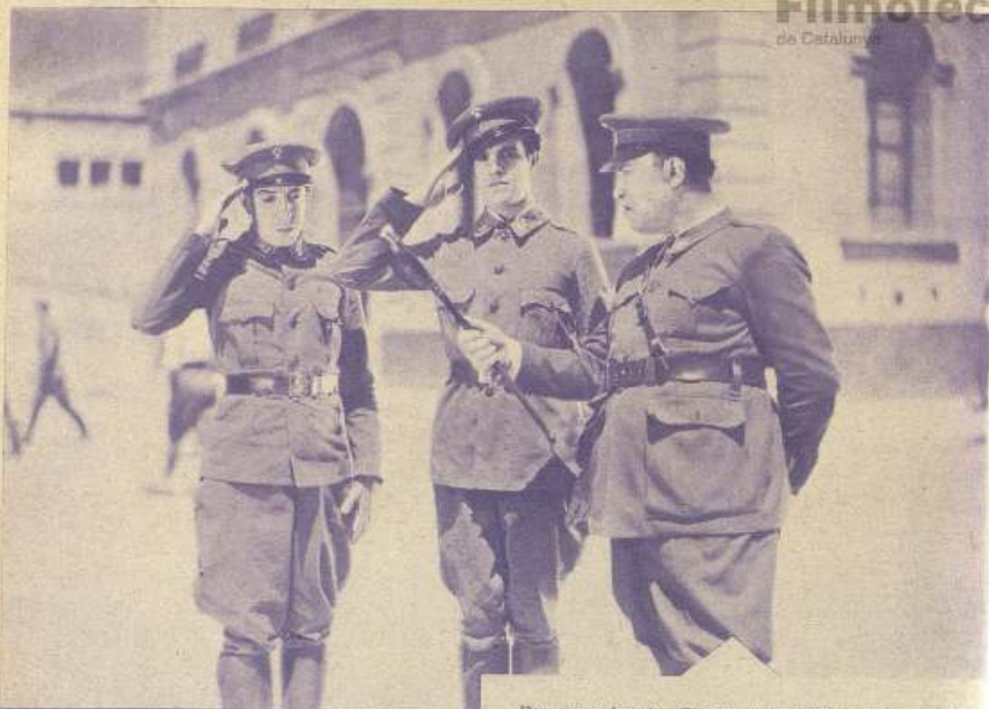
Dos momentos de «El tren de las 8'47», versión cinematográfica española de la divertidísima obra de Georges Courteline, dirigida por R. Chevalier e interpretada en los principales papeles por Acuña, Aladé, Santpere, Lepe y Nolla. (Exclusivas Hué.)