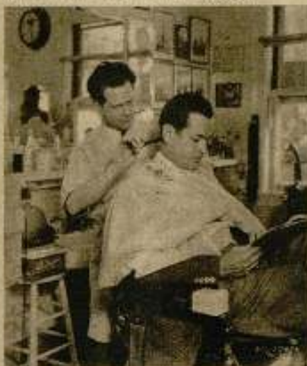
Robert Montgomery, conocido actor de la M. G. M., se entretiene leyendo las noticias del día mientras su peluquero le arregla el cabello.

por actuación de la temporada con su interpretación del papel titular de «Los amores de Enrique VIII», la hoy famosa película de producción inglesa.