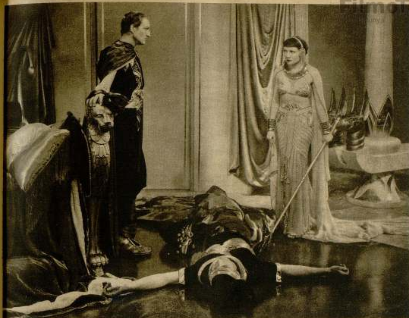
Emocionante y artística escena de «Cleopatra», última película que ha dirigido Cecil B. de Mille.

En salvar la situación. Pregunté, obedeciendo a una idea súbita, con qué podríamos oscurecer la arena en el espacio de dos millas. Si podíamos volverla negra y brillante estábamos salvados: si permanecía seca y blanca estábamos perdidos. ¿Qué hacer? Alguien sugirió la idea de la bomba hidráulica. Contábamos con bombas. En ocho minutos nuestros hombres habían acumulado de agua unos cuarenta pies de extensión, pero... a las doce del día, en un desierto, en California, cuando llegaron al trial, el principio estaba seco otra vez. Sugerí la idea de la pintura negra. ¿Con cuánta contábamos? El pintor se adelantó diciendo que no había pintura bastante en California para pintar aquella arena.