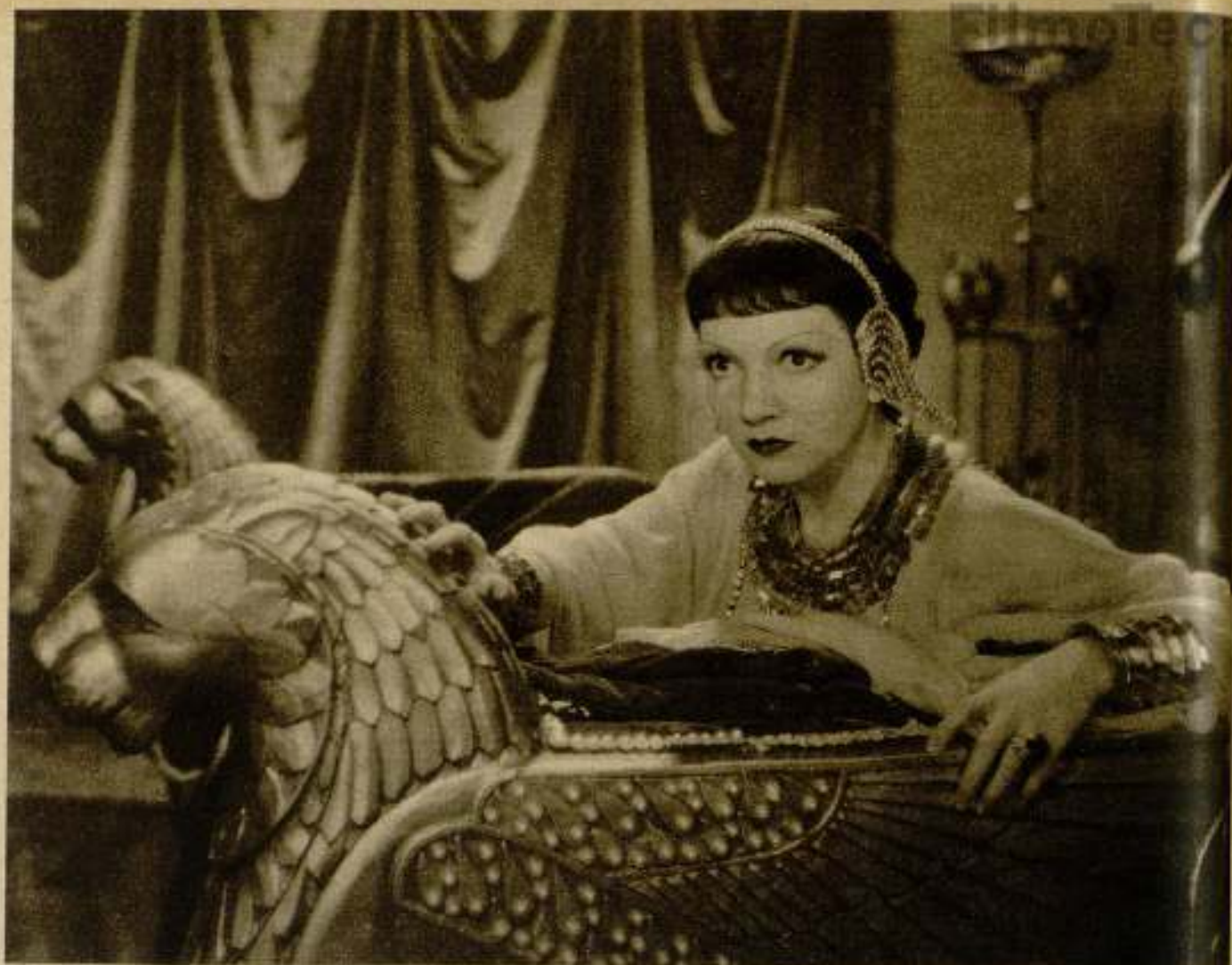
Claudette Colbert en el papel de Cleopatra de la película Permanente del mismo nombre , dirigida por Cecil B. de Mille. (Servicios de Exhibición por National International Exhibitors.)