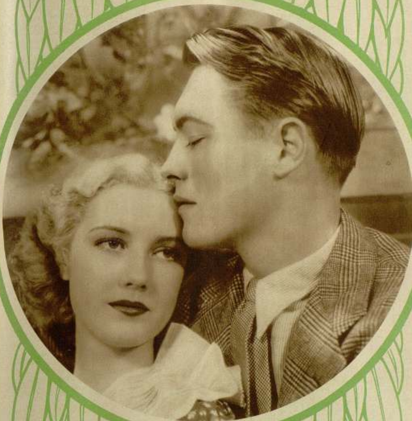
Anita Louise y Richard Cromwell, juveni pareja de la Columbia.