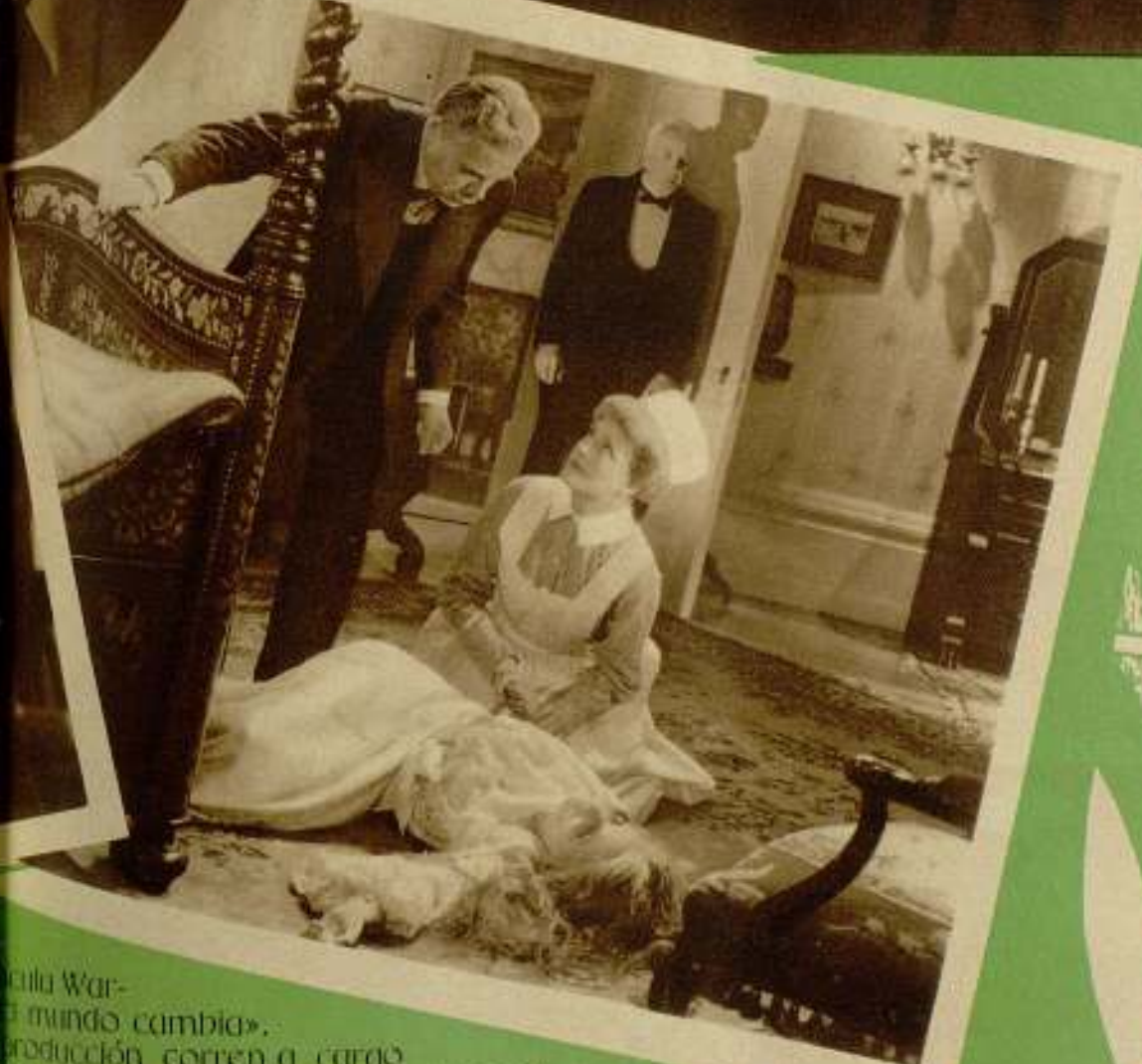
escena de ner Bros-First Nat Los principales papeles de de Paul Muni, Mary Astor, Patricia Ellis