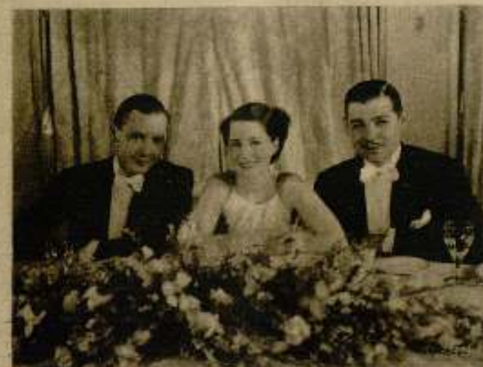
Norma Shearer, estrella de la M. G. M., con Clark Gable y Herbert Marshall.

La academia premió también a Walt Disney por su Sinfonía Tonta «Los tres cochinos». Esta memorable y brillantísima cinta recibió el título de «La mejor