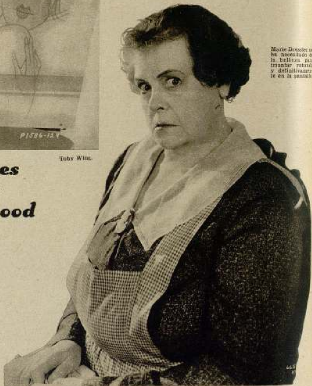
Marie Dressler ha necesitado de la belleza para triunfar rotunda y definitivamente en la pantalla.

Se impuso entonces la estilización del tipo femenino, que se masculinizó, y la mujer delgada dominó el mundo. Pero