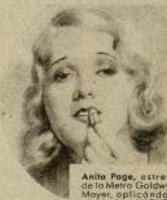
Anita Page, estrella de la Metro Goldwyn-Mayer, aplicándose el lápiz "MICHEL"

Los miraron como hubieran hecho si en realidad estallase una granada a su lado y continuaron disparando sus cañones hasta que fué filmada la escena y silbó el pito. Sólo entonces corrieron a ayudar a sus camaradas. Y es que, en nuestro oficio, cuando se lleva a los hombres al triunfo artístico, esos hombres, una vez enardecidos, darán hasta sus vidas por llegar hasta el fin.—