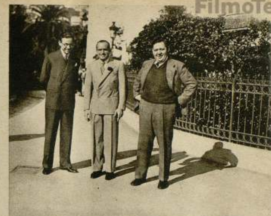
Alexander Korda, Douglas Fairbanks y Charles Laughton, director e intérpretes de «La vida privada de Enrique VIII» y «La vida privada de Don Juan», respectivamente, en Monte-Carlo, durante un breve período de vacaciones.

Con fecha 10 de abril, el comité Pro Infancia de la Liga de Naciones, en Ginebra, recomendó para los niños las películas basadas en la vida de la abeja o de la hormiga y las aventuras del ratón «Mickey», considerándolas más propias para ellos que las de «gangsters» o de amor al estilo de Hollywood. Entre los favoritos hay los dibujos animados, films de inofensiva fantasía, películas cómicas en general y auténticos documentales.