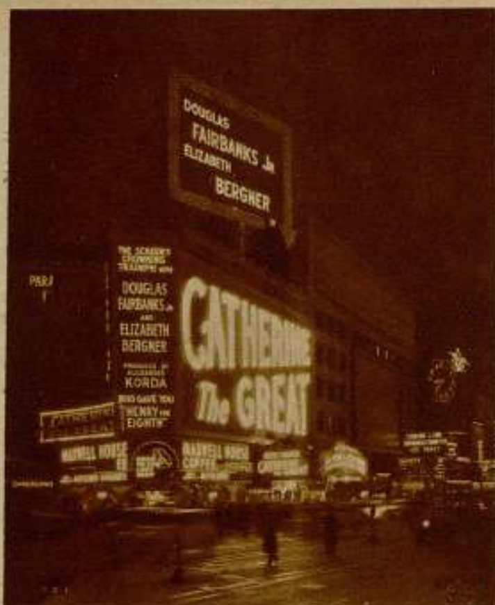
Una vista nocturna de Broadway, el famoso distrito teatral de Nueva York, mostrando el gigantesco anuncio luminoso del Cine Astor, en el cual la United Artists exhibe la épica producción de Alexander Korda «Catalina la Grande», protagonizada por Douglas Fairbanks (hijo) y Elizabeth Bergner.

...el director W. S. Van Dyke, quien ha viajado hasta los últimos rincones de la tierra para filmar «While Shadows in the South Seas», «Trader Horn», «Tarzan», «Eskimo» y actualmente «Laughing