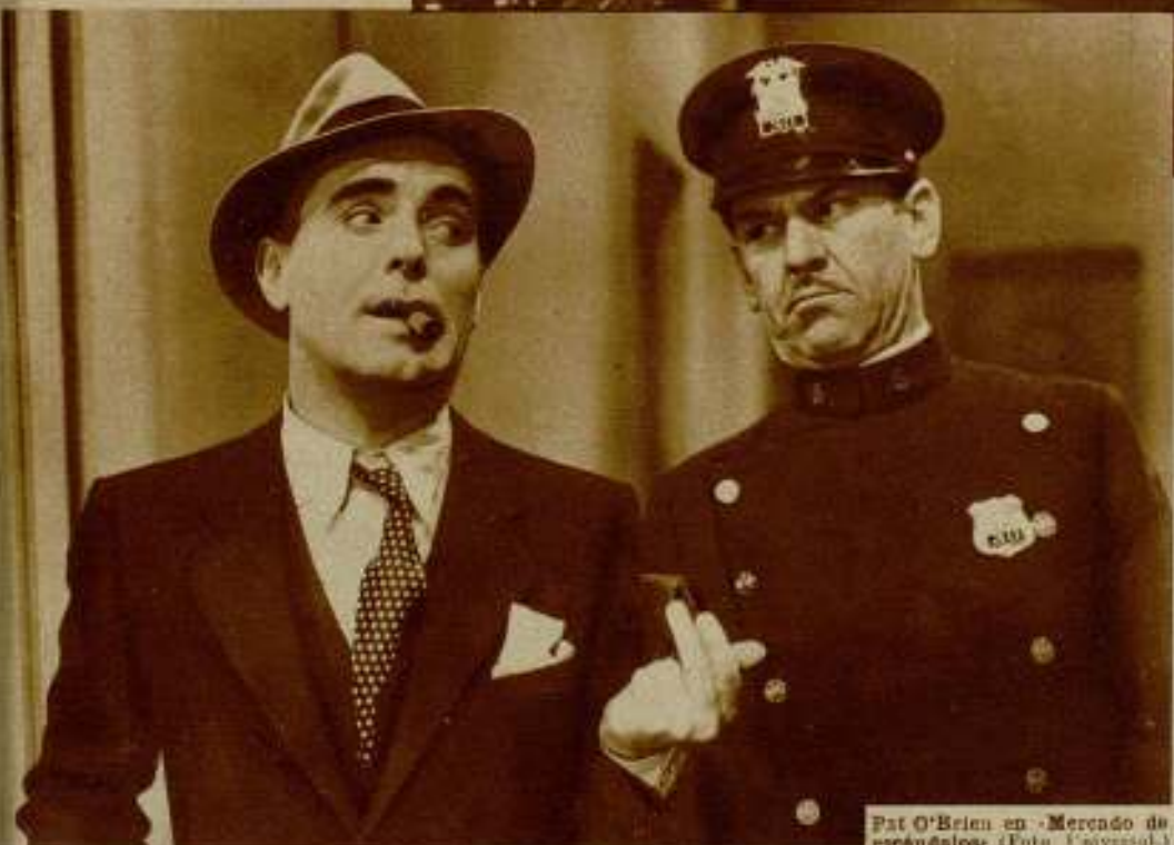
Pat O'Brien en «Mercado de escándalos» (Foto Universal).

título de «Un gran reportaje» se dió a conocer en España. Entonces se acordó del joven que había visto encarnar el tipo de repórter en Nueva York y decidió ofrecerle la misma parte en el film, convencido de su triunfo.