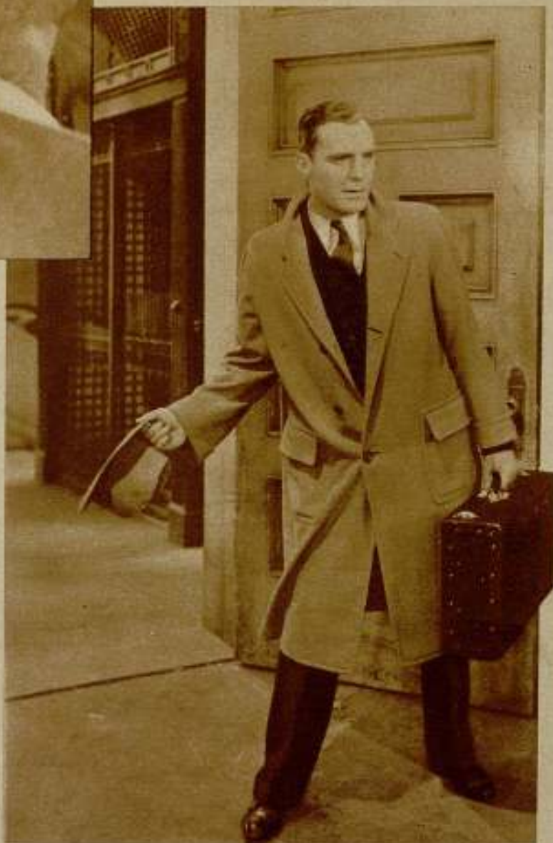
Pat O'Brien en «Un gran reportaje»

Sin embargo, a él fué a quien complacieron, ya que