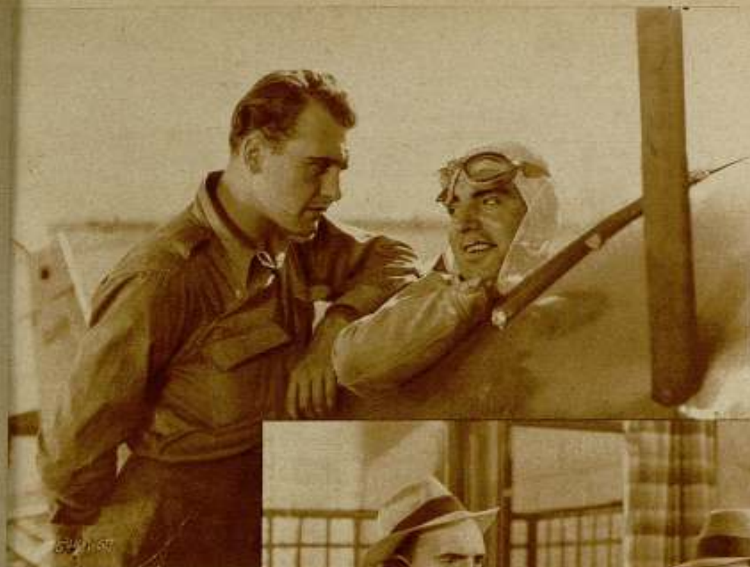
Pat O'Brien y Ralph Bellamy en una escena de «Hombres sin miedo».

prefirió asistir a otro teatro porque ya conocía la obra que tanto le habían elogiado.