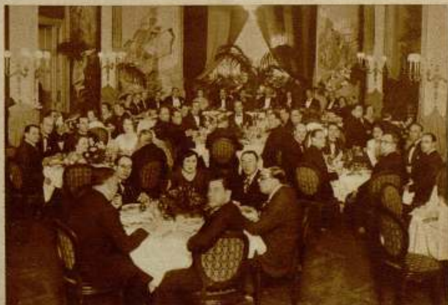
Un aspecto del banquete celebrado en el Grill Room del Hotel Ritz, para celebrar el décimo aniversario de la constitución de la Hispano Fox Films, S. A. E.

...Henry B. Walthall y Roul Walsh, ambos actuaron en «Birth of a Nation», drama de la guerra civil? Hoy se encuentran asociados en otro drama de la misma guerra en «Operador 13», con Marion Davies como estrella. Walthall