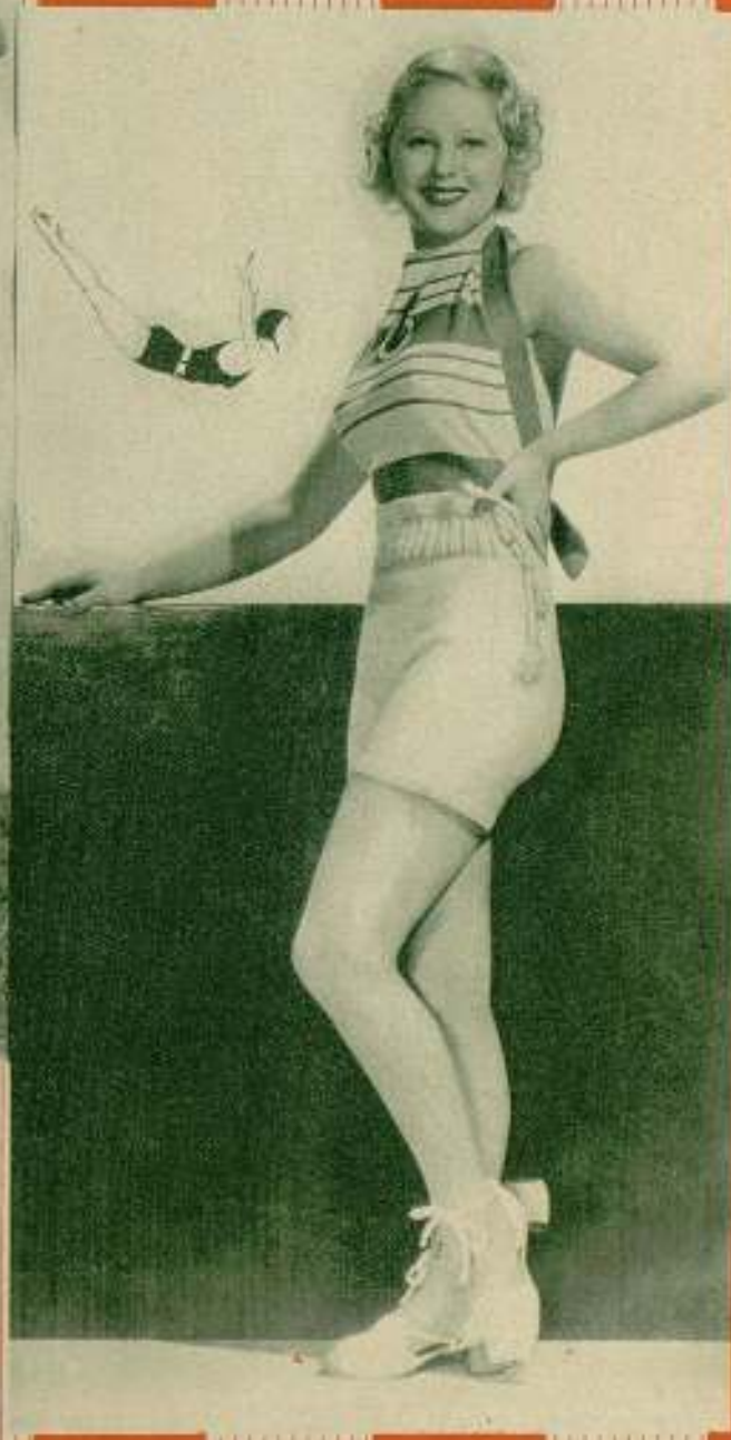
MURIEL EVANS Metro-Goldwyn