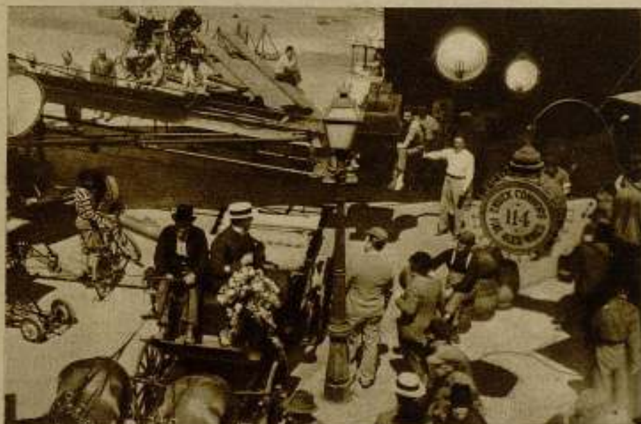
Filmando una escena de «The Bowery» (Nueva York, 1886), film de la 20th Century, interpretado por Wallace Beery, Jackie Cooper y George Egan.

El importante papel de García en la película de la Universal Pictures titulada «Uncertain Lady», le ha sido encomendado al apuesto galán mejicano Ernest Guillén, mejor reconocido como Donald Reed, que lo desempeñará al