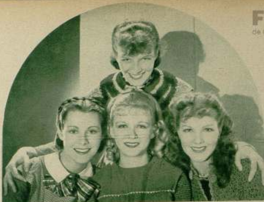
«Las cuatro hermanitas», immortalizada en la pantalla por Katharine Hepburn, Frances Dee, Joan Bennett y Jean Parker.

Y aquí podemos traer a colación una anécdota que debe