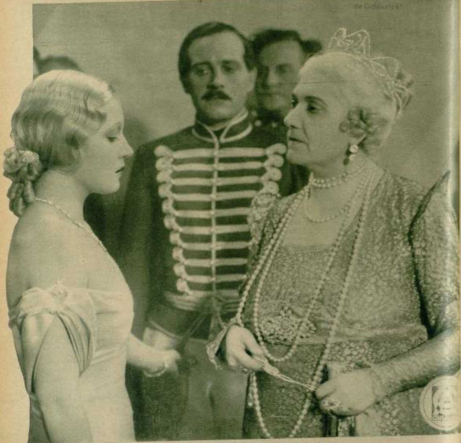
Marta Eggerth en la extraordinaria película «Vuelan mis cañones».