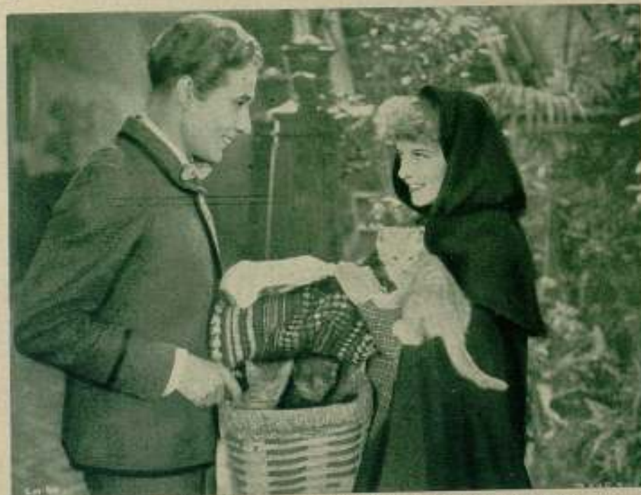
Katharine Hepburn y Douglas Montgomery en una escena de «Las cuatro hermanitas», film de la R. K. O. Radio. (Exclusiva para FILMS SELECTOS.)