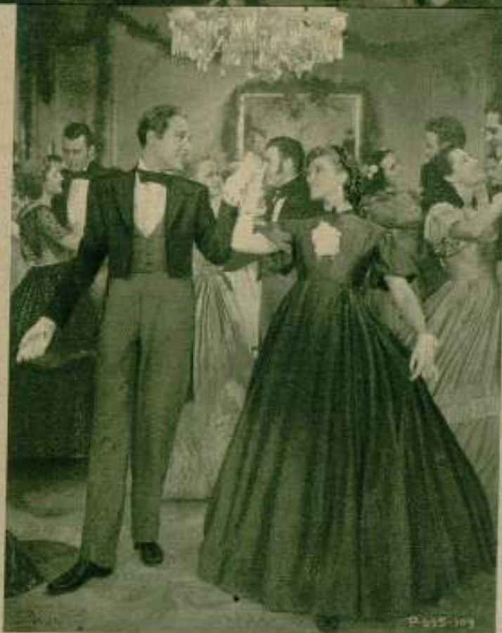
Katharine Hepburn en una escena, llena de gracia y gentileza, de la película «Las cuatro hermanitas», de la R. K. O. Radio.

El cinematógrafo ha obrado el milagro de inmortalizar en gesto y en voz a todas las figuras importantes de nuestra historia contemporánea. ¡Ya no sufrirán las futuras generaciones lo que nosotros sufrimos por no saber exactamente cómo fueron los hombres que mar-