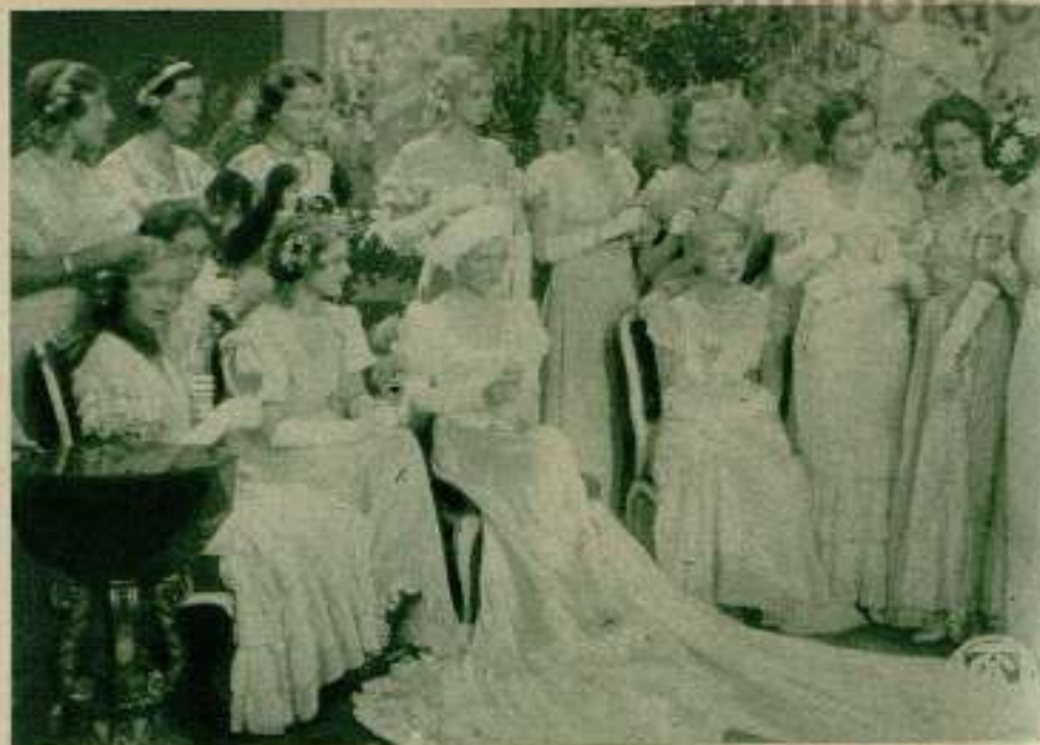
Atrayente grupo de lindas muchachas con la exquisita Martha Eggerth en la magnífica película

R AYMOND HATTON, que en un tiempo interpretó, en compañía de Wallace Berry, chistosos papeles en las comedias Paramount, vuelve ahora a la pantalla de esta editora en la producción de gran aparato escénico y sobresaliente mérito artístico, como es «Alicia en el país