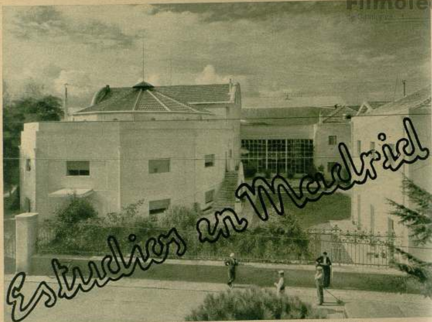
Un grupo de edificaciones blancas, limpias, recién restauradas, hiere la retina con reflejos de cortijo andaluz.

La mañana es alegre y luminosa, con esa luminosidad embusiera y traicionera que en Madrid tienen los días soleados del invierno. Días que, a través de las vidrieras, parecen esplendidos y que, una vez en la calle, hacen sentir al ciudadano el rigor de las bajas temperaturas.