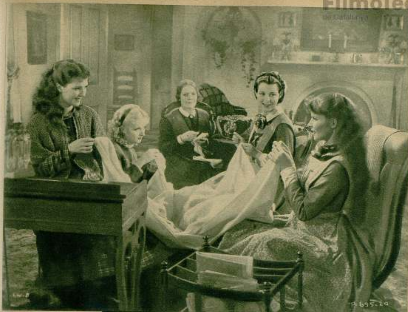
Cinco mujeres: todo el poema de un hogar normal, digno del canto de un poeta e inmortalizado en la pantalla de aluminio por la R. K. O. «Las cuatro hermanitas» ha sido el más grande triunfo cinematográfico de 1933. (Exclusiva de Mary M. Spaulding para FILMS SELECTION.)

del Polo, introduciéndose dentro de las más pavorosas montañas de nieves eternas. Ha franqueado las fronteras; ha dispersado los conocimientos; ha hecho posible que la clase media y la indigente, a la par que los privilegiados poseedores de fortuna, conozcan los remotos y misteriosos rincones del Planeta.