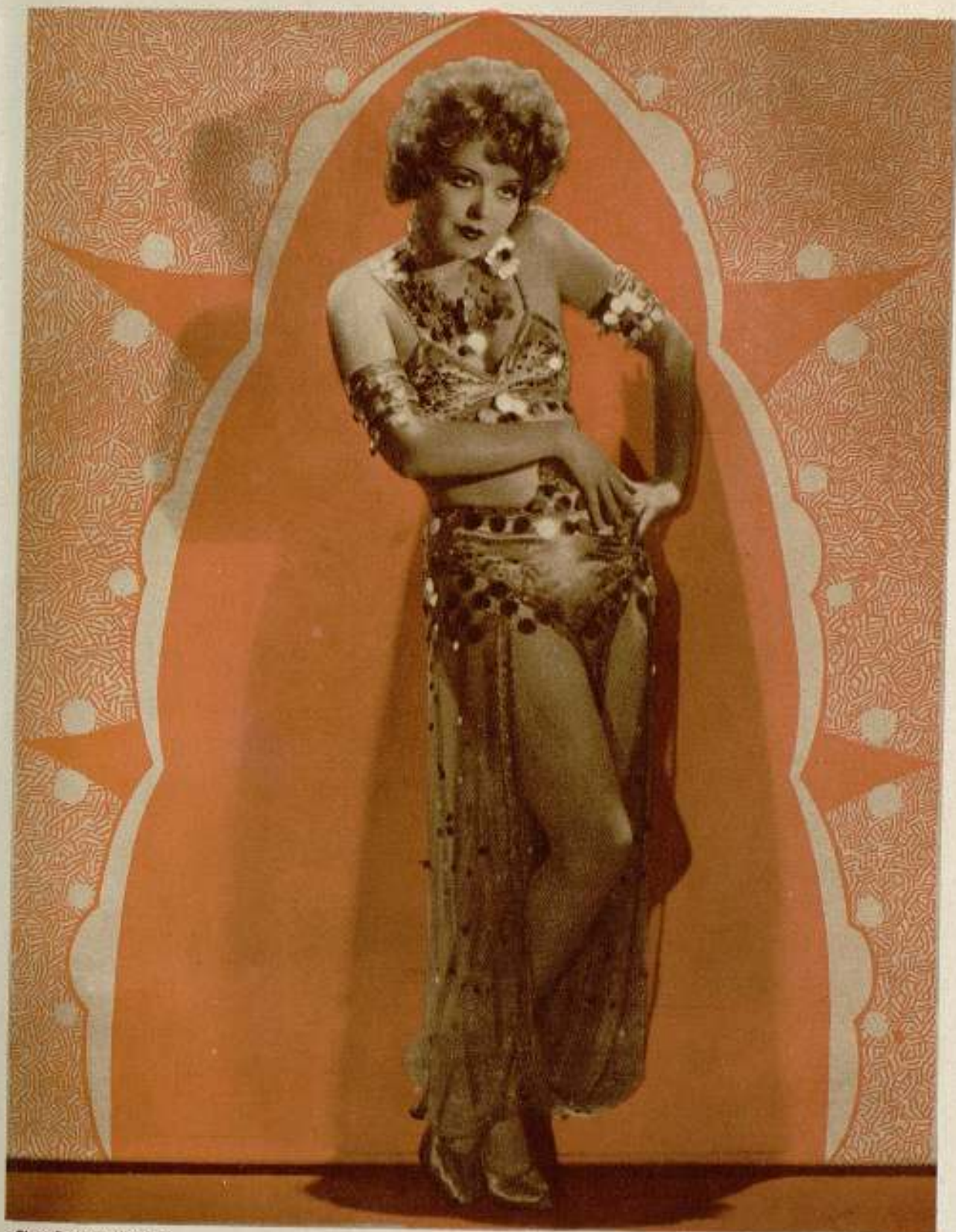
Clara Bow en «Hoopla»