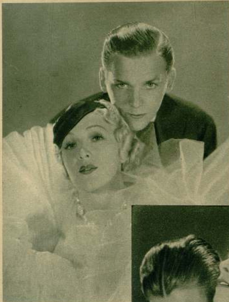
Mary Duncan es la mujer sensual cuyos atractivos carnales atraen al hombre vulgar... (Una escena de la espléndida película R. K. O. Radio «Gloria de un día», con la Duncan y Douglas Fairbanks, Jr.)

llegando a un punto obscuro, desconocido por su propia experiencia, levantaba las manos en alto y con voz patética y de profunda convicción, exclamaba: «Y ahora, señores, estáis en presencia del caos...» Nada más gráfico que la palabra «caos» para explicar la incoherencia de las escenas que pasaban frente a los atónitos ojos de los espectadores.