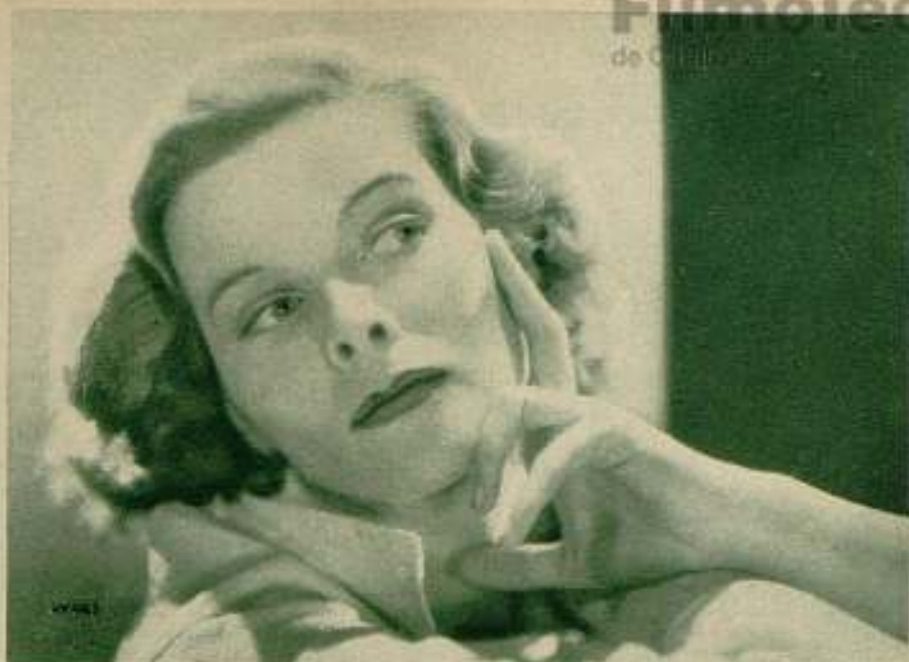
Katharine Hepburn en «Gloria de un día», donde la eximia actriz se supera en una interpretación feliz. (Especial para FILMS SELECTOS.)