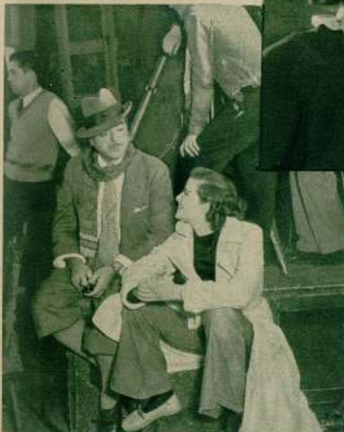
Y en el «set», en los momentos de descanso, entre escena y escena, Katharine Hepburn, la insuperable actriz, ajena a la cámara, charla con su director Lowell Sherman, a quien se debe la espléndida película «Gloria de un día», de la R. K. O. Radio. (Especial para FILMS SELECTOS.)

Las primeras exhibiciones que se hicieron en los pueblos provincianos tenían lugar en la plaza pública, al aire libre, haciendo la delicia de los golfos y desocupados. En los países fríos la ingratitude del clima no permitía estas representaciones; pero era en barracas de feria al atrayente sonido de los organillos callejeros, donde el cinemató-