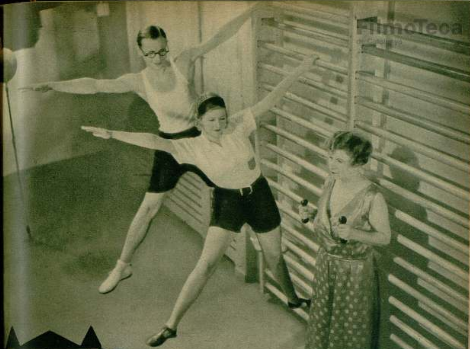
Exercicios de la divertida comedia «La señora no quiere hijos», película de Exclusivas Cines