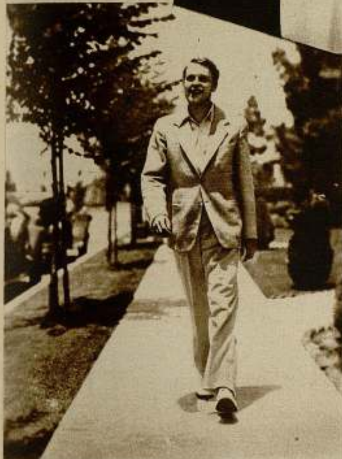
Ralph Bellamy, paseando por un parque de Los Angeles.