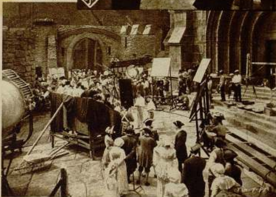
Un momento de filmación de la película Fox, «El caballero de la noche», de la que es protagonista José Mojica.