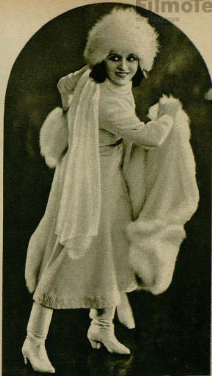
Pola Negri en dos de sus celebradas caracterizaciones.

cado y desvestirse. Más tarde, para olvidar su dolor que tantas huellas había dejado en su rostro, proyectó un viaje a Europa. Embarcó con rumbo a Francia y en el barco que viajaba, conoció al príncipe Sergio Medin. ¿Quién era este personaje que tan prontamente se adentró en el corazón de la gran trágica? Un noble de los Baikans, que hacía tiempo residía en Nueva York, jugaba a la Bolsa y poseía algunos terrenos petrolíferos. Viajaba siempre de incógnito y eran frecuentes los viajes que realizaba de Nueva York a Francia, en cuya capital se daba a la diversión y al amor. No obstante,