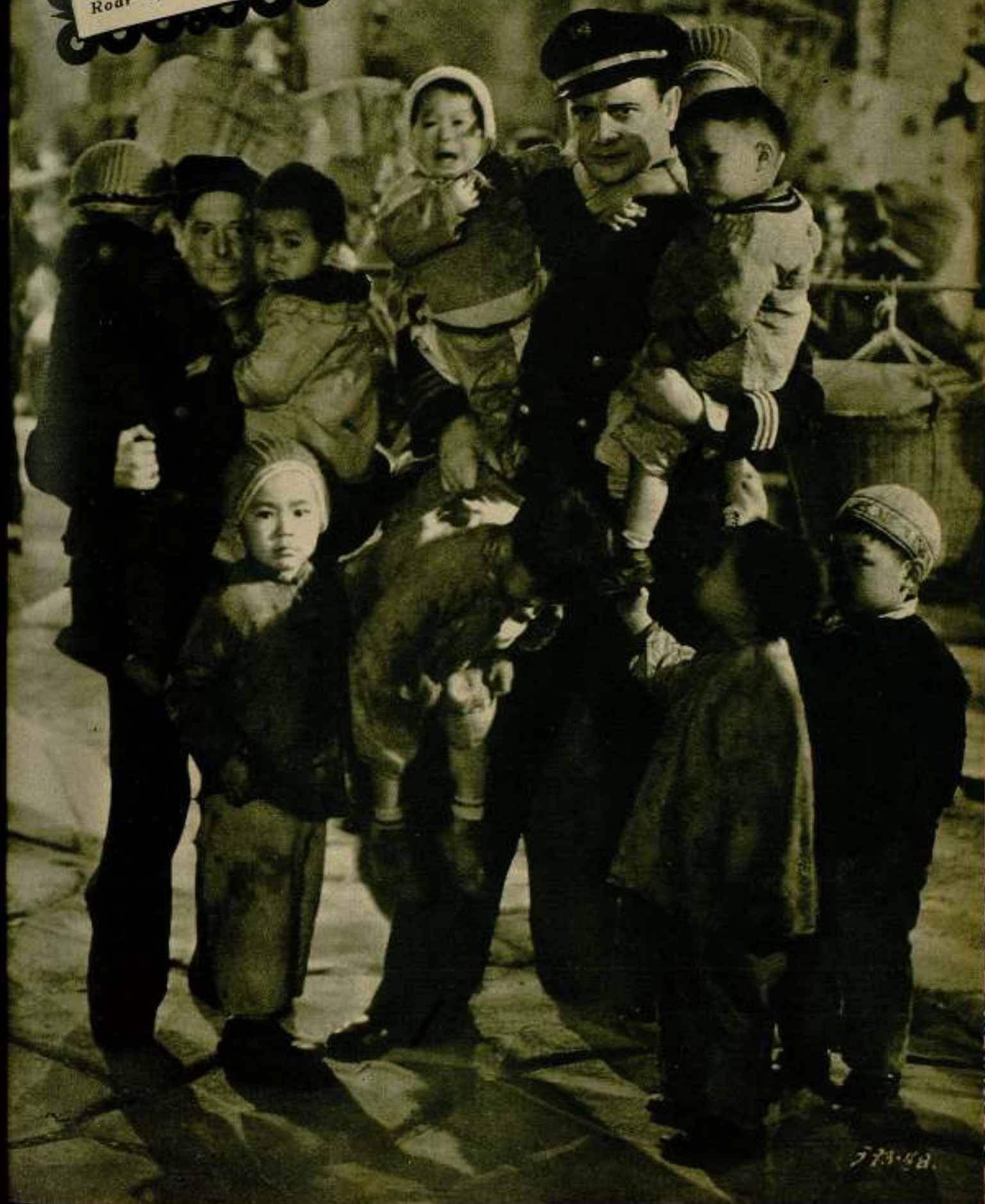
Richard Dix en una escena de la película dramática de Sice-R. K. O. «Manchuria» Roar of the dragon