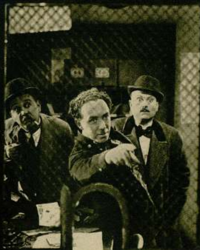
Drama de espiona- je presentado por la casa Cinac.