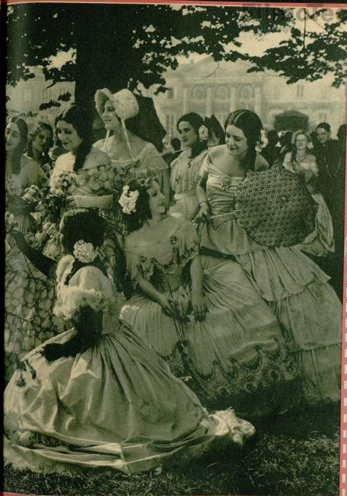
Se han rodado gran número de escenas en el «Pueblo Español del Parque de Montjuich».