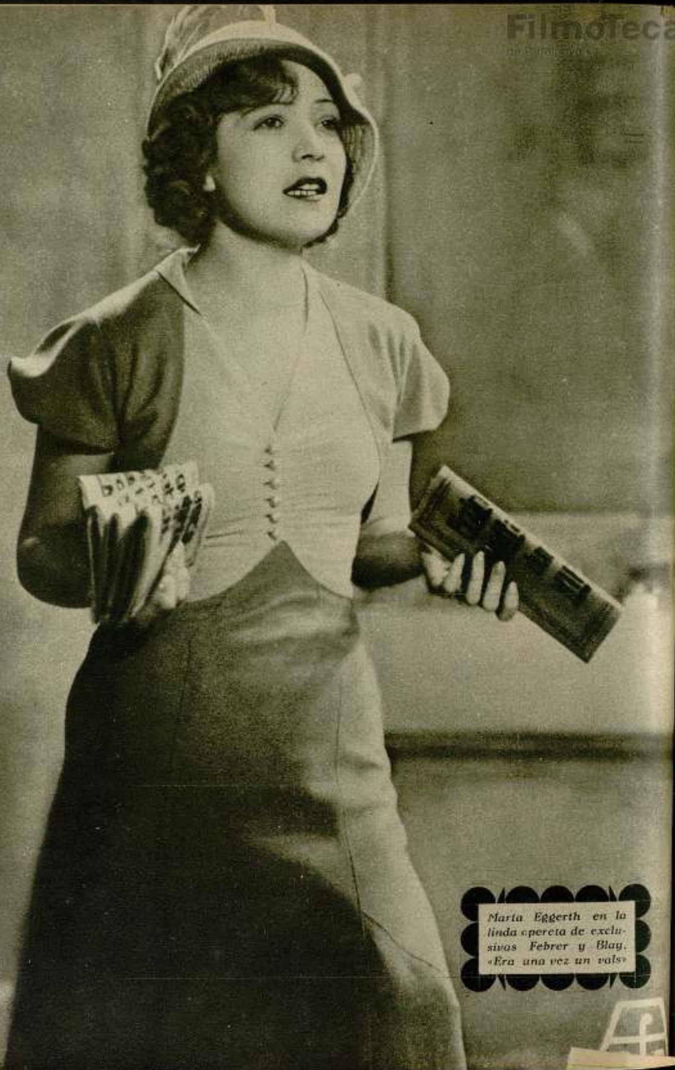
Marta Eggerth en la linda ópereta de exclu- sivos Febrer y Blay. «Era una vez un vals»