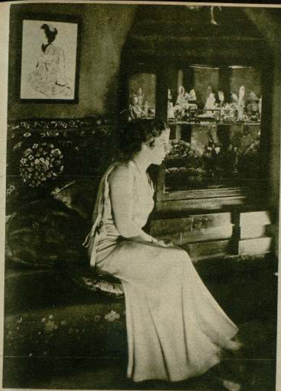
La ilustre actriz Catalina Bárcena, que ha regresado a Hollywood para continuar con la Fox la realización de películas españolas.

Jack Holt, astro de la «Columbia», mantiene el record de ser el único artista en Hollywood que jamás se ha puesto una de las tan populares boinas vascas. Dice Jack: