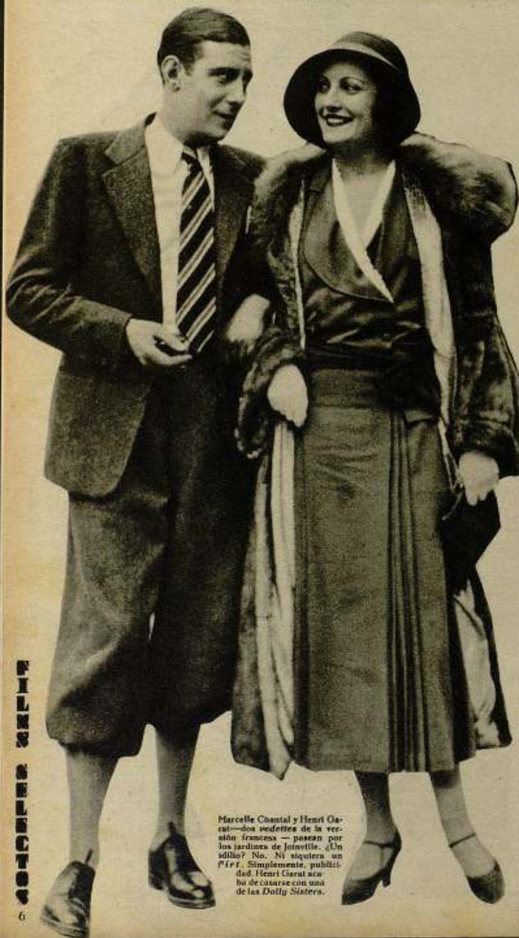
Marcelle Chantal y Henri Garat—dos vedettes de la versión francesa — posean por los jardines de Joinville. ¿Un idilio? No. Ni siquiera un flirt. Simplemente, publicidad. Henri Garat acaba de casarse con una de las Dolly Sisters.