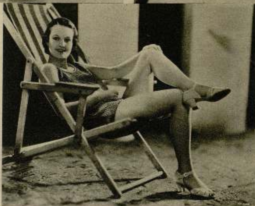
El espectáculo de unas piernas femeninas es cortante en la playa, y algunas veces maravilloso, como en el caso de Rochelle Hudson, que es la Venus de esta foto.

Realmente, la mujer parece haber recuperado algo que le faltaba. Habíamos llegado a dudar de que todas las mujeres