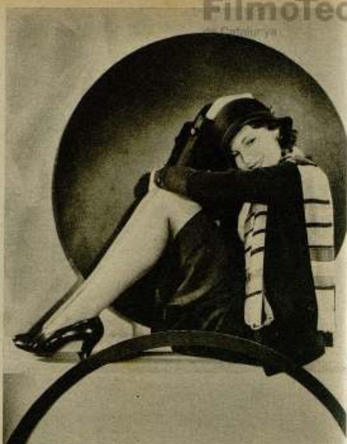
Ruth Hall no tiene nada que envidiar a Anita Page.