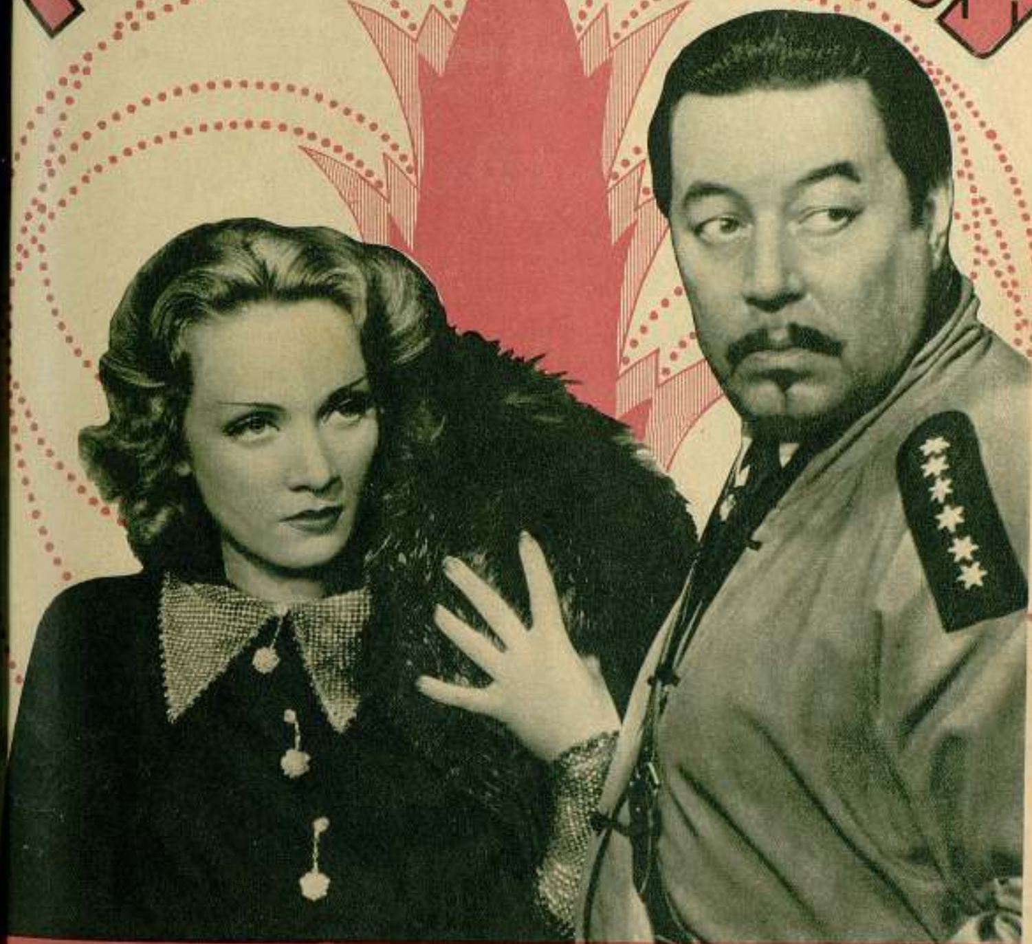
Marlene Dietrich y Warner Oland en una escena de la película Paramount "El expreso de Shang-Hai".