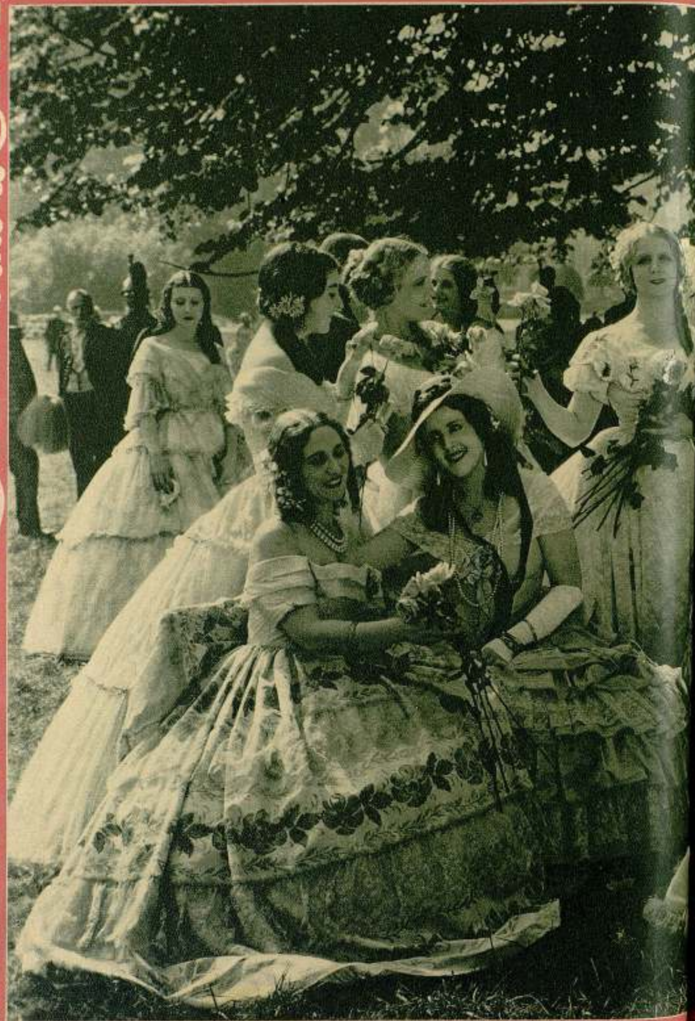
Una escena de la nueva versión sonora de la película «Violetas imperiales».