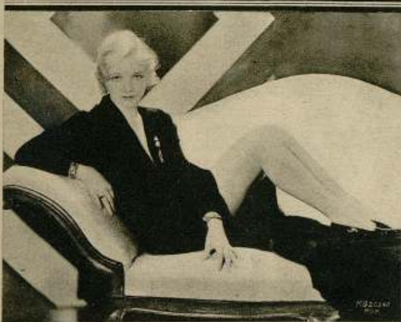
Cuando ante el objetivo posan unas piernas como las de Virginia Bruce, cualquiera es capaz de hacer fotografías maravillosas.

La revolución que ha significado la falda cortanació en Norteamérica, donde sigue conservando su hegemonía. Hace bastantes años, cuando el suelo de los Estados Unidos no era más que una gran extensión desierta y virgen, y el hombre blanco comenzó a afuir a ella para desenterrar tesoros y co-