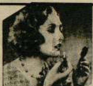
Edwina Booth, estrella de la Metro-Goldwyn-Mayer, aplicándose el lápiz «MICHEL»

evasión puede haber tres caminos: el amor, el alcohol, las drogas. Por lo pronto, el amor. ¿Qué clase de amor? ¿El hondo y puro amor de los román-