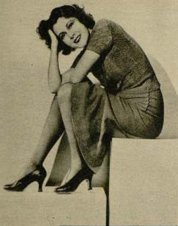
He aquí las dos finas y esbeltas piernas de Frances Dee.