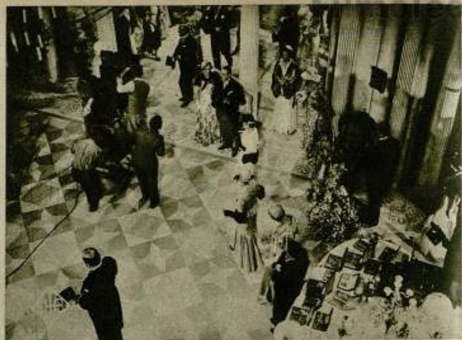
Una escena de filmación de la película Ufa, «La belle aventure».

Hans Kraly, uno de los más destacados argumentistas cinematográficos, ha sido contratado por la «Columbia» para cola-