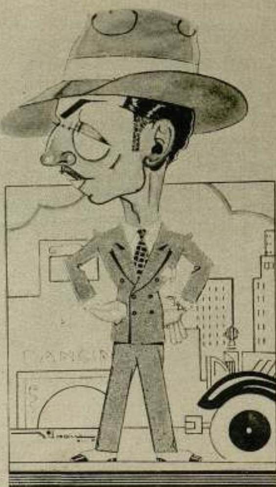
William Powell visto por Valgoma.

La novia lleva encima de la cabeza, según antigua tradición, una vallosa corona, los músicos dejan oír caprichosas melodías de circunstancia y el maestro de ceremonias dirige el festejo según las reglas legadas por un inmemorial costumbre.