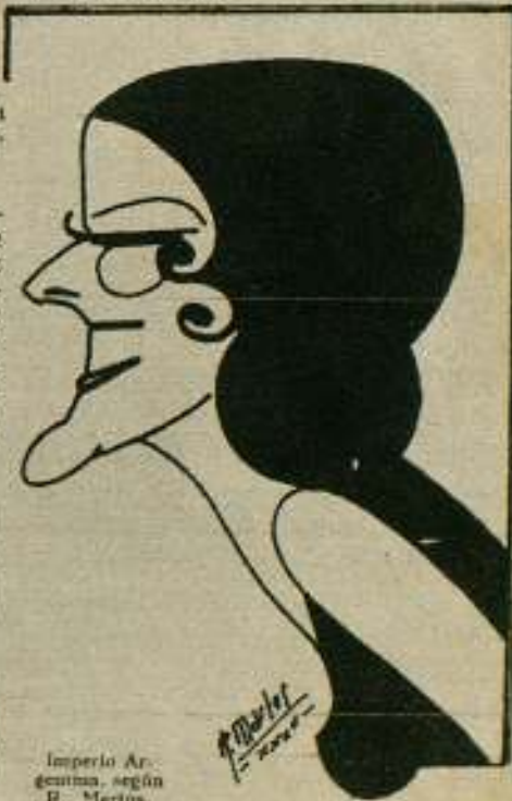
Imperio Argentina, según R. Martos.