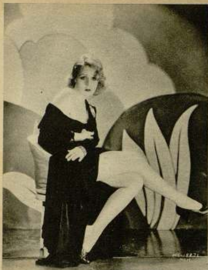
Anita Page demostrándonos que, en la parte interior, es un prodigio de forma.