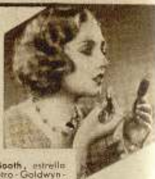
Edwina Booth, estrella de la Metro-Goldwyn-Mayer, aplicándose el lápiz "MICHEL"

Poco a poco se va sabiendo que el trabajo en los estudios cinematográficos no es ciertamente de los más ligeros. Una reciente estadística de Hollywood denota de extenuación a sus pocos profanos. Para fabricar un trozo de película que sea en cuatro minutos al proyectarse en el teatro, actores, directores y personal técnico tienen que trabajar durante toda una jornada. No es, pues, ninguna maravilla que el coste de producción de un film alcance cifras tan fabulosas.