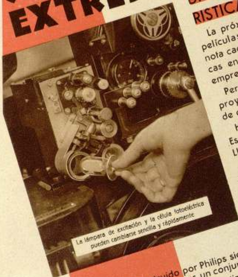
La lámpara de excitación y la célula fotoeléctrica pueden cambiarse sencillamente y rápidamente