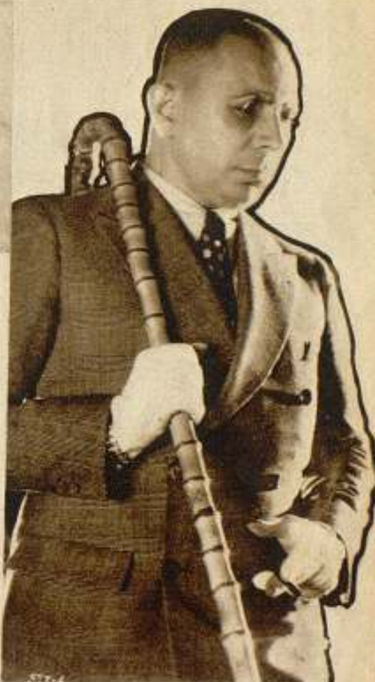
Erich Von Stroheim — a quien llaman «el director loco de Hollywood» — que en «Luna de miel» le hace el amor a Fay Wray de un modo demasiado romántico.