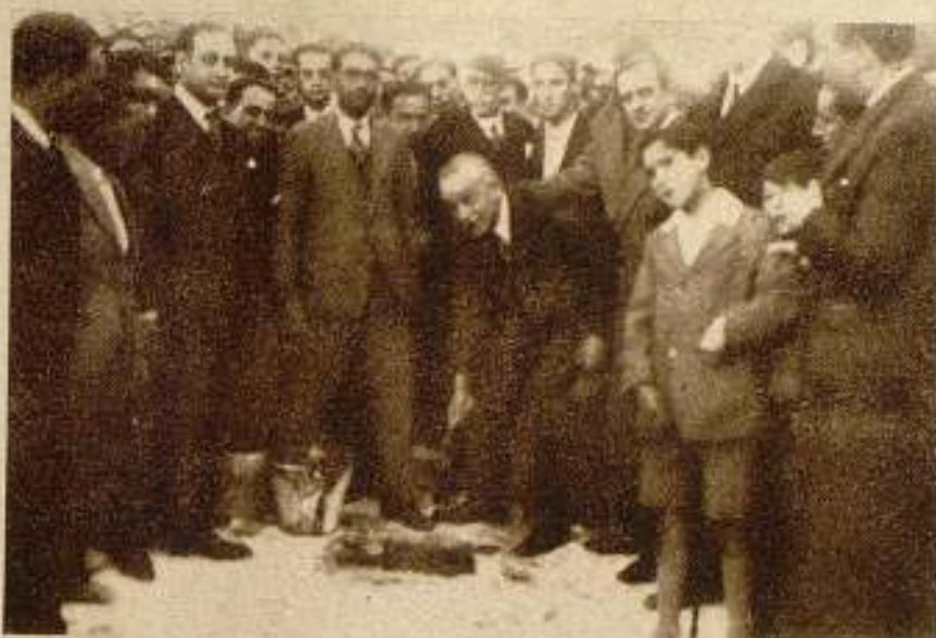
Colocación de la primera piedra de los edificios de la E. C. E. S. A. (Estudios Cinema Español, S. A.), por el director general de Bellas Artes, en los terrenos cedidos a tal fin por el pueblo de Aranzuegui.

Sin atrevernos a proferir augurios, simpatizamos; eso sí, con la conducta de una sociedad industrial que comienza por no erigirse en coto cerrado a nadie y que, al revés, pide su concurso a cada uno, aspirando a llegar a cada uno