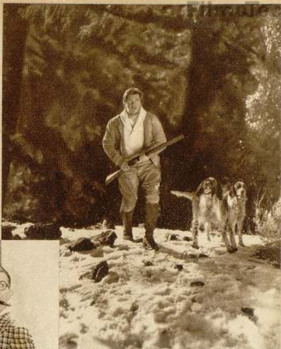
Lejos de Hollywood y del mundanal ruido... — George Bancroft, eminente primer actor y estrella de la Paramount, sorprendido por la cámara en su retiro de la Sierra de California dedicado a la caza.

mente se aplica a trajes o vestidos, sino a cualquiera otra prenda que sea visible a la cámara cinematográfica.