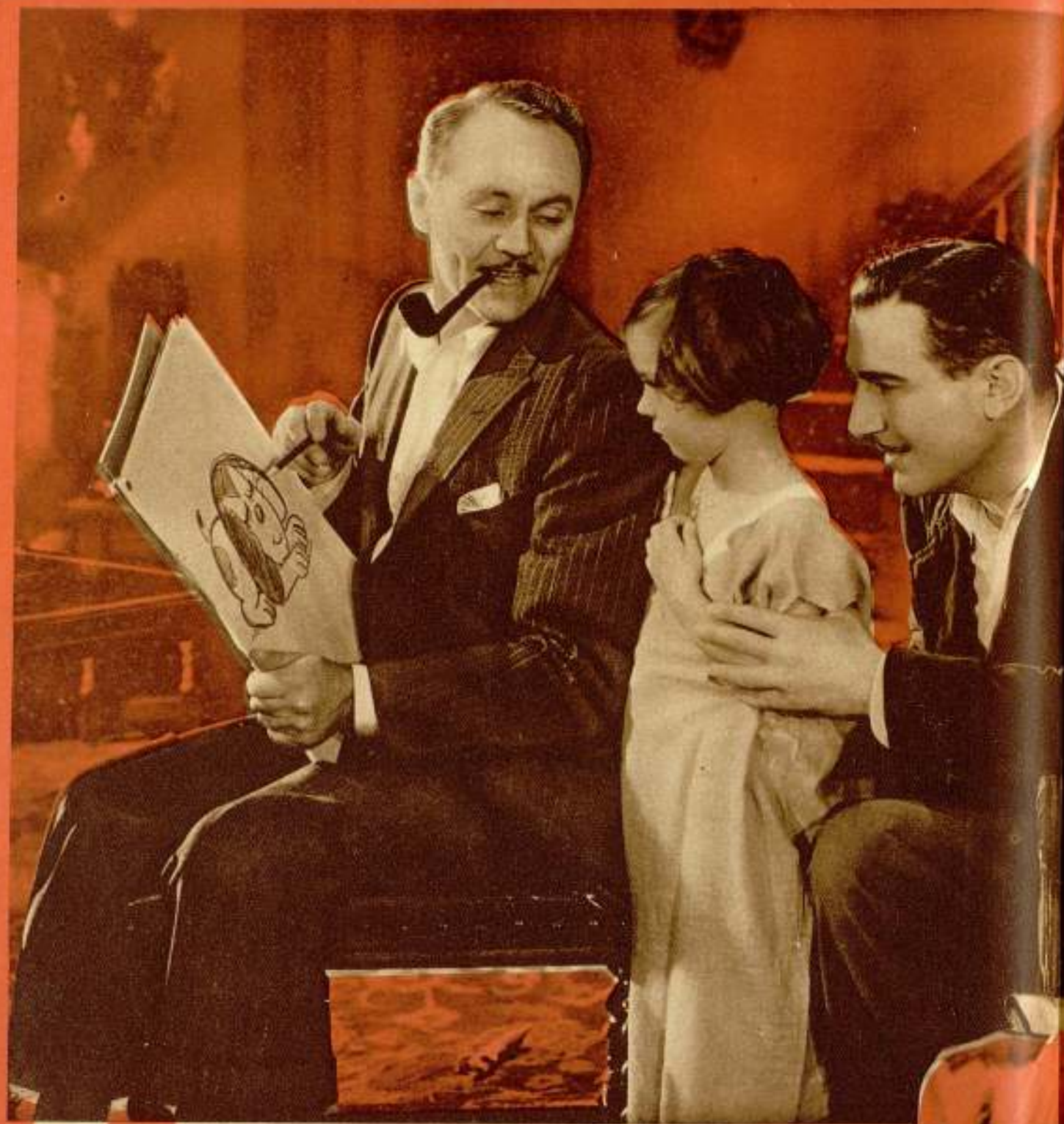
Dos escenas de la película Paramount "La conquista de papá", de la que son protagonistas Paul Lukas, Dorothy Jordan, Charlie Ruggles y Vivienne Osborne.