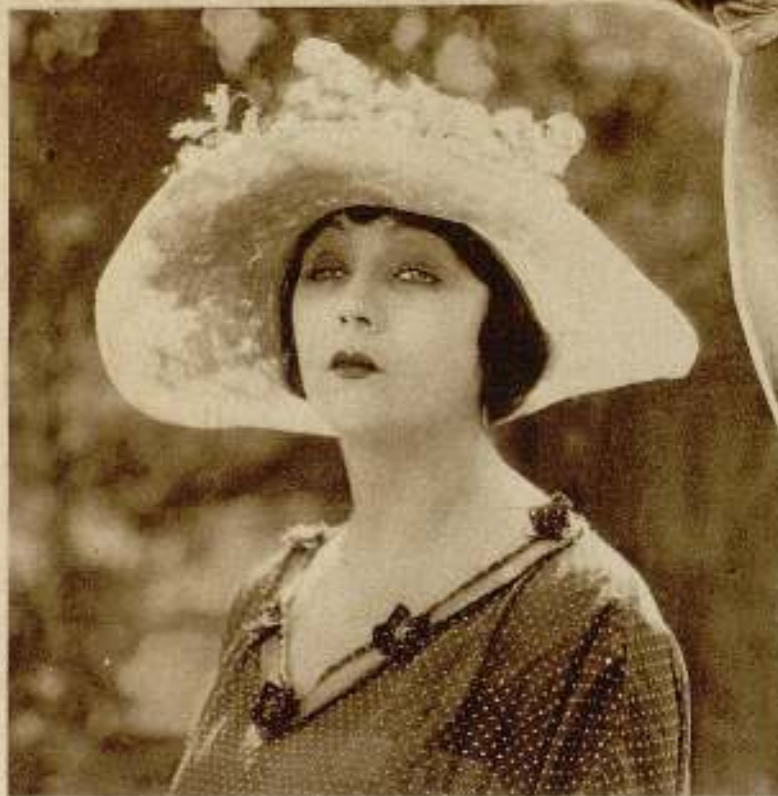
Bárbara La Marr, detentadora del campeonato matrimonial, que parece ser pretende arrebatárselo John Gilbert.