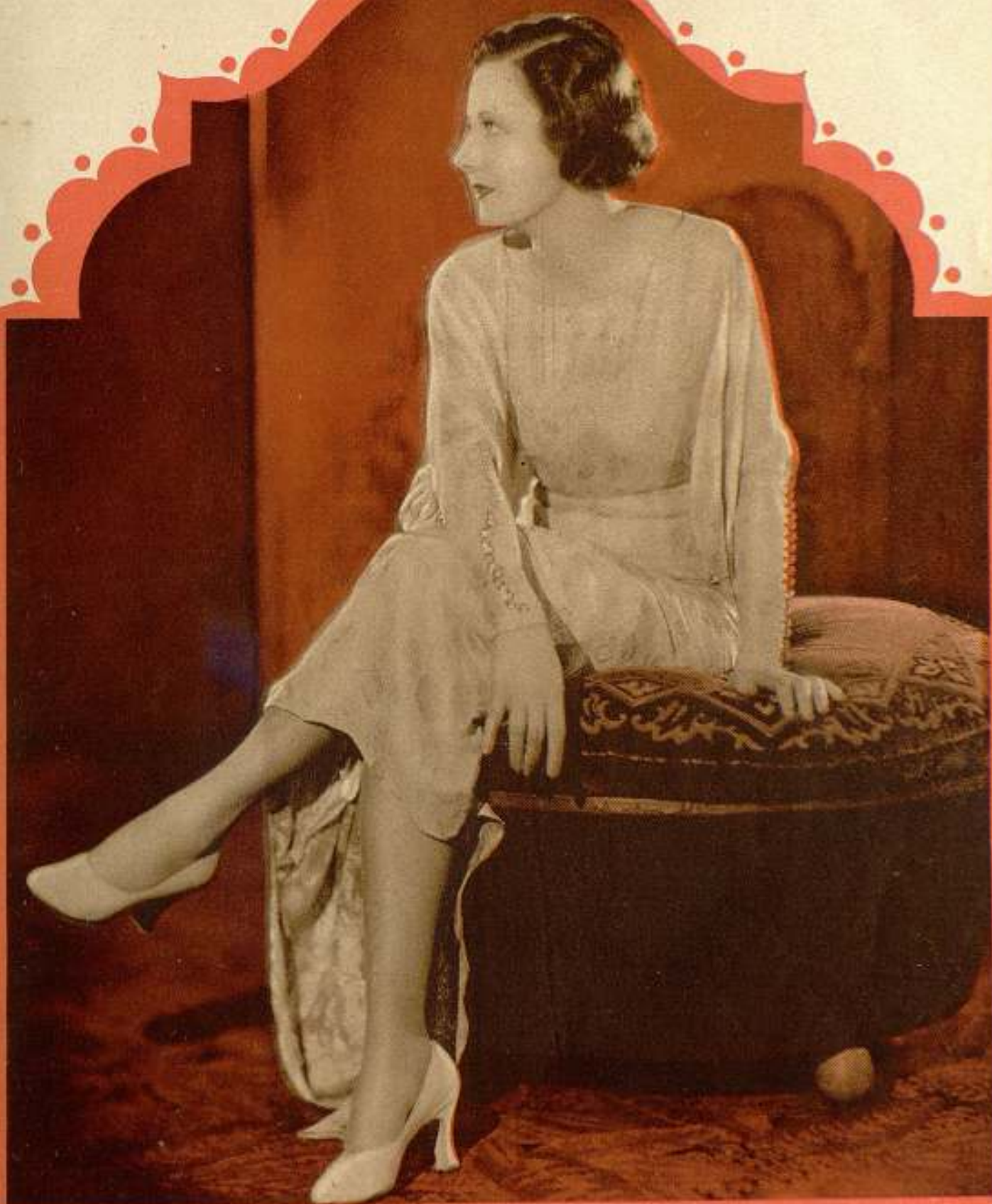
Irene Dunne posa exclusivamente para FILMS SELECTOS, luciendo un riquísimo traje de sociedad bordado con plata y cuentas diamantinas. Esta heroína de "Cimarrón" acaba de hacer una labor digna de elogio en la película sentimental "La sintonía de los seis millones", fruto de la pluma de Fannie Hurst (autora de "Humoresque"), y la R. K. O.-Radio tiene reservado para miss Dunne el papel principal de la película por rodarse "Trece mujeres".