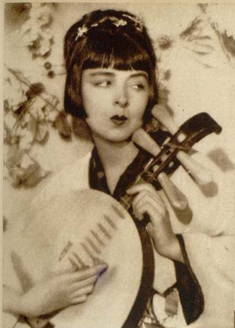
Colleen Moore, que reaparece en la pantalla, aunque desprovista de su personalísimo y popular flequillo.

taría echarles por la mañana unos puñaditos de comida. Pero ni hablar de películas. A ella la había arrinconado cruelmente el cine sonoro y ella no quería acordarse para nada de los films que le habían dado y le habían quitado todo.