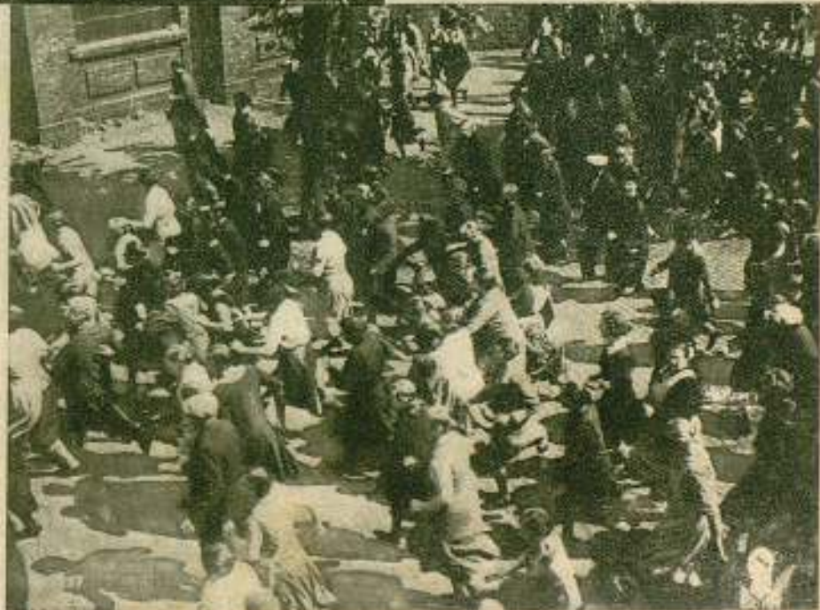
La «masa» adquiere una gran preponderancia en las películas modernas como en esta escena de «Carbón»

Ahora, a su pesar, los personajes del cine ruso toman vida independiente, propia, y empiezan a desprenderse, a defi-