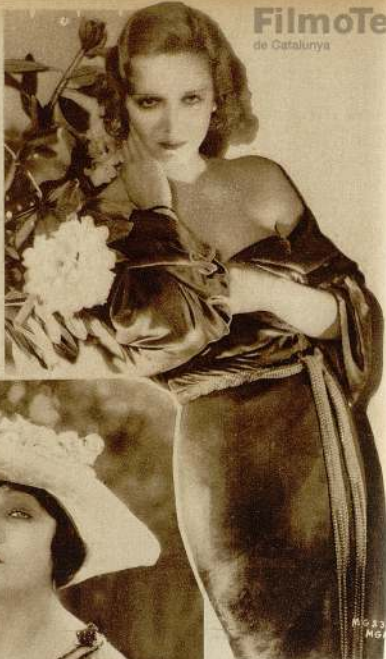
Virginia Bruce, que será la quinta esposa de John Gilbert.

Hace tres años, hablamos derramado sobre Colleen Moore las lágrimas impresas de la despedida. Colleen era el primer gran flequillo de la pantalla, y tras él se fueron, por unas u otras causas, los flequillos de Lya de Putti, de