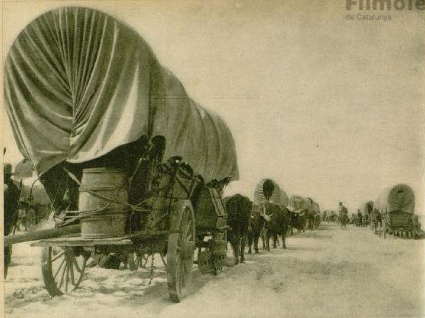
Las largas caravanas de carros entoldados son también representación de la masa.