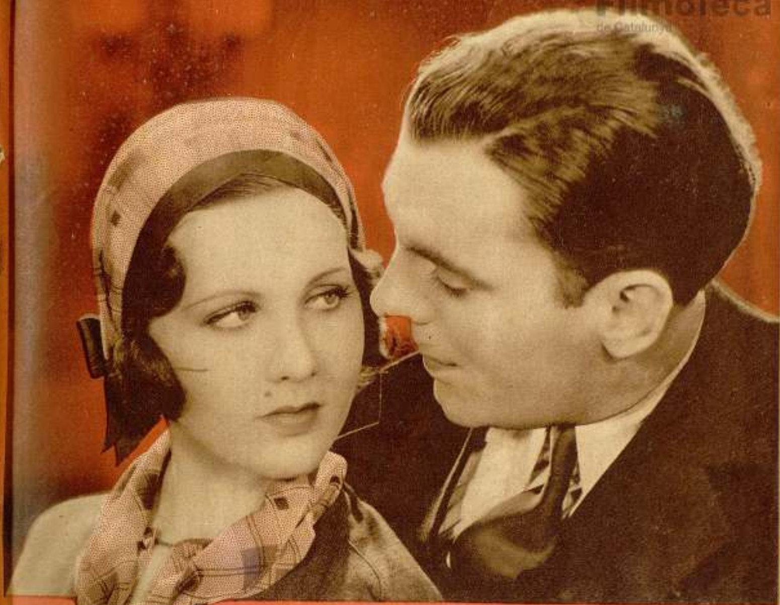
Pat O'Brien y Mary Brand en la película de Artistas Asociados "Un gran reportaje".