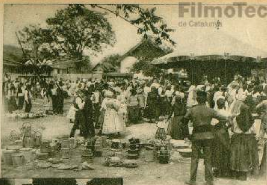
La masa, el público anónimo, da colorido y carácter a esta escena de la película Ufa «Melodía del corazón».

vana del Oregón», epopeya inolvidable, es la cinta ejemplar, el modelo de producción de «masas» netamente americana. Mas en ella, aunque la fuerza, el ímpetu y la expresividad artística de la caravana, son tales que le convierten en protagonista, no faltan los rostros destacados de los que el realizador — sin conseguirlo del todo — quiso que fueran sus héroes... Es el mismo caso del film alemán, en «Metrópolis», y del francés en las recientes producciones de René Clair. En unas y en otras dijérase que la lucha entre el héroe y la masa se entabla, franca y decidida, en espera de ver quién quedará victorioso... De un modo general, en el cine americano, lo colectivo se ha hecho atrás, y el individuo ha vencido a la multitud. Apenas aparecidos en el lienzo los ido-