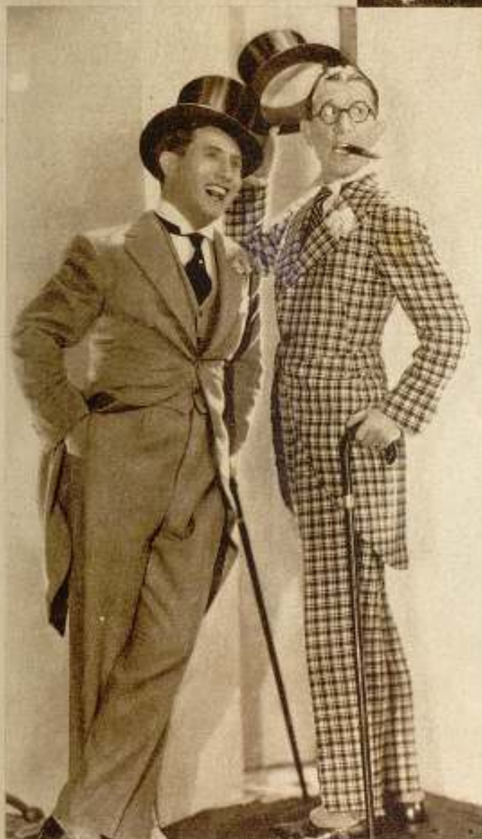
Robert Woolsey y Bert Wheeler en la chispeante comedia R. K. O., de con- fesión reciente, «El paraíso del divorcio». (Exclusiva para Puntos Selectos.)

Una estrella no puede usar su propia ropa en una película a no ser que posea dos o tres prendas de la misma tela y del mismo corte. Esto no sola-