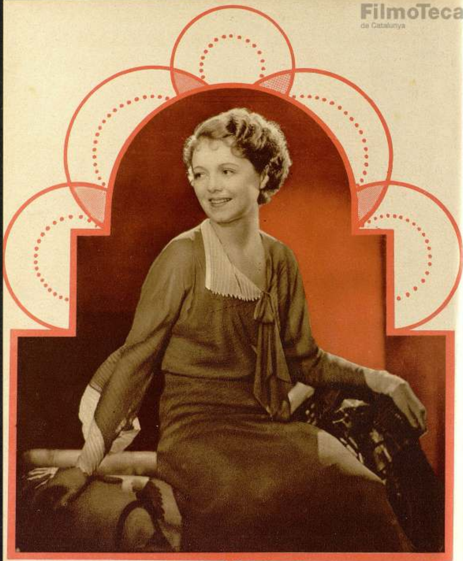
Ultimo retrato de la gran estrella de la Fox JANET GAYNOR