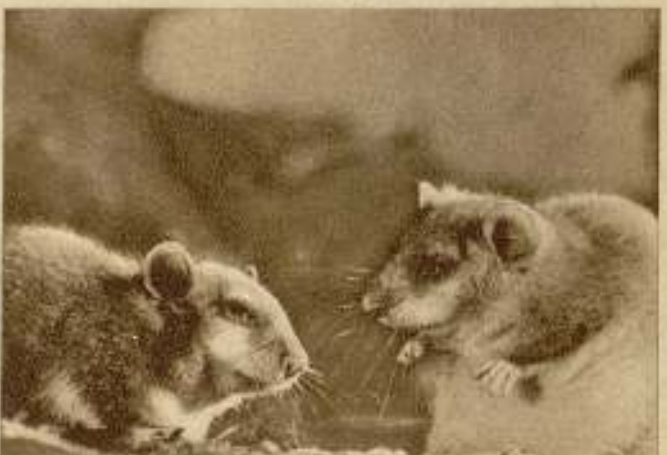
La vida de los lirones. — (Edilio).