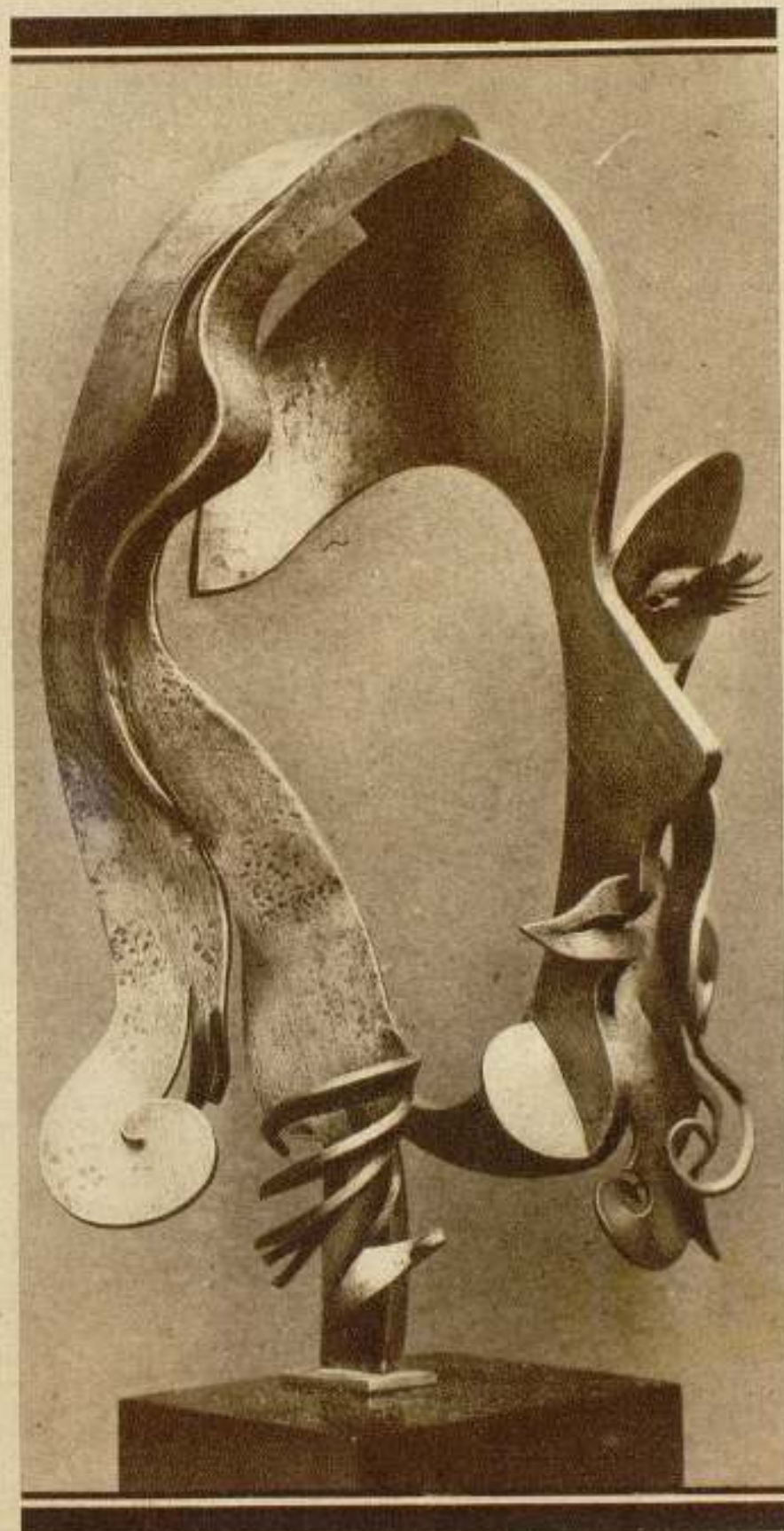
Original, bellissimo y moderno retrato de Greta Garbo, hecho por el gran escultor español Pablo Gargallo.

Indudablemente, el famoso galán ha tenido como compañeras de trabajo grandes artistas, que a la vez han sido hermosas mujeres. Pero una cosa es ser gran artista y gran belleza, y otra ser Greta Garbo. Como mujer y como estrella, Greta es algo excepcional, que no