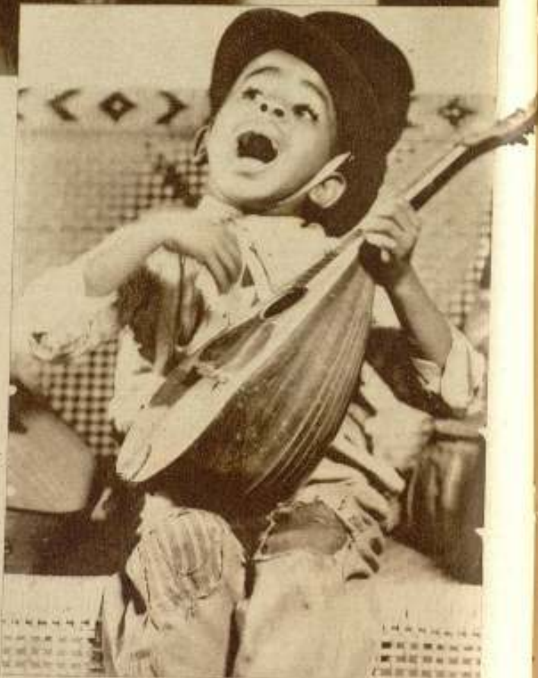
El pequeño Stymio, reciente adquisición de Hal Roach para las comedias de «La pandilla».

Los negros han puesto en la árida vida soviética un granito de sal de ternura con una chispa de gracia, de diferenciación. Son cariñosos, dulzones, de movimientos armoniosos y cadencioso hablar. Mirándoles pasar, la gente sonríe complacida y cordial. Ellos sonríen también, mostrando sus dientes blanquísimos. Y pasean, únicos ociosos entre los atareados, en espera de la faena prometida y desde lejos contratada. «La faena» es una próxima película de carácter soviético-social.