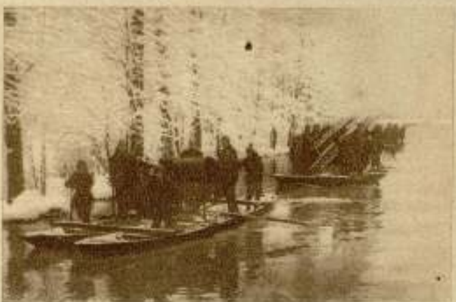
El invierno en el Spreewald. — El servicio fluvial de bomberos.