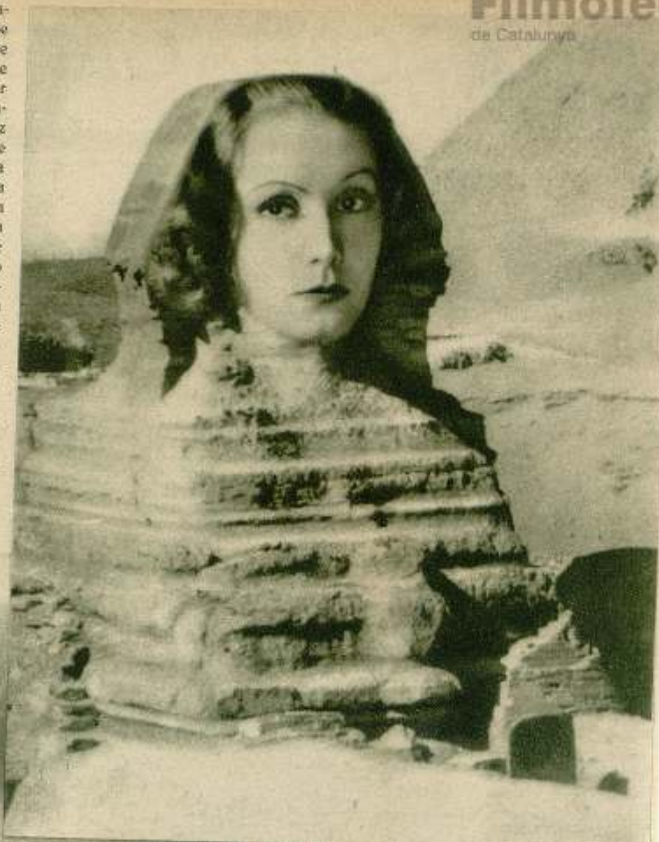
Simbólica fotografía de Greta Garbo, la enigmática esfinge de Hollywood.

Greta Garbo dedicada a la pesca, el deporte o distracción que permite más abstracción y soledad.