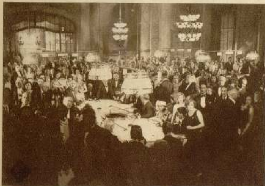
Una escena de la película Ufa «Bombas en Monte-Carlo», en la que se puede apreciar la riqueza del decorado y del ambiente.

En el Parque de Exposiciones de la puerta de Versalles, en París, tendrá lugar en los días 27 de octubre al 15 de noviembre del presente año, una Exposición Internacional del Cinema y de las Industrias relacionadas con el mismo. La Exposición comprenderá multitud de secciones, subdivididas en clases, y recogerá todos los aspectos, múltiples y variados, de la industria del film. Ha sido patrocinada por miembros del Gobierno, del Parlamento, por Sindicatos y por numerosas personalidades y entidades directamente relacionadas con la cinematografía.