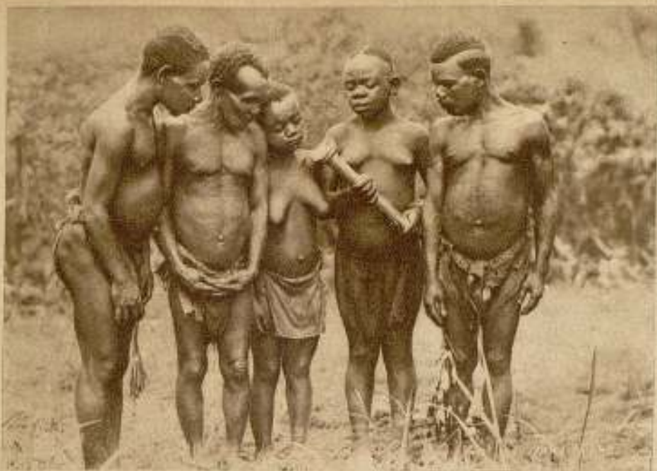
Un grupo de negros pigmeos que actúan en la película Fox, «Cangaris».

FOTOGÉNICA, es curiosa la contradicción que se da en el hombre negro, en la mujer negra... Negación de la fotogenia, por el negativo color de su tez, por lo uniforme de su tonalidad — antítesis de lo blanco, que es todo fotogenia — resulta, en cambio, amable a la cámara por la pureza de líneas de su figura, y — sobre todo — por la extraordinaria vivacidad de sus movimientos. Por su especialísimo sentido del ritmo. Por esa curiosa tendencia a lo acelerado y a lo retardado, que va desde la languidez al descoyuntamiento y que le da, con respecto a la cámara, una rara identidad.