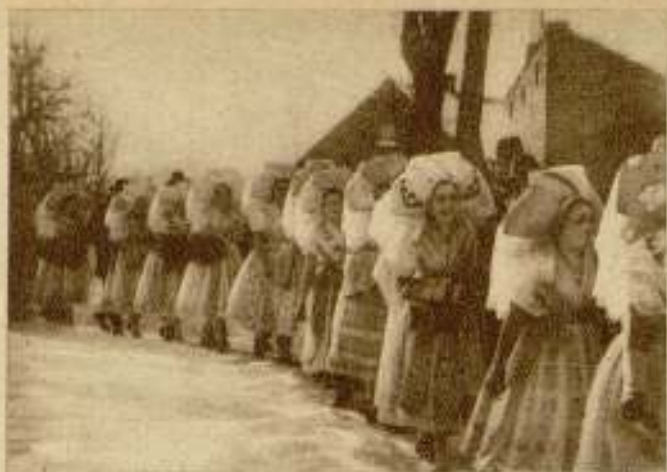
El invierno en el Spreewald. — Muchachas en traje de fiesta.

Después, cuando con los años va llegando el raciocinio, cuando han intentado emprender un