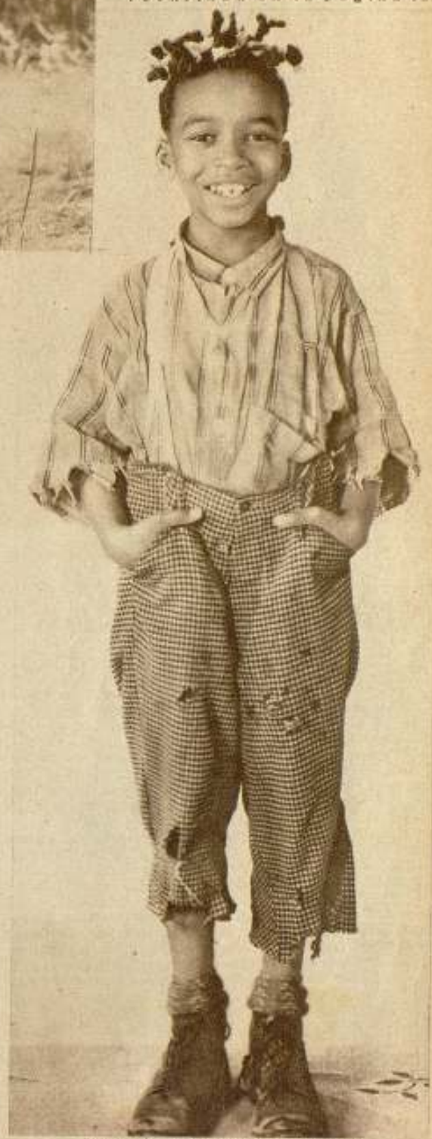
«Farina», el popular personaje de la infantil «La Pandilla», que tiene malicia común al rústico.