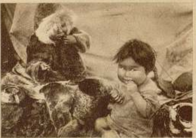
Paisajes de Groenlandia. — El aceite de pescado es una golosina para los pequeños esquimales.

derrotero firme, se han visto precisados a recuperar aquellos años perdidos. ¿Fueron ellos los culpables? Seguramente, no. Ni quizá lo fuera el maestro. Ni tampoco eran menos inteligentes que sus compañeros, los aplicaditos... Es un defecto del sistema. La mayoría de las veces sería preciso hacer un examen de las condiciones físicas del niño con el fin de deducir si su naturaleza le capacita o no para realizar el esfuerzo mental que requiere el estudio constante.