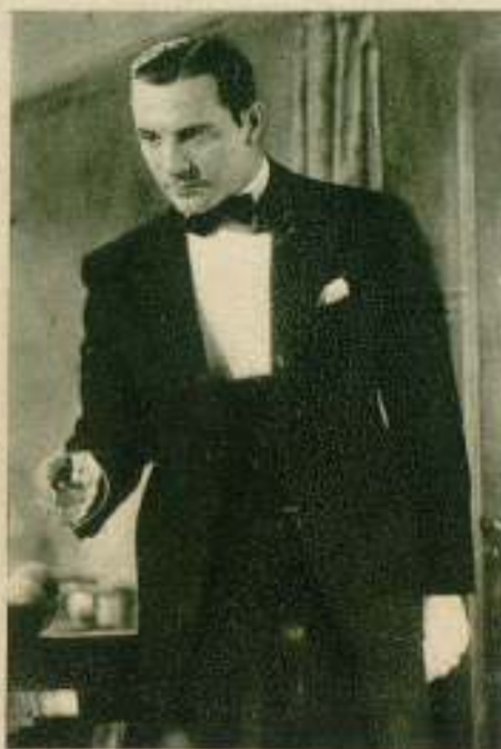
Ricardo Cortez en una escena de la película Paramount «La insaciable».

Ahora Ricardo Cortez no tiene aquella melancolía ni aquel decaimiento moral de cuando vivía Alma Rubens y se le conocía por el sobrenombre de «el segundo Valentino». Tampoco su arte es el mismo. El Ricardo Cortez de hoy es más optimista y más artista que antes. Su talento artístico ha sabido, por fin, resolver el problema que afectaba a su personalidad, puesto que ahora ya tiene la suya propia. Se ha encontrado a sí mismo, tras haber luchado por ahuyentar aquella otra personalidad que en realidad se la llevó con la muerte Rodolfo Valentino.