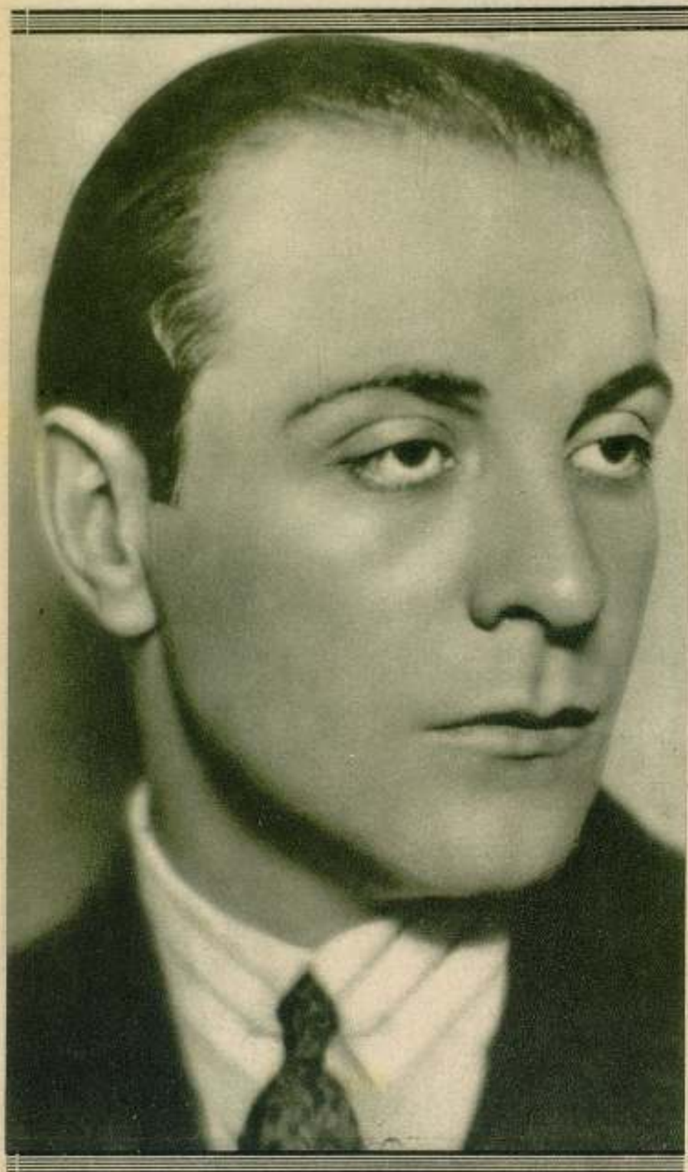
Ricardo Cortez, en los tiempos de su aparición en las pantallas, tenía, en verdad, un extraordinario parecido con el llorado Rodolfo Valentino.

EL ARTISTA A QUIEN LA ENFERMEDAD DE ALMA RUBENS SUMIÓ CASI EN EL OLVIDO, HA VUELTO A CONQUISTAR SU ANTIGUO PRESTIGIO