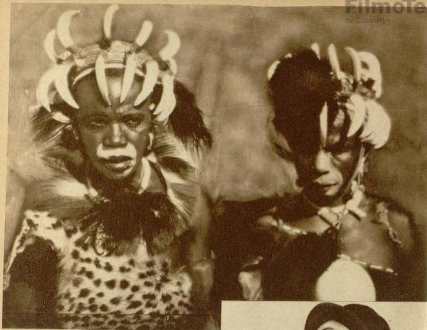
Los negros que vimos en «Trader Horn», cuyo interés fotográfico reside en lo raro y desconocido de su indumento.