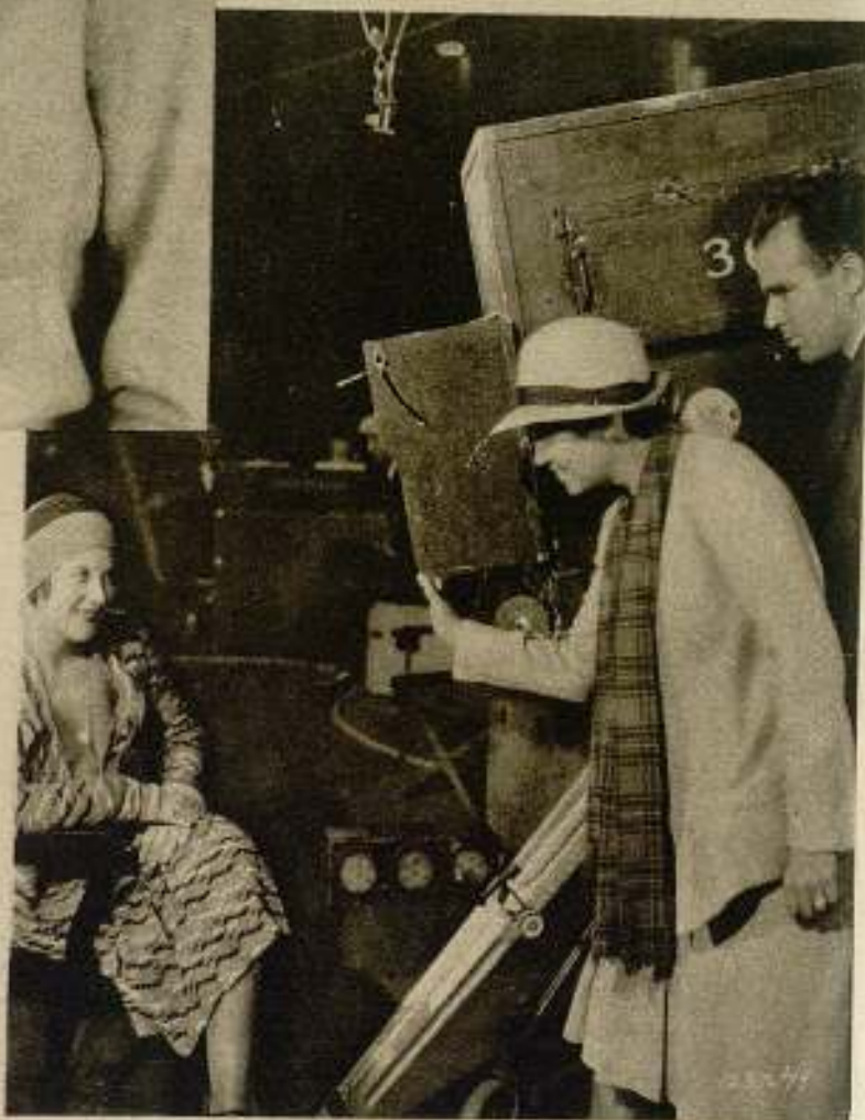
Dorothy Arzner, ejerce aquí su autoridad con Ruth Chatterton durante la filmación de una de las escenas de la versión inglesa de «Sarah and Son».

Con frecuencia se presenta el caso del actor de