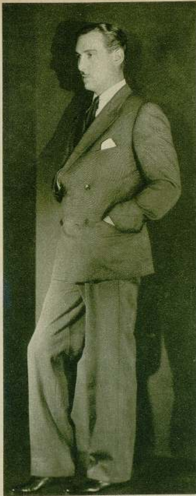
Paul Lukas en una escena de «Manhattan Cocktail», en la que actuó como protagonista, junto a Nancy Carroll y Richard Arlen.

Nació a bordo de un tren. El futuro astro de la pantalla tenía tal prisa por venir al mundo que no esperó a que el tren que traía a su augusta madre llegara a Budapest... Y fué así como una preciosa mañana de mayo, olorosa a flores y brillante de sol, Paul Lukas hizo su aparición en el mundo, mientras el tren corría a una velocidad de setenta millas por hora. Después, cuando el tiempo llegó, Paul comenzó sus estudios en la capital del reino húngaro. Allí, y muy joven aún, sintió por vez primera el anhelo de dedicarse al teatro.