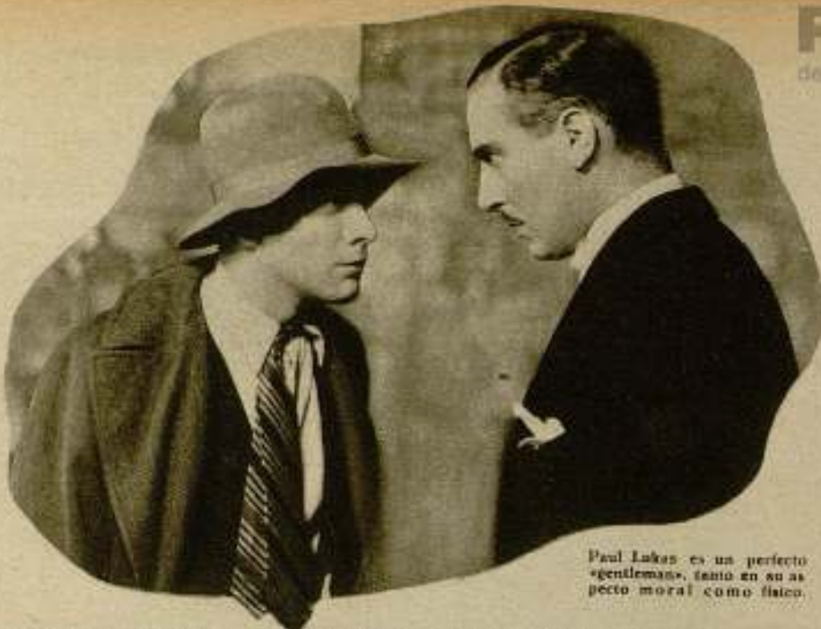
Paul Lukas es un perfecto «gentleman», tanto en su aspecto moral como físico.