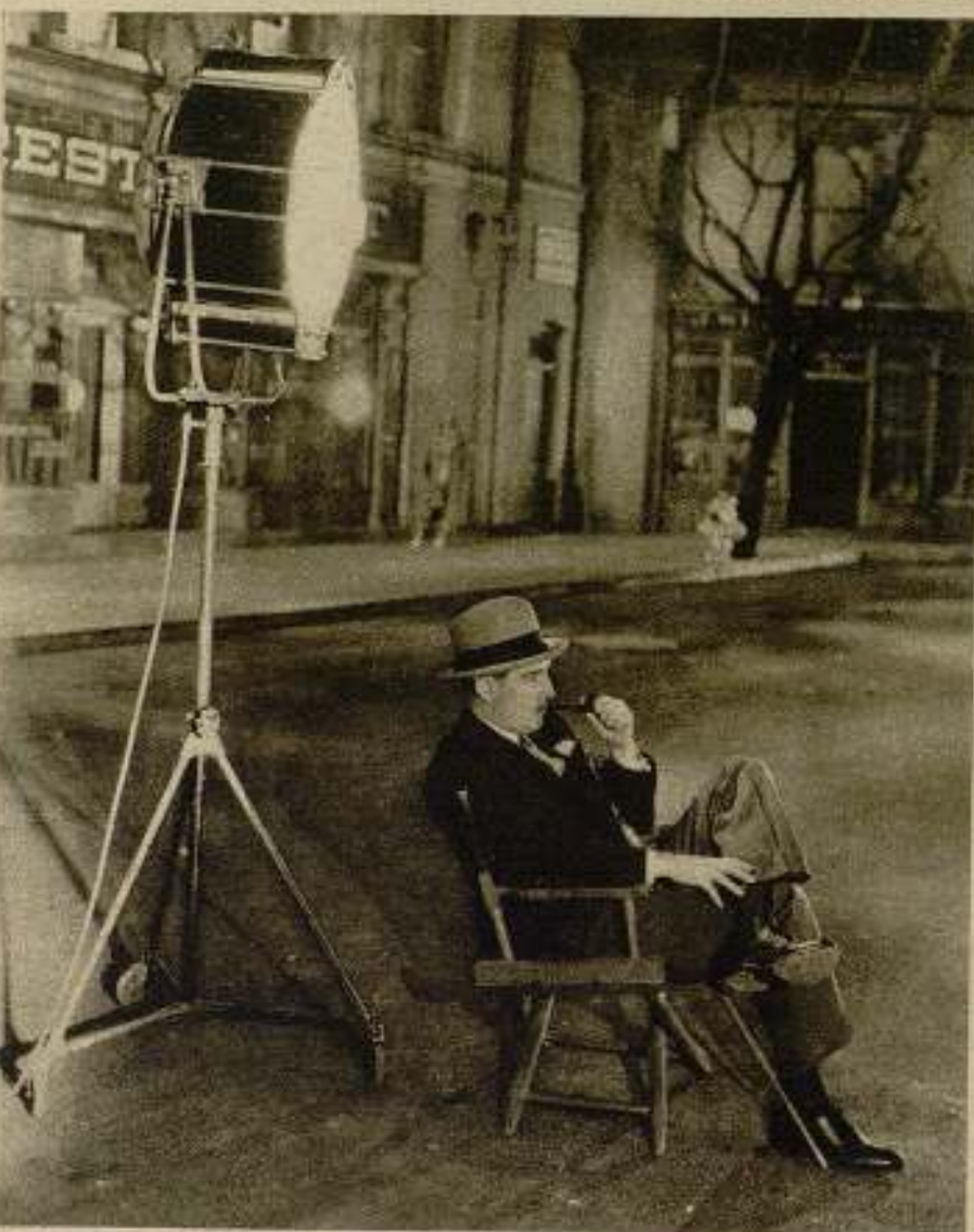
Paul Lukas es atento espectador durante la filmación de una escena de «The Vice Squad», film Paramount, en que hace el primer papel.