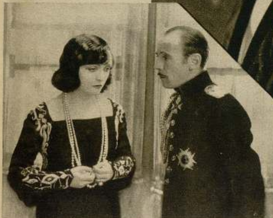
Pola Negri y el actor Roland Young, en una escena de «La mujer manda», película en la que reaparece la famosa vampiresa después de una larga temporada alejada de los estudios cinematográficos.

Pola Negri en la época que, enamorada de Valentín, obtenía los más rotundos éxitos en la pantalla.