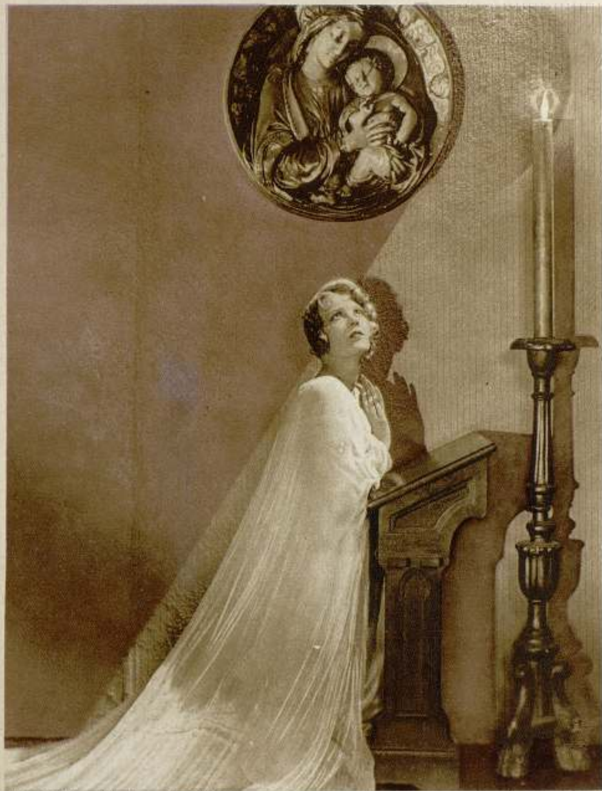
"La oración", por Anita Page, actriz de la Metro