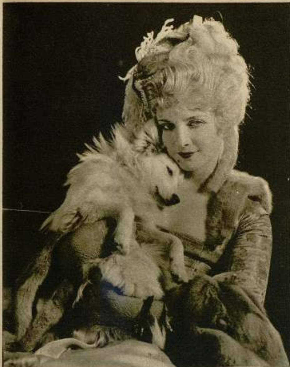
Alice Terry, en «Sourmouche», una de sus más notables creaciones.

hoy que fué ordenanza del director, escenógrafo en los estudios o «extra» simplemente.