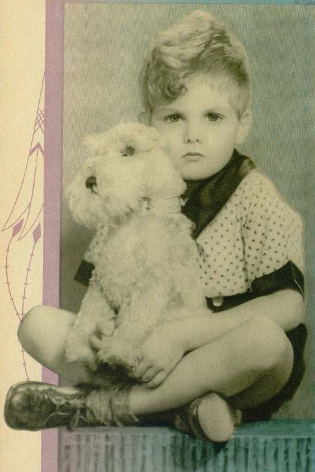
CARAS NUEVAS Dickie Moore, celebrado actor infantil que recientemente ha entrado a formar parte de la famosa "Pandilla"

H E He dec ada la han res Bie ma bie gie par la te tor men tor Rac ha sie mis ble F do Le pre dich duc dad y de mó Her prue tiga ada escri gos «Có las orde logó de A carg prin H más sese en u pres das en lo les Ta n auto nota dias tos, hono crea