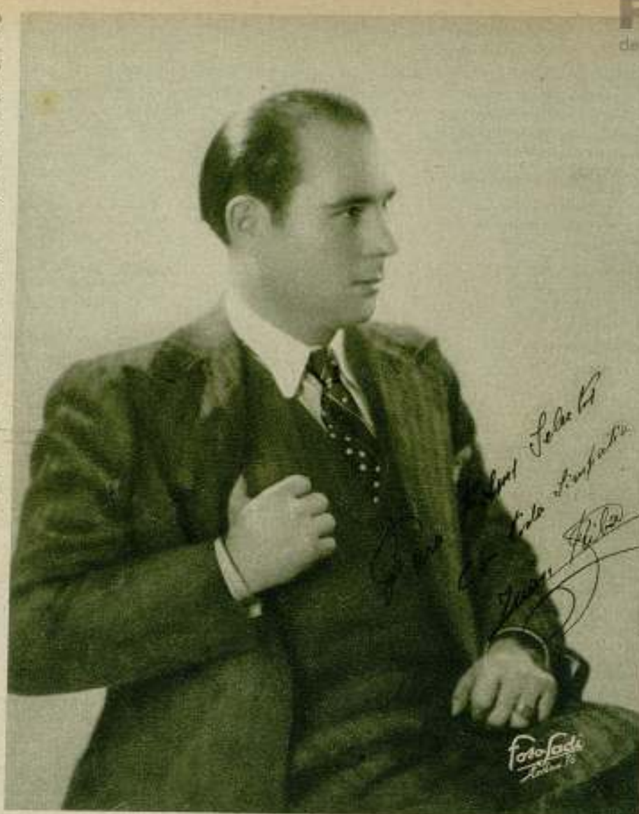
LA POLÉMICA DEL CINE