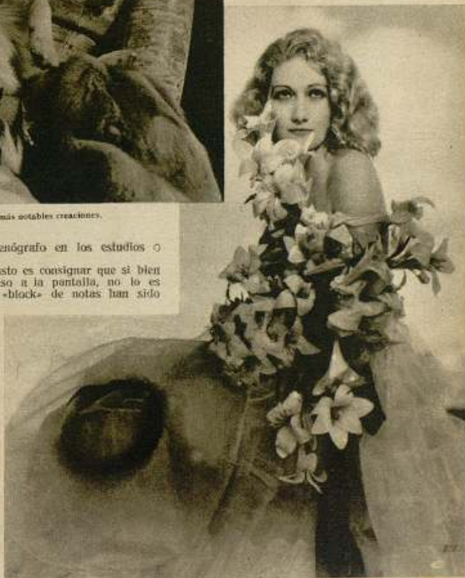
Viendo este retrato de Edwina Booth, con los lirios de Pascua, nadie creería que esta delicada rubia se atreviera a desatir los terrors de las selvas africanas durante la filmación de «Trader Horn», la gran película de la M.-G.-M.