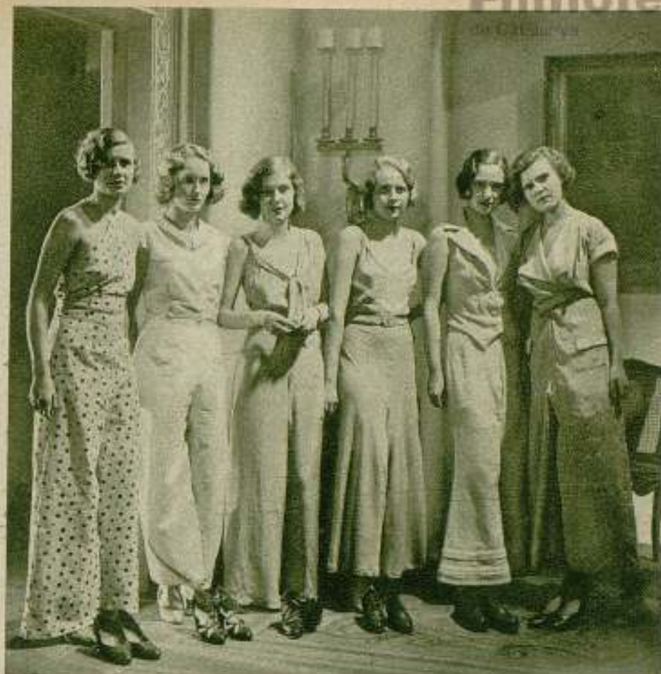
Las millergirls que actúan en la película Ufa, «Ein Toller Einfall».

Además de Zita Johann, Harriet Hagman, Bruce Cabot, Phyllis Clare y Leslie Banks, completan la media docena de caras nuevas la escandinava Gwili Andre, Gwili Andre ya lleva varias semanas ensayando con Richard Dix y