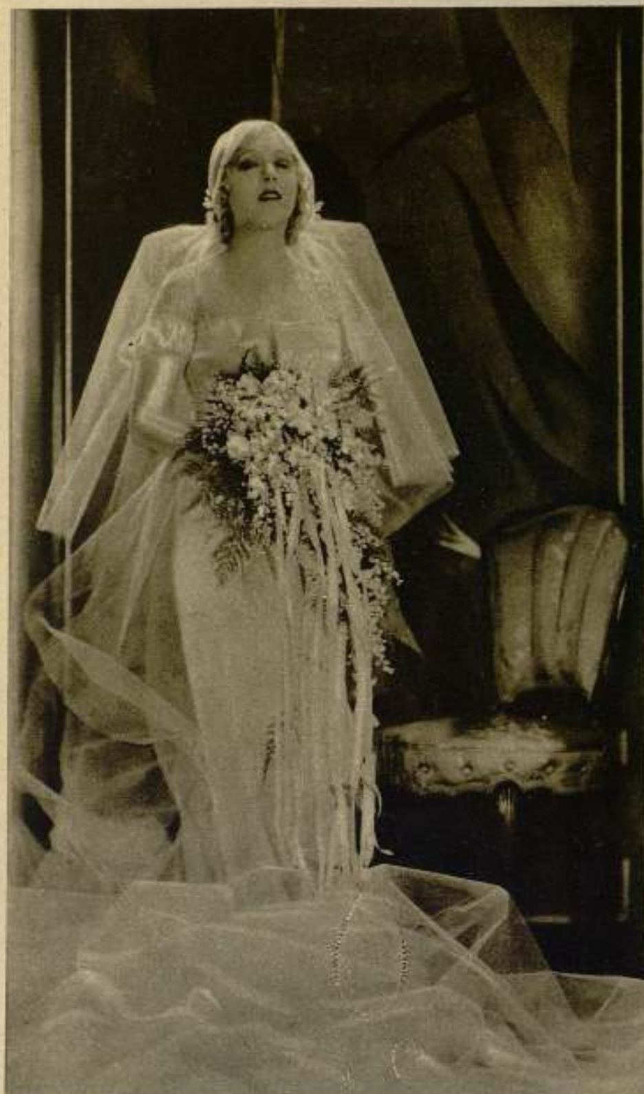
Mae Murray, la veterana actriz, que se escurre hoy por la pendiente del fracaso por querer convertirse en actriz dramática.