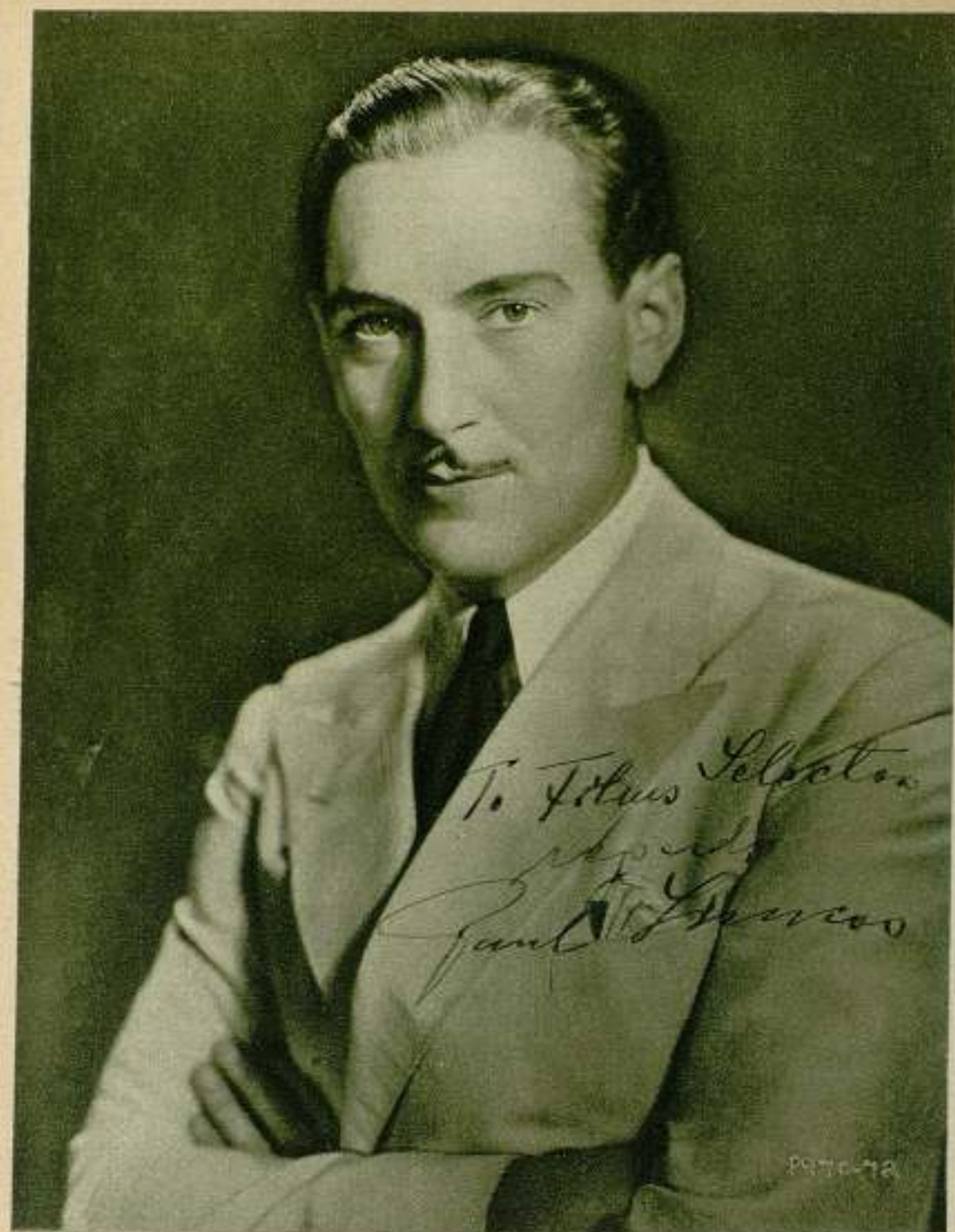
ESCENA Y PANTALLA