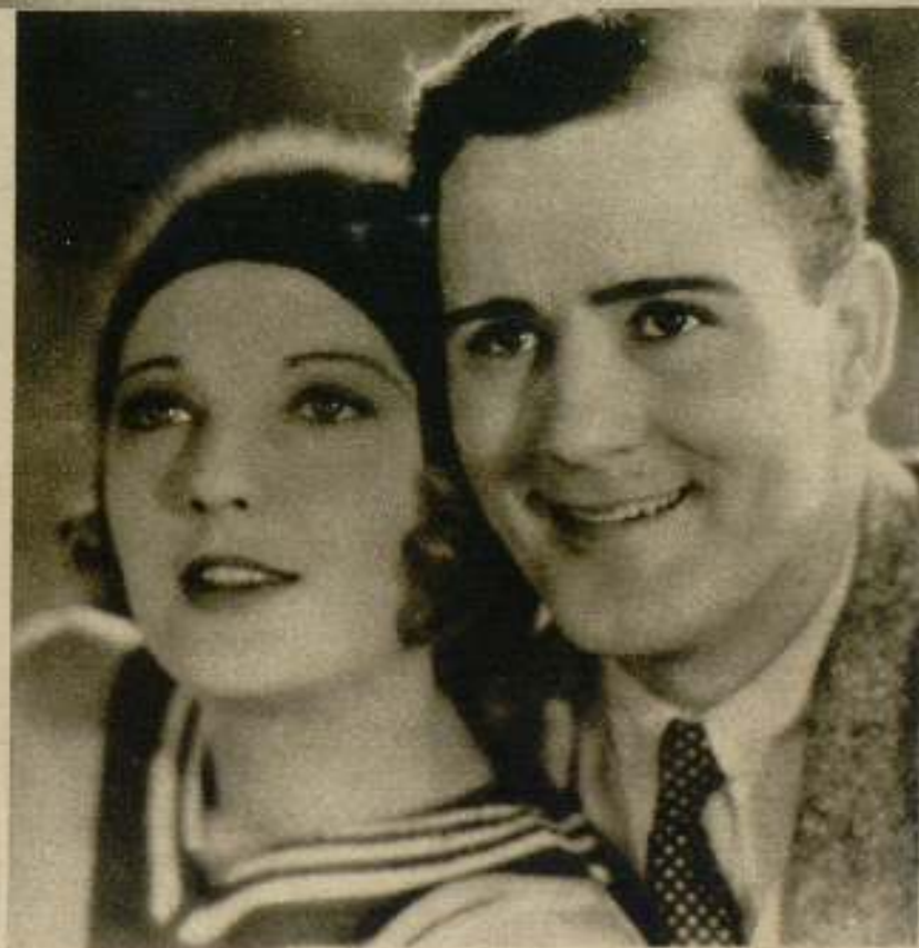
Dos escenas de la película de Exclusivas Almirante, "Una mujer de despacho".