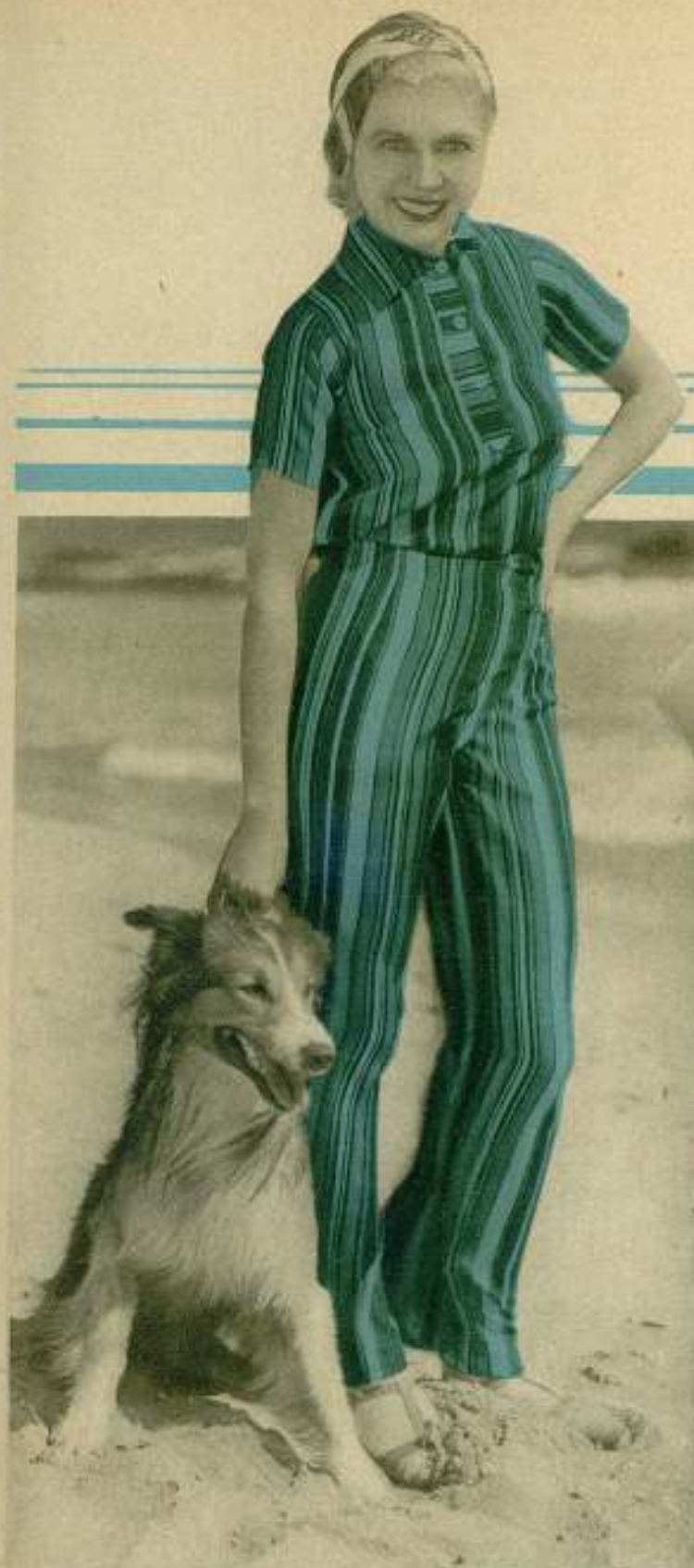
LILYAN TASHMAN DE LA PARAMOUNT